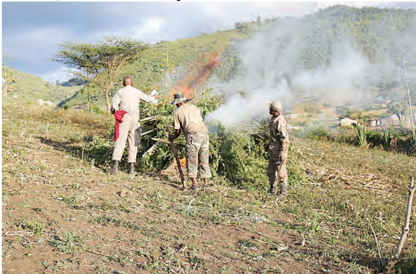
Dawa za kulevyva zilizochochwa shambani, wilayani Arumeru, mkoani Arusha.

Jumla zake zinatajwa kuchangia kuporomoka uzalishaji mali na uchumi wa taifa, kutokana na