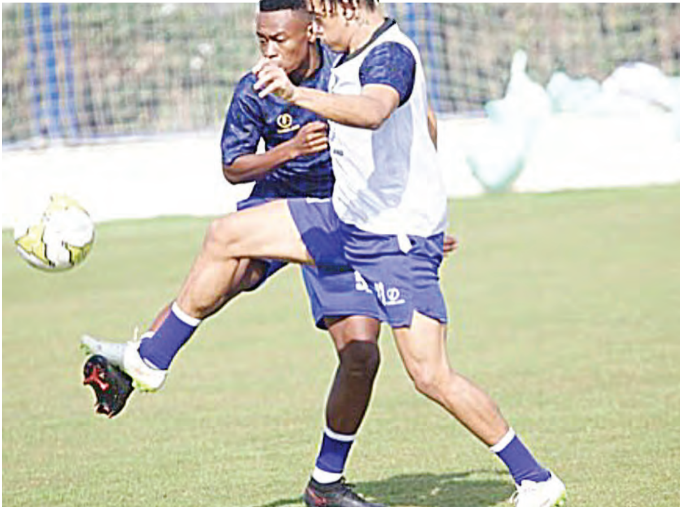
Wachezaji wa Timu ya Soka ya Taifa (Taifa Stars), wakifanya mazoezi nchini Misri ili kujiandaa na Fainali za Kombe la Mataifa ya Afrika (AFCON 2023), zitakazofanyika Ivory Coast kuanzia Januari 13, mwaka huu.