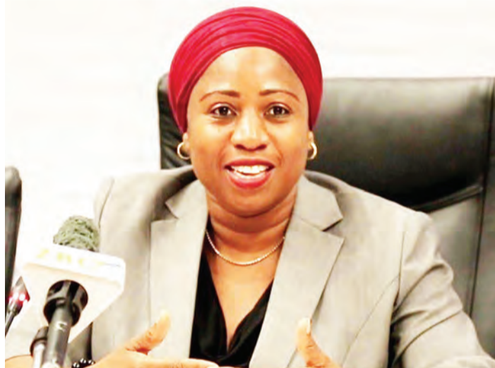
Waziri wa Afya, Ummu Mwalimu.