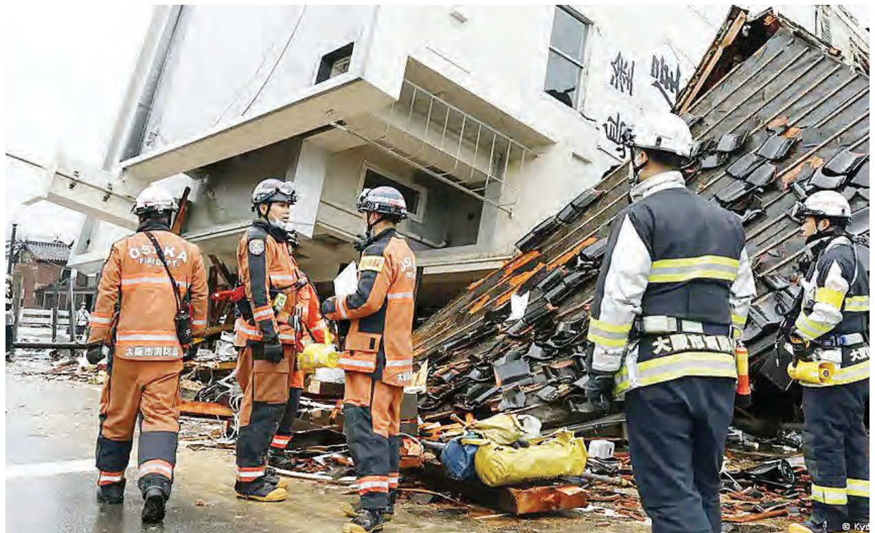
Kikosi cha zimamoto kikiwa katika juhudi za kunusuru watu katika jengo lililoporomoka mjini Wajima nchini Japan baada ya kukumbwa na tetemeko la ardhi siku chache zilizopita, hali inayotajwa kusababisha vifo 73 hadi jana.