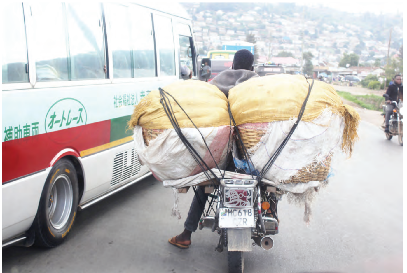
Mmoja wa vijana waendesha bodaboda wa Jiji la Mbeya akisafirisha matenga ya nyanya kwa kutumia pikipiki katika eneo la Nzovwe kwenye Barabara Kuu ya Tanzania na Zambia (TANZAM) huku akiwa amevaa kandambili na hajavaa kofia ngumu jambo ambalo ni hatari kwa usalama wake.

Mkane alitoa rai kwa wazazi wa Kata ya Itulahumba kwamba hatarajii kutumia nguvu katika kuwahimiza wazazi kupeleka watoto shule na badala yake kila mmoja atimize wajibu wake.