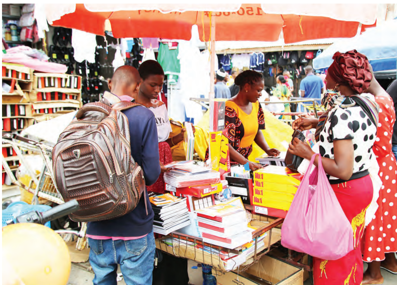
Baadhi ya wazazi wakinunua mahitaji ya shule kwa ajili ya watoto wao wanaosoma ikiwa ni sehemu ya maandalizi ya kufunguliwa kwa shule wiki ijayo.