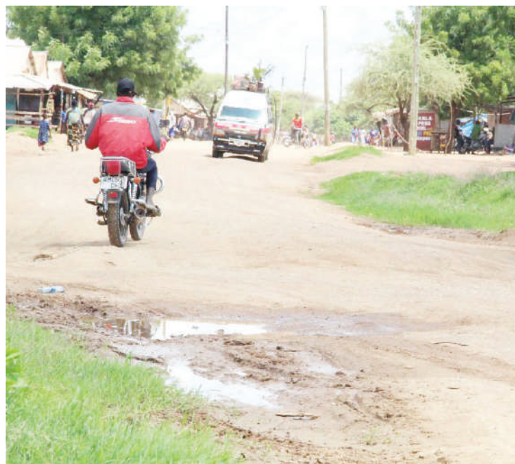
Mwonekano wa ubovu wa barabara ya kwenda Hospitali ya Rufani Mkoa wa Shinyanga, mashimo yake yameweka historia ya ajali zenye vifo.

Vilevile, Waziri wa Fedha, Dk. Mwigulu Nchemba, Juni 13 mwaka huu bungeni Jijini Dodoma, katika hotuba yake ya bajeti ya serikali kwa mwaka wa fedha 2024/2025, akataja takwimu; watu 7,639 wamepoteza maisha kwa ajali za barabarani kwa miaka mitano; 2019-2024, pia majeruhi 12,663.