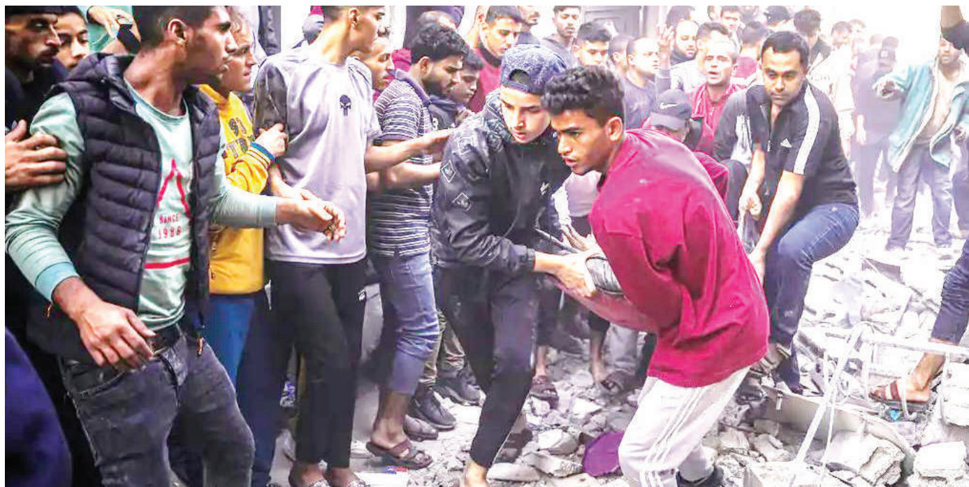
Wapalestina wakiwabeba watu waliojeruhiwa ili kuwapeleka hospitali kufuatia shambulio la anga la Israel kwenye jengo la makazi mjini Khan Younes jana.

Operesheni hiyo inafuatia sakata la kuhakikisha wachimbaji hao wanatoka kwa hiari lilodumu kwa wiki kadhaa kushindikana.