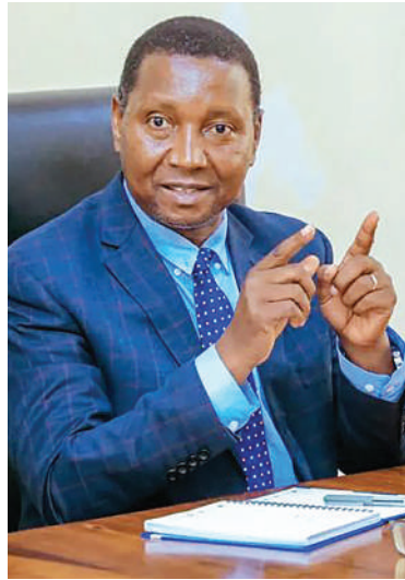
Waziri wa Elimu, Sayansi na Teknolojia, Prof. Adolf Mkenda.

"Kama mtu hana elimu na ufahamu kuhusu kuandaa maudhui