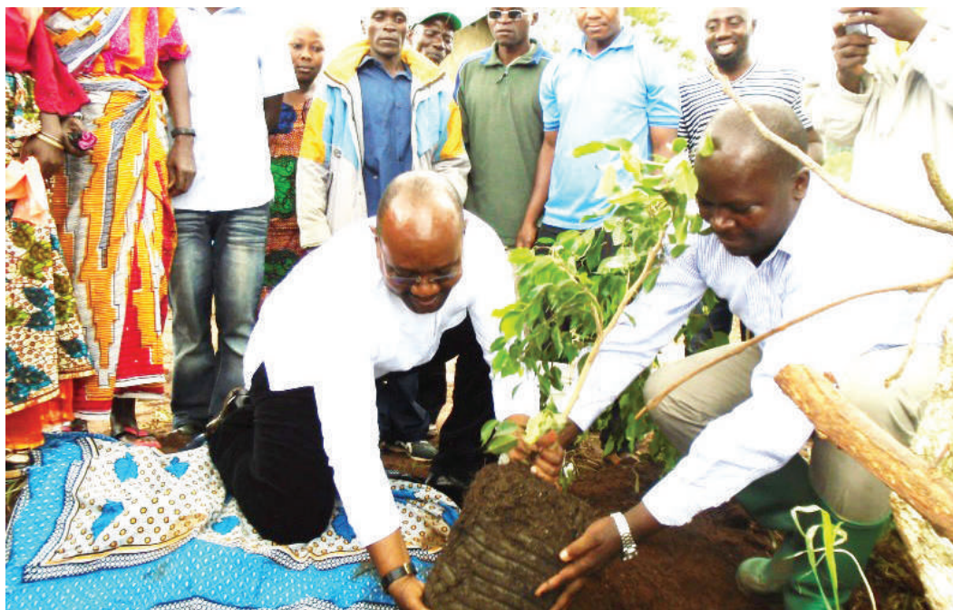
Tukio mojawapo la upandaji miti wilayani Kilindi.

"Ili kukidhi mahitaji ya sasa na kizazi kijacho, serikali ya kijiji inaruhusiwa kutenga asilimia 10