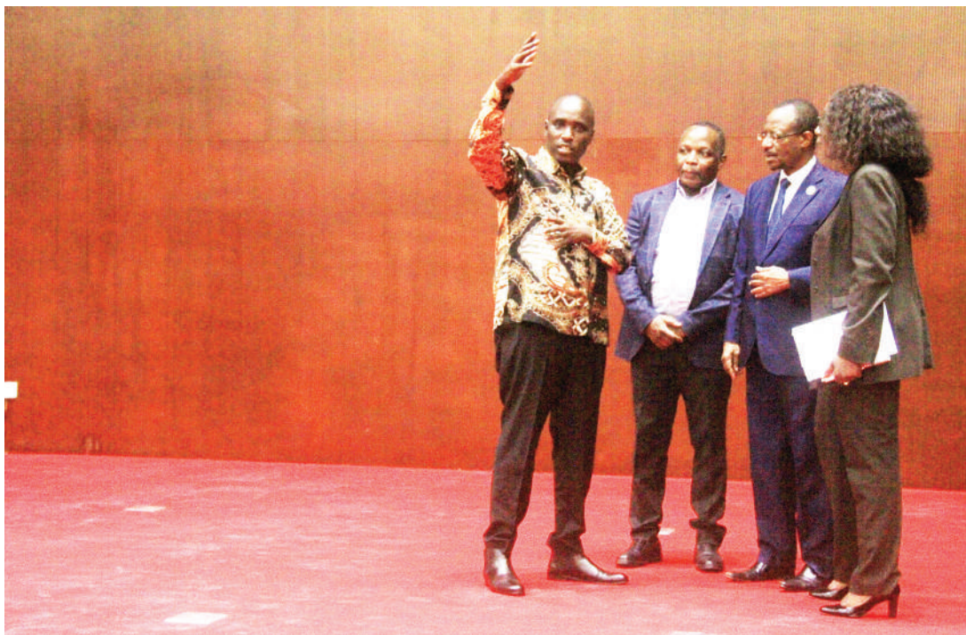
Naibu Waziri Mkuu na Waziri wa Nishati, Dk. Dotto Biteko (kushoto), akizungumza na kamati ya maandalizi ya Mkutano wa Wakuu wa Nchi za Afrika utakojadili nishati ya umeme utakaowakutanisha wakuu 14, wakati akikagua ukarabati wa jengo la mikutano la Mwalimu Nyerere (JNICC), jijini Dar es Salaam jana.

Alisema wamejiandaa kunadi huduma mbalimbali ikiwamo za afya, mazoezi, utalii na watakuwa na maonesho ya baadhi ya bidhaa na kwamba wamepata taa 400 ambazo zitafungwa ili kusaidia kufanyika kwa biashara saa 24.