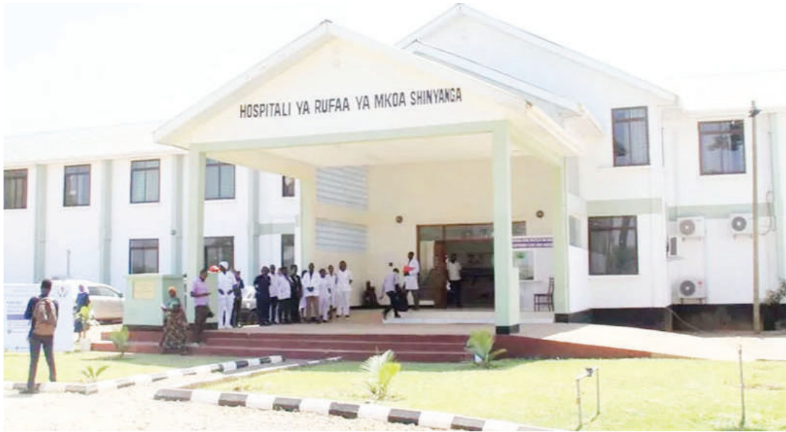
Majengo ya Hospitali ya Rufani Shinyanga.

Anasema, kutokana na uhitaji wa huduma za kibingwa kwa wananchi wa mkoa huo, ilibidi waanze kutoa huduma hivyo, licha ya ubovu huo wa barabara ulipo.