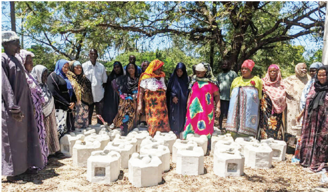
Wanakijiji wa Mkwaja, wilayani Pangani, katika harakati za kulinda misitu.

“Tunashukuru Umoja wa Ulaya (European Union) kutoa fedha ambazo zimesaidia Shirika la TFCG na MJUMITA kusaidia