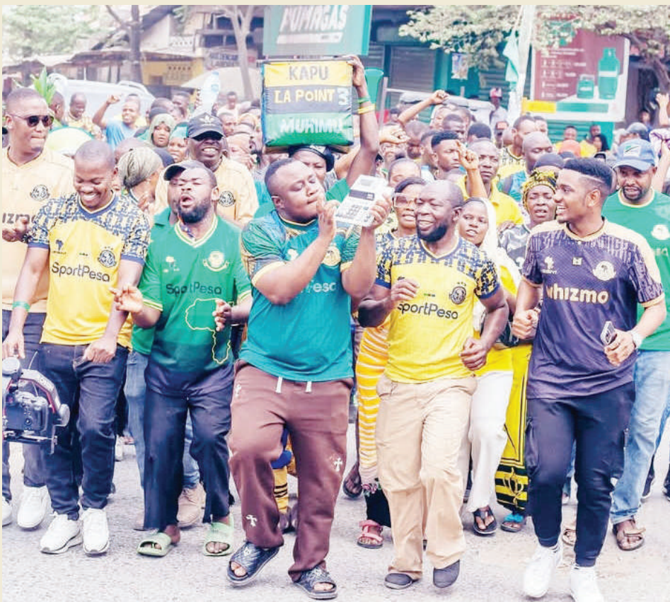
Wanachama na mashabiki wa Yanga kutoka sehemu mbalimbali jijini Dar es Salaam wakishiriki maandamano kama sehemu ya hamasa ili kujitokeza kwa wingi keshokutwa kwenye Uwanja wa Benjamin Mkapa kushuhudia mechi ya raundi ya sita ya Kundi A ya mashindano ya kimataifa ya Ligi ya Mabingwa Afrika dhidi ya MC Alger kutoka Algeria.