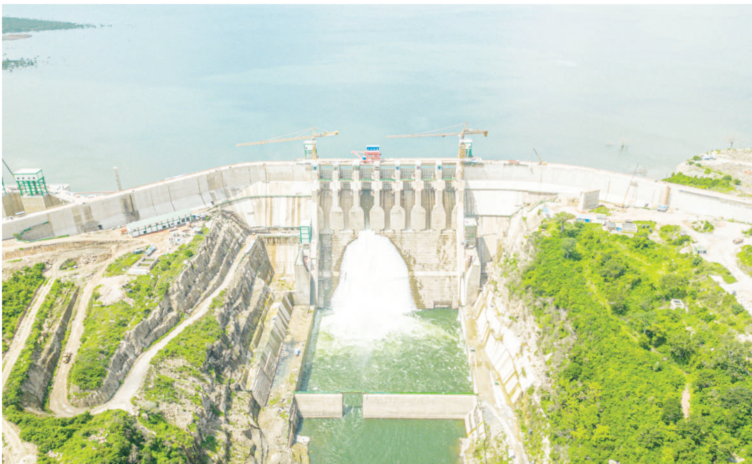
Sehemu ya mradi wa umeme wenye kiwango cha kimataifa, Bwawa la Mwalimu Nyerere.

Pia, anawarejea wananchi wote, akiomba ukarimu wao kwa wageni, kama ilivyo desturi ya Kitanzania, ndani ya kipindi chote cha mkutano huo ujao wa M300.