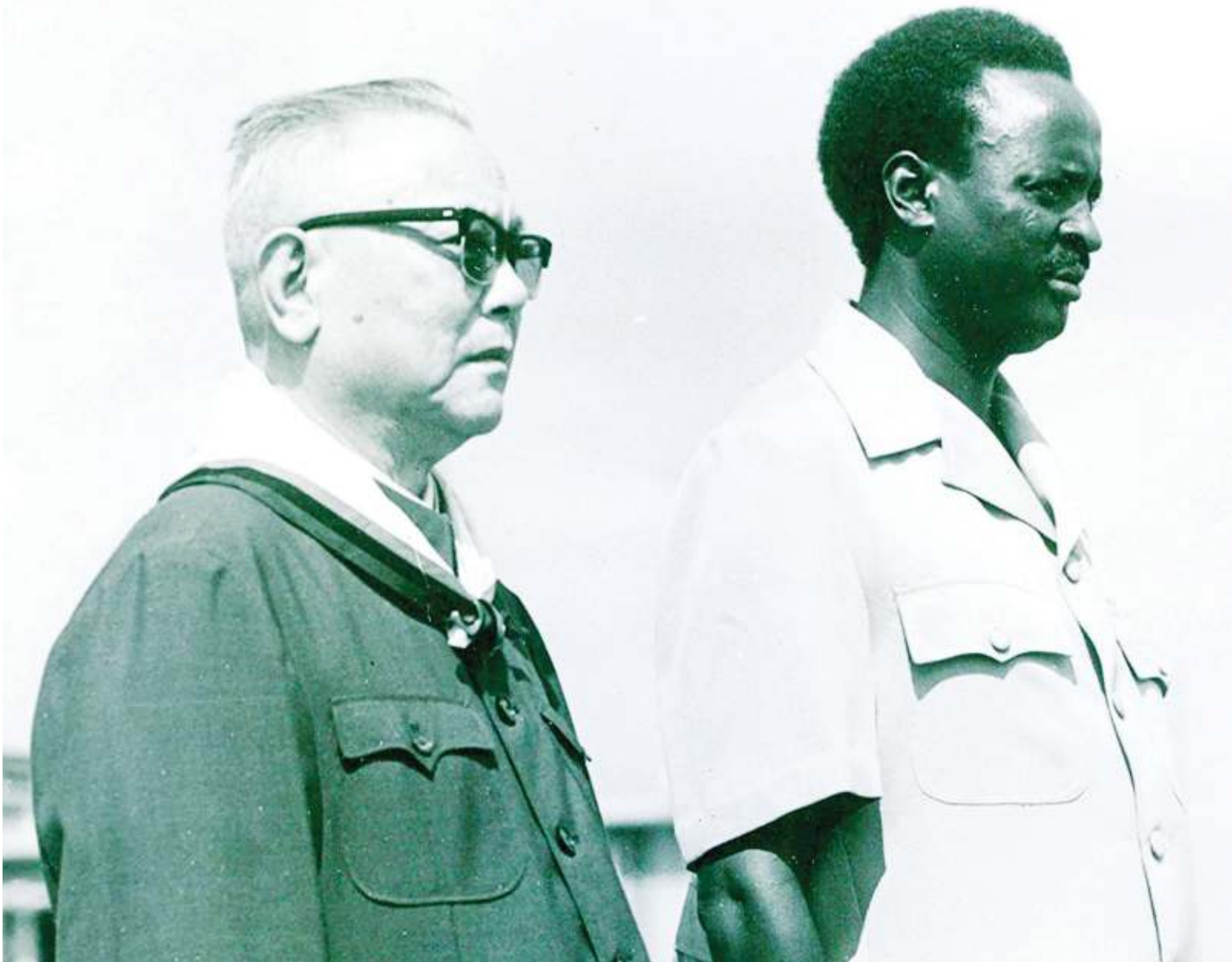
Sokoine akimpokea Rais wa China, Li Xiannian, kwenye uwanja wa ndege wa Dar-es-Salaam, alipofanya ziara nchini mwaka 1979.