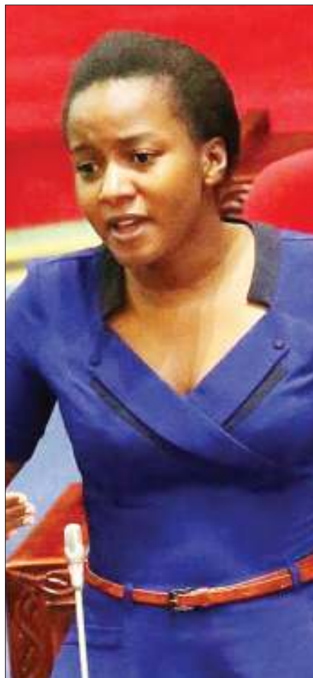
asavyo, hivyo kumarisha uhusiano mwema kati ya waajiri na wafanyakazi kwenye maeneo hayo.

Ilisitiza kuwa, itaendelea kufanya ufuatiliaji wa mara kwa mara ili kuhakikisha maelekezo yanayotolewa yanazingatiwa ip-