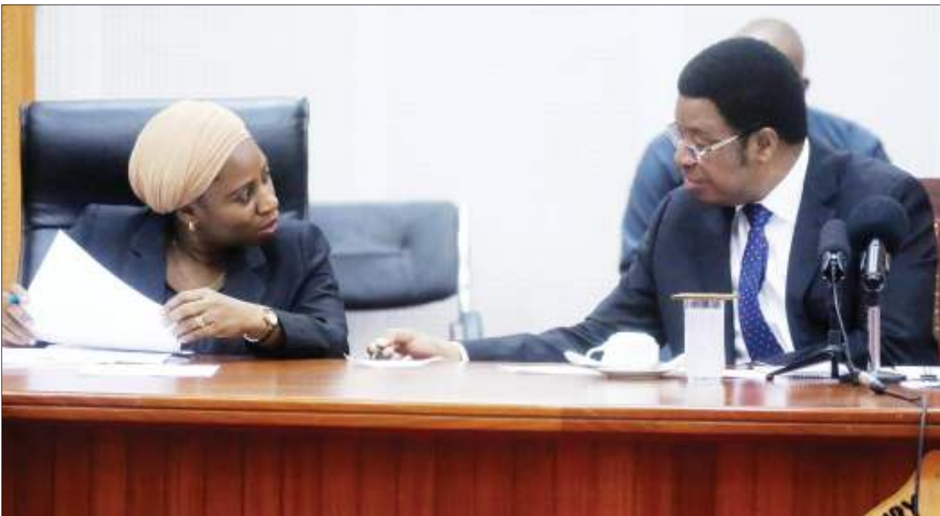
Waziri Mkuu Kassim Majaliwa, akiteta jambo na Waziri wa Afya, Maendeleo ya Jamii, Jinsia, Wazee na Watoto, Ummu Mwalimu, kwenye kikao cha Kamati ya Kitaifa ya Uratibu wa Mapambano dhidi ya Ugonjwa wa Homa kali ya Mapafu (COVID - 19), jijini Dodoma, jana.