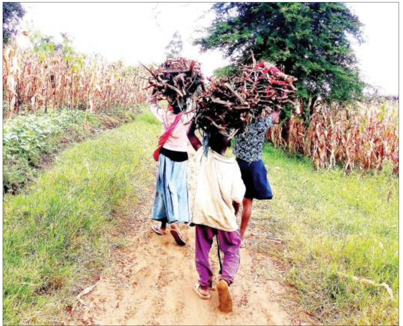
Baadhi ya watoto ambao ni wanafunzi wa shule mbalimbali za msingi na sekondari, wakisaidia kazi za nyumbani kwa kutafuta kuni, katika Mamlaka ya Mji Mdogo wa Mbalizi mkoani Mbeya juzi, kutokana na Serikali kuzifunga shule zote ili kuepusha maambukizi ya virusi vya corona.