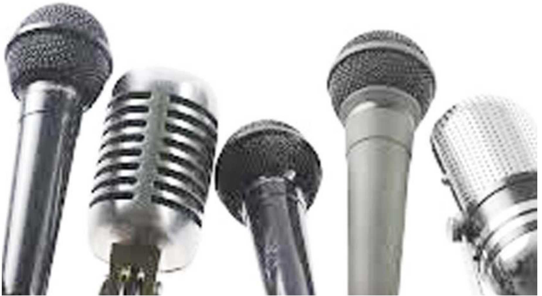
Zana mbalimbali za wanahabari.