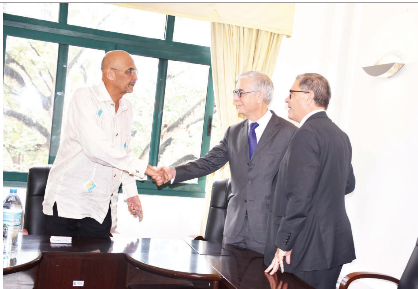
Waziri wa Nchi Ofisi ya Makamu wa Rais, Muungano na Mazingira, Mussa Azzan Zungu, akisalimiana na maseneta kutoka Ufaransa waliomtembelea ofisini kwake Mtaa wa Luthuli, jijini Dar es Salaam jana.