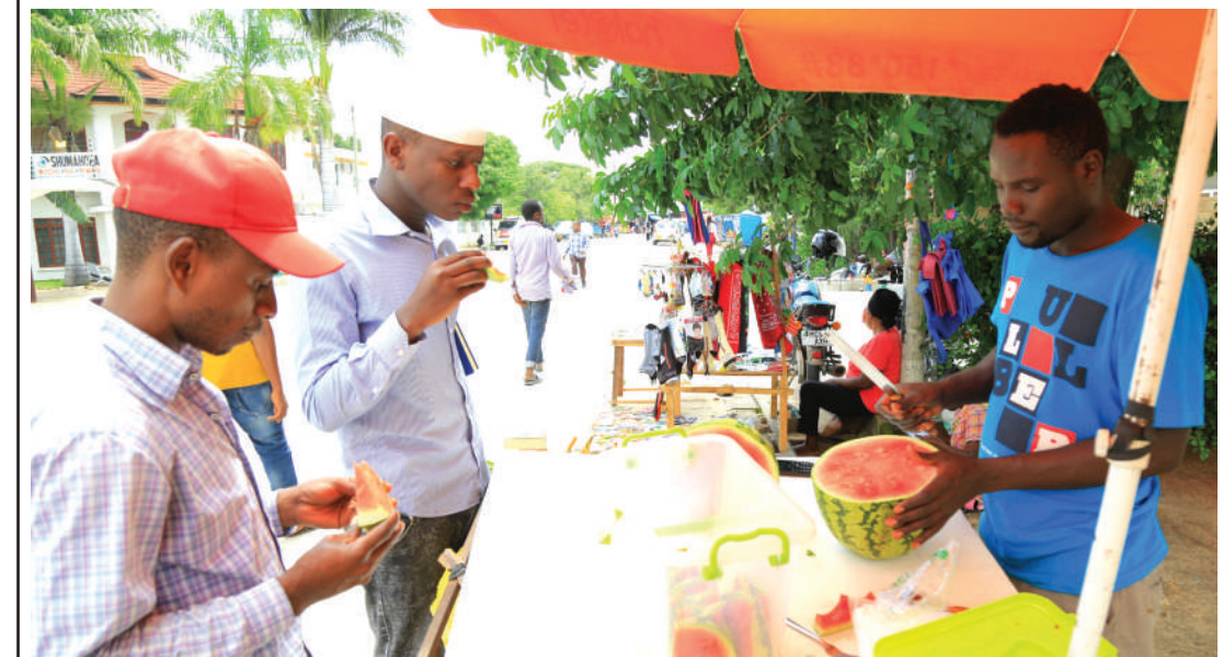
Mchuzi wa matikiti akiwahudumia wateja wake, katika eneo la Uhindini, jijini Dodoma mapema wiki hii. Kipande kimoja cha tikiti kilizuwa kwa bei ya 500/-