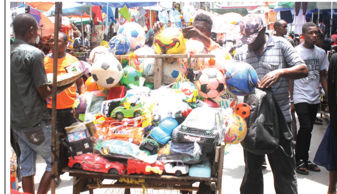
Wafanyabiashara wadogo maarufu kama machinga wakifanyia shughuli zao katikati ya barabara za mitaa ya eneo la Kariakoo, jijini Dar es Salaam jana na kusababisha usumbufu kwa watembea kwa miguu.

nashuhudia kila kitu na nililazimika kumwita Ofisa Mtendaji wa Kata pamoja na wa Kijiji nikawaeleza.