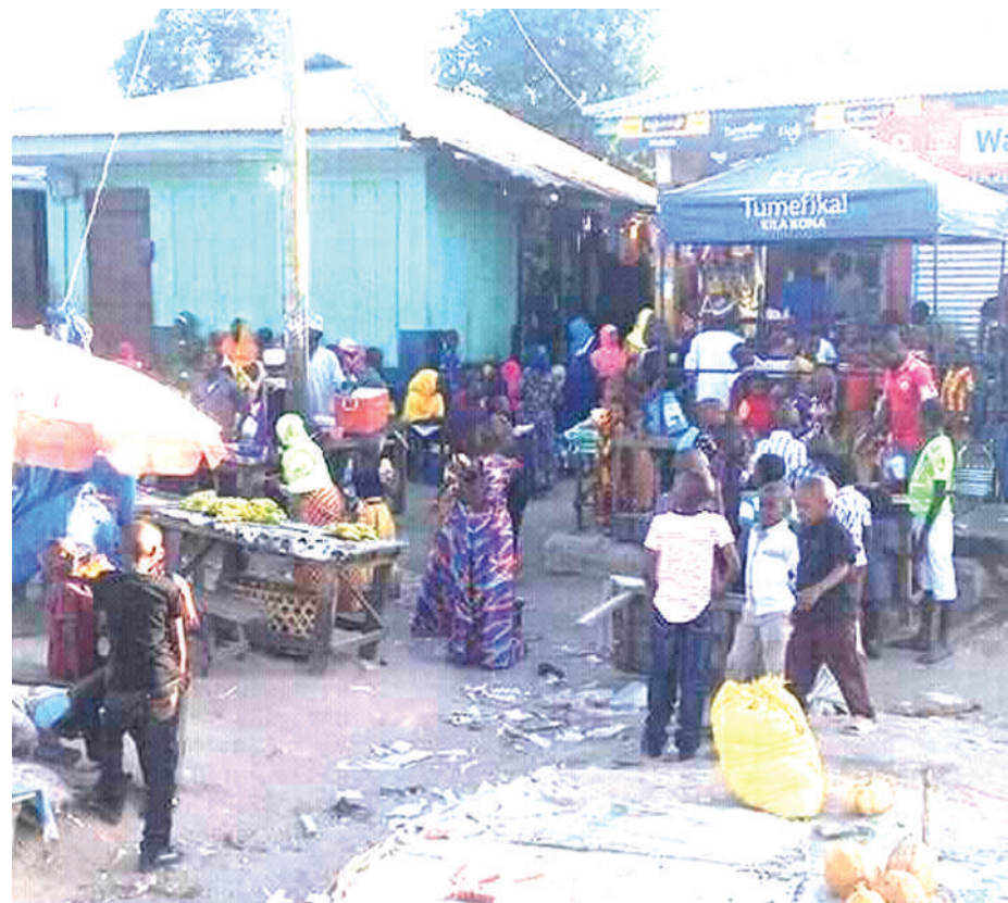
Mandhari ya kijiji cha Mkuranga, ambako watoto wanaharibika. PICHA ZOTE: MTANDAO.

"Mimi nikirudi shuleni nikikuta nyumbani hakuna chakula, huwa naenda dukani naomba maji ya kuuza na nikipata hela, tunanunulia dagaa au mboya ya majani tunakula na ugali. Kama mama na yeye amepata naiweka ili misaidie kununulia mihogo ya kula shuleni.