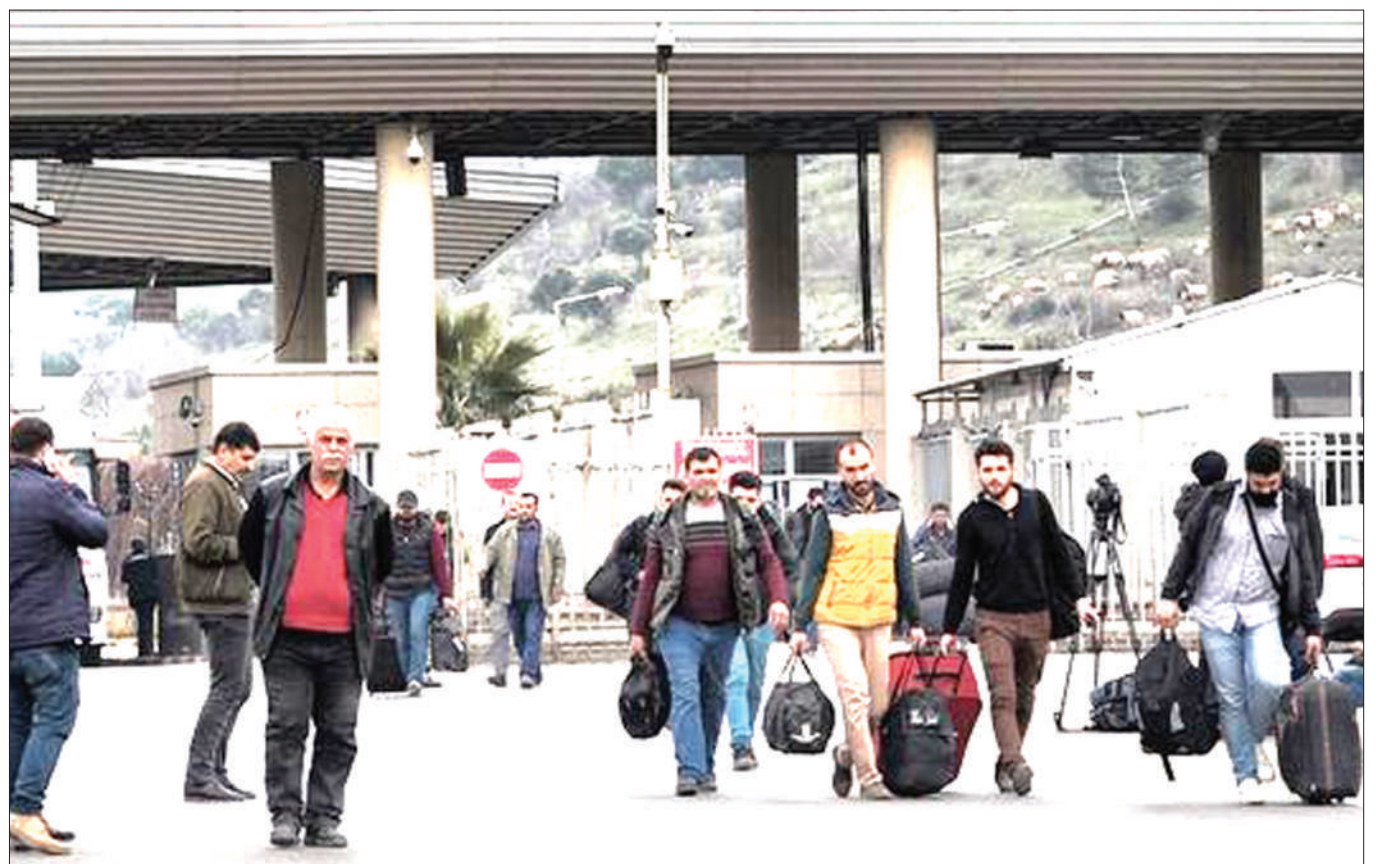
Wahamiaji na wakimbizi kutoka Syria wanaotafuta hifadhi katika nchi za Ulaya wakivuka mpaka wa eneo la Magharibi mwa Uturuki na Ugiriki.

Msaada huo wa dharura unajumuisha mikopo ya gharama za chini, ufadhili na msaada wa kiteknolojia. BBC