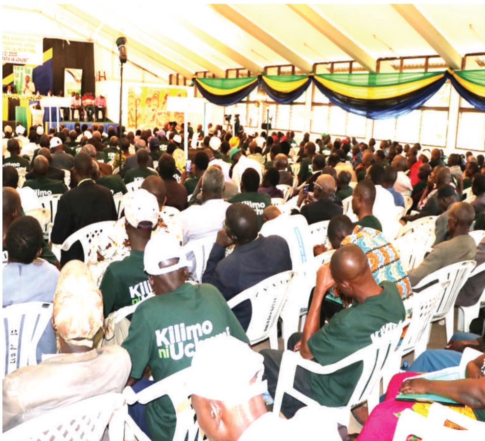
Wanachama wa Chama Kikuu cha Ushirika Nyanza, kwenye mkutano Mkuu wa chama hicho.

Anasema, makubaliano ya serikali na halmashauri ni kwamba, boti hiyo inapaswa kutumika katika maeneo ya ukanda wa bahari wa 'delta' kwa ajili ya kufanya doria ili kulinda vyanzo vya mapato, hivyo ni vugumu kuvunja mkataba kwa kujielekeza na mambo mengine.