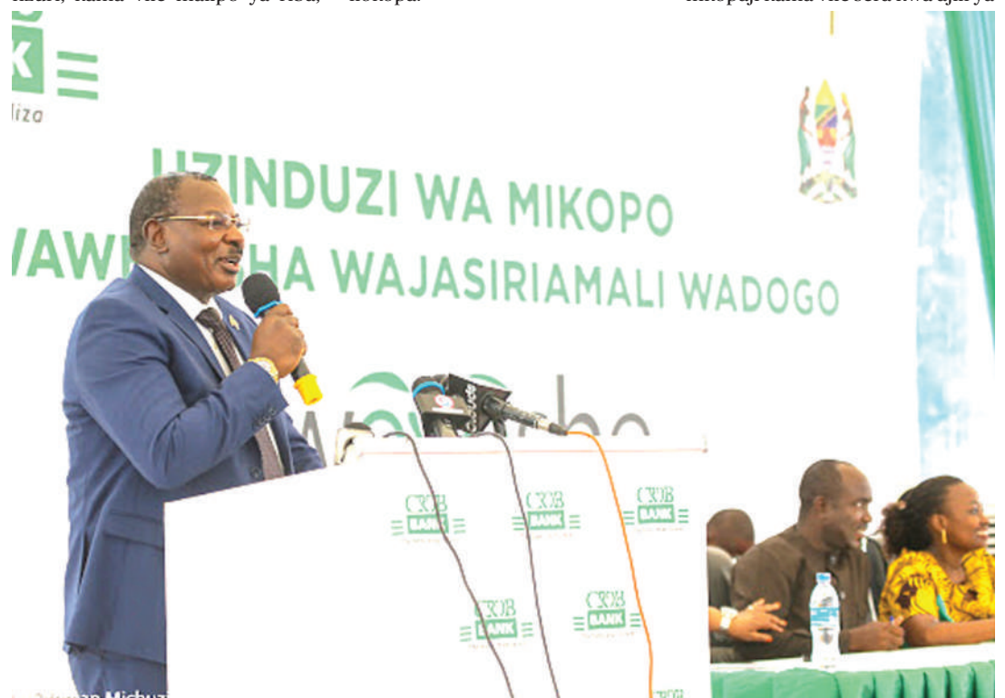
Tukio la benki kuzindua aina mojawapo ya mkopo.

Vilevile, katika kupeana mikopo, iwapo inatokea hakuna mamlaka inayodhibiti na mwenendo wa mkopo huo, nayo inaangukia katika sura nyingine au kunyanyasa. Nchini, kuna Benki Kuu ya Tanzania (BoT).