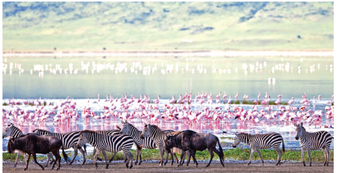
Mandhari ya baadhi ya vivutio vya nchini vinavyotarajiwa kuonyeshwa kimataifa.

Anaeleza matarajio ya mkataba huo ni kuleta matokeo chanya na kuhamasisha wageni kutembelea Tanzania, zaidi, badala ya kuishia kwenye picha na matangazo.