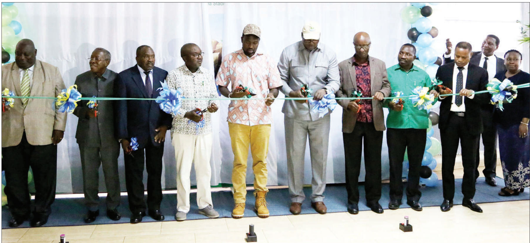
Waziri wa Maliasili na Utalii, Dk. Hamis Kigwangala (wa tano kushoto), akikata utepe kuzindua rasmi maandalizi ya maonesho ya kimataifa ya utalii katika Ukanda wa Maziwa Makuu na Jukwaa la Uwekezaji katika sekta hiyo, jijini Mwanza juzi, yatakayofanyika Juni 19 hadi 21, mwaka huu, katika Jiji hilo.