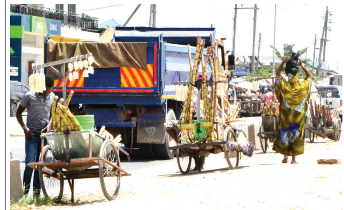
Wachuuzi wa miwa wakiwa wamepaki baiskeli zao kusubiri wateja huku kukiwa na jua kali bila kuwa na kitu cha kujikinga katika eneo la Kizuani Mbagala, jijini Dar es Salaam jana.