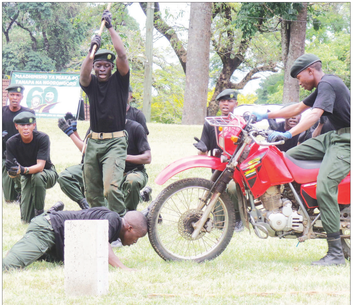
Mmoja wa askari wa Jeshi Usu, akionyesha uwezo wake wa kuzuia pikipiki kwa kutumia kichwa wakati wa maadhimisho ya Siku ya Viumbehai Duniani iliyoadhimishwa katika Chuo cha Kimataifa cha Uhifadhi wa Wanyamapori cha Mweka, wilayani Moshi, juzi.