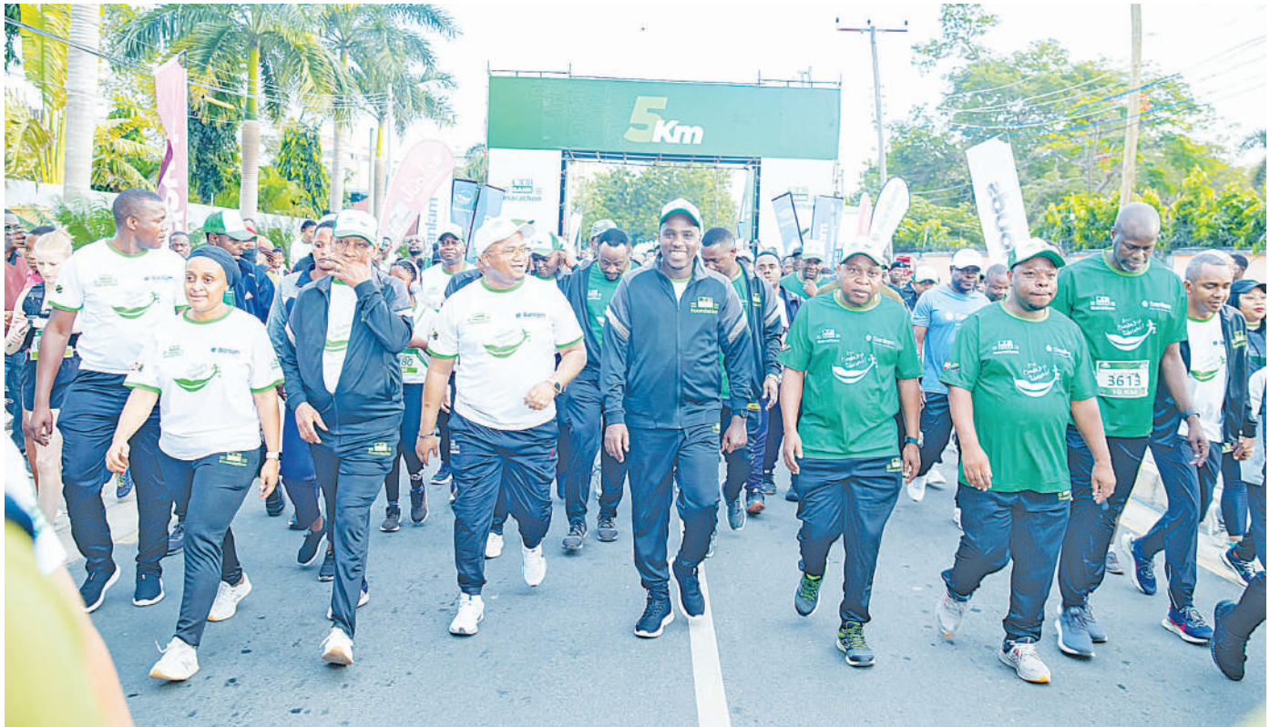
Naibu Waziri Mkuu na Waziri wa Nishati, Dk. Doto Biteko (katikati), akiongozana na viongozi wengine wa serikali na Benki ya CRDB kuanza mbio za kilometa tano katika kilele cha msimu wa tano wa CRDB Bank Marathon zilizofanyika viwanja vya Farasi ‘The Green Grounds’ jijini Dar es Salaam jana na kuhudhuriwa na washiriki zaidi ya 8,000.

Kombo alitaja miradi mikubwa iliyotekelezwa, ikijumuisha zahanati mpya sita zilizojengwa kutokana na mapato ya ndani na wanaendelea kubainisha maeneo yenye vikwazo na kupeleka miradi ya maen-deleo.