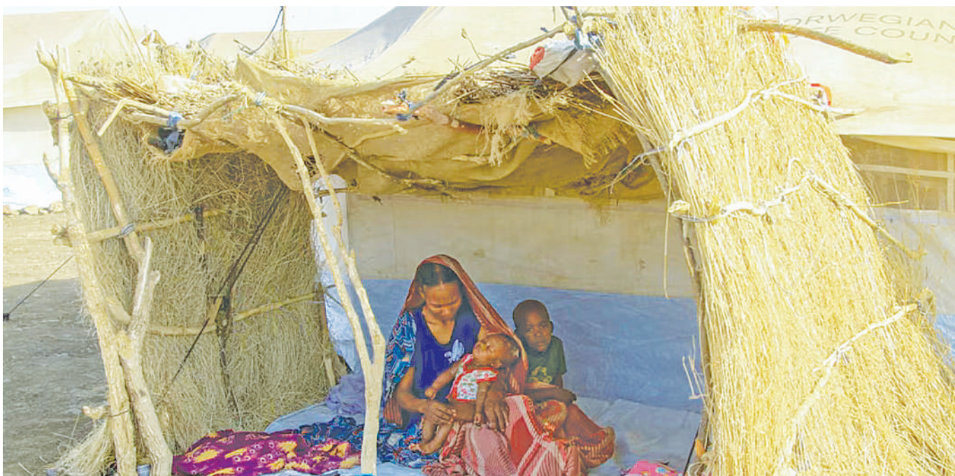
Picha ya mama na watoto wake wakiwa kwenye moja ya kambi wanazoishi watu waliokoseshwa makazi nchini Sudan.