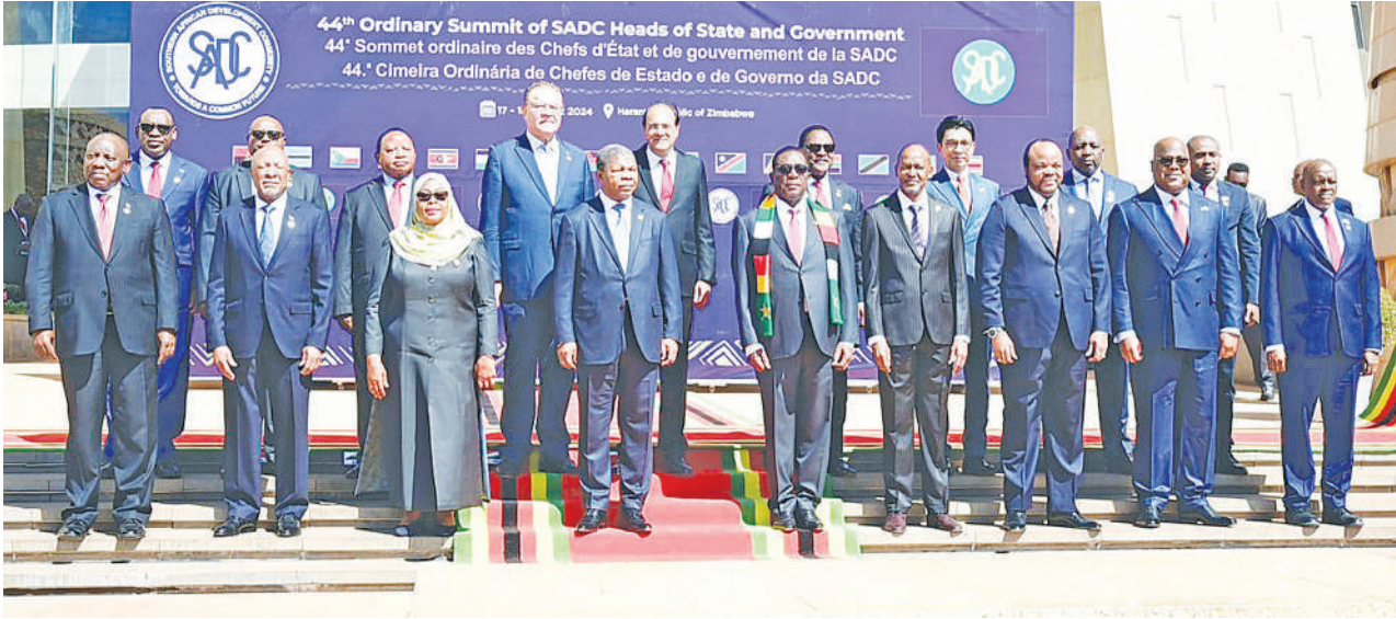
Wakuu wa Nchi na Serikali wa Jumuiya ya Maendeleo Kusini mwa Afrika (SADC) wakiwa pamoja wakati wa mkutano wao wa kawaida wa 44 uliofanyika mwishoni mwa wiki Harare, Zimbabwe.