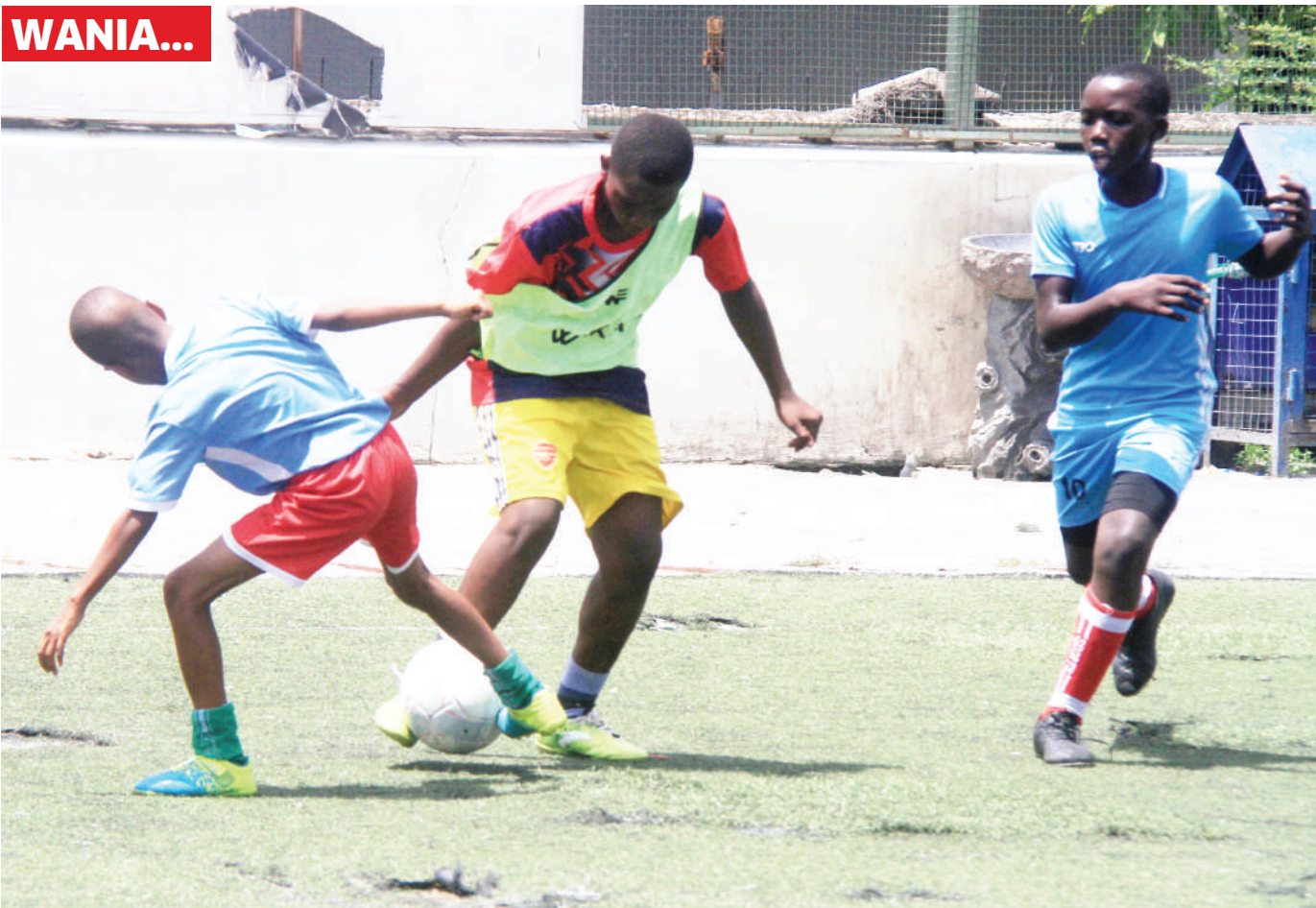
Wachezaji Yosso wakiwania mpira wakati wakifanya mazoezi katika Uwanja wa Kituo cha Michezo cha Jakaya Kikwete jijini Dar es Salaam jana.