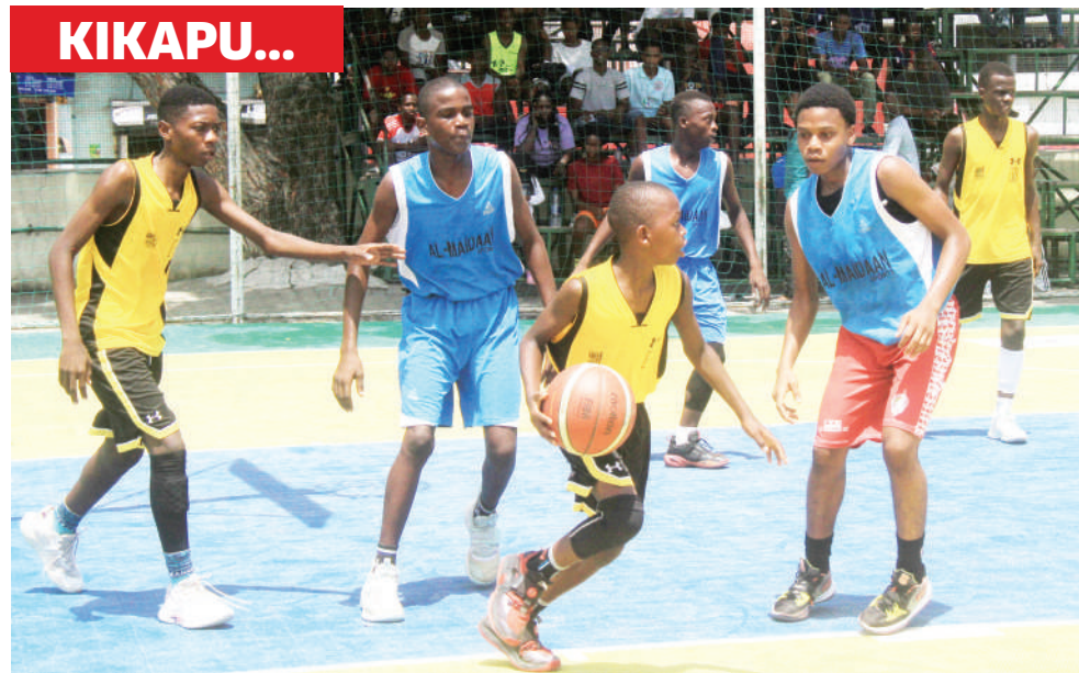
Wachezaji vijana wakicheza mpira wa kikapu katika Uwanja wa Kituo cha Michezo Jakaya Kikwete jijini Dar es Salaam jana.