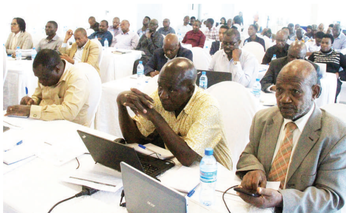
Baadhii ya wahandisi wazawa wakiwa katika mkutano wa kuku-sanya maoni ya mabadiliko ya sheria ya uhandisi yali-ofanyika jijini Dar es Salaam, ulioandaliwa na Wizara ya Ujenzi na Bodi ya Wahandisi Tanzania (ERB) jana.

Mradi wa bwawa la kufua umeme wa JNHPP tayari umeanza kuleta matumaini makubwa ya kuimarisha hali ya upatikanaji wa umeme nchini ikiwa ni kati ya juhudi kubwa zilizofanywa na serikali ya awamu ya sita.