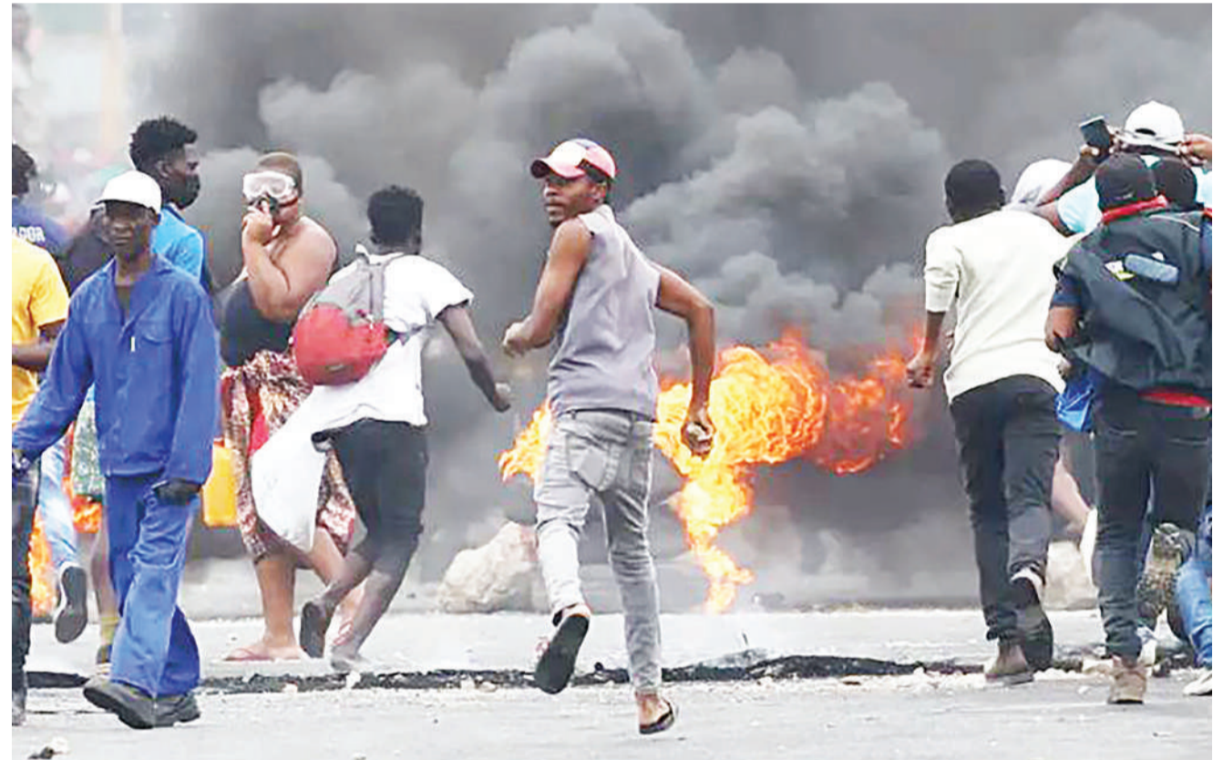
Waandamanaji wakiwakimbia polisi wakati wa purukushani za kudhibiti maandamano katika Kitongoji cha Luis Cabral katika Jiji la Maputo, Msumbiji, wiki iliyopita.