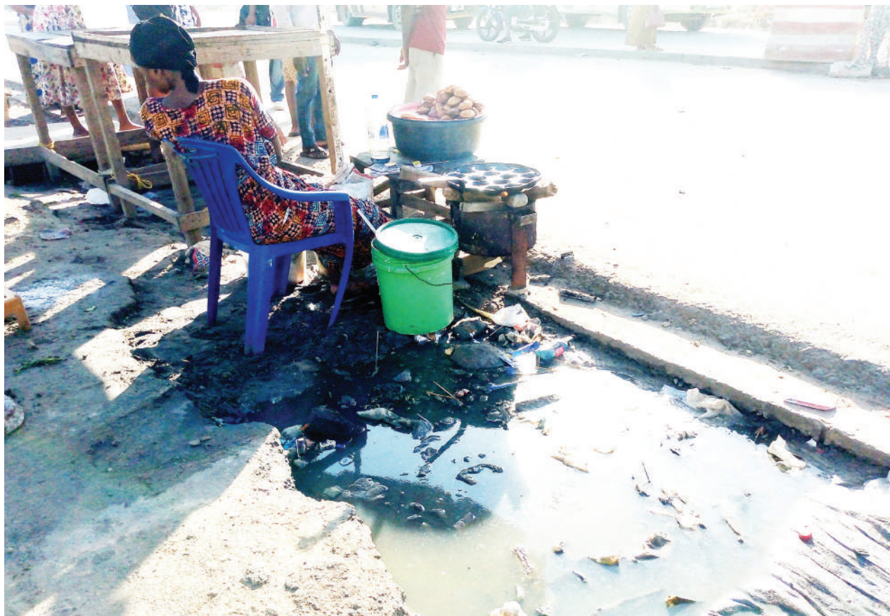
Mamalishe akiandaa biashara zake katika mazingira ambayo ni hatari kwa afya za wateja wake, kama alivyonaswa na kamera yetu eneo la Gongo la Mboto jijini Dar es Salaam jana.