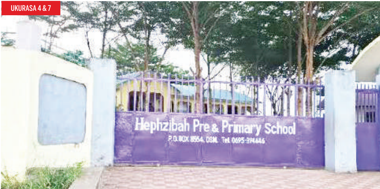
Shule inayodaiwa kufungwa