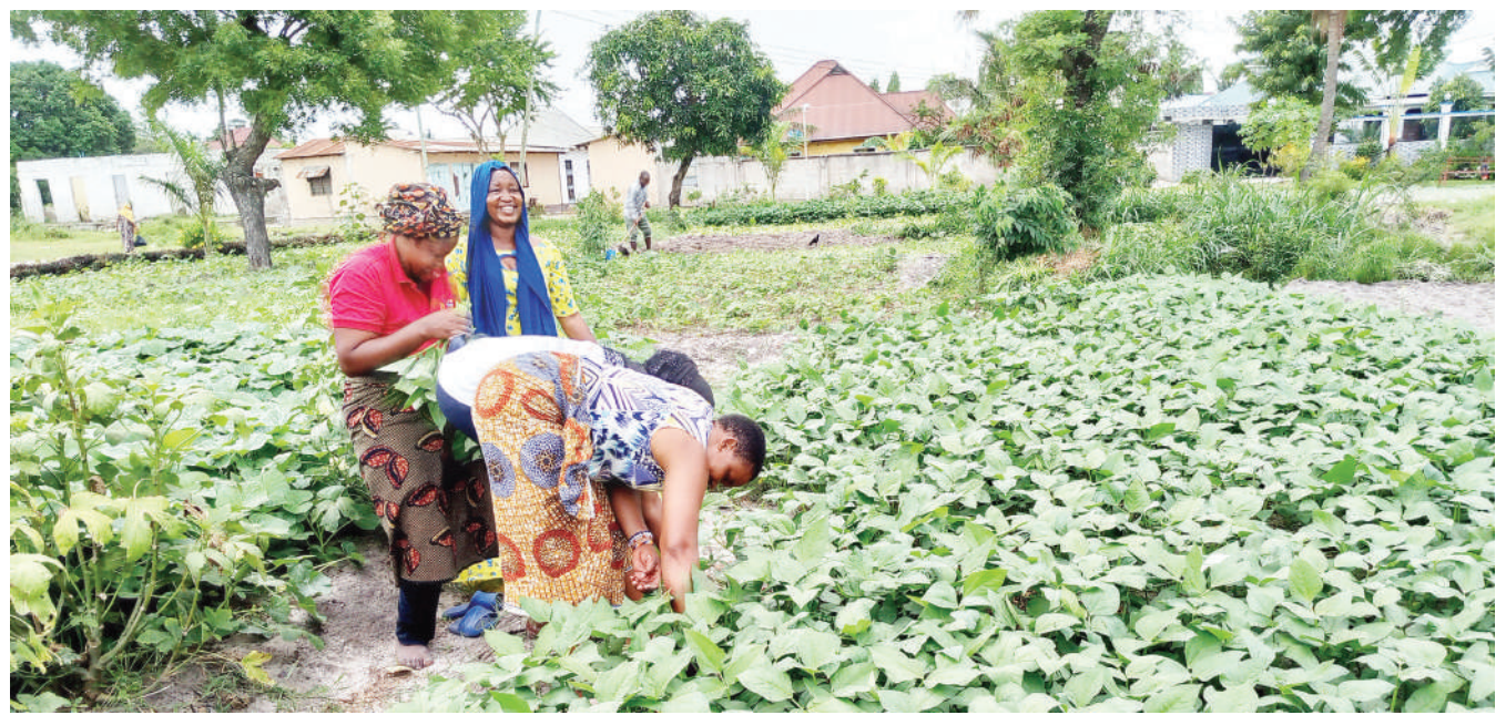
Wakazi wa Kivule jijini Dar es Salaam wakichuma mboga katika bustani yao jana, kwa ajili ya kutembeza mitaani kusaka wateja kwa bei ya Sh. 200 kila fungu ambalo sokoni huuzwa kwa Sh. 500.

Alisema Sh. bilioni 2.7 zilitumika kuwalipa wananchi fidia waliopisha maeneo yao na kuruhusu kuanza kwa ujenzi huo ambao umefikia asilimia 80.