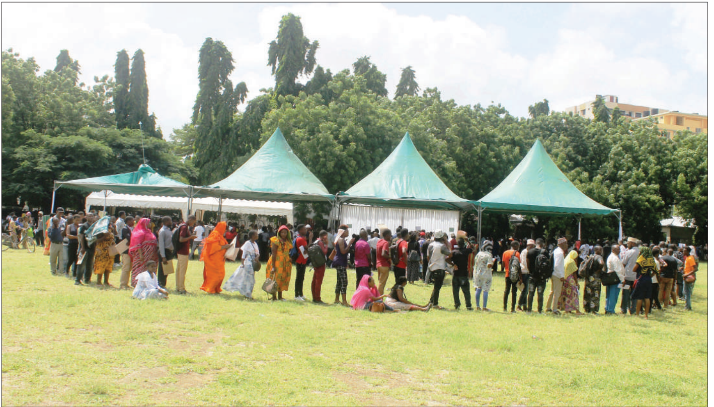
Wakazi wa jijini Dar es Salaam wakiwa wamejipanga foleni kwa ajili ya kujiandikisha kupata vitambulisho vya Taifa Nida katika Viwanja vya Mnazi Mmoja jana.

Alisema Tanzania yenye wakufunzi wa kutosha, madarasa na vitendea kazi, huku mkazo ukiwekwa zaidi kwenye elimu ya ufundi, ikiwamo kuwa na huduma bora na nafuu za afya, inayojikita kwenye kuwakinga na kuwatibu wananchi, kwa kuwa na zahanati, vituo vya afya na hospitali za kutosha, zenye watendaji wenye sifa, vitendea kazi na vifaa tiba vya kutosha.