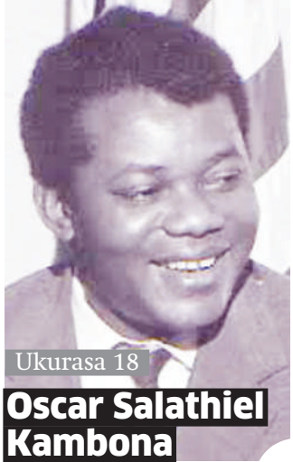
Ukurasa 18 Oscar Salathiel Kambona

Wenye sifa tutumie fursa hii kujiandikisha kwenye Daftari