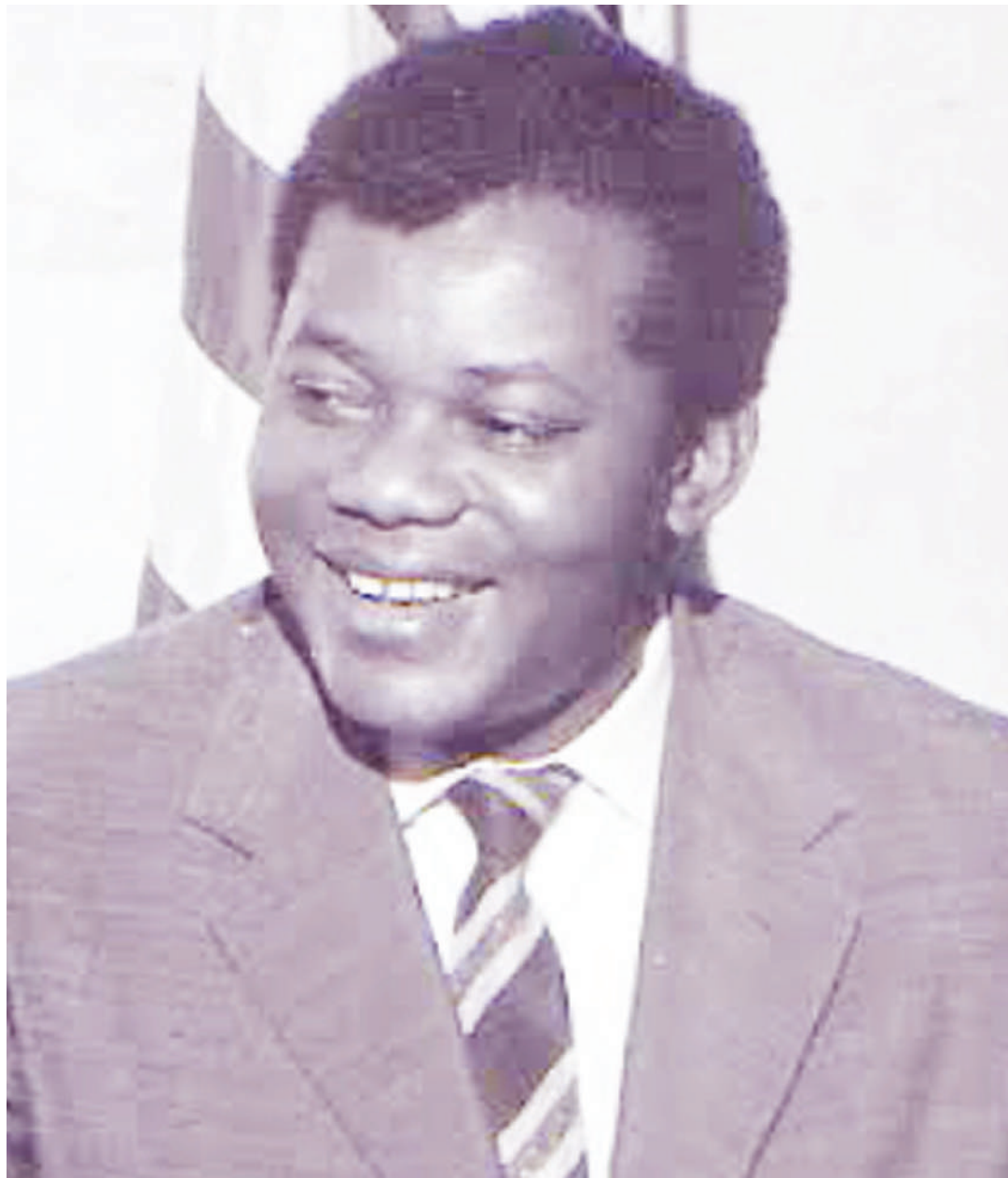
Oscar Kambona enzi za uhai wake.

• Alifariki Julai 1997 Uingereza, mwili ukarejeshwa na kuzikwa nchini