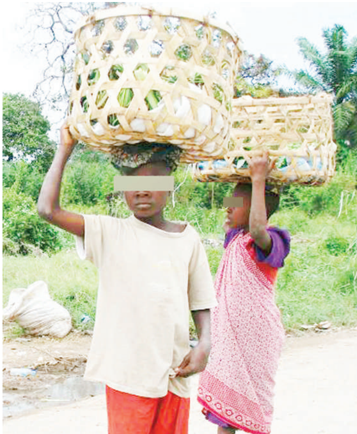
Watoto wenye umri mdogo wakijishughulisha na ajira mbali mbali ili kuweza kujikimu kimaisha huku wakikosa hudumu muhimu ya elimu.

Serikali imeamua kutekeleza ahadi yake ya kutoa elimu bila malipo kuanzia elimu ya awali hadi kidato cha nne ili kuwapatia nafasi kila mtoto kupata elimu.