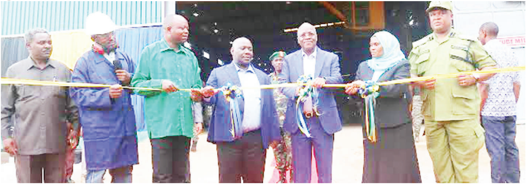
Rais John Magufuli (wa tatu kulia), akifungua moja ya viwanda vilivyojengwa hivi karibuni.