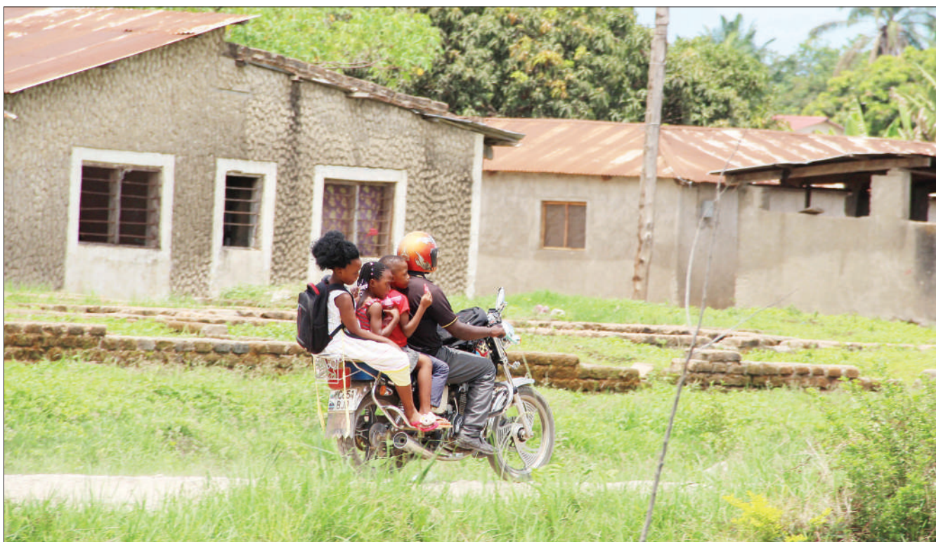
Mwendesha pikipiki maarufu 'Bodaboda' Mkazi wa Wilaya ya Kyela, mkoani Mbeya, akiwa amepakia watoto watatu juzi, kitu ambacho ni hatari na Jeshi la Polisi limekuwa likipiga marufuku vitendo hivyo.

"Wasichana wanaweza kushiriki kwenye programu hiyo na kuhakikisha upatikanaji wa msaada wa kisaikolojia kwao na kwa wazazi wao, kwani hii ni ni sehemu ya programu pana inayoungwa mkono na UNFPA, ambayo inahusisha kujenga uwezo wa vyombo vya habari, polisi, mahakama, walimu na waganga wa jadi, katika kuzuia ukeketaji," anasema.