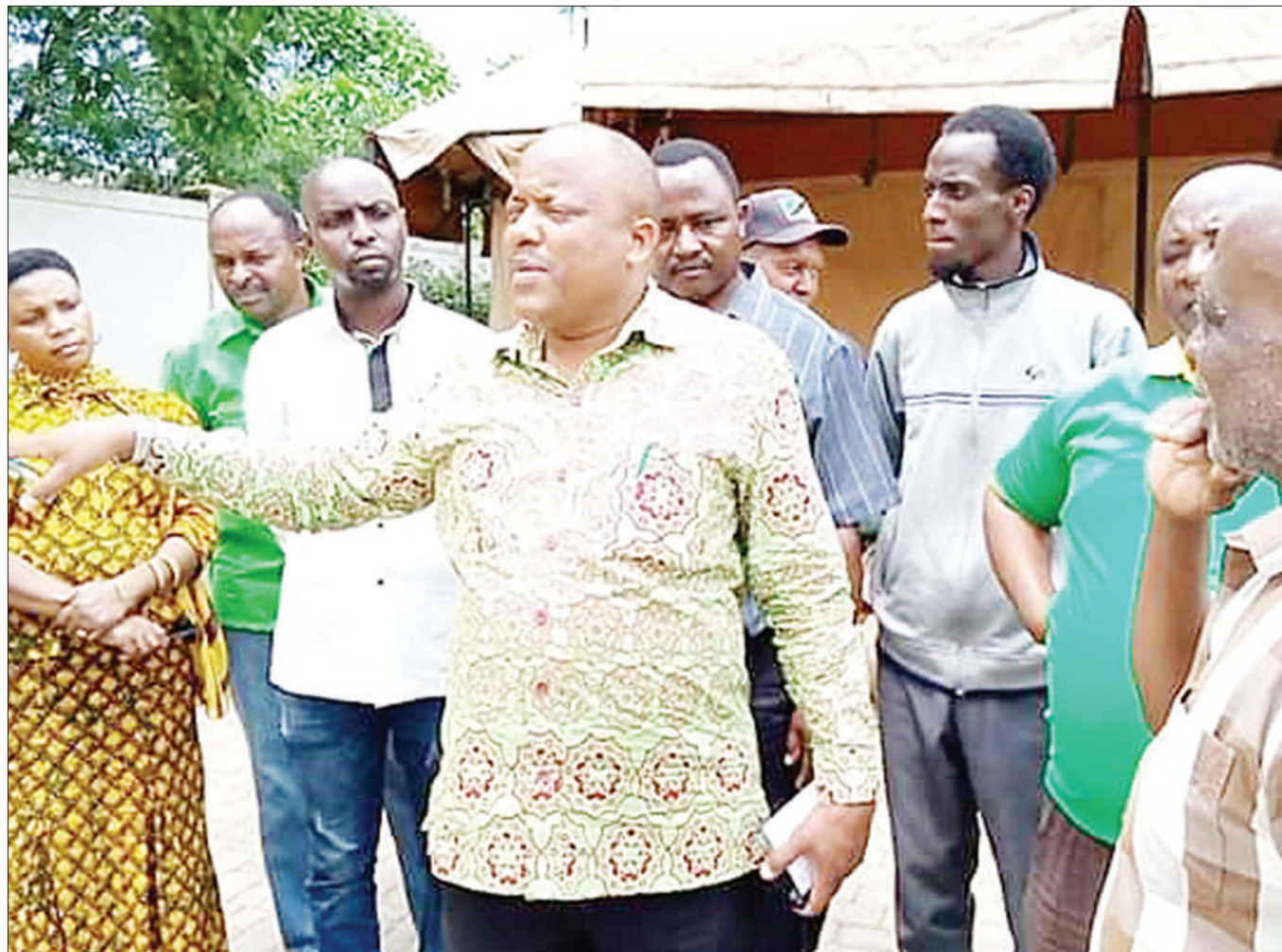
Katibu Mkuu wa Jumuiya ya Wazazi, Erasto Yohana Sima, akiwa katika ziara ya siku 2 ya kikazi akikagua utengenezaji wa mizinga 700 ya nyuki kwa ajili ya mkakati wa 2020 kwa wilaya zote za Mkoa wa Arusha.

Katibu Tawala wa Mkoa wa Simiyu, Jumanne Sagini, alitoa wito kwa wakurugenzi wa mkoa huo kuhakikisha wanashughulikia suala la vyumba vya madarasa, huku akiongeza kuwa wanafunzi wote waliochaguliwa kujiunga na kidato cha kwanza kwa mwaka 2020 wote wanatakiwa kupangiwa shule na wanasaswa kuripoti Januari 6 bila kisingizio chochote.