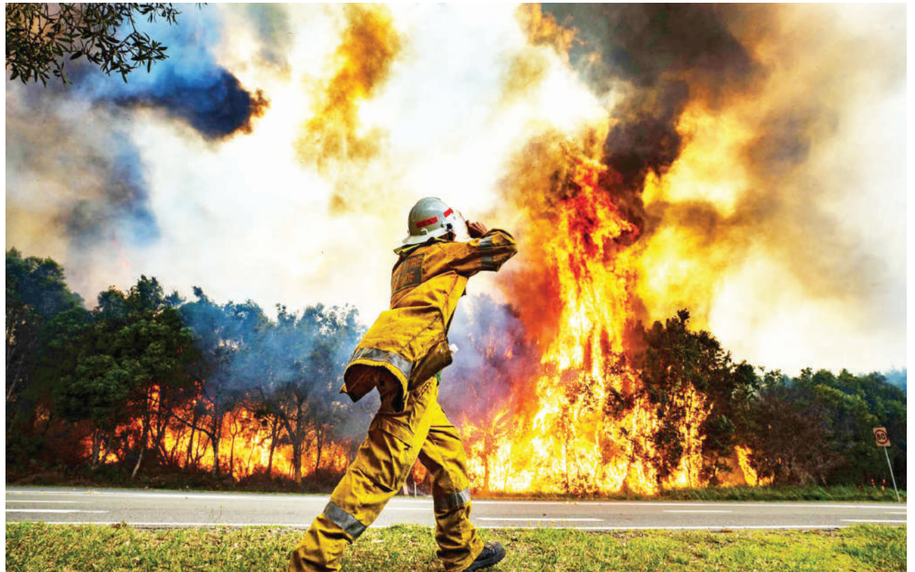
Mkazi wa Carbago nchini Australia, akipita kandokando ya barabara kuukimbia moto jana, ambao ulitekeza misitu na makazi ya watu.

Moto huo umeharibu majengo kadhaa, lakini ulikatiza makali yake baada ya mkondo wa upepo katika ufuo wa bahari kubadilika. BBC