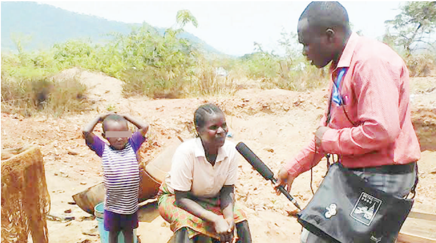
Mama akiwa katika machimbo na mtoto ambaye angepaswa kuwa shuleni.