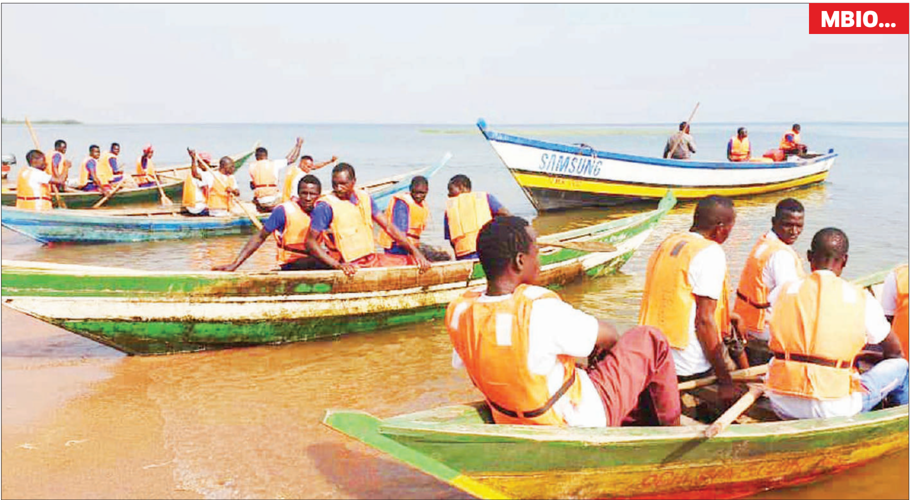
Baadhi ya timu za mbio za mitumbwi zikijiandaa kuanza mashindano hayo juzi kwenye Ufukwe wa Ziwa Victoria, katika Kijiji cha Bukima mkoani Mara, ambayo yalishirikisha timu kutoka kata 11.