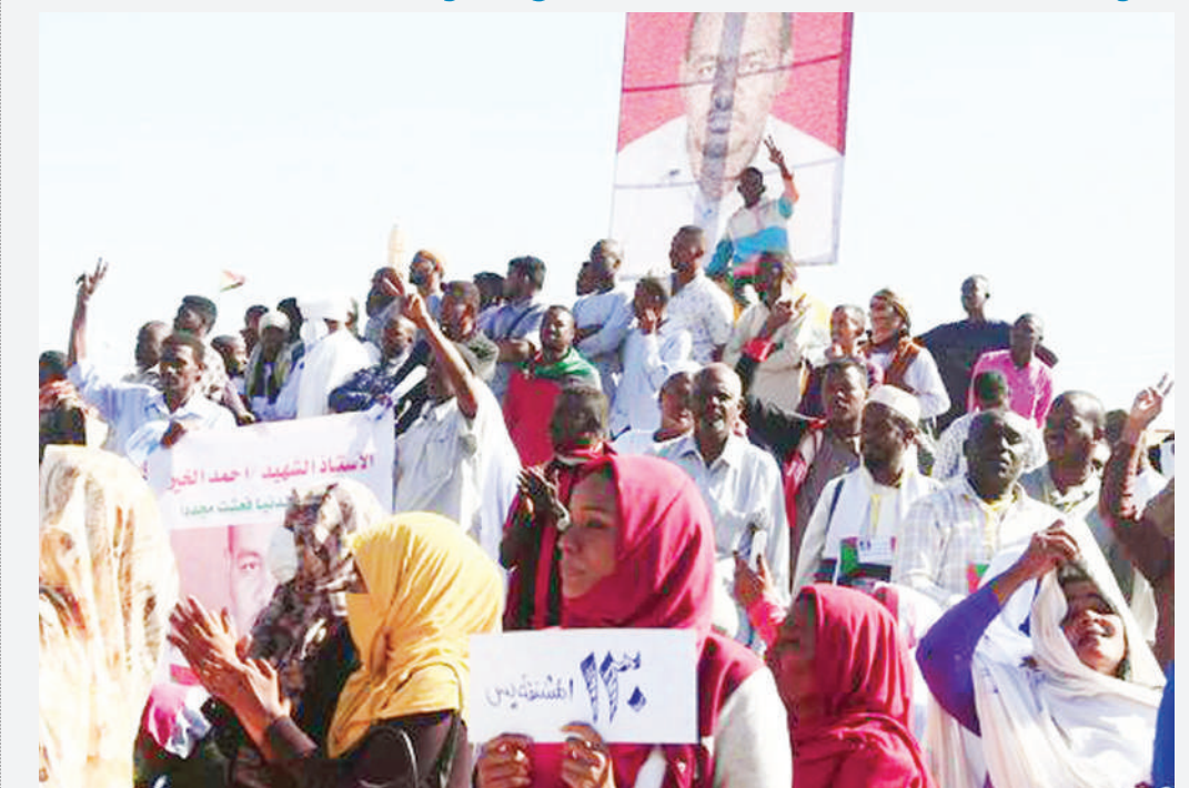
Waandamanaji Sudan wakishangilia wakati hukumu ikitolewa.

MAHAKAMA moja ya Sudan imewahukumu adhabu ya kifo maofisa 27 wa vikosi vya usalama kwa kumtesa na kumuuwa mwandamanaji mmoja wakati wa maandamano ya kumpinga aliyekuwa kiongozi wa muda mrefu Omar al-Bashir.