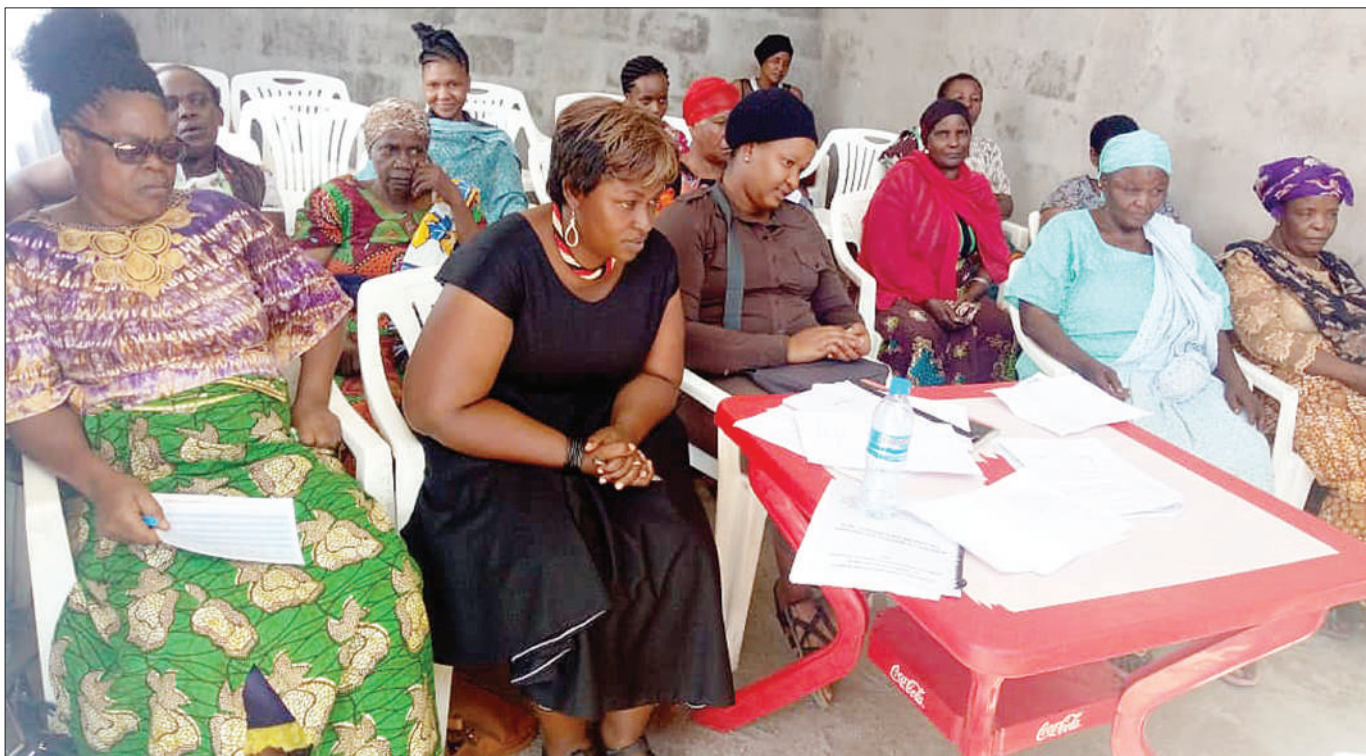
Wanaushirika wa Mirerani Multipurpose Cooperative Society Ltd wa Mji Mdogo wa Mirerani, wilayani Simanjiro, mkoani Manyara, wakiwa kwenye kikao.

Alisema kupitia vipindi hivyo vimeleta matokeo chanya, ambayo kwa asilimia kubwa yameanza kuziba pengo, baina ya wakulima, wafugaji na wataalamu wa ugani.