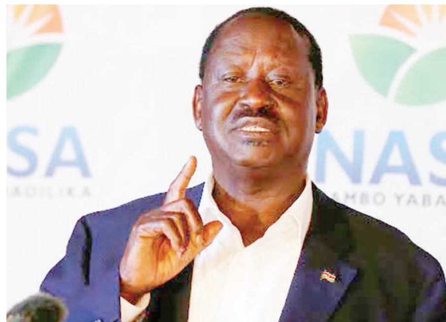
Kiongozi wa upinzani Kenya, Raila Odinga.