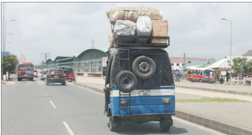
Bajaj ikiwa imebeba mizigo juu na abiria ndani yake ikipita bila kujali sheria za usalama barabara-rani jana.