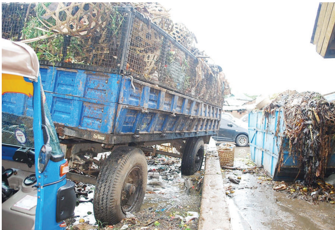
Kontena za kuhifadhi takataka zilizowekwa pembezoni mwa soko kuu la Majengo jijini Dodoma zikiwa zimezingirwa maji machafu, hivyo kutoa harufu kali kwa wafanyabi-ashara wa soko hilo na wapita njia.