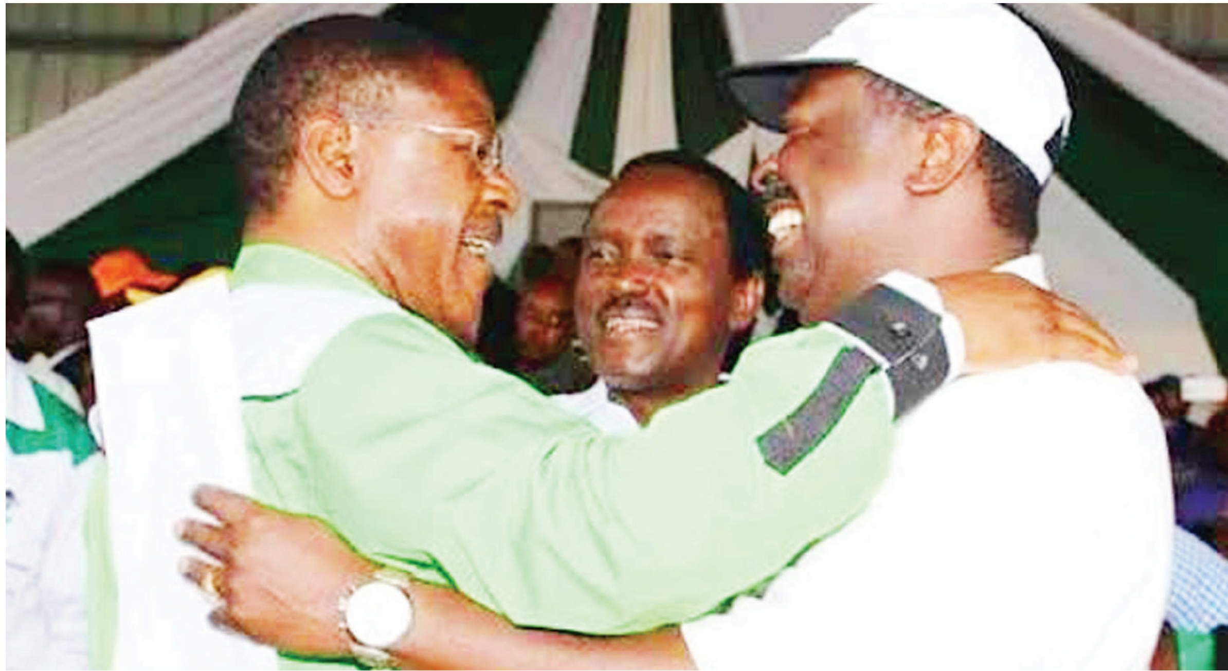
Musalia Mudavadi (kushoto) na mwenzake Moses Wetang'ula.

"Rais ndiye mwenye mipira mikononi mwake, huenda anaweza kuutupa kwa Mudavadi,"