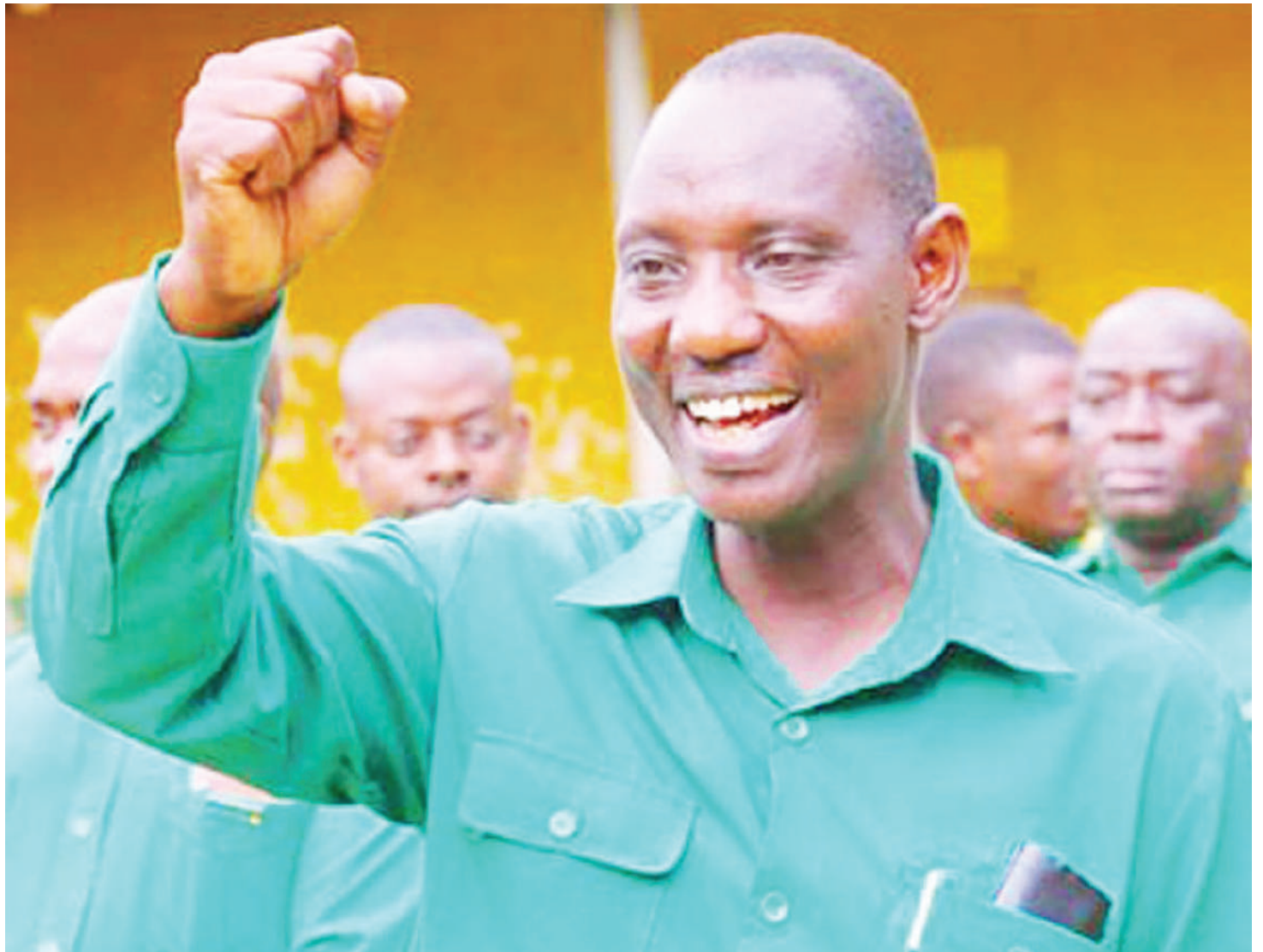
Katibu Mkuu wa CCM, Dk. Bashiru Ally.

Vitu vingine vya msingi, ambavyo CCM inavisimamia ni umoja na mshikamano miongoni mwa Watanzania, utu wema na kuwajali wanyonge, ambao ndio wengi ka-