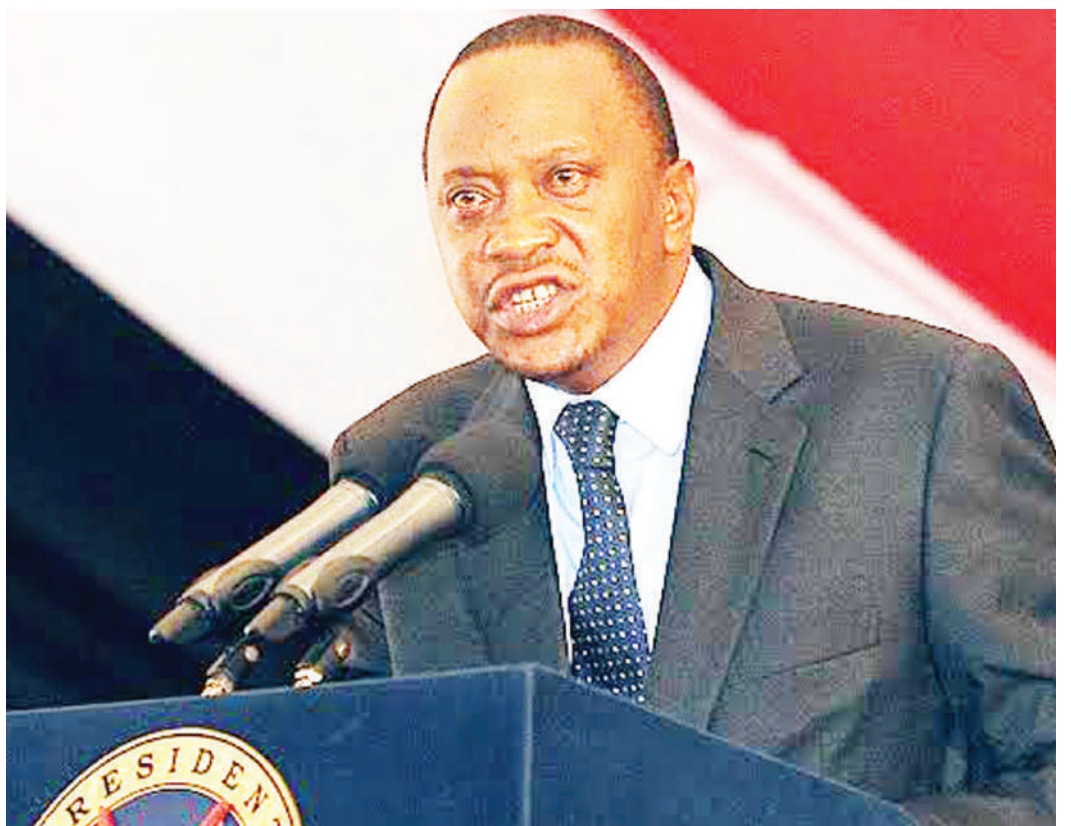
Rais Uhuru Kenyatta wa Kenya.

Tujenge amani kama siri ya Tanzania ya viwanda Ukurasa 14