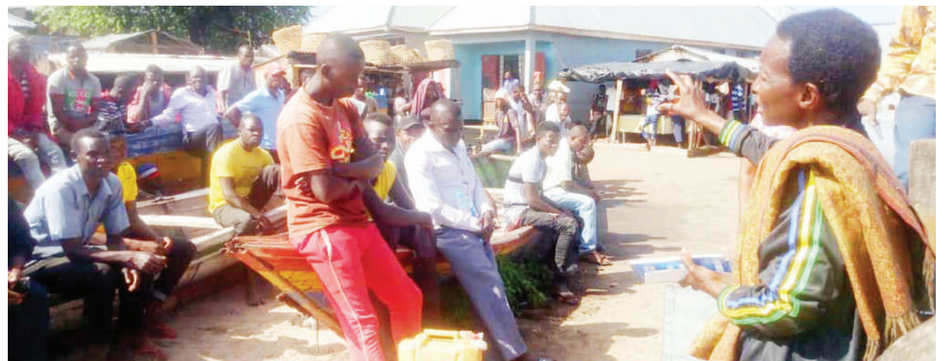
Ofisa Maendeleo ya Jamii wa Halmashauri ya Wilaya Musoma, mkoani Mara, Tanna Nyabange, akizungumza jana na wavuvi wa Busekera, kwenye ziara ya kuwahamasisha wajunge katika vikundi, ili waweze kupata mikopo ya halmashauri na taasisi nyingine za fedha.

Alisema hiyo itakuwa fursa nzuri zaidi kwa wafanyabiashara wa Tanzania na Rwanda kufanya biashara kutokana na uwapo wa mkutano huo.