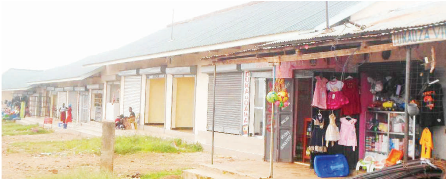
Sehemu ya jengo la vibanda 63 vya maduka ya biashara ya kitega uchumi cha Halmashauri ya Mji wa Tarime, lililojengwa kwa mkataba na mwekezaji wa ndani.