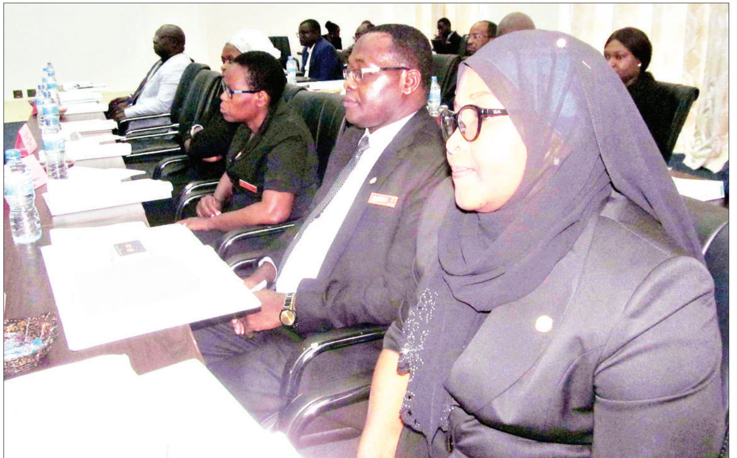
Baadhi ya wajumbe wa kamati ya kitaifa ya kusukuma mashauri ya madai, ambao ni majaji wafawidhi wa Mahakama Kuu ya Tanzania, wakifuatilia kikao cha uzinduzi wa kamati hiyo, jijini Dar es Salaam juzi.