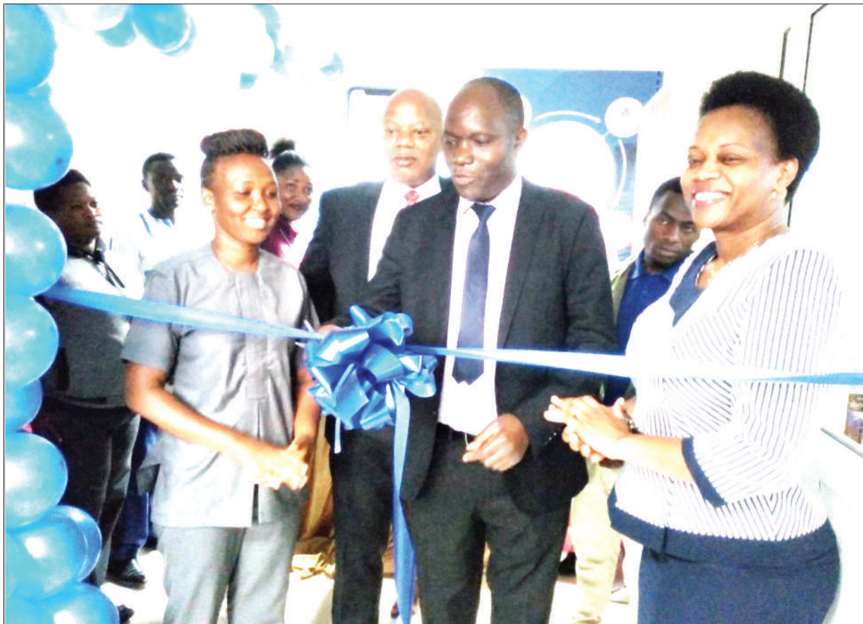
Maofisa wa kampuni ya uwekezaji wa pamoja (UTT AMIS), waki-kata utepe kuashiria ufunguzi wa kituo cha kuhudumia wawekezaji wa mkoa ya Kanda ya Nyanda za Juu Kusini, jijini Mbeya hivi karibuni.

Hata hivyo Kesi hiyo iliahirishwa hadi Disemba 24, mwaka huu ambapo mashahidi wengine wataendelea kusikilizwa. Mshtakiwa alirudishwa rumande.