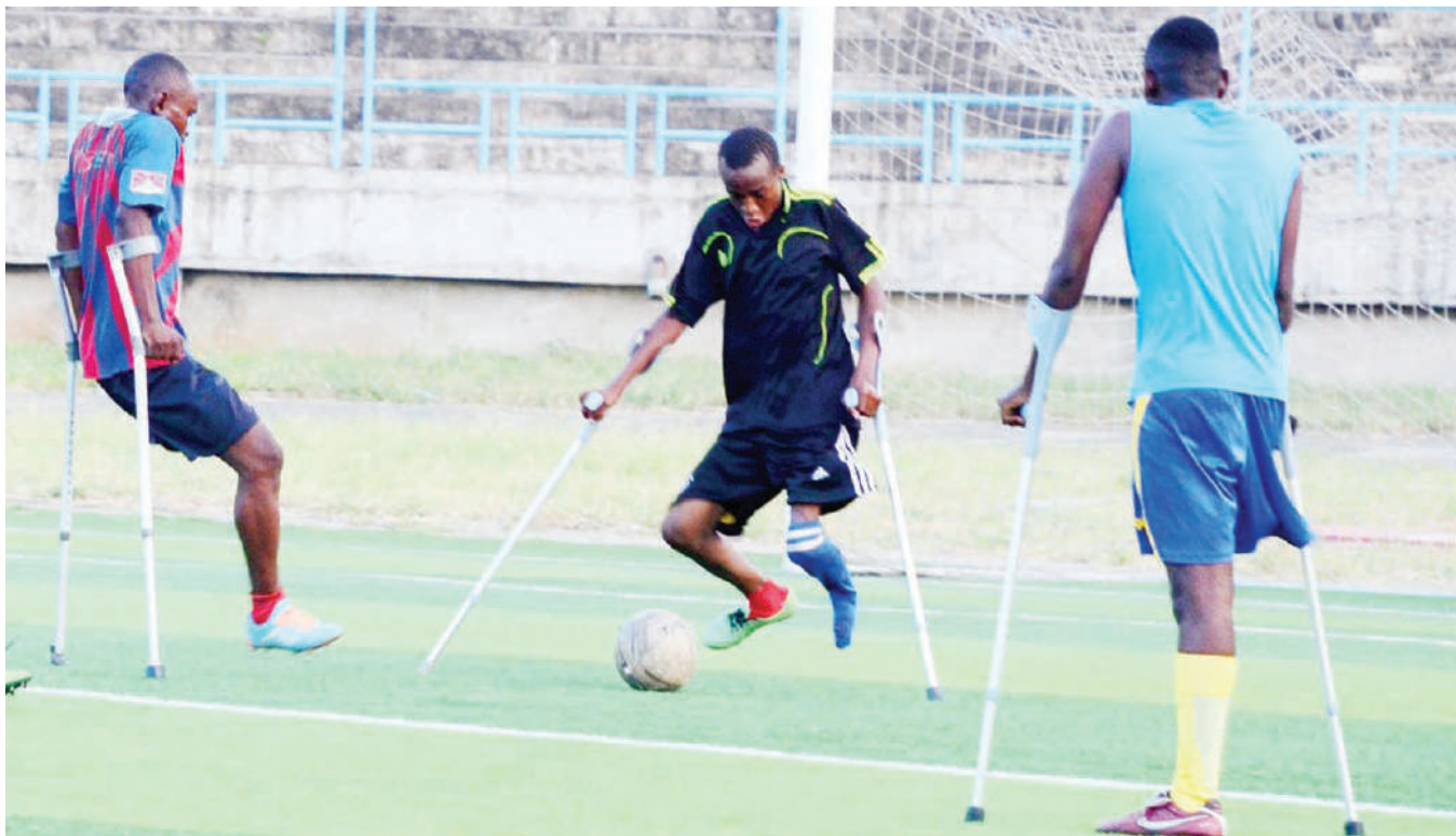
Wachezaji wa Timu ya Taifa ya mpira wa miguu ya wenye ulemavu 'Tembo Warriors', wakijifua kwenye mazoezi katika Uwanja wa Uhuru jijini Dar es Salaam juzi.