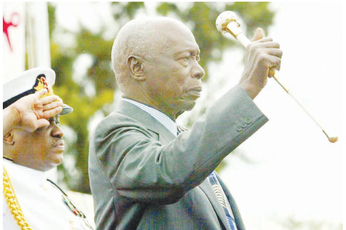
Rais wa zamani wa Kenya, Daniel Arap Moi (kulia), enzi za uhai wake Desemba 28, 2002, muda mfupi kabla ya kuondoka madarakani.