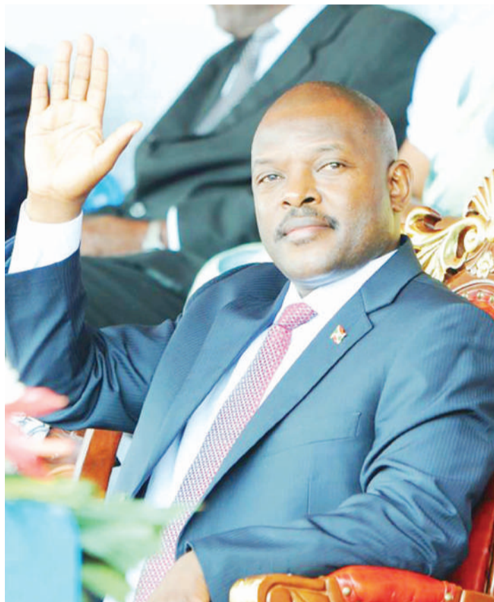
Rais Pierre Nkurunziza, anayetarajiwa kuacha kiti mwaka huu, baada ya kutumikia vipindi vitatu.

Kwa mfano, hivi karibuni alimpinga Nkurunziza katika nia yake ya kuwania urais kwa muhula wa tatu, lakini baadaye akabadilisha fikra zake na kumuunga mkono kiongozi huyo wa nchi.