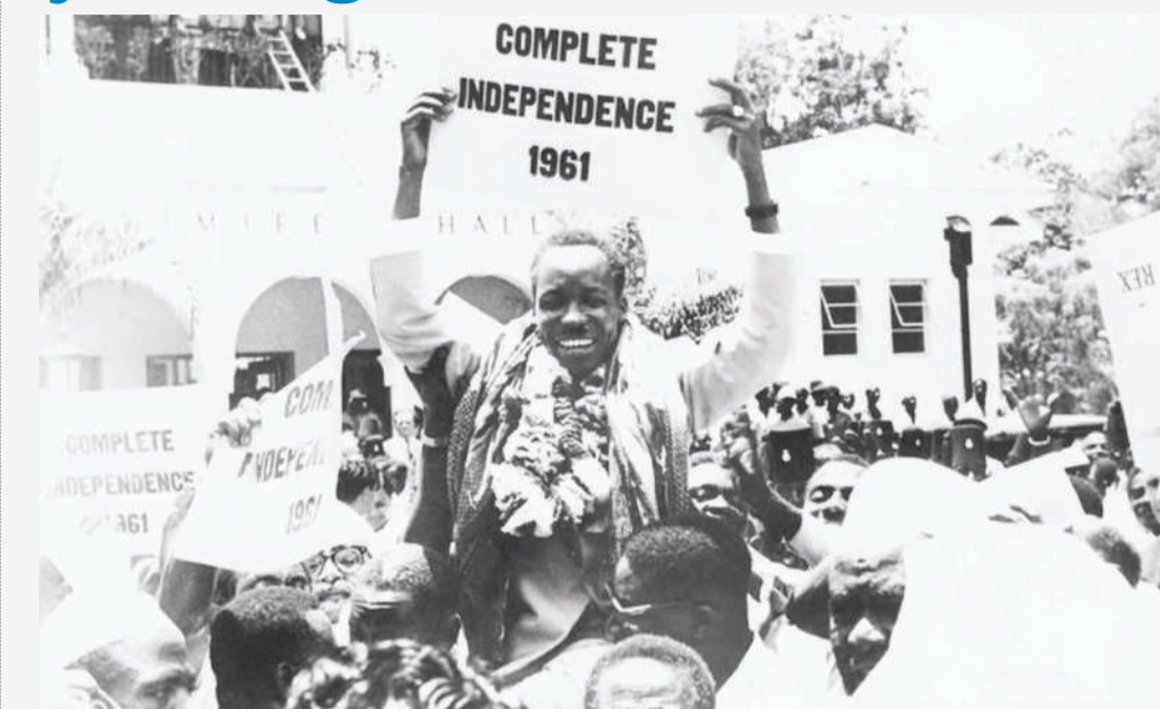
Mwalimu Julius Nyerere, alipojumuika na umma kufurahia uhuru wa nchi.