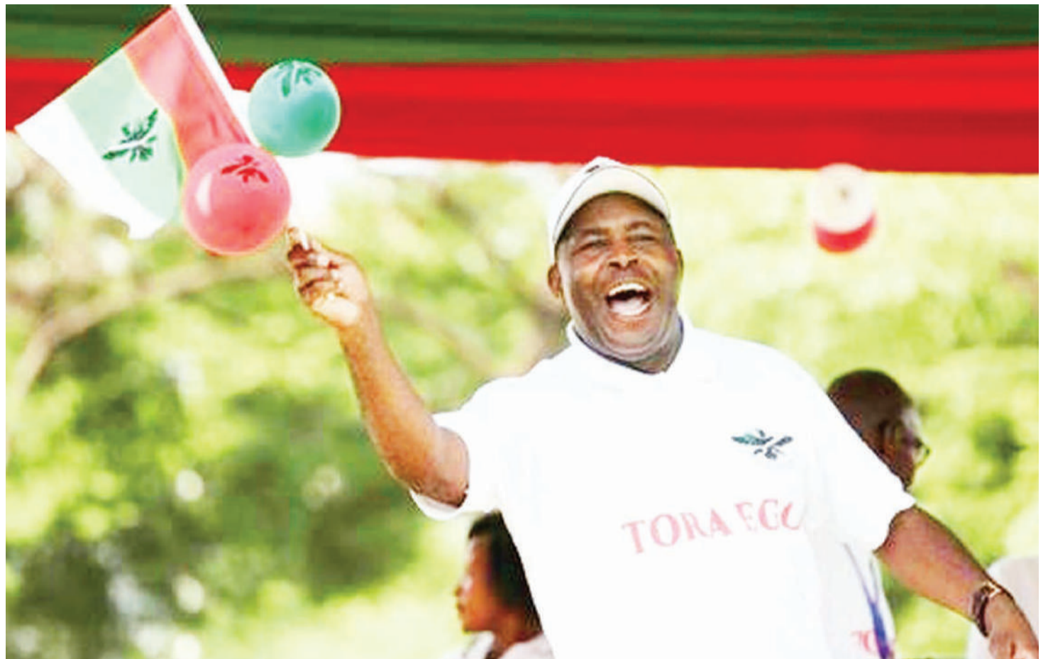
Meja Jenerali Evariste Ndayishimiye, katika nyendo zake za kisiasa.

Marekani limeripoti tukio hilo kutoka Nairobi nchini Kenya, likimtaja mgombea urais mteule huyo kuwa ni 'Jenerali wa Jeshi'.