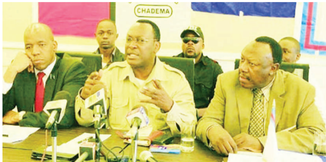
Viongozi wa vyama vya upinzani walipokutana.

Somo la Ngawaiya, upenyo sahihi kuwanasa viongozi bora Oktoba Ukurasa 20