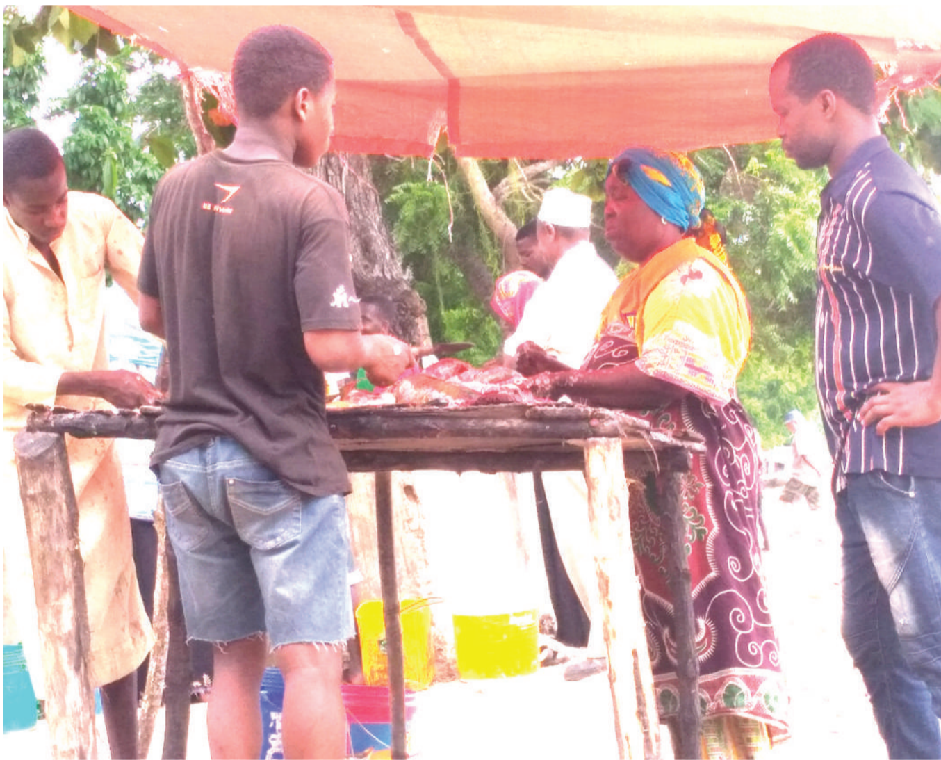
Baadhi ya wananchi wa Kijiji cha Unguja Ukuu, wakiwa katika harakati za kusafisha samaki ili kupata fedha za kujikimu kimaisha katika soko la mnada wa samaki la kijiji hicho, jana.

“Tumeyapokea malalamiko kutoka kwa wananchi na tumeanza mchakato wa kuzipitia sheria zote muhimu kwa kuzitafsiri kwa lugha ya Kiswahili pamoja na miswada yake,” alisema.