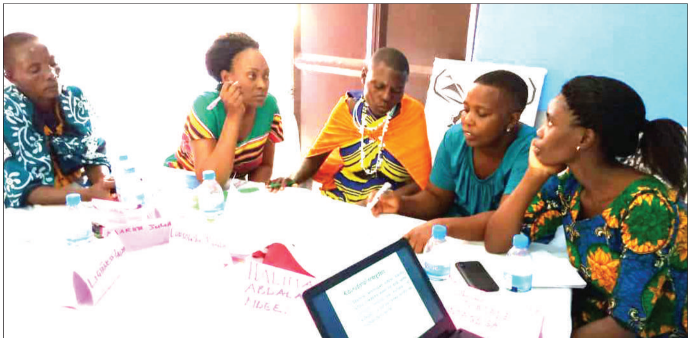
Baadhi ya wanawake wa jamii ya wafugaji wa Kimasai wilayani Hai, wakijadiliana kuhusu vitendo vya ukatili wa kijinsia hasa ukeketaji na ndoa za utotoni vinavyoendelea kuwatesa vijijini, wakati wa mradi wa nguvu ya pamoja ya kupambana na ukatili dhidi ya wanawake na watoto ulioandaliwa na Shirika la Kwieco, juzi.

Aidha, aliwataka wananchi kuacha tabia ya matumizi ya pombe na badala yake kujikita katika kuhakikisha wanafanya kazi kwa ajili ya maendeleo.