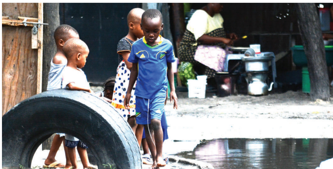
Mtoto akipita eneo lenye maji machafu la Mwananyamala Sokoni, jijini Dar es Salaam, bila kuvaa viatu, kitendo kinachoweza kuhatarisha usalama wa afya yake.

Pia aliwataka kuacha tabia ya kuendelea kuingiza mayai hayo kienyeji kwa kushirikiana na wafanyabiashara kutoka nchi za jirani ili kutoendelea kuingia hasara, na badala yake waagize mayai kutoka mikoa inayofunga kuku kwa wingi nchini.