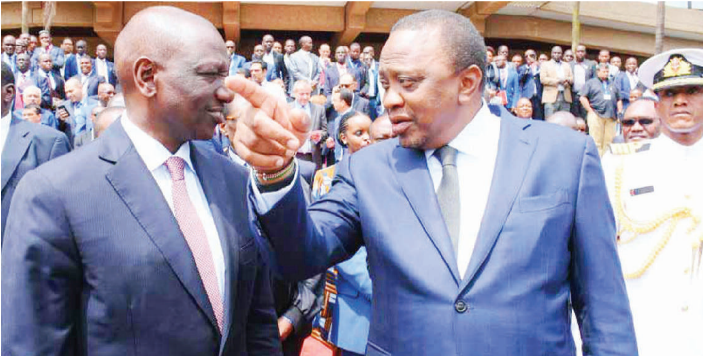
Rais Uhuru Kenyatta akiwa na makamu wake, William Ruto.