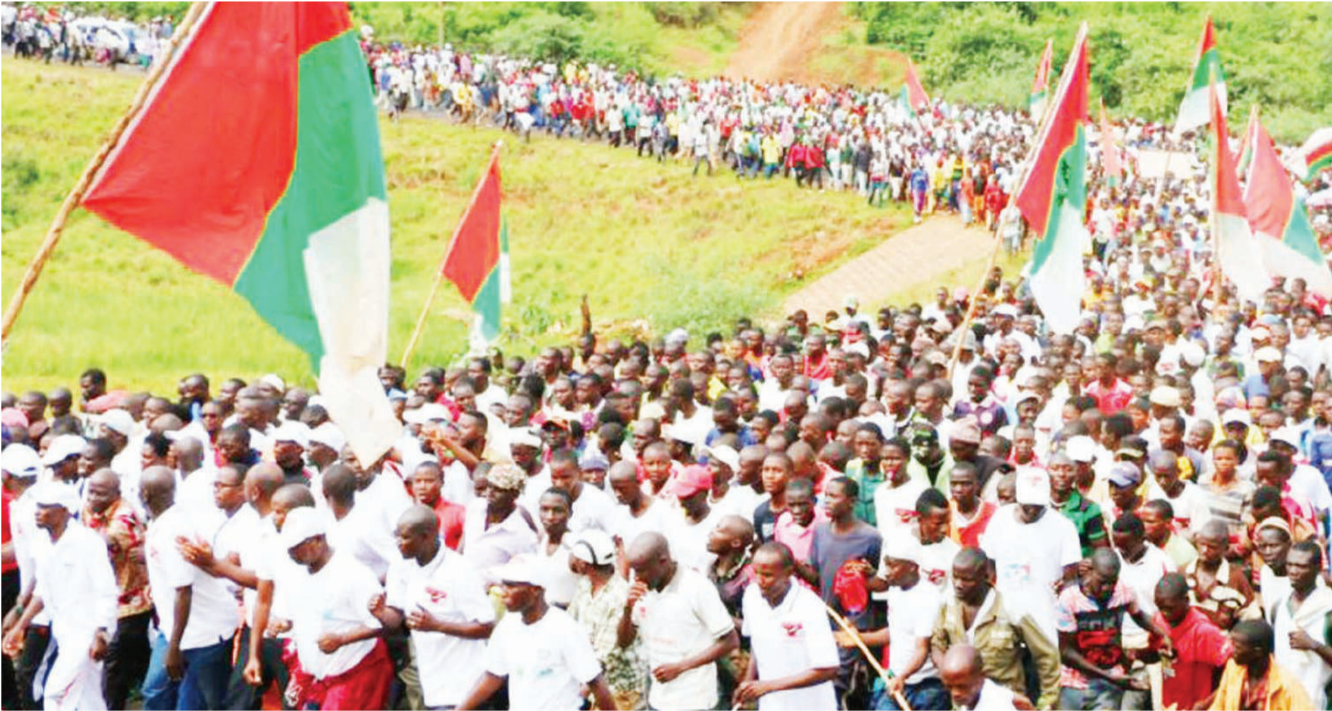
Wananchi wa Burundi, katika moja ya harakati zao za siasa.