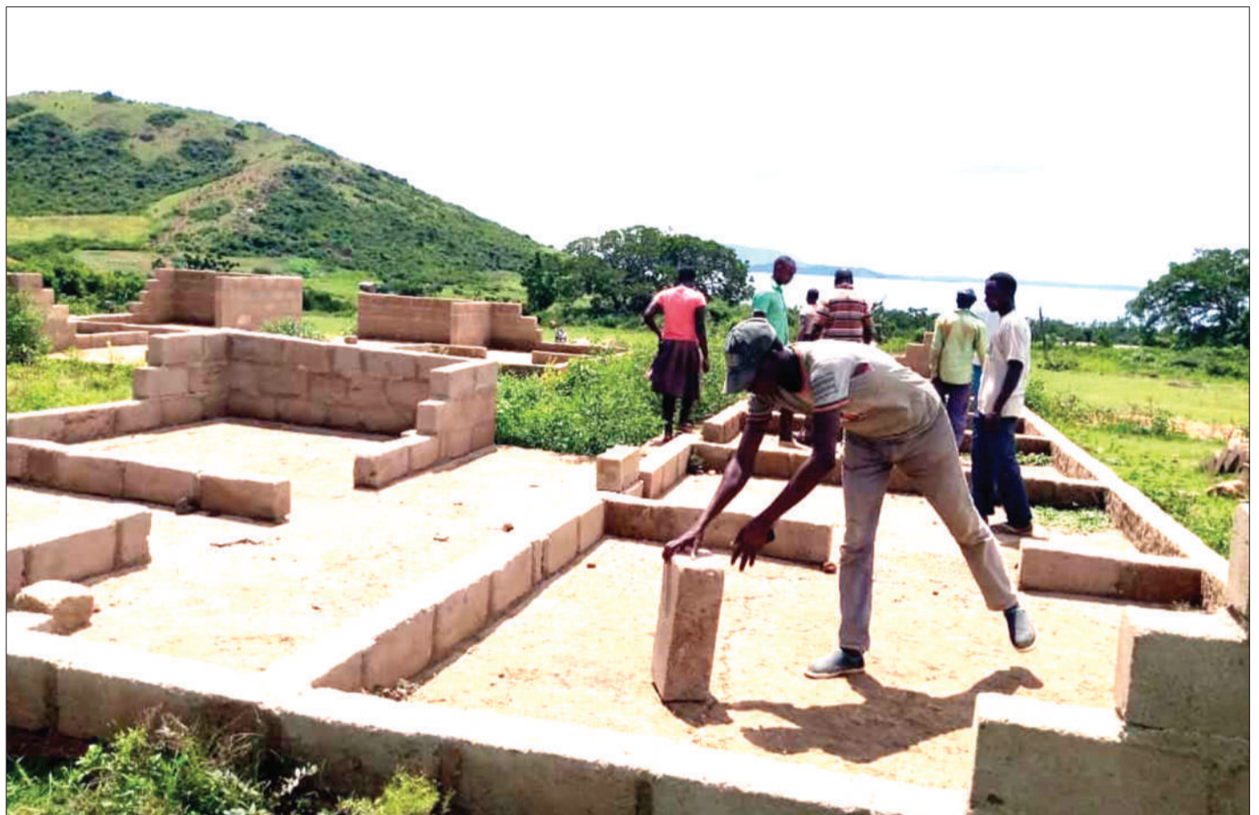
Fundi akiandaa matofali, kwa ajili ya kuendelea na ujenzi wa majengo ya zahanati ya kijiji cha Bukimu, Musoma Vijijini mkoani Mara juzi. Mkakati wa serikali ni kila kijiji kuwa na zahanati, ili kusogeza huduma za afya karibu na wananchi.

Twaibu alisema majina ya waliofariki dunia bado hayajafahamika na wote wanakadiriwa kuwa na umri kati ya miaka 20 hadi 30.