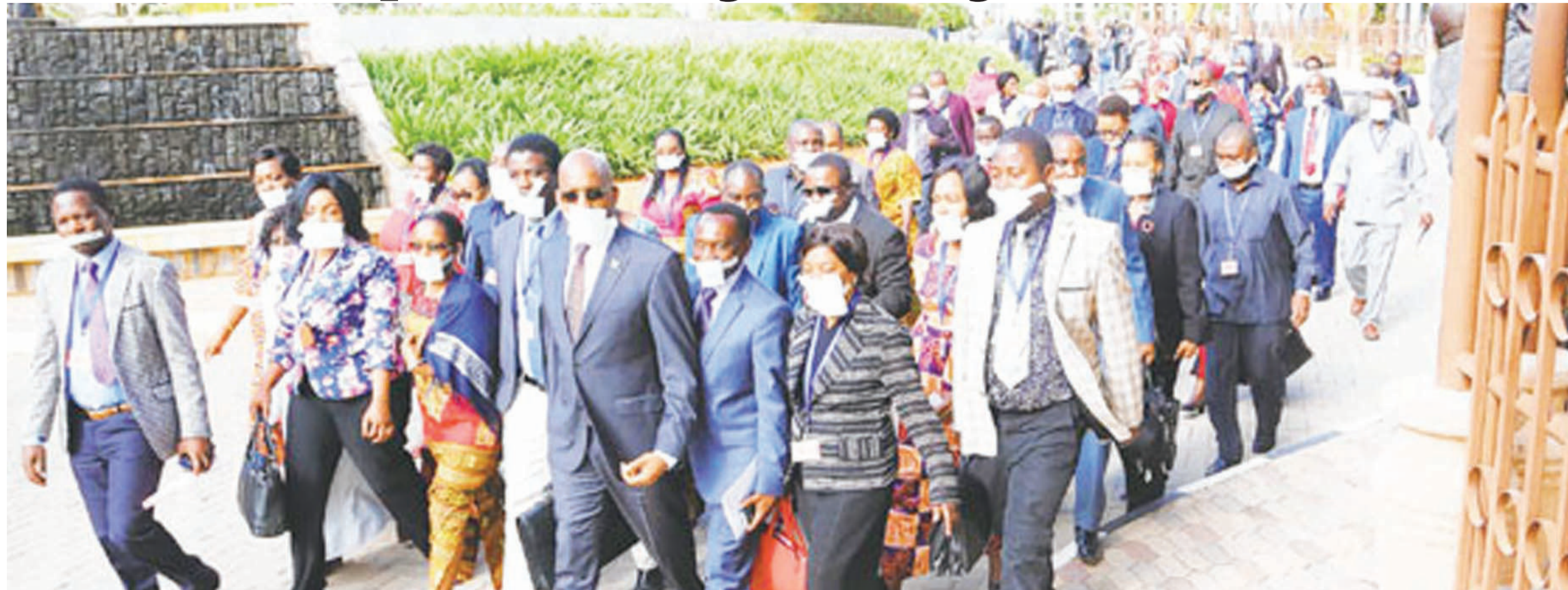
Iliyokuwa harakati za kudai siasa za vyama vingi nchini.