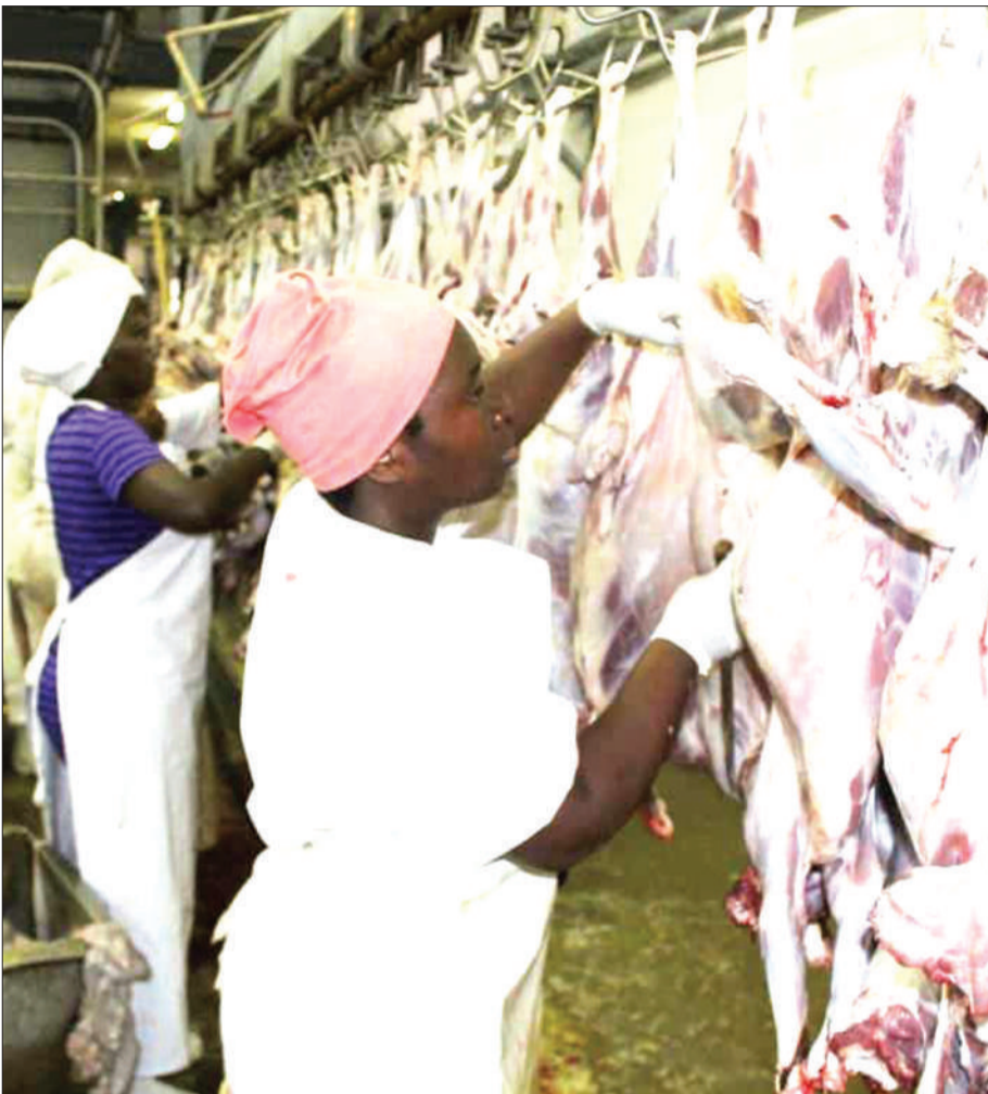
Baadhi ya wafanyakazi wa machinjio ya ng'ombe ya serikali yaliyopo eneo la Kizota jijini Dodoma, wakiwa kazini kuandaa nyama kwa ajili ya kupeleka sokoni, juzi.