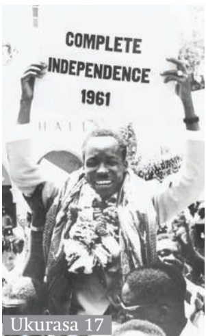
Ukurasa 17 Dondoo za safari ya mageuzi nchini

Nchi za Sahel katika mthani ubia na Ufaransa vita ya uasi