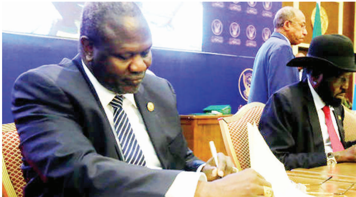
Evariste Ndayishimiye, katika majukumu.

Nkurunziza atarudi tu, hawezi kwenda mbali. Atakuwa anafanya kazi kupitia mlango wa nyuma aki- jaribu kuilinda familia na utajiri wake.