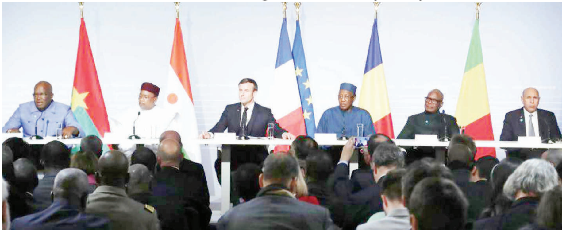
Viongozi wa jumuiya ya nchi ukanda wa Sahel, walipokuwa mkutanoni na Rais wa Ufaransa, Emmanuel Macron (wa tatu kutoka kulia), hivi karibuni.

• Macron aambiwa 'bora magaidi kuliko yanayoendelea..'