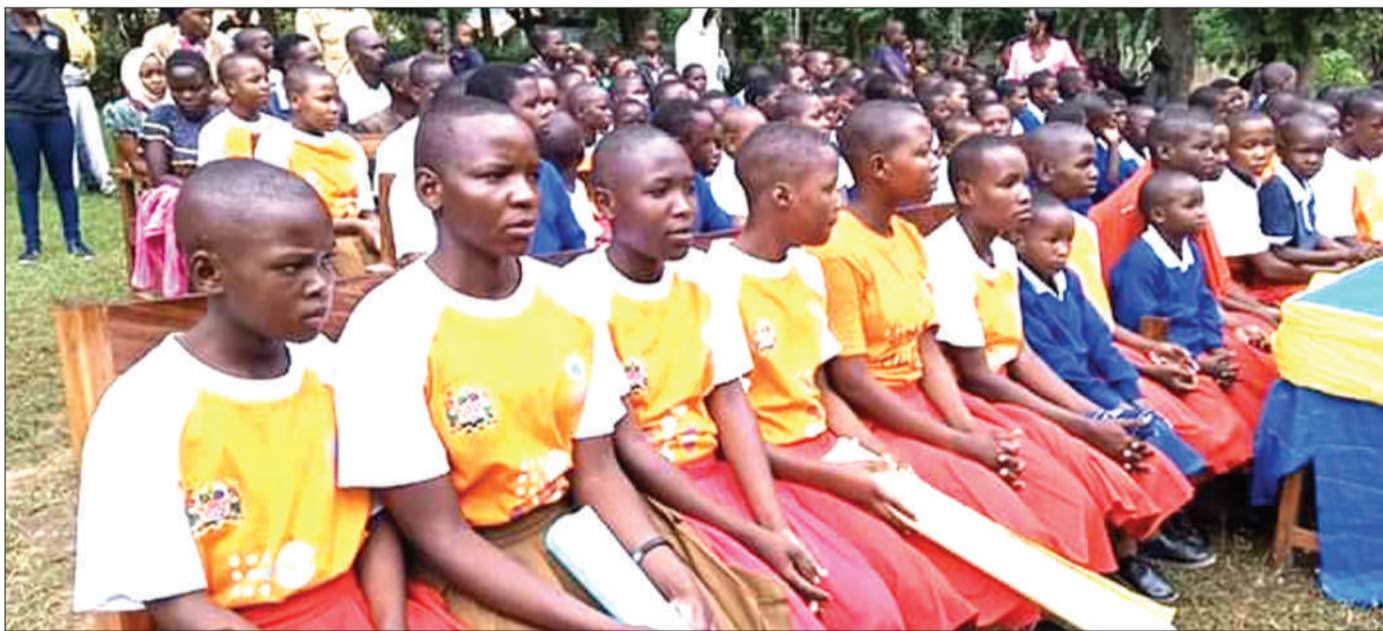
Wasichana waliokimbia ukeketaji ambao sasa wanalelewa na nyumba salama ya shirika lisilo la kiserikali la Hope for Girls and Women Tanzania la mjini Mugumu, Serengeti mkoani Mara, wakifuatilia uzinduzi wa Wiki ya Sheria mjini humo juji.

Akijibu swali hilo, Masauni alisema serikali itafanyia kazi madai hayo.