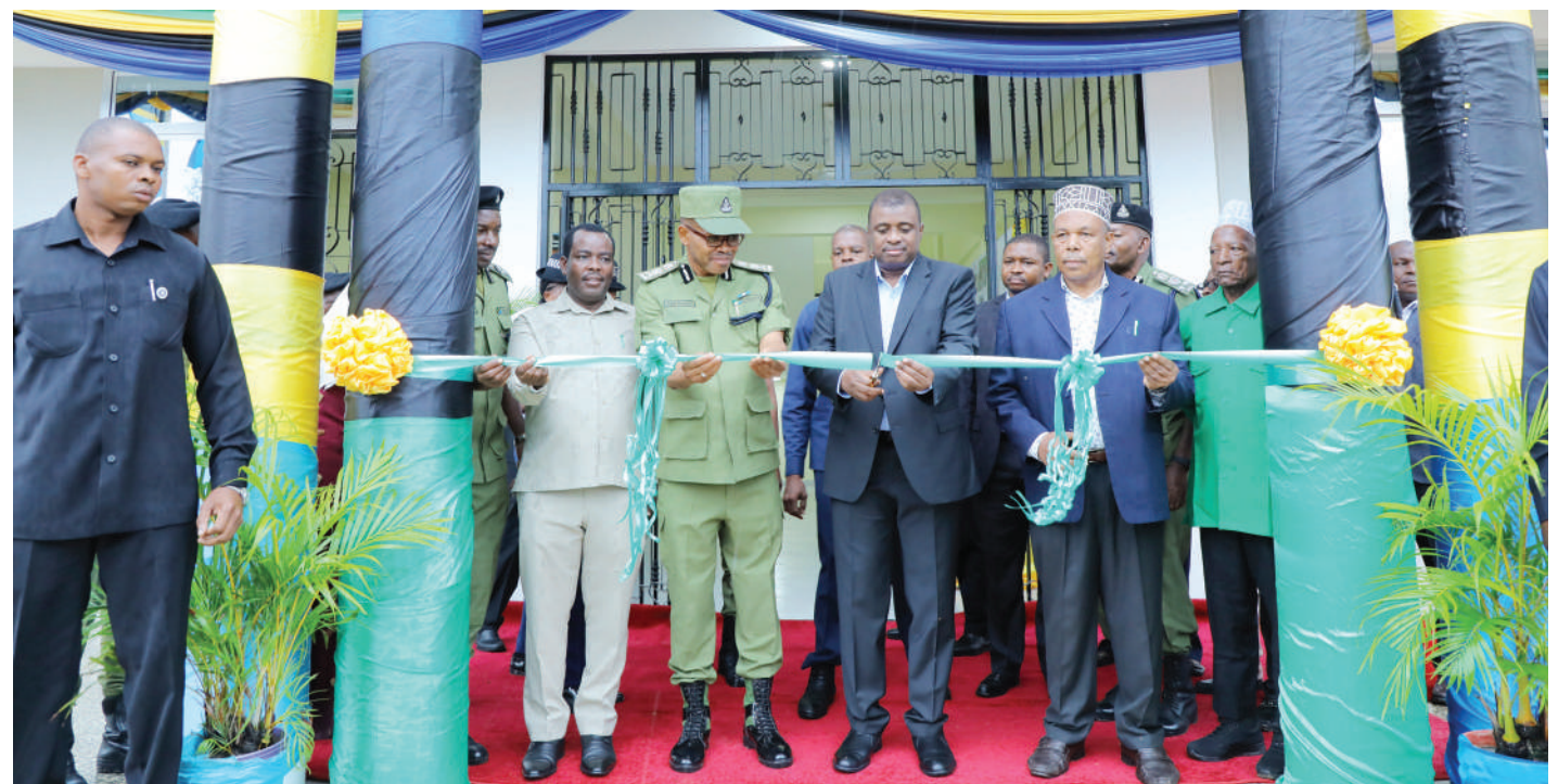
Makamu wa Pili wa Rais wa Zanzibar Hemed Suleiman Abdalla, akikata utepe kuashiria Ufunguzi Jengo la Ofisi ya Makamanda wa Polisi Mkoa wa Kusini Unguja lililopo Tunguu Zanzibar ikiwa ni shamrashamra za maadhimisho ya miaka 59 ya Muungano wa Tanganyika na Zanzibar.

Katika matukio hayo 155 yaliyoriipotiwa ya ubakaji ni 69 na ulawiti 29 na kuingilia kinyume na maumbile matukio sita na waathirika washichana waliobakwa ni 65, wavulana waliolawitiwa 24 na wasichana watano wameingiliwa kinyume na maumbile.