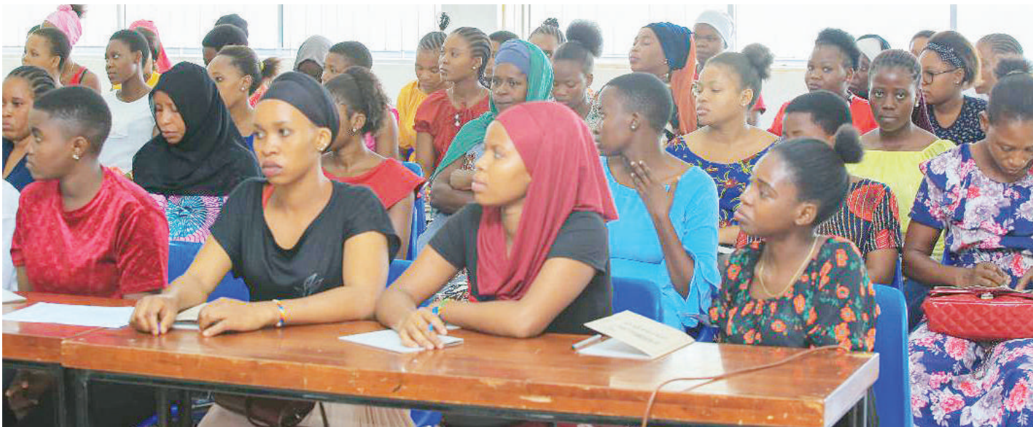
'Wadada wa kazi' wakiwa mafunzoni katika Chuo cha Ustawi wa Jamii, Dar es Salaam.

K UNA baadhi ya wafanyakazi majumbani wanakiri kupitia unyanyasaji wa aina mbalimbali, ikiwamo mashambulio ya aibu, ngono na mateso mengineyo ya hatari kwa afya zao, kwani seketa hiyo imetawaliwa na mabinti wenyewe umri chini ya miaka 18 katika umaarufu wao 'wadada wa kazi' au 'wasichana wa kazi.'