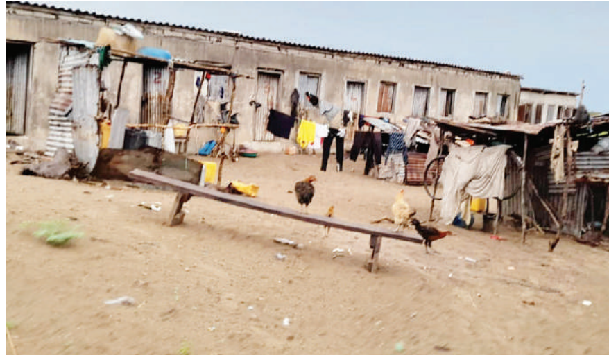
Moja ya makazi yaliyokutwa katika Kitongoji cha Makupani karibu na mradi wa chumvi.

Ukiingiza mafuta na kemikali nyingine za mitambo, na vitu hivyo kumwagika au kum-