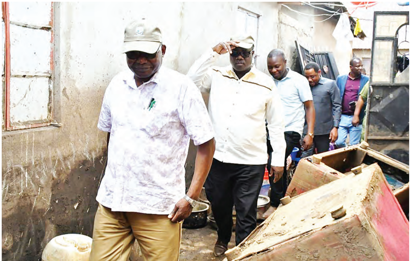
Naibu Waziri wa Ardhi, Nyumba na Maendeleo ya Makazi, Geophrey Pinda, akipita katika moja ya nyumba iliyoathirika na mafuriko ya Hanang jana.

Sambamba na hilo baadhi ya wananchi wanaendelea kupata hifadhi katika maeneo ya taasisi za elimu zilizoko Katesh baada ya makazi yao kuharibiwa.