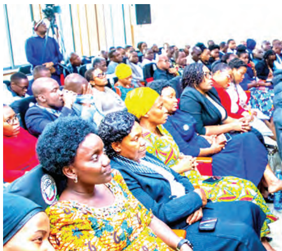
Naibu Waziri Mkuu na Waziri wa Nishati, Dk. Doto Biteko, alipozindua ripoti ya nishati mwezi uliopita.

Ndani ya sura hiyo kuu, kunaendana na angalizo chanya lililotewa Julai mwaka jana na aliyekuwa Waziri wa Nishati, January Makamba akitamka: "Serikali haisambazi umeme vijijini kwa