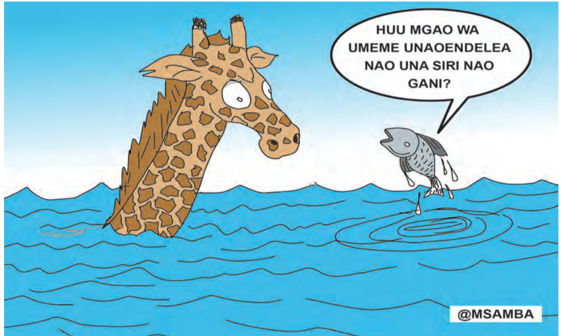
Na Tuntule Swebe

Ni vyema suala la dawa bandia na zilizokwisha muda lisifanyiwe masihara katika kuhakikisha Watanzania wanatumia dawa na vifaa tiba vilivyothibitishwa ubora wake.