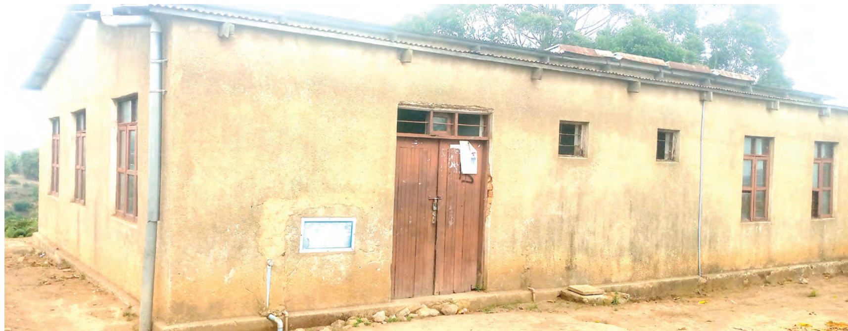
Hali ya kiwanda kilichokufa katika picha tofauti Njombe.

kuwa kinahitaji maboresho kwa sababu kinatumia vyanzo vya aina tatu kujiendesha; kukausha nanasi, kwanza nahitaji dizeli, jua na kuni au mkaa, sasa kiwanda kimoja kinahitaji mahitaji matatu kwa wakati