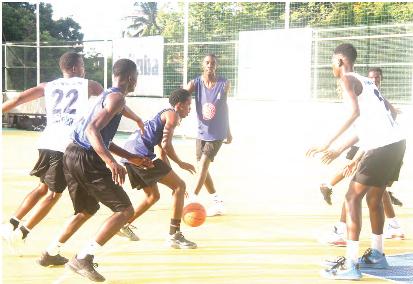
Wachezaji wa mpira wa kikapu wa Timu ya Vijana wakifanya mazoezi ili kujiimarisha kwenye viwanja vya JKM Park jijini Dar es Salaam juzi.

Timu zitakazofanya vizuri katika ligi hiyo inayosimamiwa na TFF zitapanda daraja kucheza Ligi ya Championship (zamani Ligi Daraja la Kwanza), katika msimu ujao wa 2024/2025.