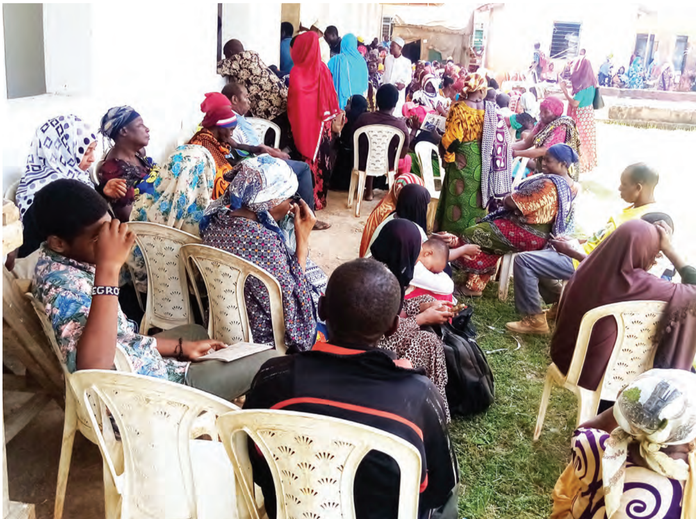
Wakazi wilayani Muheza, Mkoa wa Tanga wakisubiri kuitwa ndani ya chumba maalum cha matibabu ya macho katika Kituo cha Afya Ubwari baada ya madaktari bingwa wa macho kutoka Hospitali ya Mvumi kuweka kambi siku tatu wilayani humo.