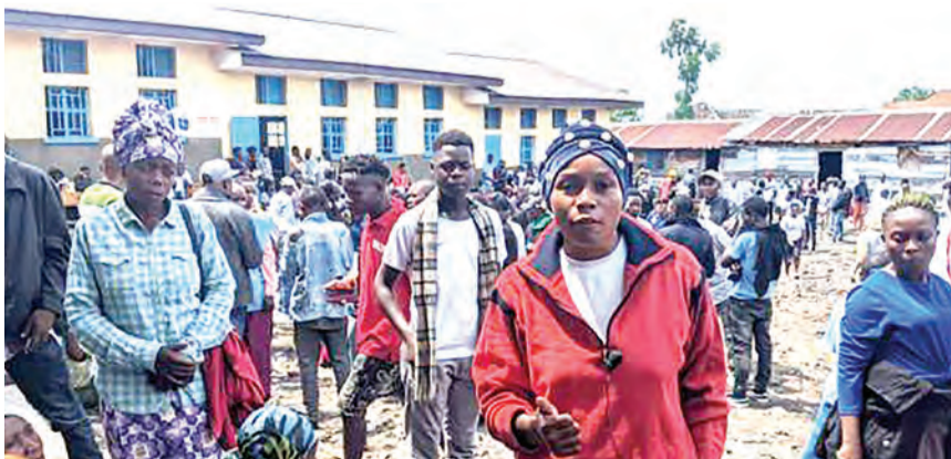
Kundi la wapiga kura nchini DRC walioshindwa kutimiza haki yao baada ya kituo kushindwa kufunguliwa kutokana na matatizo ya umeme juzi

mashariki wa Bunia, watu hawakuweza kurejea katika vijiji vyao vya kupiga kura, walishambulia na kuchoma moto kituo kimoja na kusababisha mashine na karatasi za kura kuteketea.