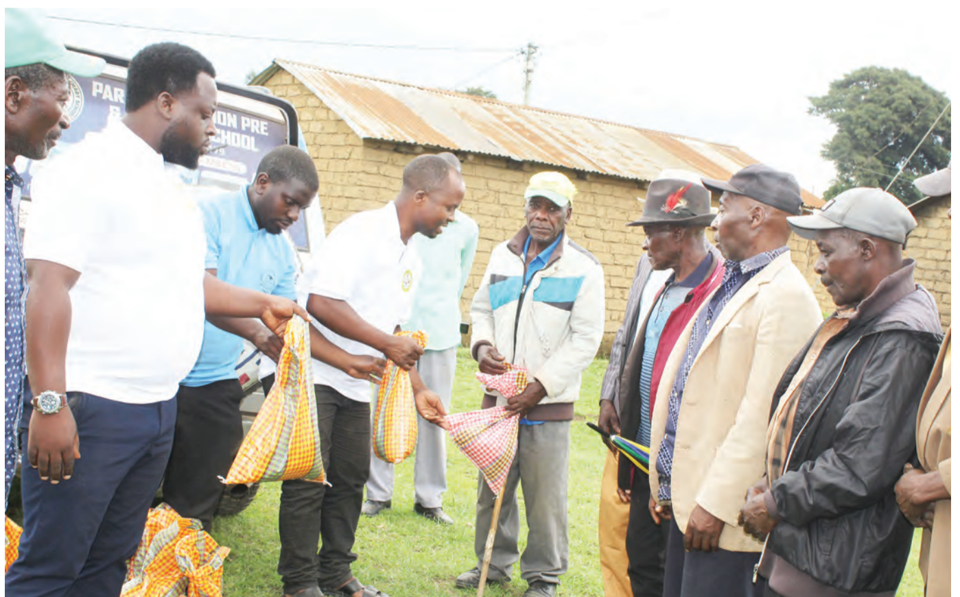
Wafanyakazi wa Shule ya Sekondari ya Patrick Mission Dar es Salaam na Paradise Mission ya mkoani Mbeya waki-gawa misaada ya vyakula kwa wazee wasiojiweza katika Kata ya Santiliya, wilayani Mbeya juzi kwa ajili ya sikukuu za Krismasi na Mwaka Mpya, zaidi ya 300 wamenufaika.

Alisema atawasiliana na wakuu wa wilaya zote za mkoa huo ili kukubaliana namna ya kuzigawa kulingana na maelekezo ya viongozi wa CCM mkoa.