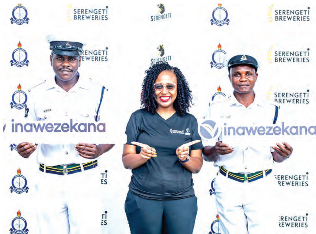
Tukio la kuzindua kampeni ya usalama barabarani, kudhibiti ajali za mwisho wa mwaka.

Nje, Ulinzi na Usalama iliyowasilishwa mwezi Februari 2023 katika Bunge la 12, watu 382 wameripotiwa kupoteza maisha kutoka mwezi Oktoba hadi Desemba 2022, vifo vinavyoelezwa kuongezeka kwa asilimia 4.1 kutoka idadi ya watu 367 waliokufa katika kipindi kama hicho kwa mwaka 2021, huku chanzo kikubwa kikitajwa ni ajali za barabarani zilizotokea katika maeneo mbalimbali nchini katika kipindi hicho.