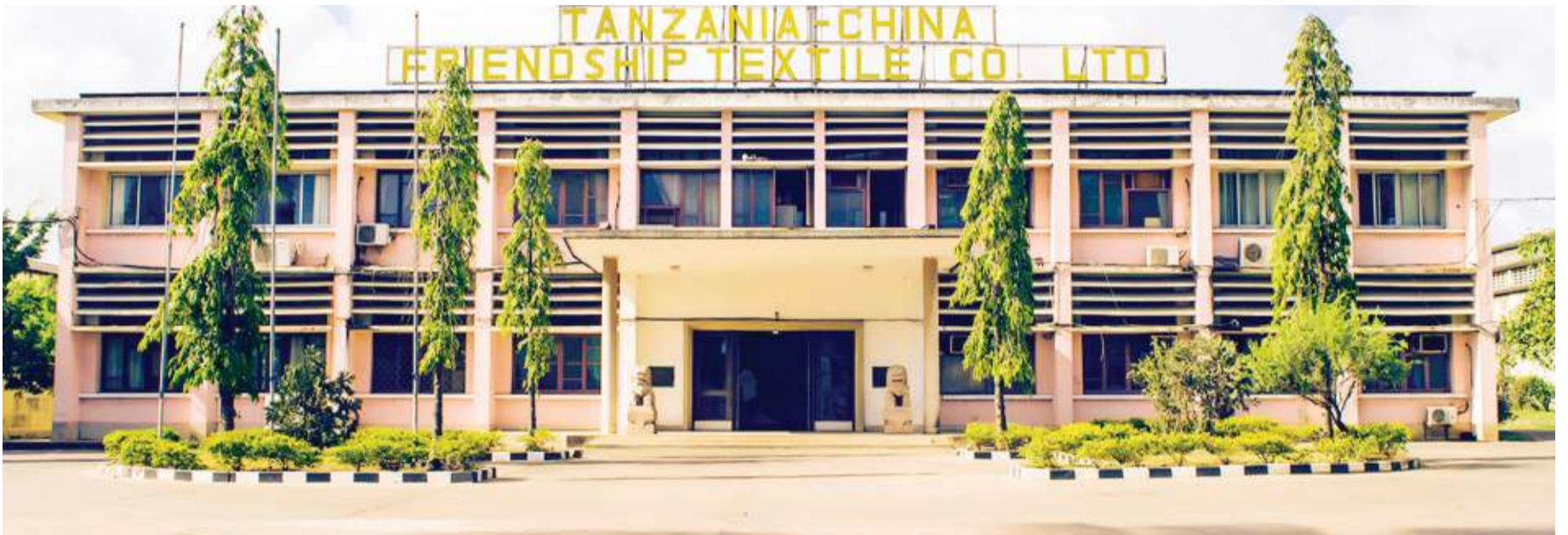
Jengo la Kiwanda cha Ng'uo cha Urafiki, moja ya matunda ya uongozi wa Mwalimu Julius Nyerere.