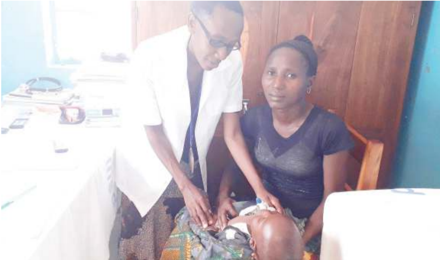
Mtoto wa Happy, Yalumbwe, mwenye miezi 14 akifanyiwa uchunguzi na muuguzi wakati alipohudhuria kliniki.