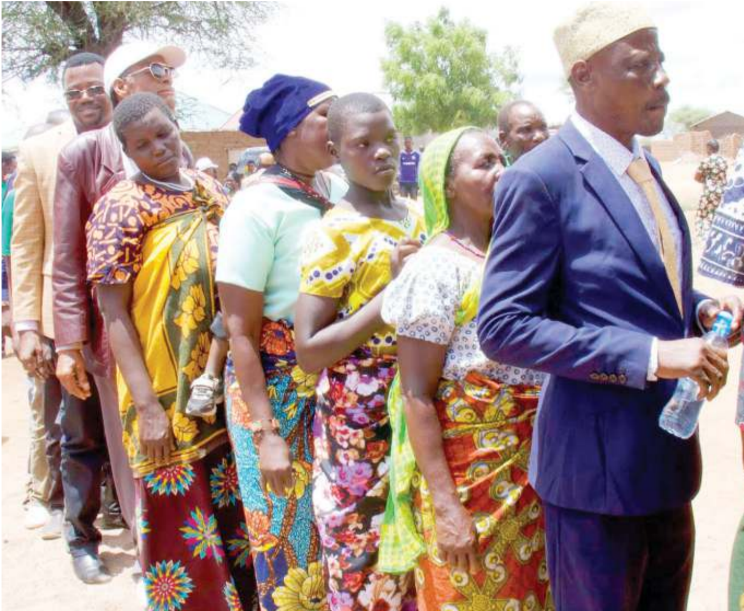
Wananchi wakiwa katika foleni ya kujiandikisha kwa ajili ya kupiga kura.