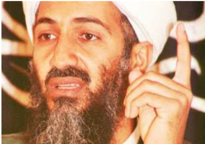
Osama Bin Laden.

Huku daktari huyo akionekana kuwa shujaa Marekani, nchini Pakistan anaonekana kama msaliti ambaye alilitea aibu taifa hilo.