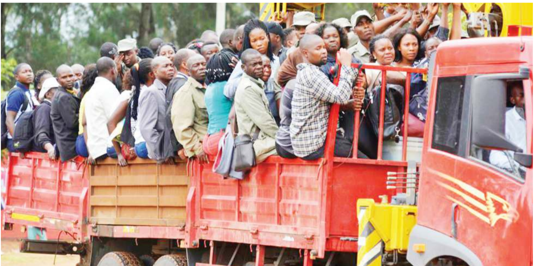
Maofisa wa Tume ya Uchaguzi na vifaa vya uchaguzi wakisafirishwa katika maeneo mbalimbali nchini Msumbiji kwa kujiandaa na Uchaguzi Mkuu.

Pamoja na kuwa na familia kubwa amemudu kuwasomesha watoto wake, familia yake ina wahandisi, madaktari, wauguzi, maofisa afya, waalimu na wanasheria, wengine wamepitia vyuo vya ufundi huku wengine wakiwa wafanya-biashara. BBC