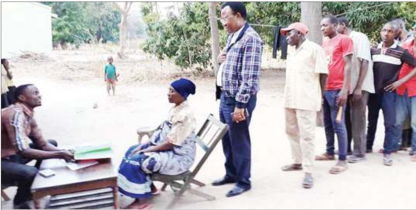
Mbunge wa Jimbo la Isimani ambaye ni Waziri wa Ardhi, Nyumba na Maendeleo ya Makazi, William Lukuvi, akisubiri kujiandikisha katika daftari la wapigakura la uchaguzi wa viongozi wa Serikali za Vijiji na Mitaa katika kituo cha Msimbo kilichopo Tarafa ya Idodi mkoani Iringa jana.

Alisema analichukua suala hilo na kulifanyia kazi ambapo aliahidi kuwasiliana na Wakala wa Barabara Mijini na Vijijini (Tarura) ili wachukue hatua za dharura za kujenga daraja hilo.