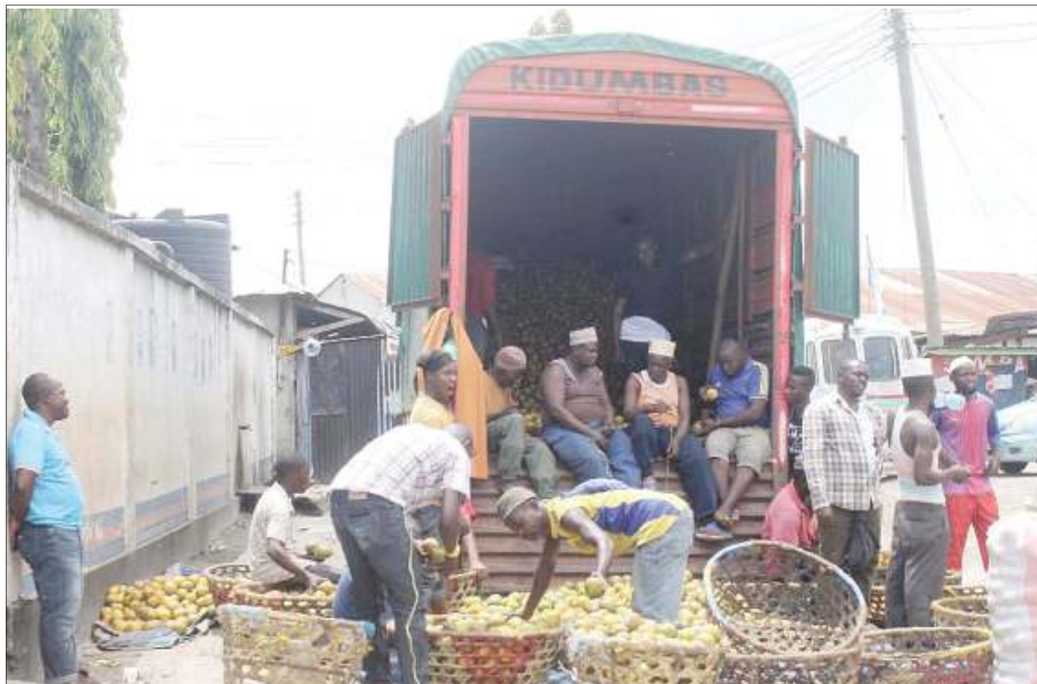
Wafanyabiashara katika Soko la Buguruni Dar es Salaam wakishusha machungwa kwenye gari kwa ajili ya kuwauzia wateja jana.

Alisema kutokana na kutokuwa na fedha za kukabiliana na changamoto za magonjwa hayo, serikali imekuwa ikitoa fedha kila baada ya muda fulani ili kuwatibu wagojwa hao wa ukoma kama ilivyo wagonjwa wengine.