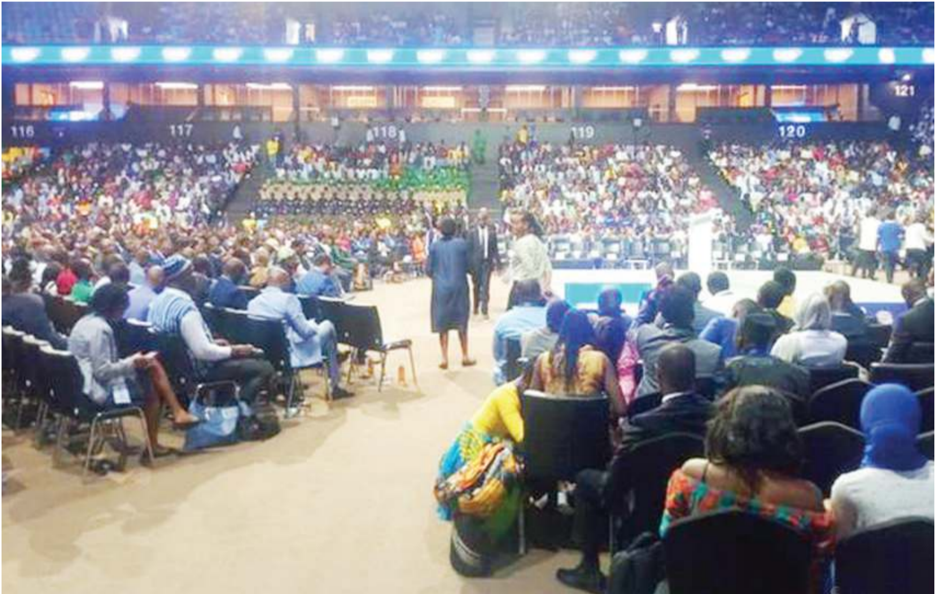
Baadhi ya vijana waliokutana kwenye Kongamano la siku tatu jijini Kigali nchini Rwanda.