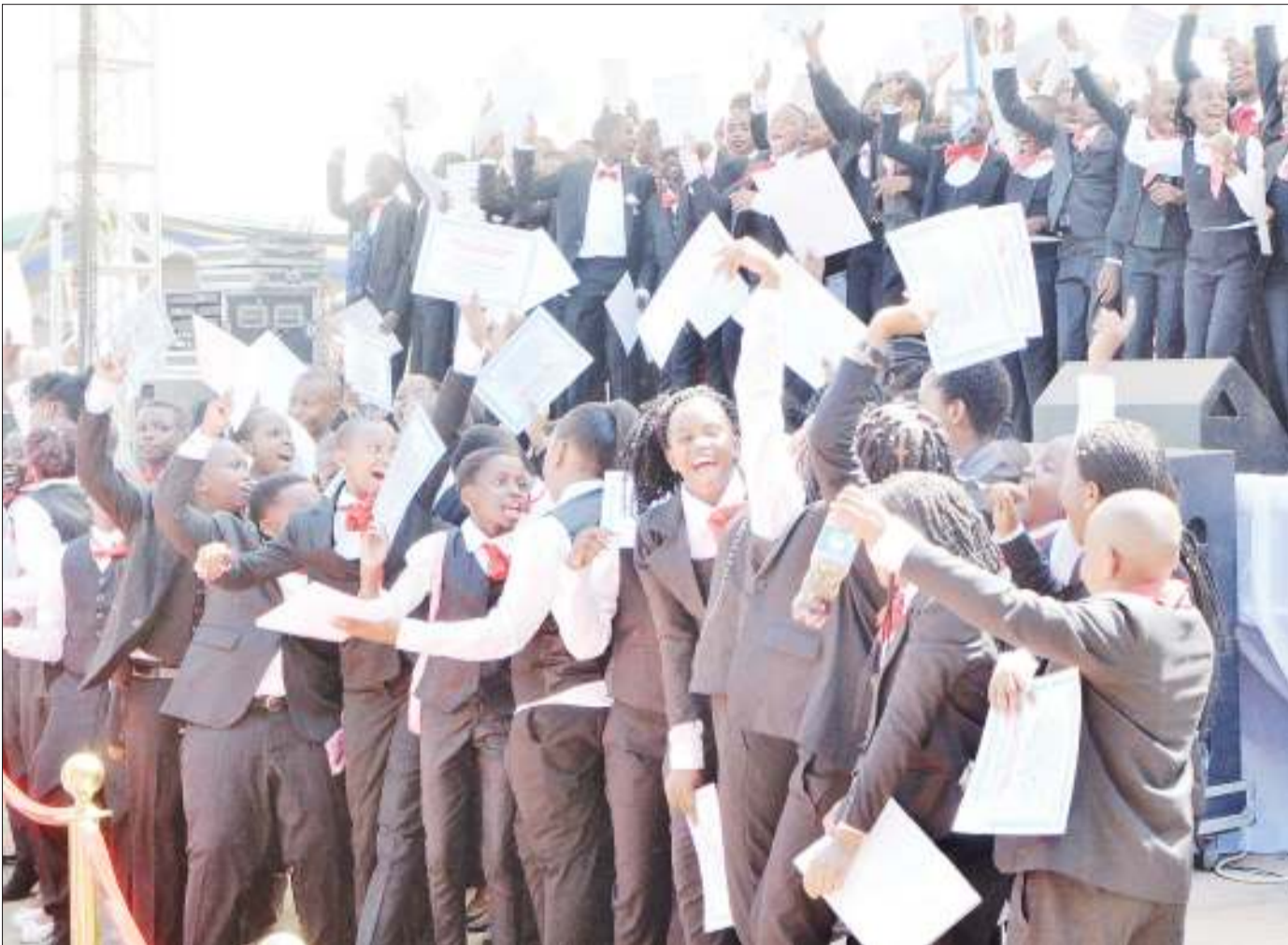
Wahitimu wa darasa la saba wakifurahi katika mahafali ya tisa ya Shule za Msingi za Atlas, yaliyofanyika mwishoni mwa wiki Madale, jijini Dar es Salaam.