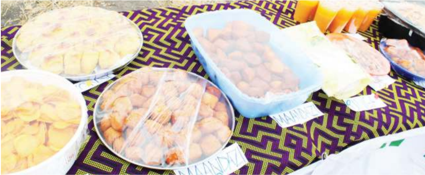
Baadhi vyakula vinavyoangukia katika kundi la lishe bora.

L ISHE bora ina umuhimu mkubwa sana kwenye maisha ya watu. Ulaji wa chakula chenye lishe bora inasaidia kuzuia utapiamlo wa aina zote.