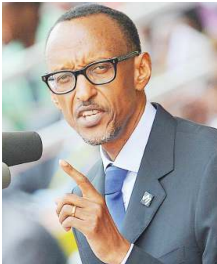
Rais Paul Kagame wa Rwanda.

Hatua ya kuanzia inaweza kuwa nyumbani, yaani kama nyumbani kwako ni Mali, Cape Verde, Cameroon na kadhalika, yaani pale ulipotoka wakati unakuja hapa.