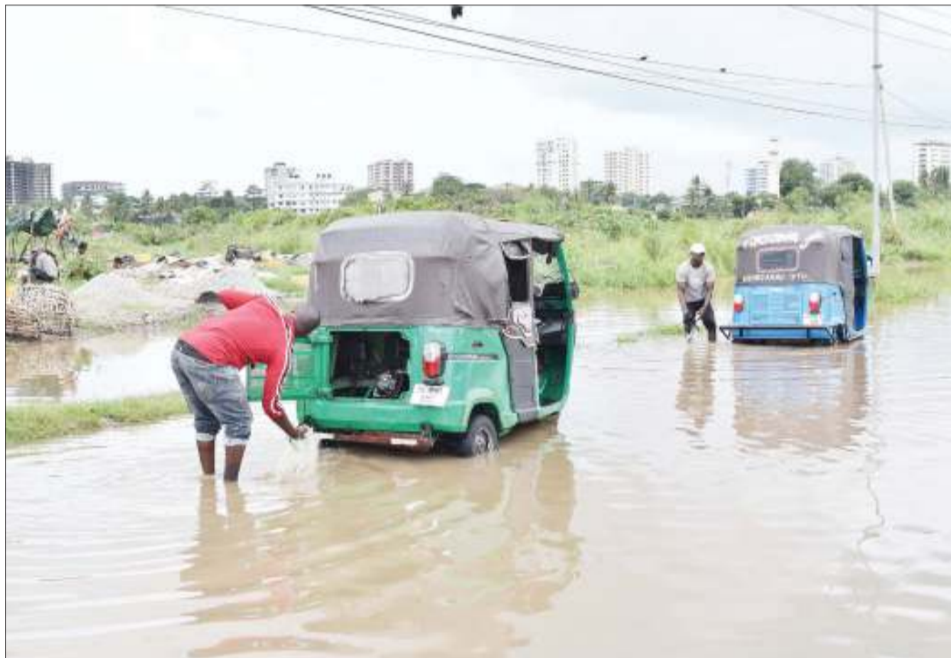
Madereva wa Bajaj wakiziosa kwa kutumia maji yaliyotumama katika eneo la Jangwani jana, kutokana na mvua zilizonyesha, jijini Dar es Salaam.