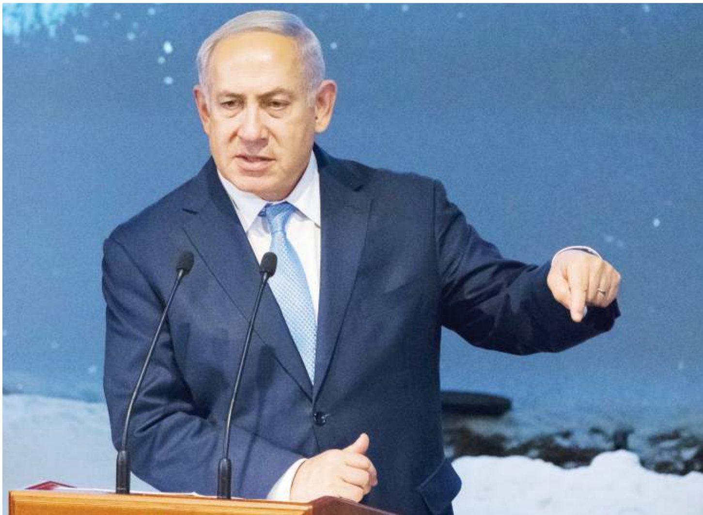
Waziri Mkuu wa Israel, Benjamin Netanyahu.