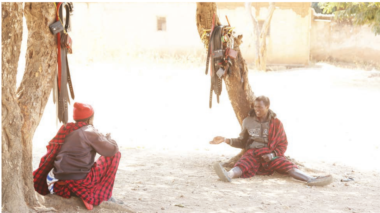
Wajasiriamali wa Kimasai wakiwa wamepumzika kwenye kivuli huku wametundika bidhaa zao kwenye mti katika Uwanja wa Shule ya Msingi Ma-kongorosi wilayani Chunya, juzi.

Aliwataka wakazi wa Kata ya Mwakibete pamoja na maeneo mengine yanayozunguka vyanzo vya maji kwenda kuchukua miti hiyo na kuipanda kwenye vyanzo hivyo.