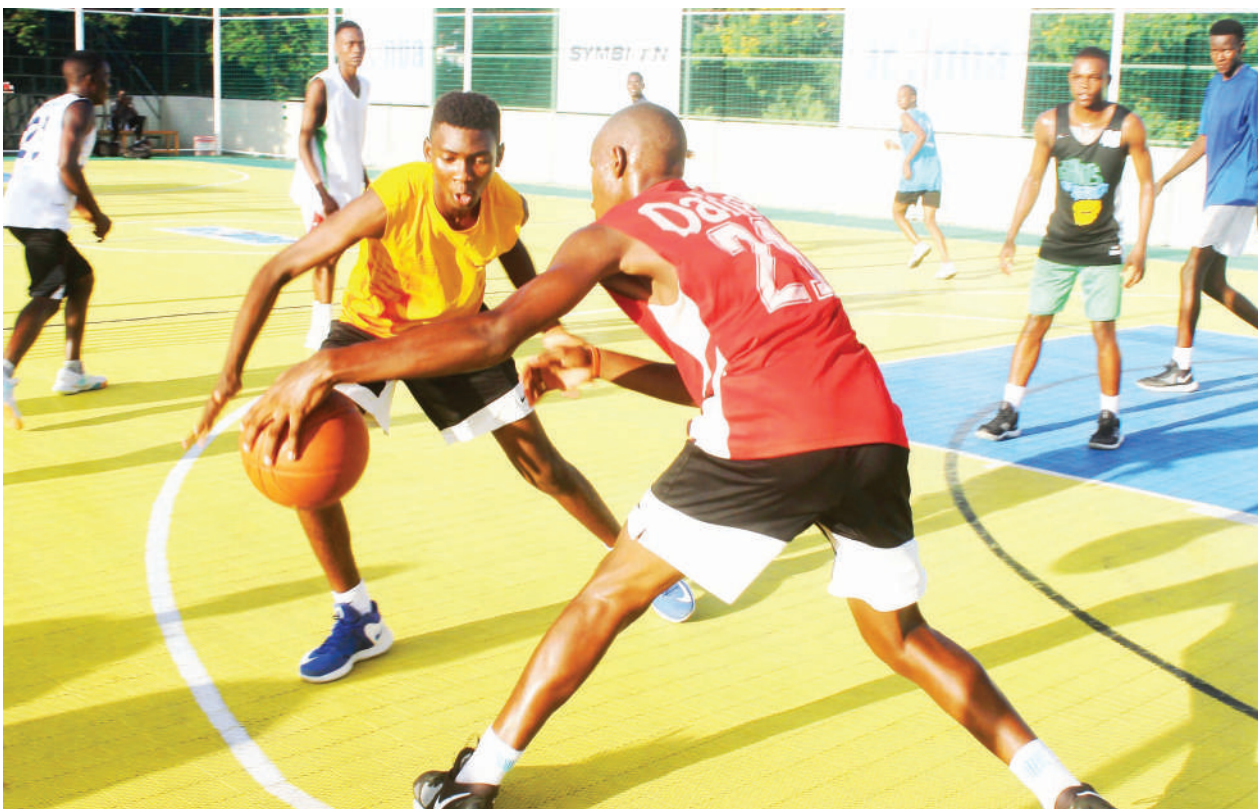
Wachezaji wa mpira wa kikapu wakifanya mazoezi katika viwanja vya Jakaya Kikwete jijini Dar es Salaam hivi karibuni. PICHA: JUMANNE JUMA

"Yanga tulichukua kikombe cha Ligi Kuu Bara mara tatu mfululizo, sio kama tulikuwa na kikosi hatari sana, lakini tulizoeana, mchezaji unajua ukipeleka mpira hapa, utamkuta mwenzako, huwezi kupata mafanikio haraka haraka," Niyonzima alisema.