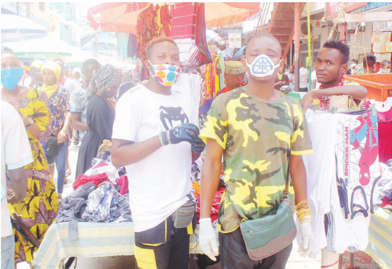
Wafanyabiashara ndogo maarufu 'Machinga' wakifanya biashara zao katika Mtaa wa Kongo jijini Dar es Salaam.