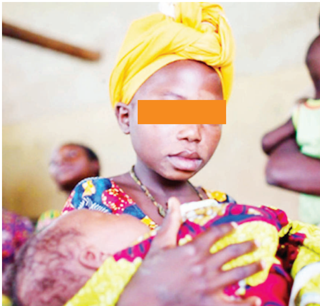
Mwanamama mwenye umri mdogo, akiwa na mtoto wake.