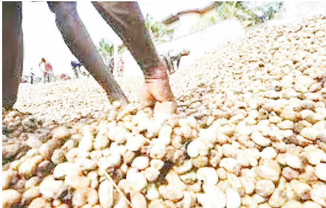
Korosho iliyokwishaandaliwa, inayoelezwa kuwa na manufaa zaidi kwa afya ya mlaji.

Kingine ni korosho inasaidia uwezo wa macho kuona, kama ilivyo kwa karoti. Inamiliki kirutubisho kisayansi kinachojulikana kama 'zea xanthin' ambacho