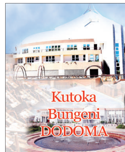
Habari zote na Augusta Njoji, DODOMA

"Wakati wa utekeleza kazi ya ununuzi, NFRA hulipa ushuru wa mazao (Produce Cess) kwa Mamlaka za Serikali za Mitaa kwa mujibu wa Sheria ya Fedha ya Serikali za Mitaa ya Mwaka 1982," ilisema.