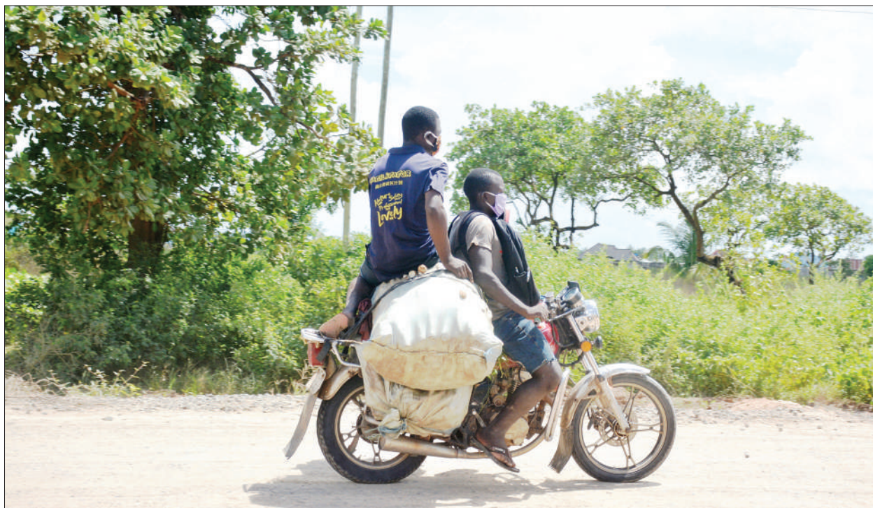
Mwendesha pikipiki akiwa amebeba viroba vya viazi vitamu huku akiwa amepakia na abiria katika eneo la Kitonga Dar es Salaam jana.

Aliwataka wafiwa wote wawe na moyo wa subira, uvumilivu na ustahimilivu katika kipindi hiki kigumu cha majonzi ya kuondokewa na mpendwa wao.