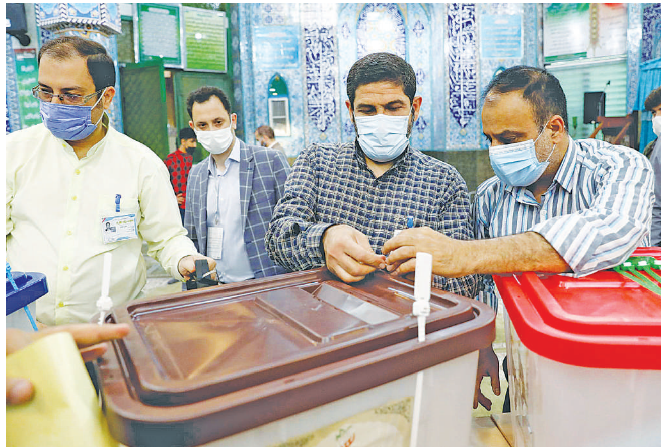
Maofisa wanaosimamia uchaguzi nchini Iran wakiendelea na maandalizi ya uchaguzi huo.

Kwa upande mwingine, shirika la kutetea haki za binadamu linalofadhiliwa na serikali ya Kenya lilisema lilikuwa limerekodi vifo 22 na majeruhi 300 likisema kwamba litaanzisha uchunguzi. RFI