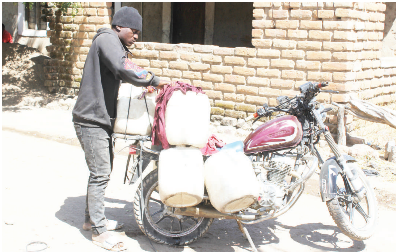
Mwendesha pikipiki akipakia madumu ya maji kwa ajili ya kwenda kuyauza ili kujipatia riziki, katika Kijiji cha Mjele, Halmashauri ya Wilaya ya Mbeya, mwishoni mwa wiki.

Alisema watazitimia pia mbinu walizojifunza kwenda kuwafundisha wakulima wa maeneo ya jirani na chuo hicho ili na wao waongeze tija kwenye uzalishaji.