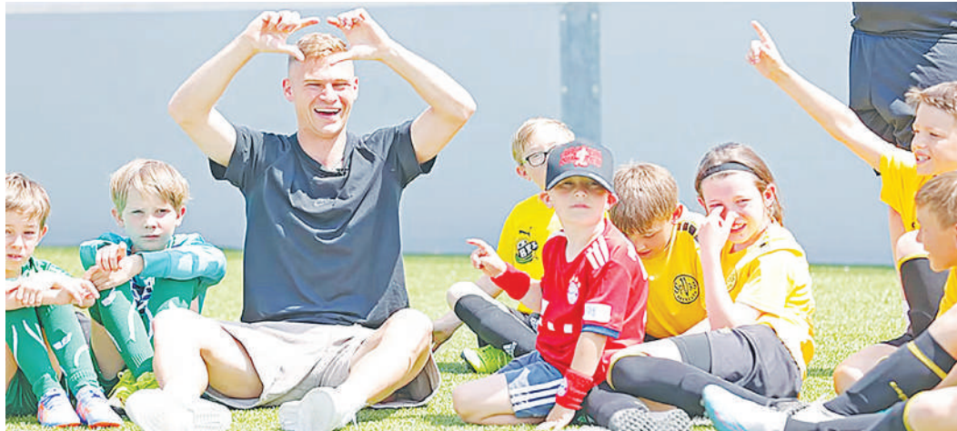
Nyota wa Bayern Munich, Joshua Kimmich, akiwa na watoto wenye ndoto za kufikia mafanikio yake katika soka.

Arsenal, Liverpool, City, Barcelona na Madrid basi zimetajwa kuwa klabu tano ambazo mchezaji huyo mwenye umri wa miaka 29, angefikiria kujiunga nazo.