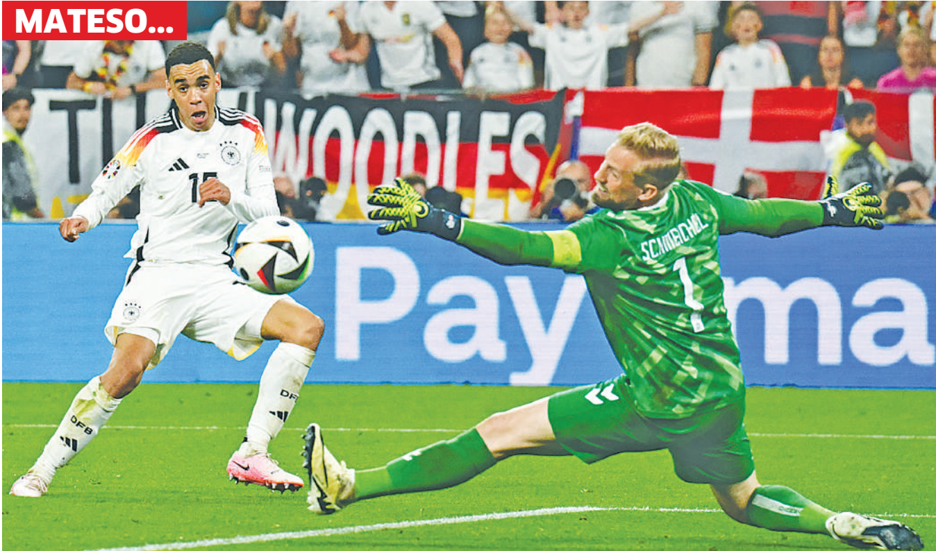
Kiungo mshambuliaji wa Ujerumani, Jamal Musiala, akiifungia timu yake bao la pili, huku kipa wa Denmark, Kasper Peter Schmeichel, akiteseka kuokoa bila mafanikio, kwenye mechi hiyo ya michuano ya Euro 2024 iliyopigwa Ujerumani juzi na wenyeji kushinda mabao 2-0.