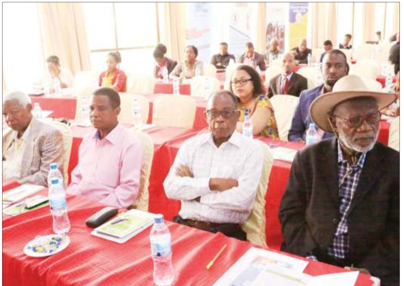
Baadhi ya wadau wa habari, wahariri na waandishi wa habari, wakiwa kwenye mkutano wa Maadhimisho ya Wiki ya Uhuru wa Habari, yaliyofanyika, jijini Dodoma jana.

Alibainisha mwaka wa fedha 1996/07 ukarabati wa miundombinu mbalimbali ya hospitali ulifanyika sambamba na ujenzi wa kliniki ya mama na mtoto. "Mwaka 2010, ulifanyika ujenzi wa jengo la huduma za Ukimwi (CTC), mwaka 2012, ulifanyika ujenzi wa jengo la wazazi na mwaka 2017, ulifanyika ujenzi wa jengo la mama ngojea," alisema.