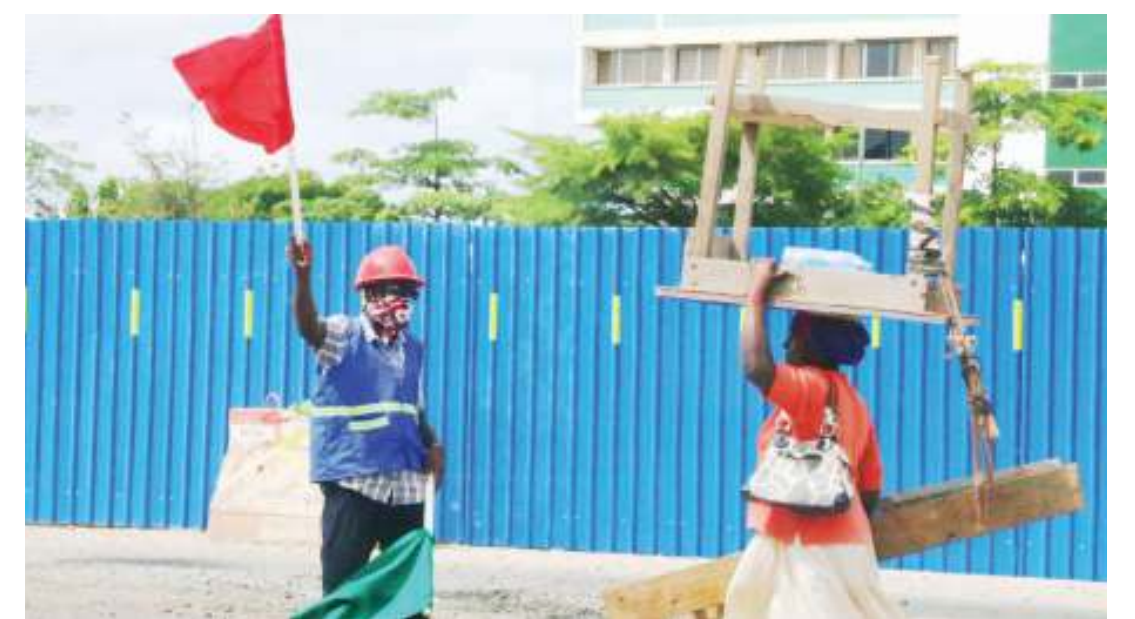
Mfanyabiashara ndogondogo akihama na meza yake kutafuta eneo la biashara Ubungo jijini Dar es Salaam jana.