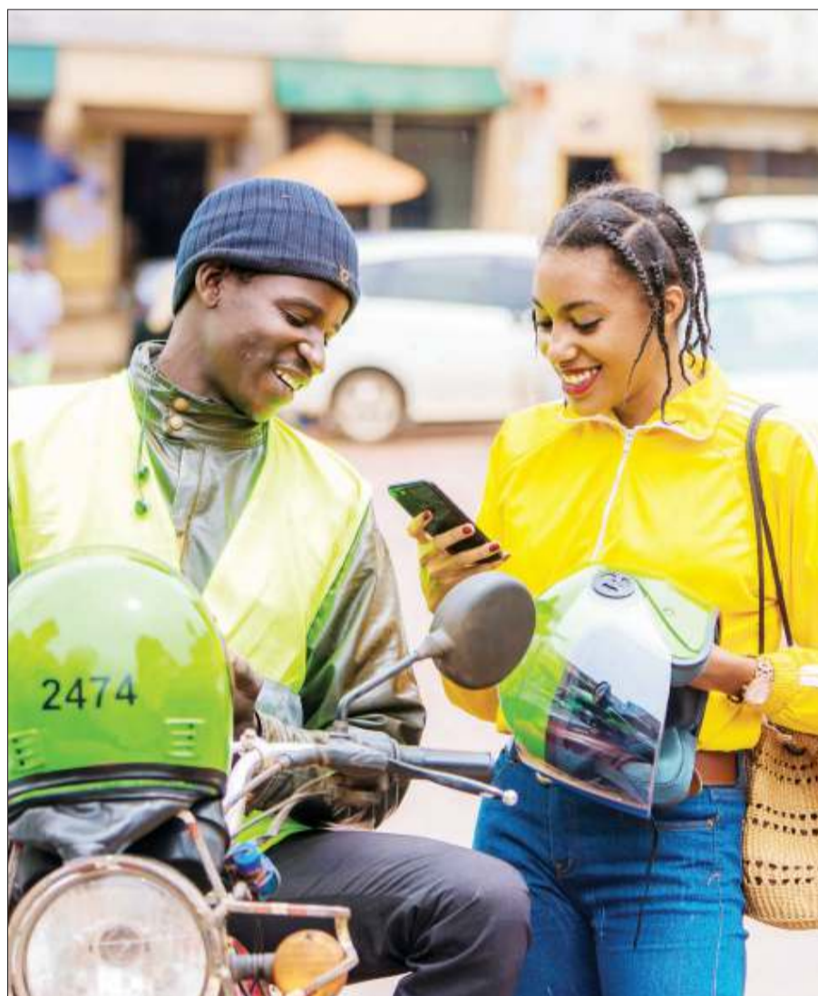
Mmoja wa abiria wanaotumia programu ya Bolt, akipata huduma kutoka kwa dereva bodaboda, baada ya kampuni ya Bolt kuzindua kitufe cha dharura (SOS), jijini Dar es Salaam jana, kwa lengo la kuimarisha usalama wa madereva wanapokutana na hatari.

Kaizilege alisema hali hiyo ya kutokujali uhalifu dhidi ya waandishi wa habari ni tishio linaloathiri jamii zote kukosa haki yao ya kupata habari.