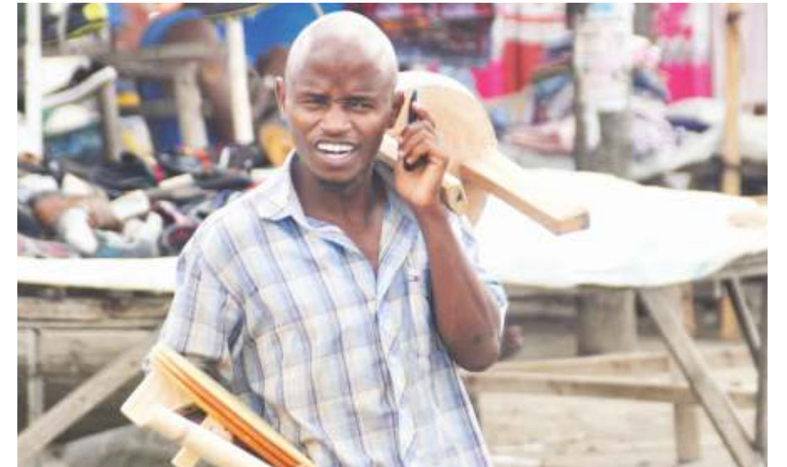
Machinga akiwasiliana kwa simu wakati akisaka wateja wa bidhaa zake, katika eneo la Mwenge, Manispaa ya Kinondoni, jijini Dar es Salaam jana.