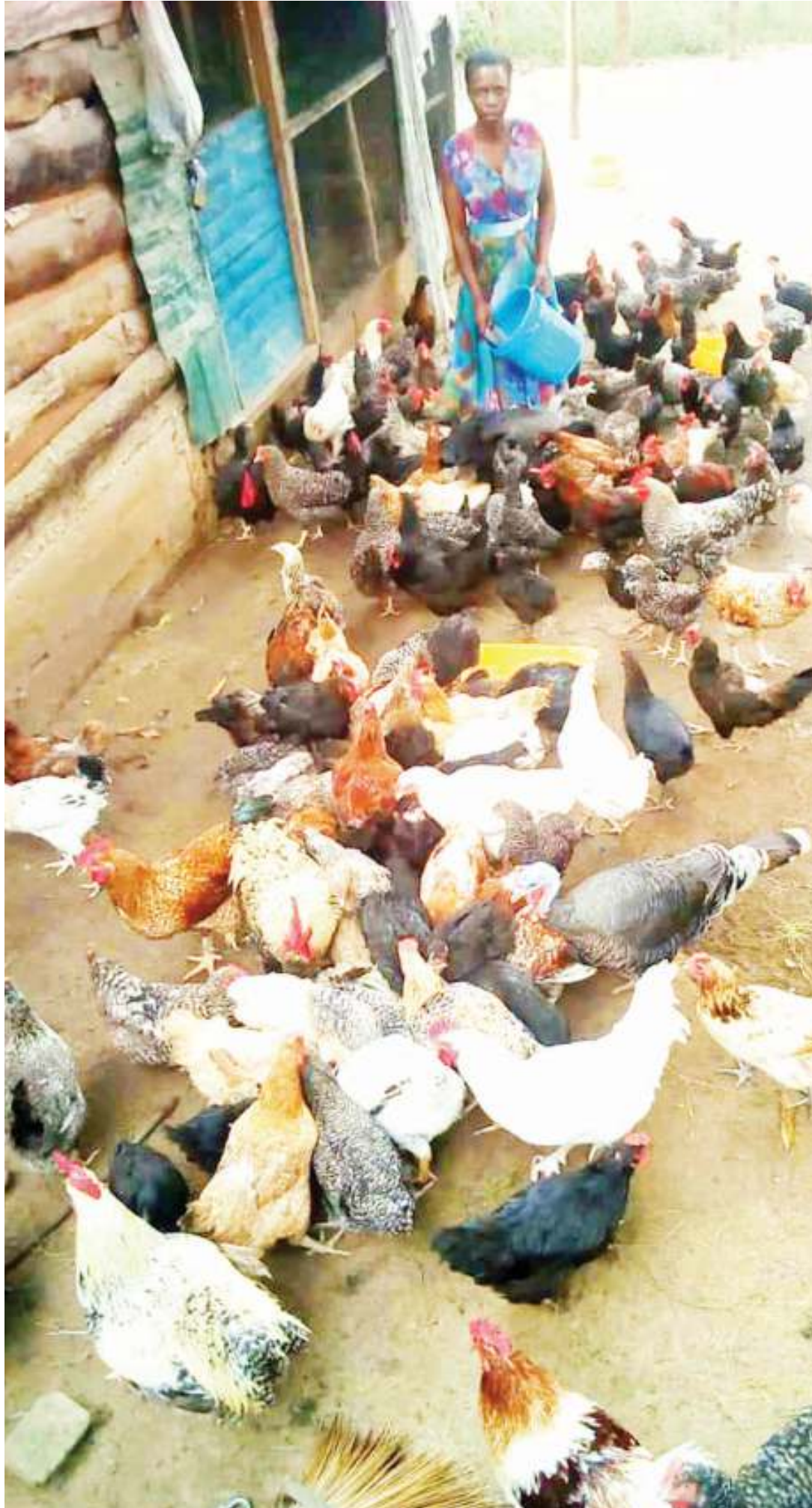
Jesca akihudumia kuku wake nje ya banda.

SWALI: Shughuli yoyote hai-kosi changamoto. Kwako hili likoje. Je, unaweza kuniambia hali halisi ya changamoto unazokabiliana nazo katika mae-