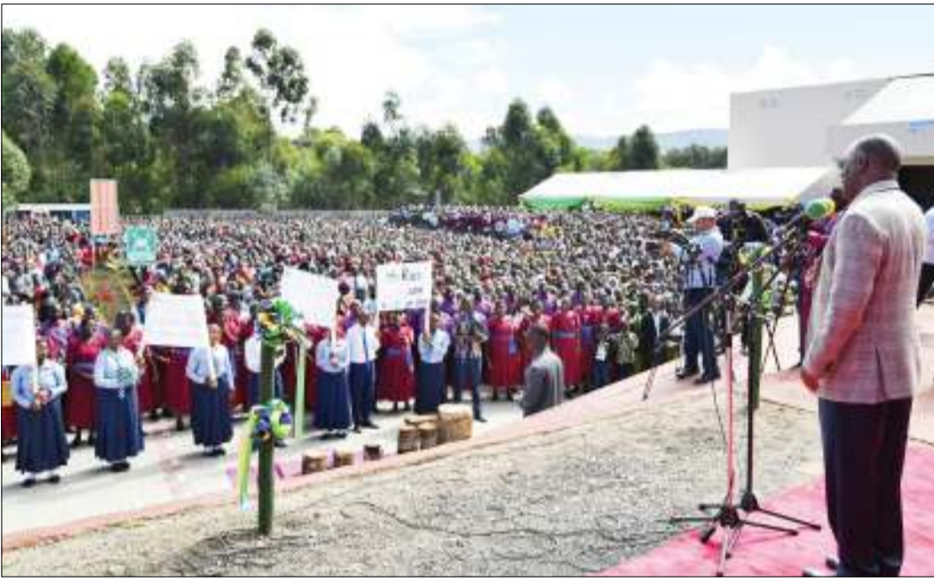
Rais Dk. John Magufuli, akizungumza na wananchi baada ya kuzindua Hospitali ya UWATA, jijini Mbeya jana.