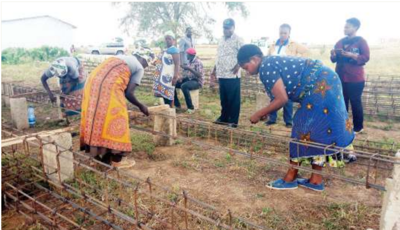
Baadhi ya wanawake wa Kata ya Inyala, wilayani Mbeya, wakisaidiana kusuka nondo kwa ajili ya ujenzi unaoendelea wa Hospitali ya Wilaya hiyo, jana.

"Nimeingia hasara kubwa sana, maana shughuli zangu zilikuwama kwa zaidi ya wiki tatu, kuna baadhi ya magari niliyokuwa nimekodi na niliendelea kuyalipia pamoja na madereva wake... kwa sasa namshukuru Mungu nimesharekebisha kasoro zilizokuwapo na nimefunguliwa," alisema Mdimi.