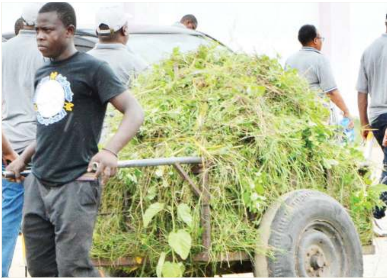
Kijana akitoka kukata majani kwaajili ya kulisha mifugo, katika eneo la Uwanja wa Taifa, Manispaa ya Temeke, jijini Dar es Salaam jana.

Kwa upande wake muathirika aliyeunguliwa na nyumba yake na kupoteza fedha taslimu zaidi ya Sh. milioni 20 amekishukuru Chama cha Ushirika Uru Kaskazini, kupitia mradi wa pamoja kwa kumsaidia mabati 20.