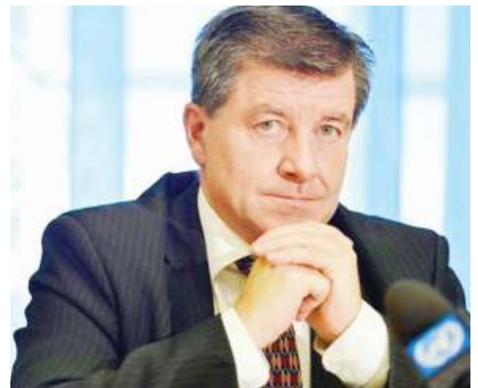
Mkurugenzi Mkuu wa Shirika la Kazi Duniani (ILO), Guy Ryder.