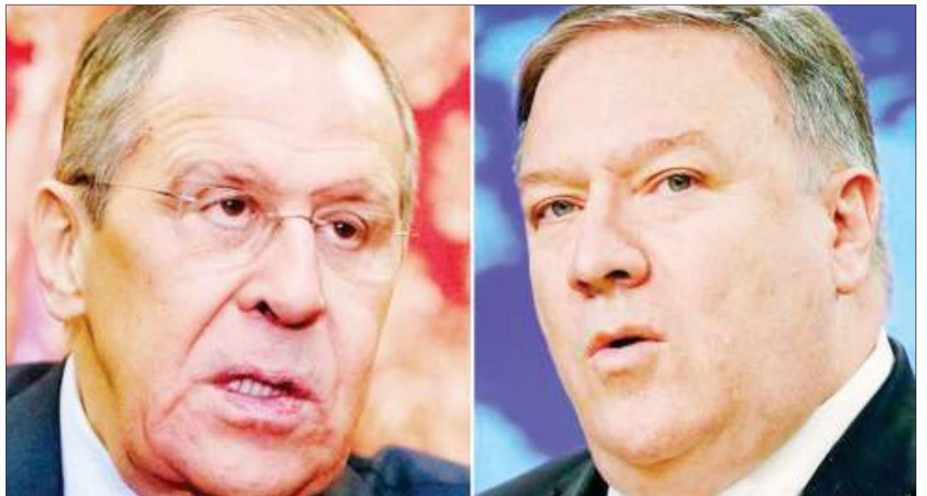
Waziri wa Mambo ya Nje wa Urusi (kushoto), Sergei Lavrov na Mike Pompeo wa Marekani.

Mfalme aliyetangulia, Bhumibol Adulyadej, alitawala kwa miaka 70 na kuwa mfalme pekee aliyetawala kwa muda mrefu zaidi duniani, alifariki dunia mwaka 2016. BBC