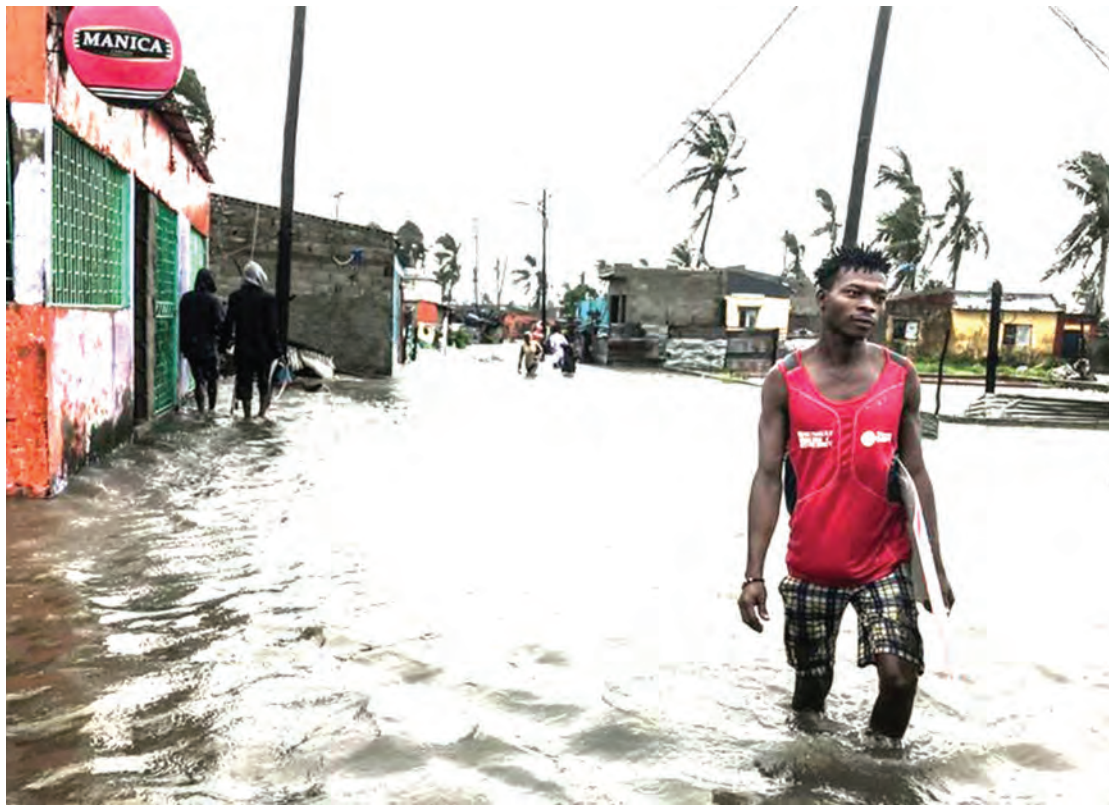
Eneo lililoathiriwa na kimbunga, nchini Msumbiji.