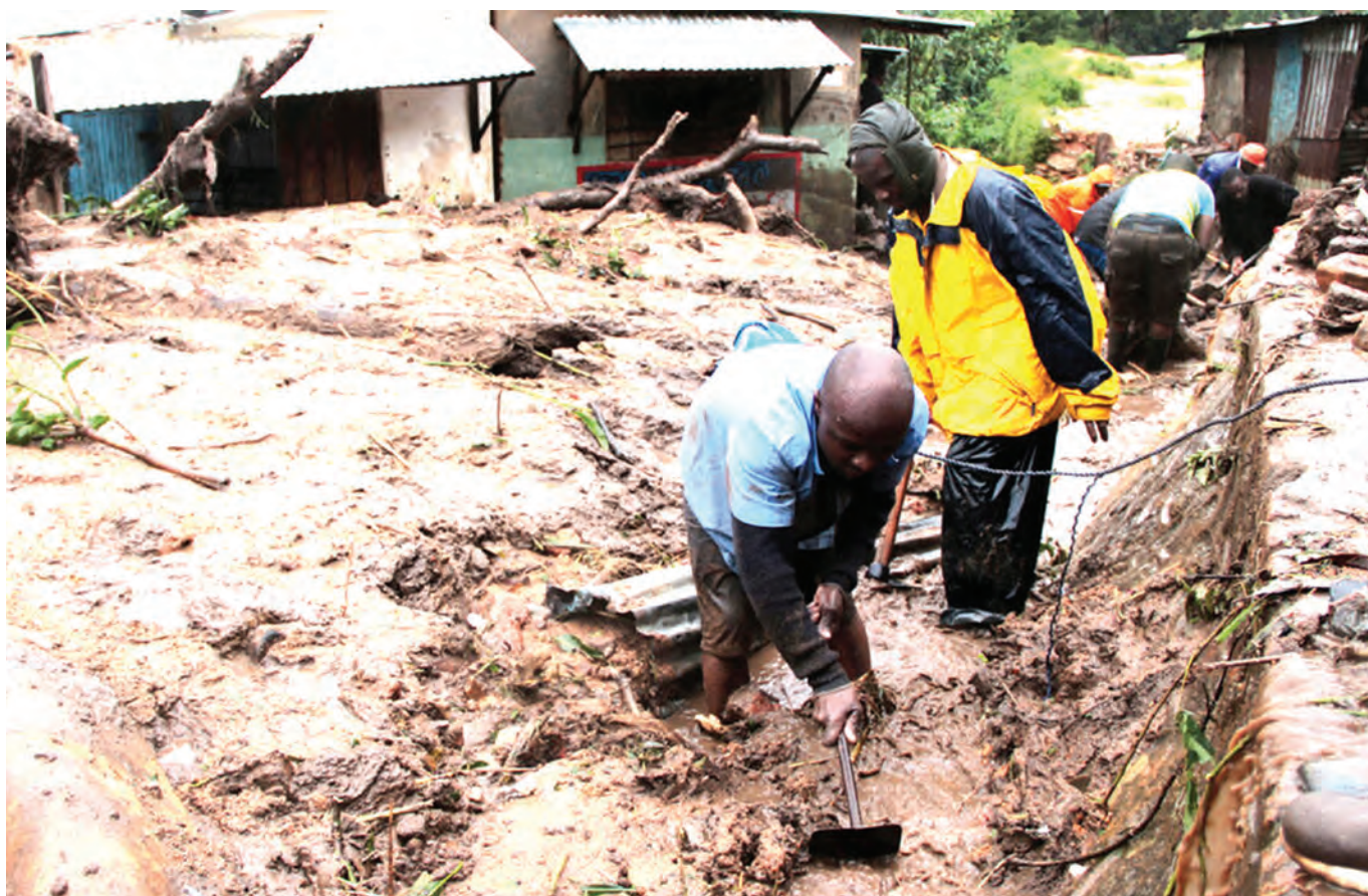
Baadhi ya raia wakitaifuta watu walionusurika katika dhoruba iliyosababishwa na kimbunga Freddy kilichopiga jiji la Blantyre nchini Malawi juzi.