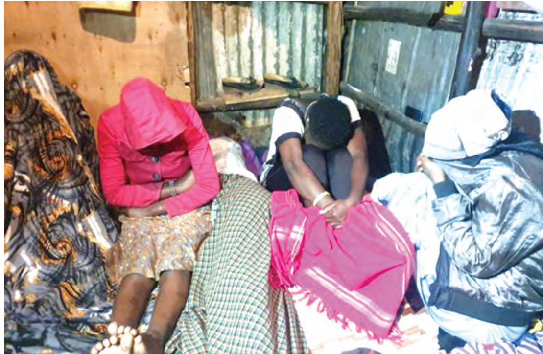
Wahamiaji haramu waliokuwa wakisifarishwa kiharamu, chini ya ulinzi.

Pia, anaelekeza pongezi kwa vyombo vya usimamizi wa sheria, Idara ya Ustawi wa Jamii, taasisi katika sekta ya sheria, mashirika yasiyo ya kiserikali na wabia wen-