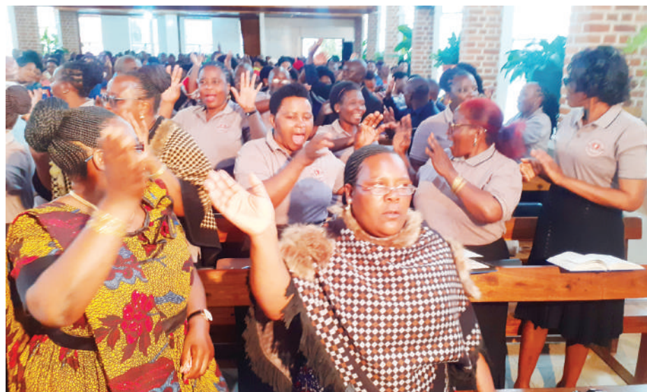
Baadhi ya waumini wa Kanisa la Kiinjili la Kilutheri Tanzania (KKKT) Usharika wa Kanisa Kuu Iringa, wakisalimiana kwa kupungiana mikono wakati wa mkesha wa Krismasi juzi usiku.