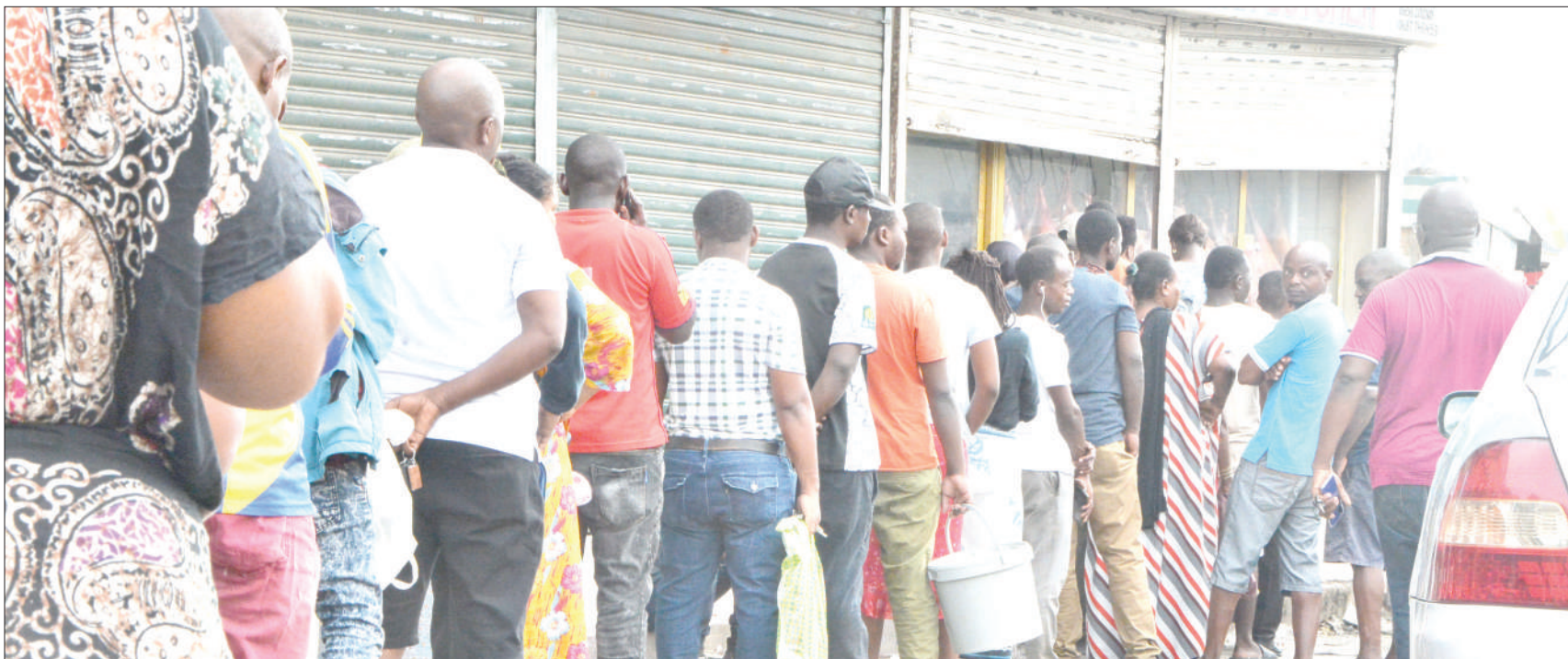
Wakazi wa jijini Dar es Salaam wakiwa wame-panga foleni ya kununua nyama kwa ajili ya sikukuu ya Krismasi katika eneo la Ubungo.