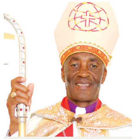
Askofu Masangwa "Tuzalisha na kutumia bidhaa za ndani"