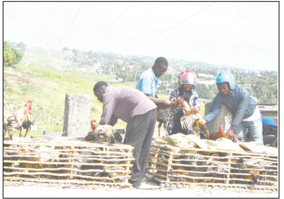
Wateja wakichagua kuku kwa ajili ya kitoweo cha sikukuu ya Krismasi katika eneo la Kimara Mwisho, jijini Dar es Salaam jana, kuku mmoja aliuzwa kwa Sh. 25,000.