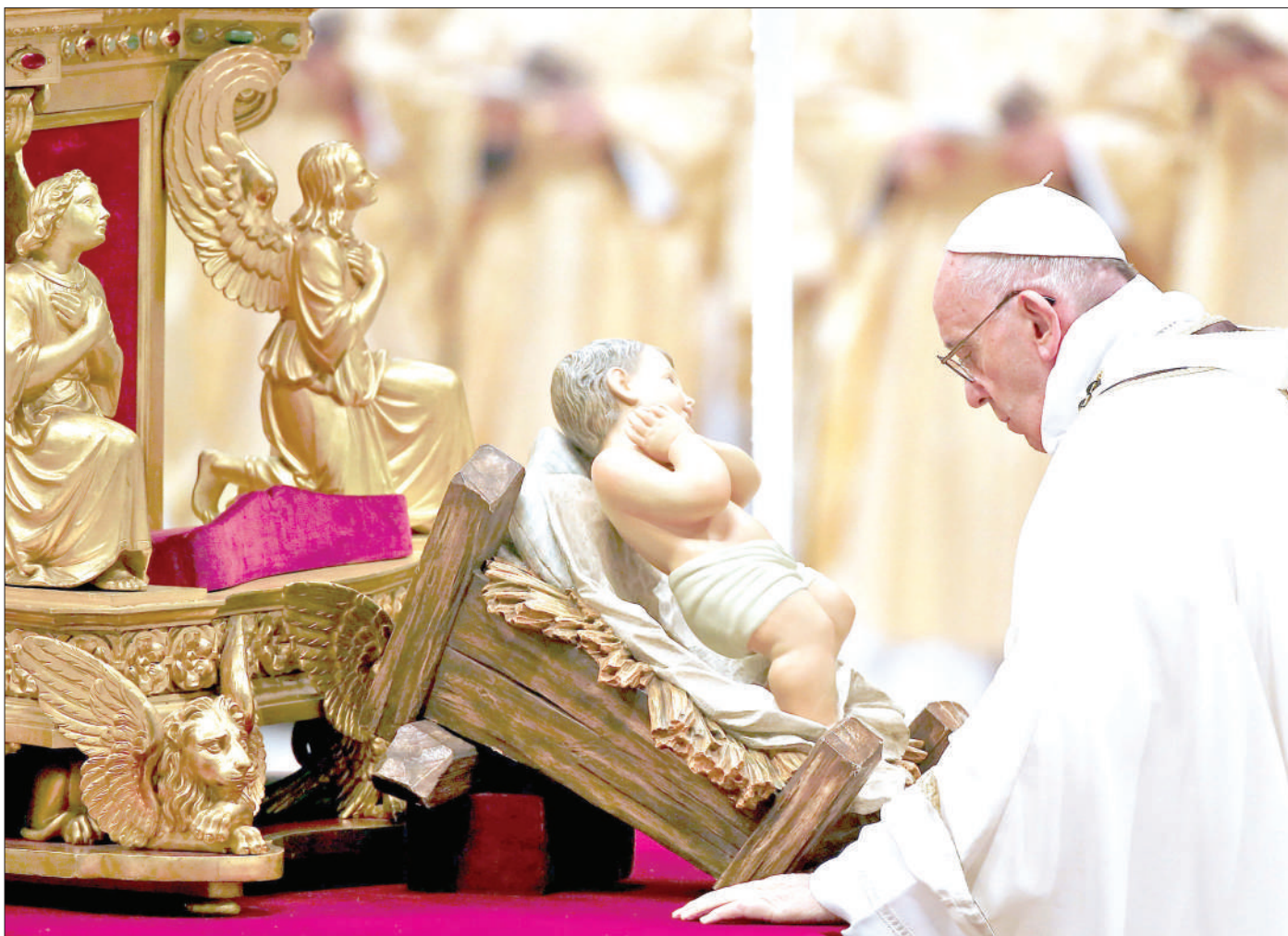
Kiongozi wa Kanisa Katoliki Duniani, Papa Francis, aliongoza mkesha wa sikukuu ya Krismasi katika Kanisa la St. Peter's Basilica, mjini Vatican, jana.