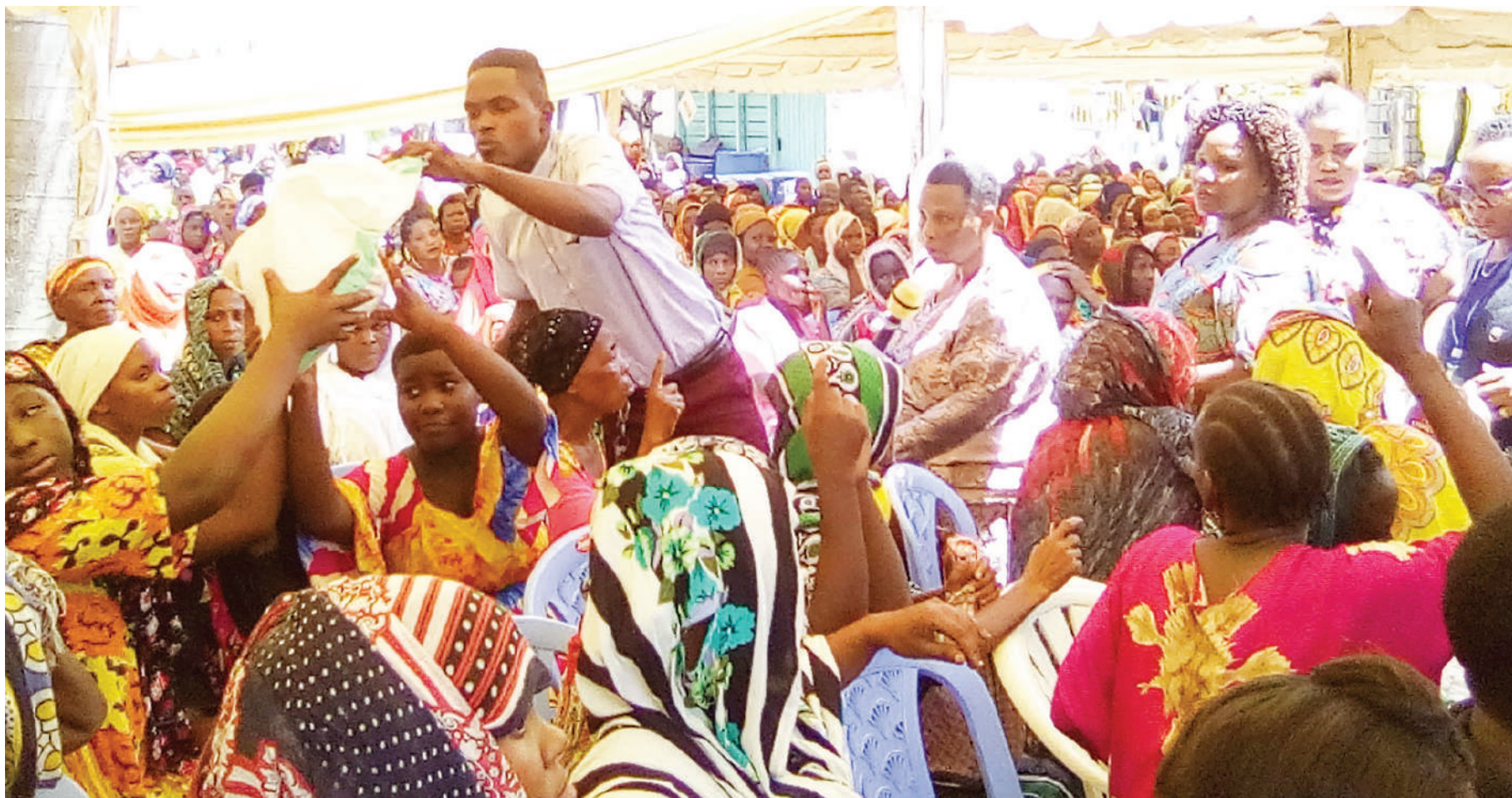
Viongozi wa Kanisa la Glory Temple Tanga, wakigawa zawadi kwa watu wenye mahitaji maalumu, wakiwauzua wazee, wajane na waathiriwa wa dawa za kulevya kanisani hapo, ikiwa ni sehemu ya kusherehekea sikukuu ya Krismasi jana.