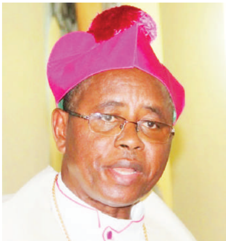
Askofu Shao "Hatua ya wapinzani imeleta amani Zanzibar".