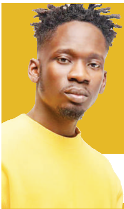
MR EAZI YAMEMKUTA HUKO GHANA Ukurasa 14