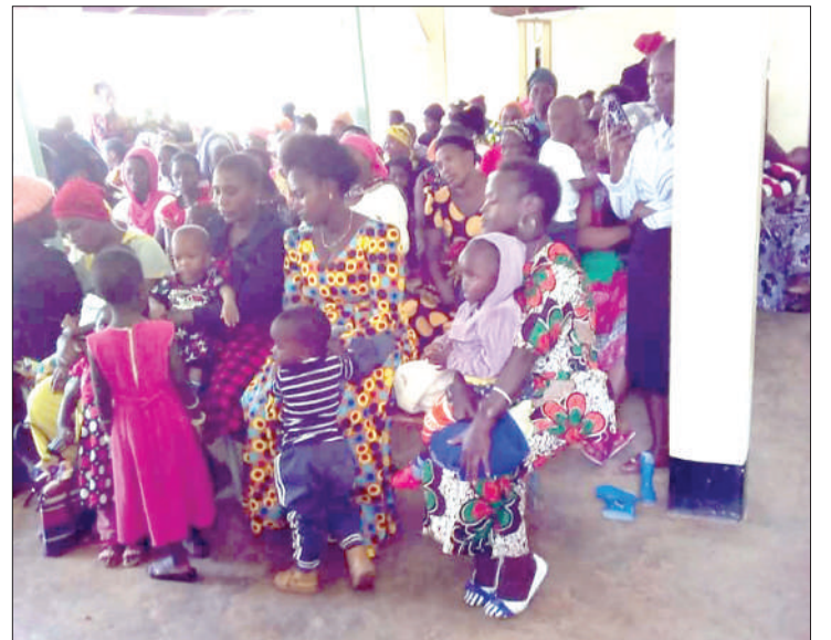
Baadhi wa watoto wakipatiwa chanjo.

Katika Manispaa ya Bukoba, kuna zaidi ya Sh. milioni 14.7 zilizotengwa kuratibu masuala mbalimbali ya chanjo katika Manispaa ya Bukoba, katika mwaka wa fedha 2019/2020.