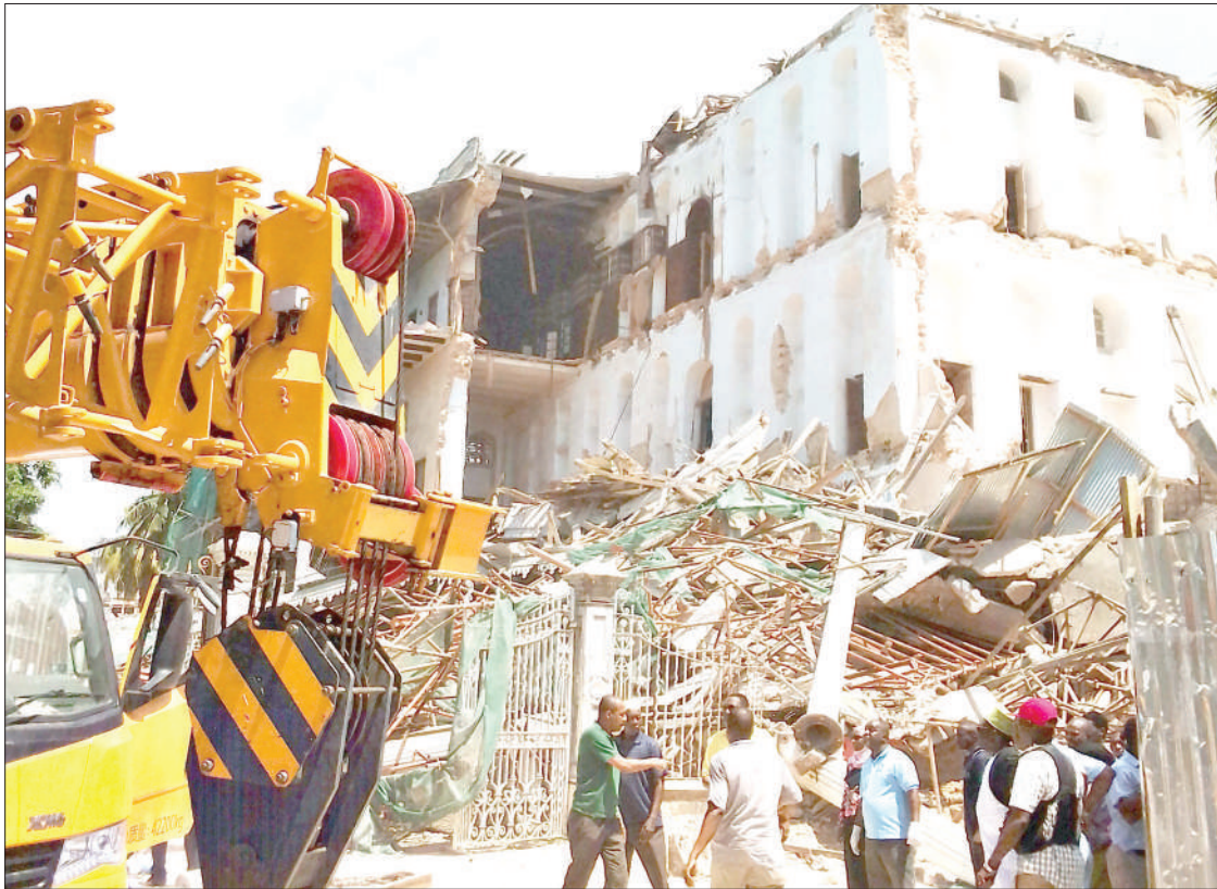
Jumba la kihistoria la Beitel a Jaib lililoko Mjim-kongwe limeanguka jana. Linasadikiwa kuuwa watu waliokuwa wakilifanyia ukarabati.