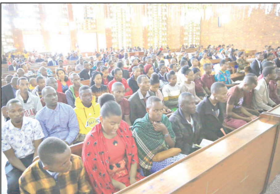
Baadhi ya waumini ya dini ya Kikristo Kanisa la Kiinjili la Kiluther Tanzania (KKKT), Usharika wa Dodoma Mjini, wakishiriki ibada ya sikukuu ya Krismasi ambayo ilifanyika jana.