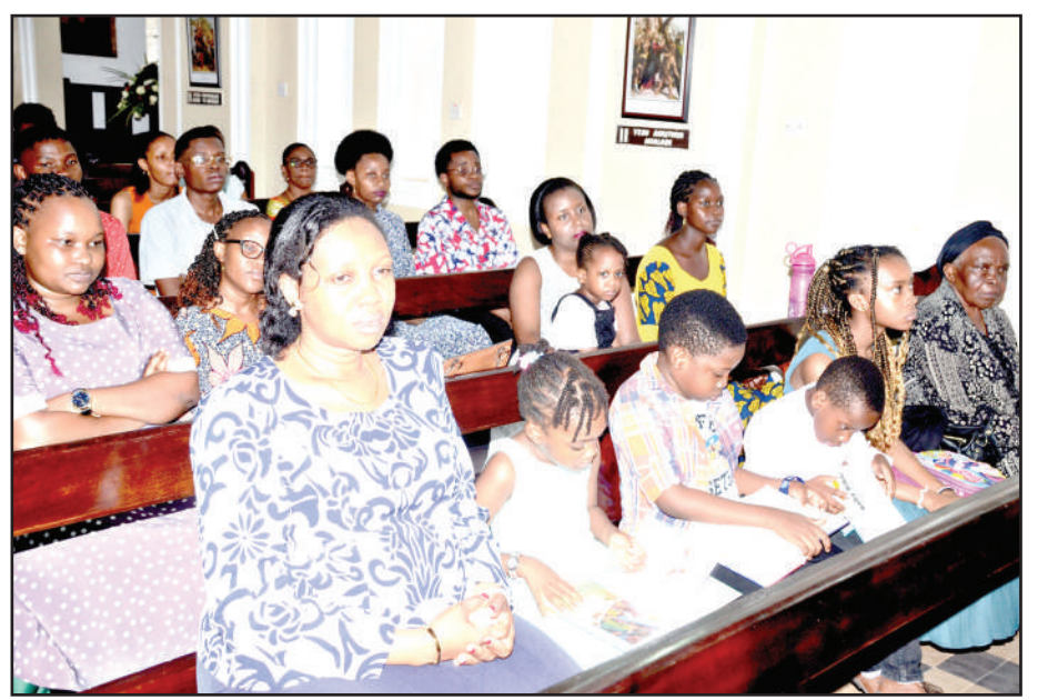
Waumini wa Kanisa la Mtakatifu Alban's, wakiwa kanisani katika ibada ya sikukuu ya Krismasi, jijini Dar es Salaam jana.