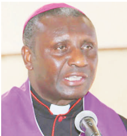
Askofu Sangu "Watanzania tusiichezee amani"