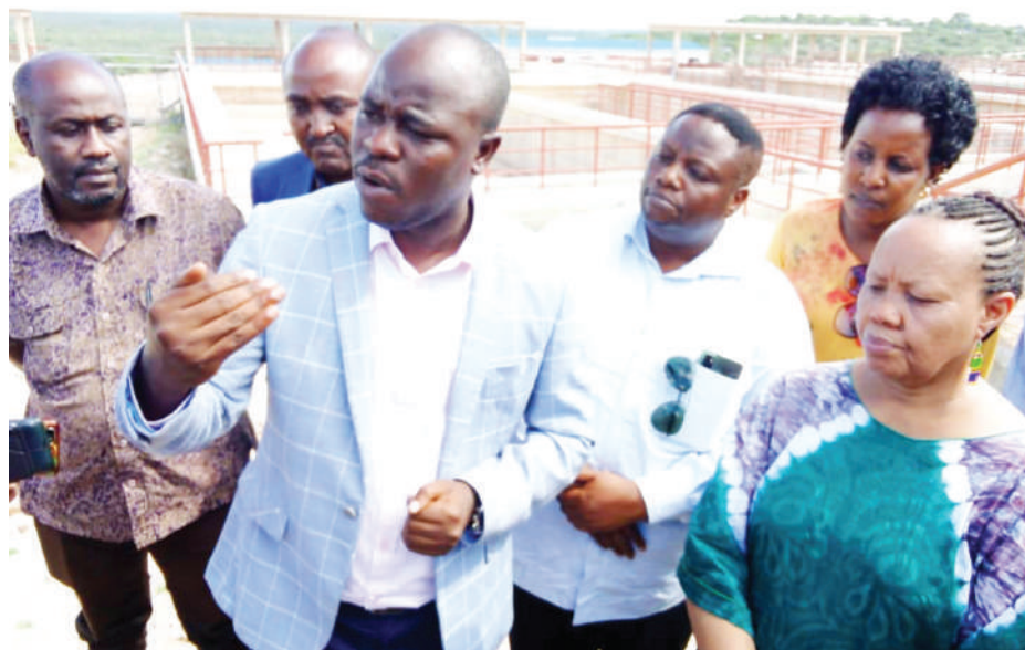
Waziri wa Maji, Jumaa Aweso, akifafanua jambo jana, alipokuwa ziarani Wilaya ya Mwanga mkoani Kilimanjaro, kukagua mradi mkubwa wa maji utakaohudumia Wilaya za Mwanga, Same na Korogwe. Aweso amemsimamisha kazi mkandarasi M.A Kharafi & Sons anayetokeza mradi huo kutokana na kushindwa kukamilisha kazi hiyo.