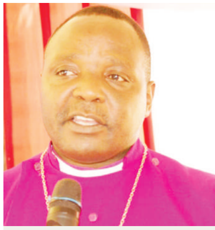
Askofu Sehaba "Malalamiko ya uchaguzi yafanyiwe kazi"