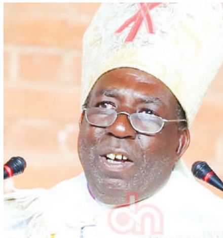
Askofu Kinyuny "Mungu ametukinga na corona"