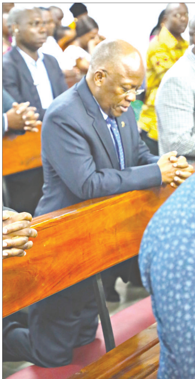
Rais Dk. John Magufuli akishiriki Misa Takatifu ya Krismasi katika Kanisa la Bikira Maria Imakulata, Ikulu Chamwino, mkoani Dodoma jana.