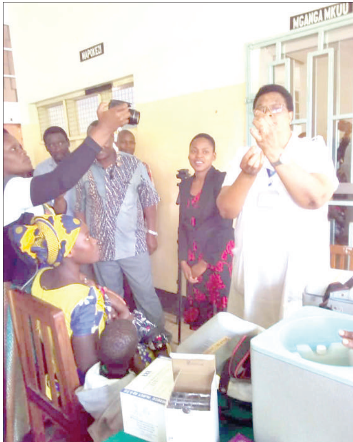
Baadhi ya kinamama wakiwa kliniki katika Kituo cha Afya Rwamishe-nye, katika Manispaa ya Bukoba, wakisubiri watoto wao wapatiwe chanjo.

mahudhurio ya wananchi hayakuwa mazuri, maana wengine walikimbia mji na kwenda vijijini, haifahamiki kama huko walikowenda waliwapeleka watoto wao kupata chanjo au la” anasema.