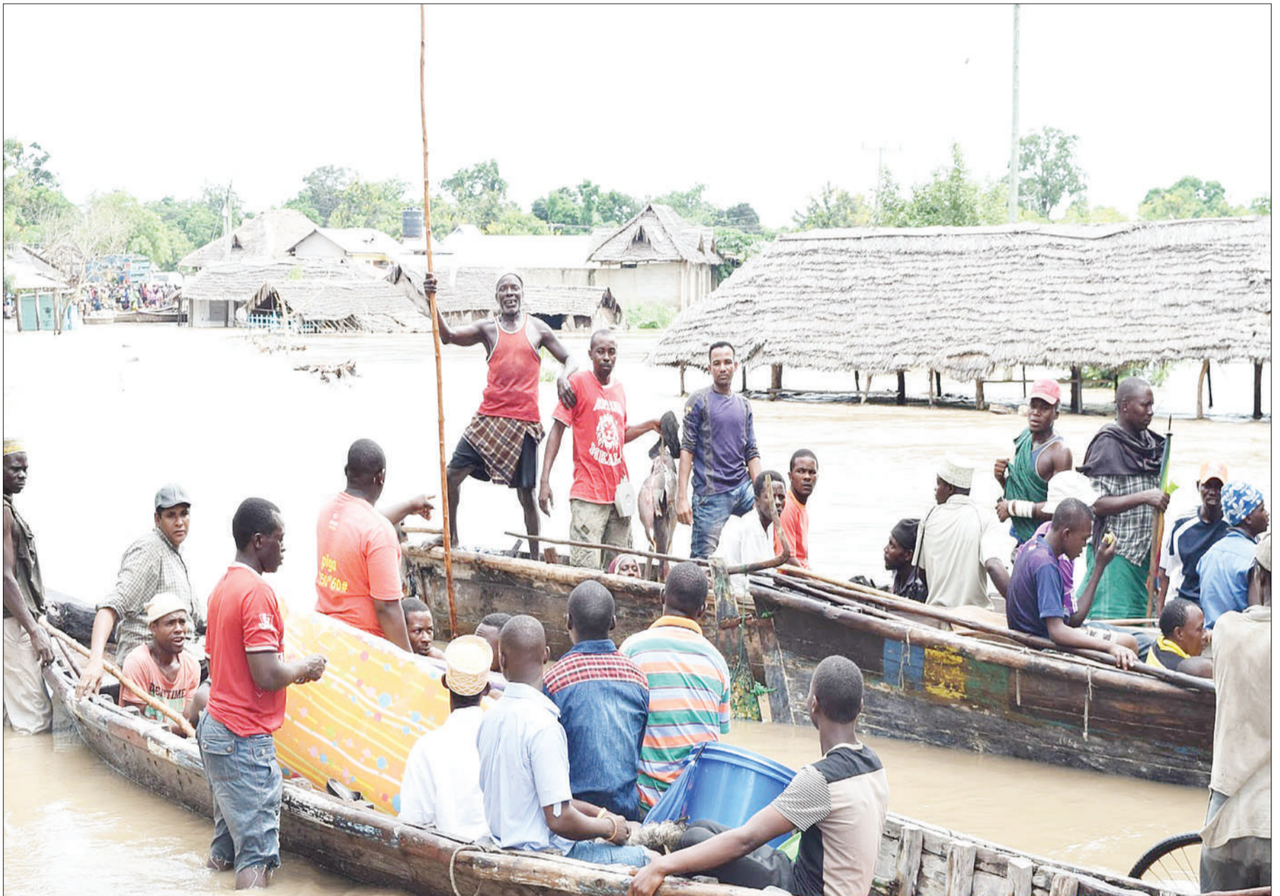
Mitumbwi ikitumika kuwaokoa watu waliozingirwa na maji wilayani Rufiji.