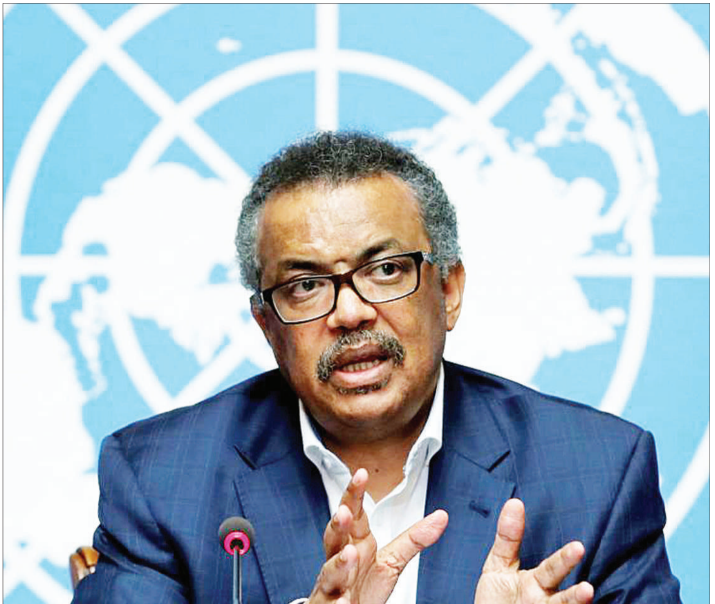
Mkurugenzi wa Shirika la Afya Ulimwengini (WHO) Tedros Adhanom Ghebreyesus

Marekani imekuwa mfadhili mkubwa wa WHO kwa kutoa mchango wa miaka miwili wa dola milioni 893, tayari imetoa dola