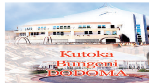
Na Augusta Njoji, DODOMA

Aidha, kwa mujibu wa Sheria ya zamani ya barabara (The Highway Ordinance Cap. 167) ya mwaka 1932, Barabara Kuu ya Kaskazini inapita katika maeneo hayo.