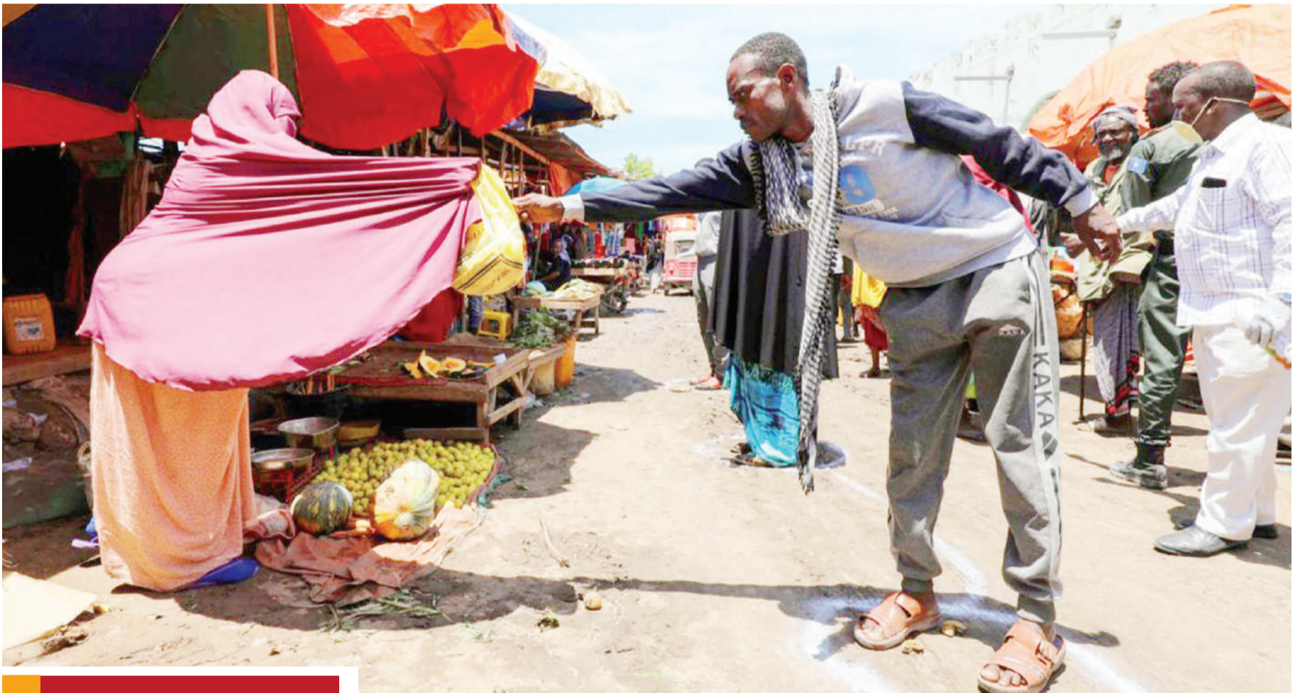
Mwanamke mfanyabiashara wa matunda nchini Somalia, akimuuzia mteja wake kwa kufuata masharti ya afya ya kukaa mita mbili na mteja wake katika kujikinga na virusi vya Covid-19.

Wakati huo huo, Kenya imepokea vifaa 40,000 vya kupimia, ikiwa ni katika harakati ya kuimarisha uwezo wa kupima watu haraka kwa lengo la kupima, kutengwa kwa walioathirika na kutibu.