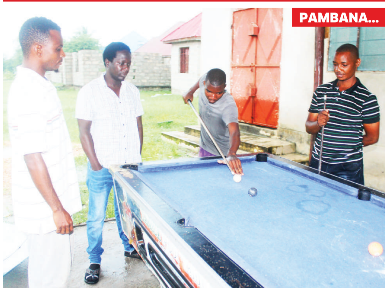
Vijana wakicheza mchezo wa pool katika eneo la Kitunda, Kivule jijini Dar es Salaam jana.

Kocha huyo ambaye mkataba wake unatarajiwa kumalizika mwishoni mwa msimu huu, aliweka wazi mipango yake ni kuhakikisha Namungo inaendelea kutoa ushindani katika kila mechi wanayocheza.