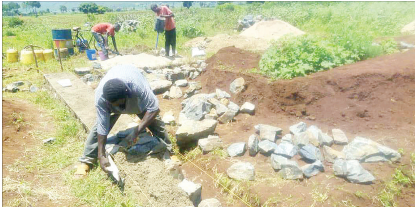
Mafundi wakiandaa msingi kwa ajili ya ujenzi wa Seko Sekondari, iliyopo Kata ya Nyamrandirira Musoma Vijijini mkoani Mara juzi, ambayo inajengwa na serikali huku wananchi wakichangia fedha na nguvu kazi.

Yusuph na wenzake watano wanakabiliwa na mashtaka manne, ikiwamo kujihusisha na biashara haramu ya meno ya tembo yenye thamani ya Sh. milioni 785.