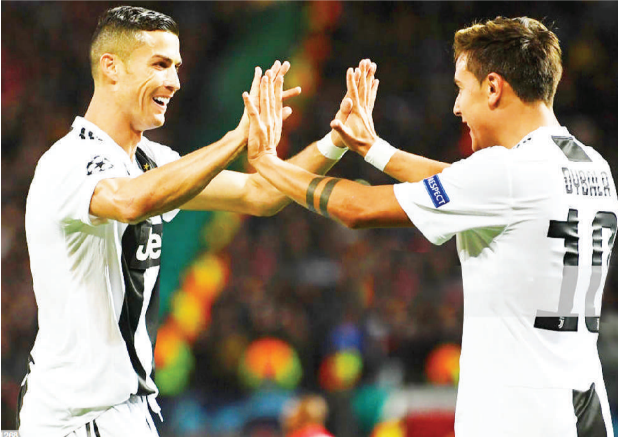
Washambuliaji wa Juventus, Cristiano Ronaldo (kushoto) na Paul Dybala, wakishangilia bao katika mechi mojawapo ya Serie A msimu huu.