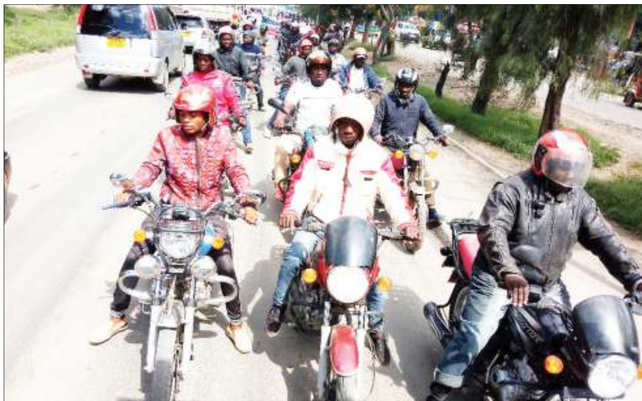
Baadhi ya vijana waendesha pikipiki maarufu kwa jina la Boda boda wa Jiji la Mbeya wakiongoza maandamano wakati wa maa-dhimisho ya siku ya Kifua Kikuu mkoani Mbeya ambayo yalifanyika katika Kituo cha Daladala cha Kabwe.