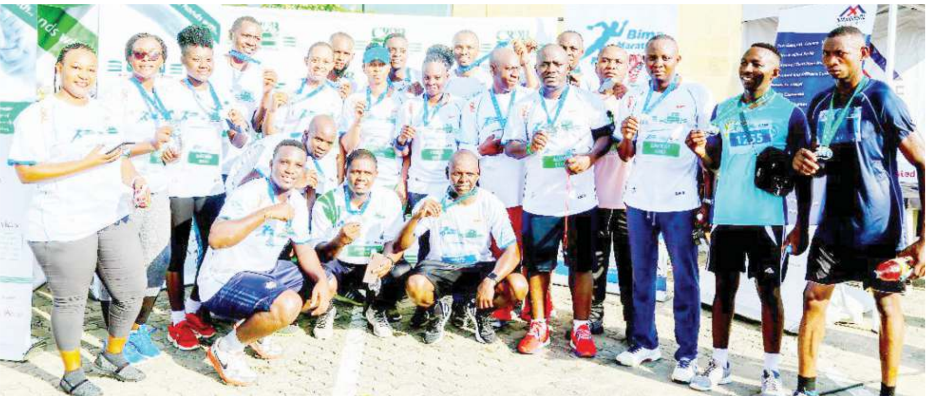
Baadhi ya wafanyakazi wa Benki ya CRDB na Kampuni tanzu ya Bima ya CRDB, wakionyesha medali zao baada ya kumaliza mashindano ya mbio ya CRDB Bima Marathon yaliyofanyika mwishoni mwa wiki jijini Dar es Salaam.