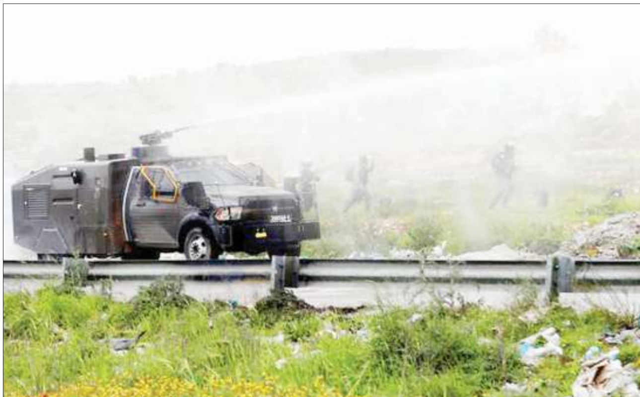
Jeshi la Israel likitumia maji kuwatawanya waandamanaji wa Palestina katika ukanda wa Gaza.

Viongozi kadhaa wa Ulaya wameeleza kuwa Uingereza itajiondoa EU bila ya kupata makubaliano, hali ambayo kampuni zinahofia kutasababisha mtafaruku wa uchumi kwa nchi hiyo. DW