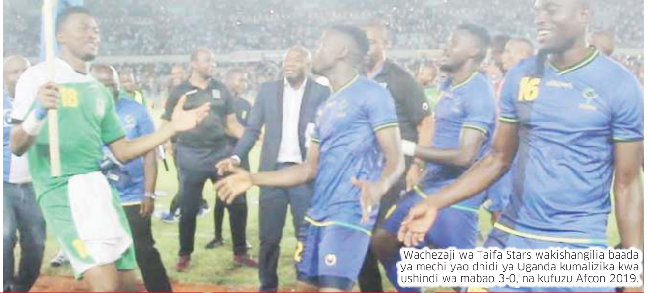
Wachezaji wa Taifa Stars wakishangilia baada ya mechi yao dhidi ya Uganda kumalizika kwa ushindi wa mabao 3-0, na kufuzu Afcon 2019.