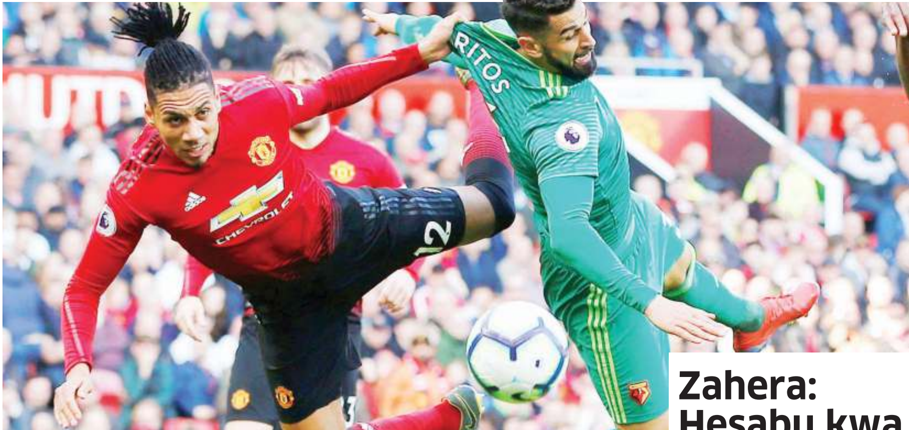
Beki wa kati wa Manchester United, Chris Smalling, akiwa katika harakati za kuokoa hatari dhidi ya beki wa Watford, Miguel Britos (kulia), kwenye mechi ya Ligi Kuu England iliyopigwa Uwanja wa Old Trafford juzi na United kushinda 2-1.