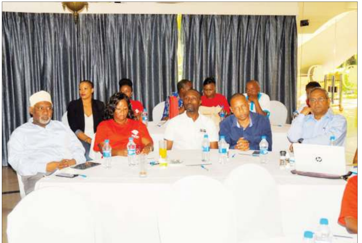
Baadhi ya mawakala wa bima wakisikiliza mawasilisho kuhusu bima mpya ya General Insurance, iliyozinduliwa na kampuni ya AAR jijini Dar es Salaam mwishoni mwa wiki.