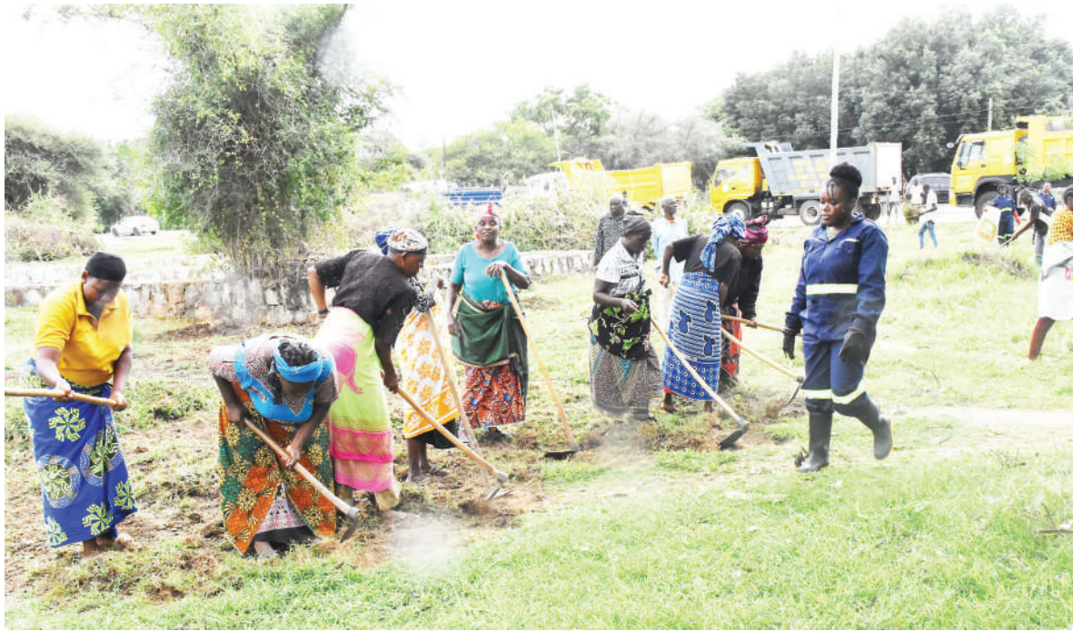
Wakazi wa Kata ya Kikuyu Kusini jijini Dodoma wakishiriki kufanya usafi wa mazingira kwenye maeneo yao mwishoni mwa wiki.