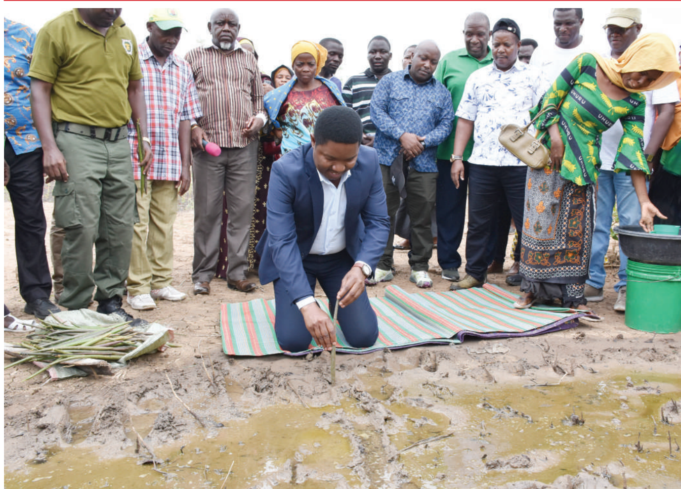
Waziri wa Nchi Ofisi ya Makamu wa Rais (Muungano na Mazingira), Dk. Selemeni Jafo, akipanda mti aina ya mkoko katika hafla ya uzinduzi wa kampeni ya upandaji miti aina ya mikoko katika delta ya Mto Rufiji. Uzinduzi huo ume-fanyika mwishoni mwa wiki katika Kijiji cha Mbuchi, Tarafa ya Mbwela, Wilaya ya Kibiti.

"Kila Mtanzania awe mkaguzi wa bidhaa hizi tunasisitiza ukaguzi uanzie ndani mwetu sisi wote," ilieleza taarifa hiyo.