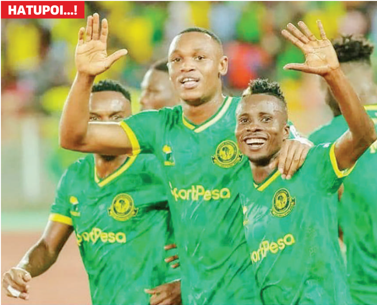
Wachezaji wa Yanga wakishangilia moja ya ushindi walioupata kwenye Ligi Kuu msimu huu.