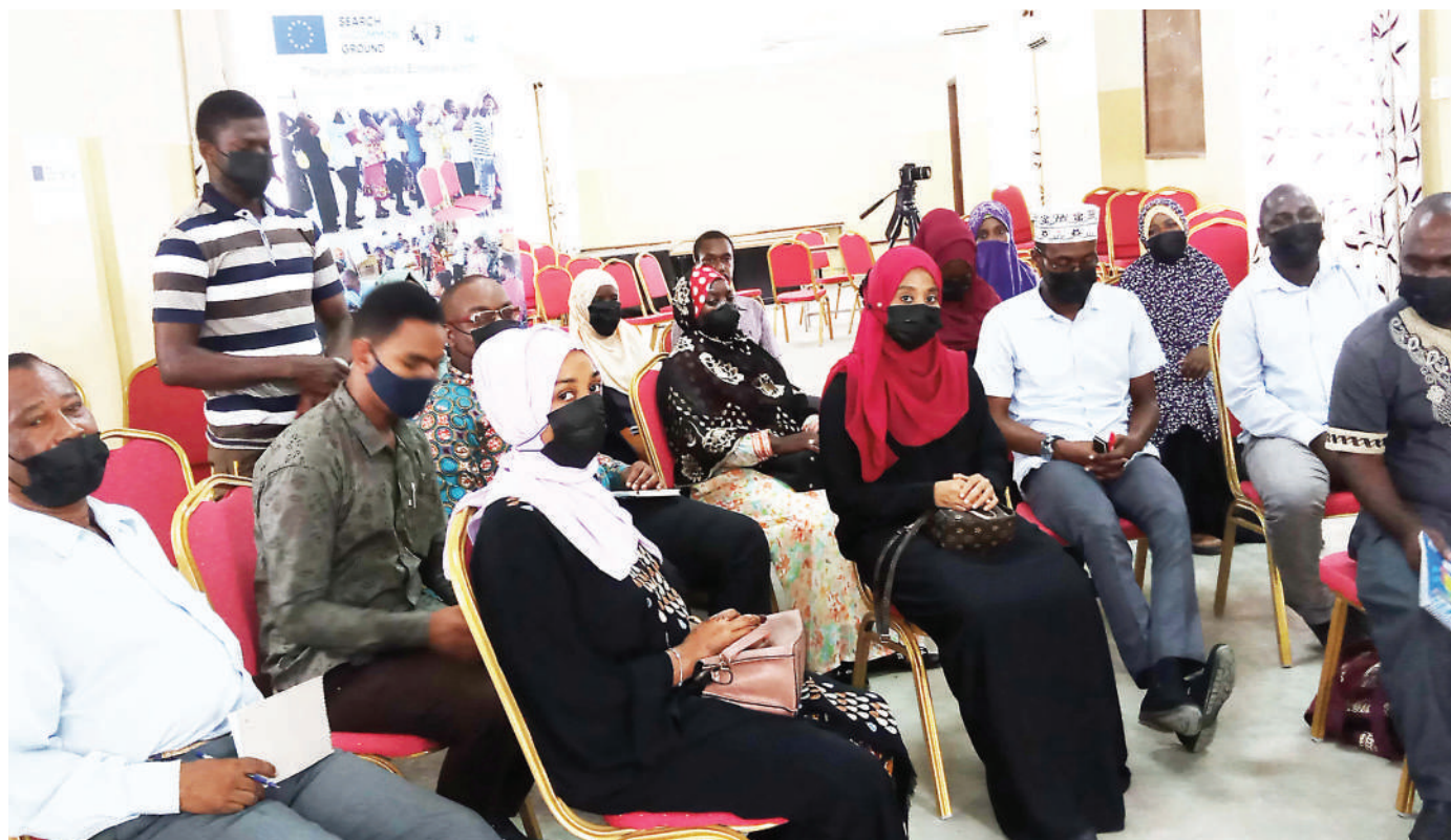
Baadhi ya waandishi wa habari Zanzibar wakiwa katika mafunzo kuhusu kuandika habari za utatuzi wa migogoro, mafunzo ambayo yameandaliwa na kituo cha huduma na sheria Zanzibar kupitia mradi wa jenga amani.

Kwa upande wake Meneja Mradi wa Ujenzi wa Hoteli ya Palolo Altedo Otri, alisema wao ni wadau wakubwa katika ulipaji wa kodi kwa serikali.