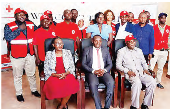
Baadhi ya wenyevitani na watumishi wa Msalaba Mwekundu, nchini wakiwa pamoja.

"Tutawasaidia watoto wawe na maisha bora. Tutawasaidia wajendeleze pale watakaposhindwa wajajiri baada ya kupatiwa mafunzo ya ufundi seremala," anaeleza Kihenzi.