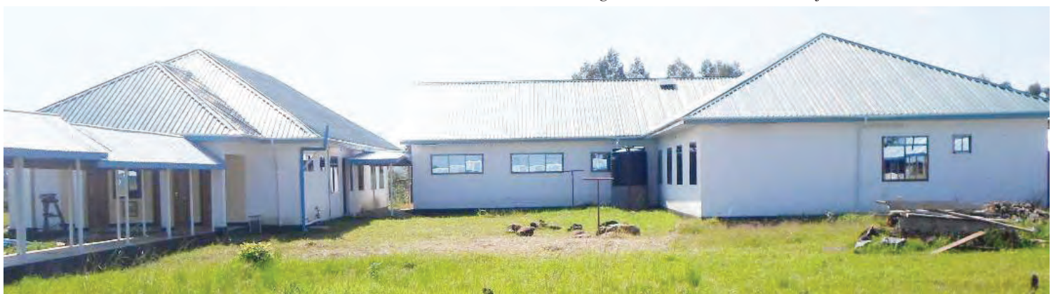
Kituo cha Afya cha Magena, katika Halmashauri ya Mji wa Tarime, kilichopandishwa hadhi kutoka zahanati.

Mkurugenzi huyo ana ufafanuzi wa manufaa mengine ni kupatikana ajira kwa wenyeji washiriki wa ujenzi.