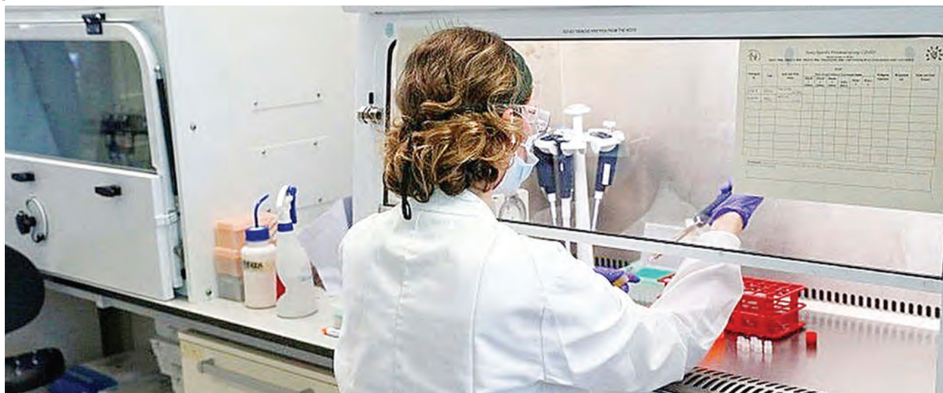
Uandaaji dawa ya kinga ya corona, ukiendelea katika Chuo Kikuu cha Oxford, Uingereza. Picha nyingine, dawa ya kinga inayotarajiwa.

Akitoa taarifa kuhusu mkakati wa kuanza wimbi la chanjo nchini Uingereza, Waziri Mkuu Boris Johnson, aliwaasa wananchi wasianzishe foleni za kutaka