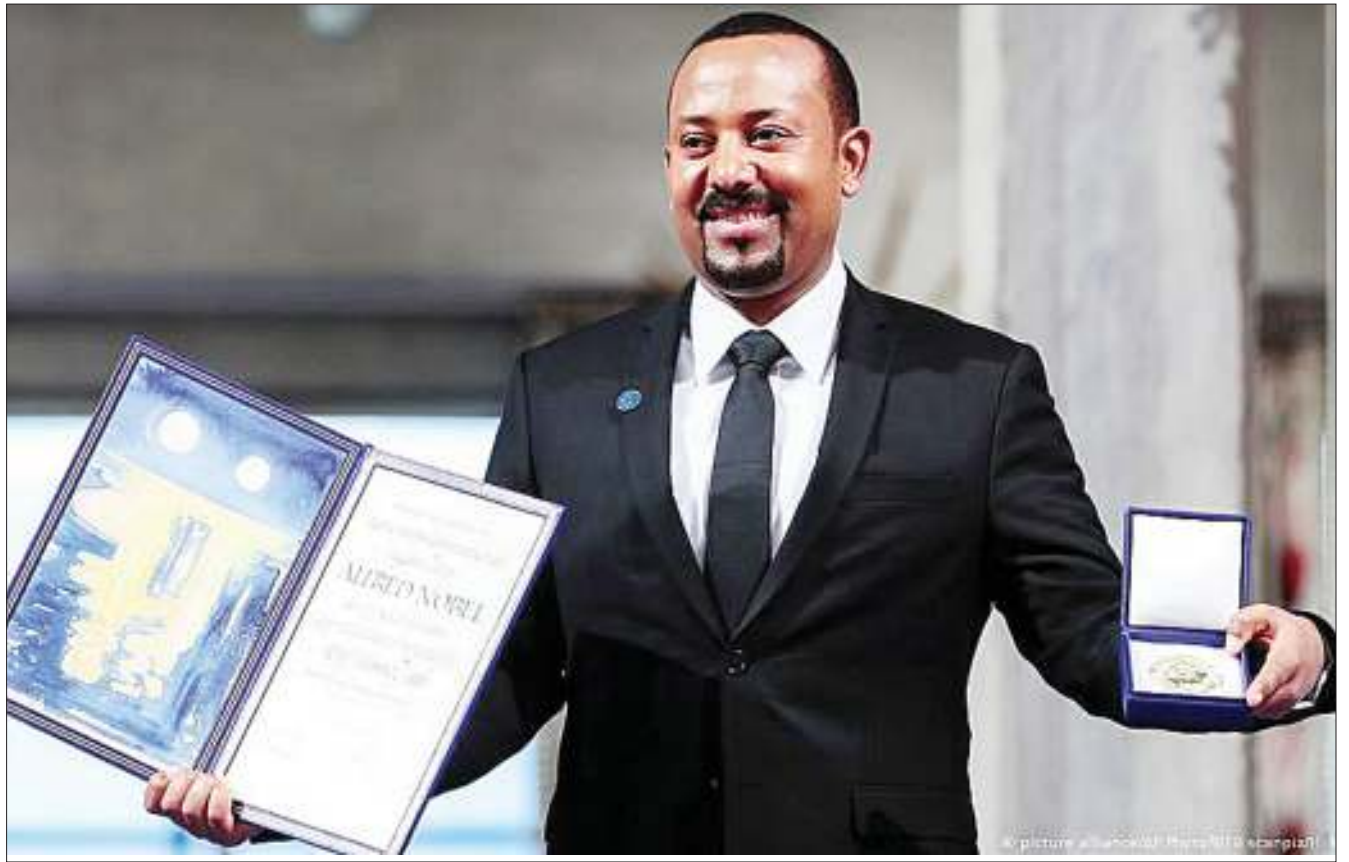
Waziri Mkuu wa Ethiopia, Abiy Ahmed, ametunukiwa tuzo ya amani ya Nobel mjini Oslo, Norway, alitoa wito wa kuwapo umoja, huku machafuko ya kikabila yakiitikisa nchi yake na juhudi za suluhu pamoja na Eritrea zikionyesha kukwama.

Siku ya kupiga kura, inafanyika kwa njia rahisi ambapo kinachohitajika kufanywa ni kujitokeza katika kituo cha kupiga kura na kawaida huwa ni sehemu iliyokaribu na nyumba ya mpigakura. BBC