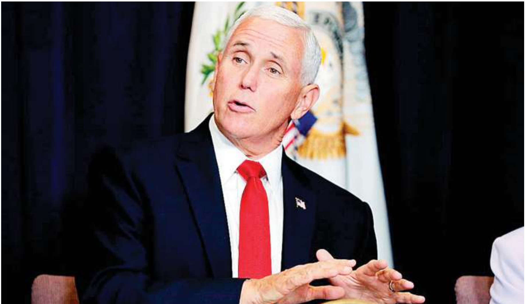
Makamu wa Rais wa Marekani, Mike Pence, ndiye anayekuwa kiongozi iwapo Bunge la Seneti litampata Rais Trump na hatia.