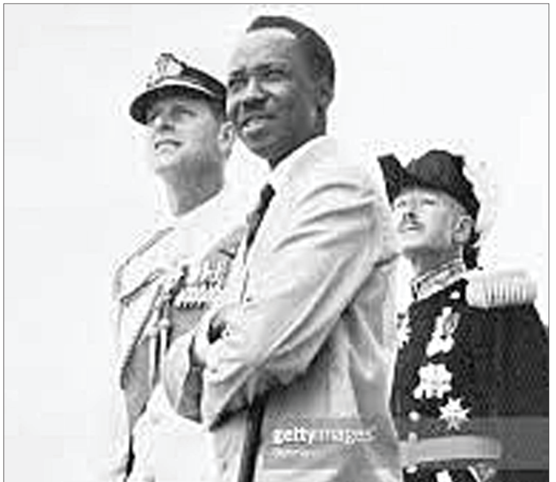
Mwalimu Nyerere akiwa na viongozi wa mkoloni wakishuhudia kushushwa bendera ya Mwingereza na kupandishwa ya Tanganyika.

Katika Hotuba hii ya 10/12/1962 Mwalimu Nyerere alisema "Uhuru tuliupigania sio tu uhuru dhidi ya mkoloni, tulitaka uhuru wa watu wetu binafsi kufanya mambo yao na kujitafutia kipato chao kwa ajili ya maisha yao yenye utu". Aliendelea kusema