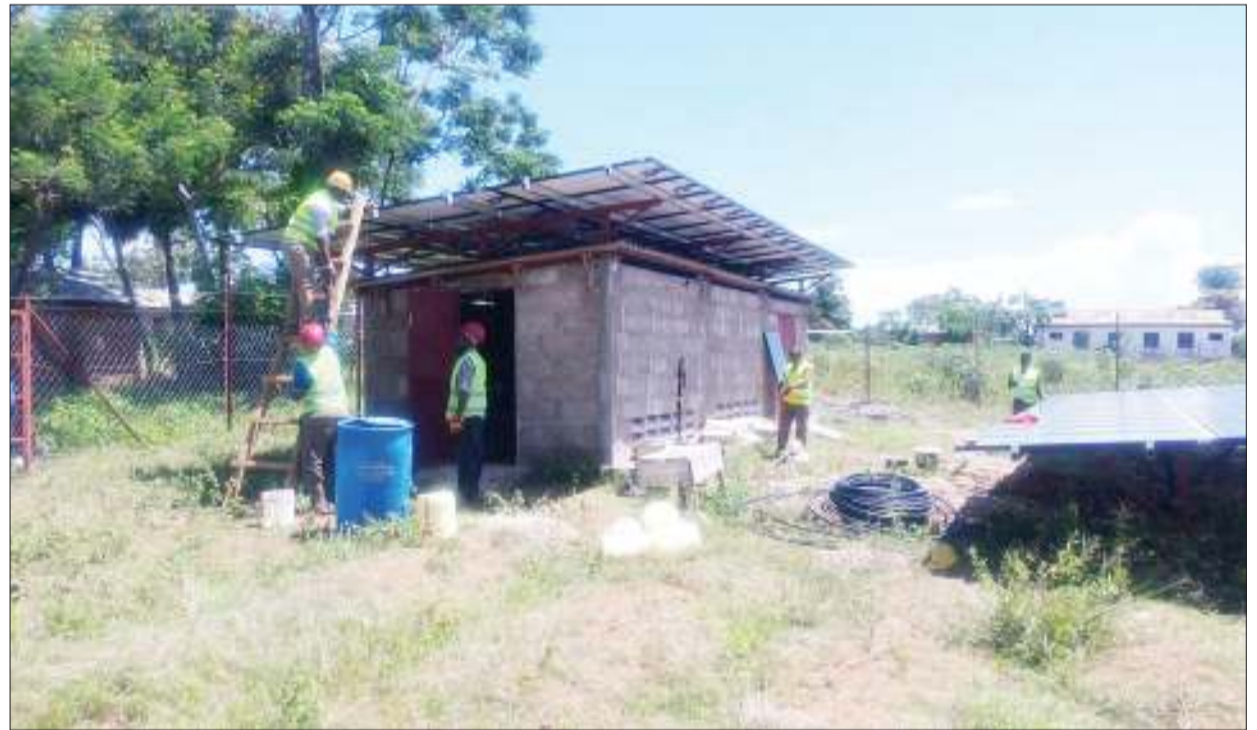
Baadhi ya mafundi mitambo wa kampuni ya uzalishaji na usambazaji umeme jua (Jumeme), wakifunga mitambo ya uzalishaji nishati hiyo katika moja ya miradi yake kisiwa cha Ukara wilayani Ukerewe, mkoani Mwanza.

Aliongeza kampuni hiyo ya Jumeme ilioundwa mwaka 2014 chini ya mradi wa "Micro-power Economy roll out in Tanzania" na kufadhiliwa na EU, inalenga kukuza, kujenga, na kuendesha gridi ndogo za umeme jua katika vijiji mbalimbali nchini.