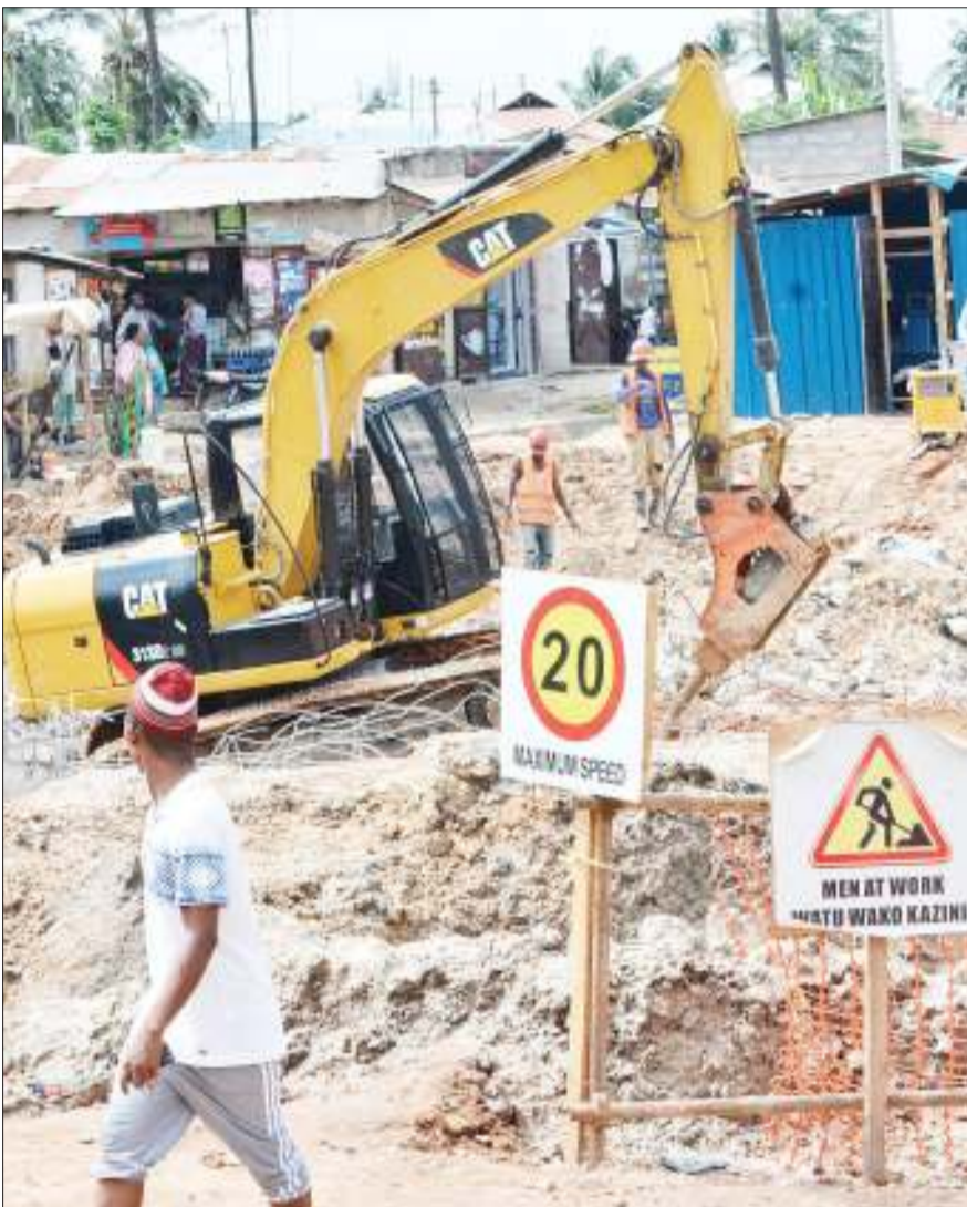
Mafundi wa kampuni ya Chico wakiendelea na kazi ya ujenzi wa daraja karibu na Shule ya Mama Salma Kikwete jijini, Dar es Salaam jana.