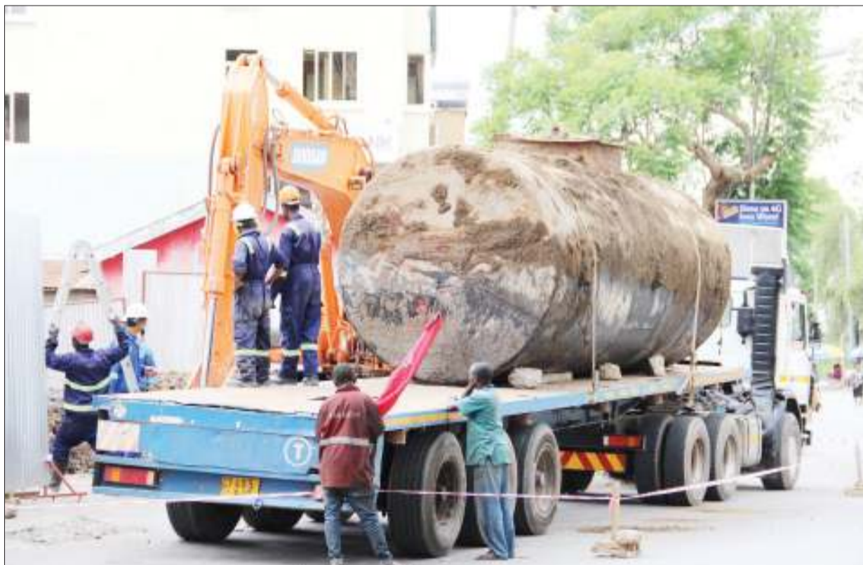
Wafanyakazi wa moja ya kampuni ya ujenzi ya jijini Mbeya, wakipakia tangi la mafuta kwenye gari wakati wa marekebisho ya kituo cha mafuta kilichopo eneo la Posta jijini humo, juzi, huku wakiwa wamezungushia utepe eneo hilo kwa ajili ya tahadhari kwa watumiaji wengine wa barabara.

Alisema changamoto kubwa iliyopo ni wananchi wa Idugumbi ambako ndiko uchomaji wa mkaa upo kwa kiwango kikubwa kwa madai wakati mwingine wanaachia moto kwenye misitu hiyo.