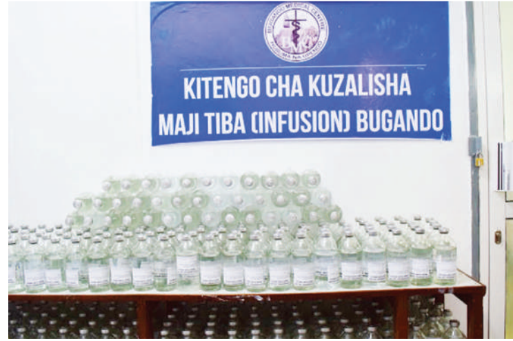
Majitiba, iliyokwishatengenezwa Bugando tayari kwa matumizi, katika Kitengo cha Kuzalisha Majitiba katika Hospitali ya Rufani ya Kanda ya Ziwa.

“Kitengo hicho kilianzishwa mwaka 2016 na kwa sasa wanatoa huduma kwa wagonjwa kati ya 40 hadi 45 kwa siku.”