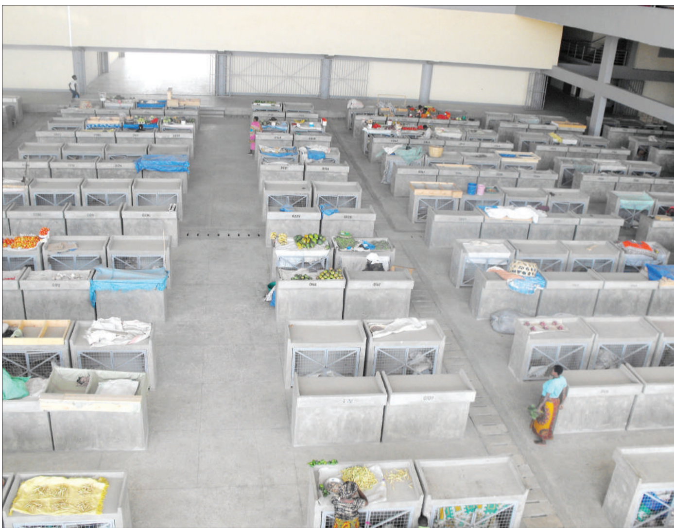
Baadhi ya wajasiriamali wa Jiji la Mbeya, wakiendelea na shughuli zao, kwenye vizimba vya Soko la Kimataifa la Mwanjelwa jijini humo, jana, ambapo wanawalalamikia wenzao wanaopanga bidhaa zao nje ya soko hilo, kwa maelezo wanawazuia wateja wasiingie sokoni humo.