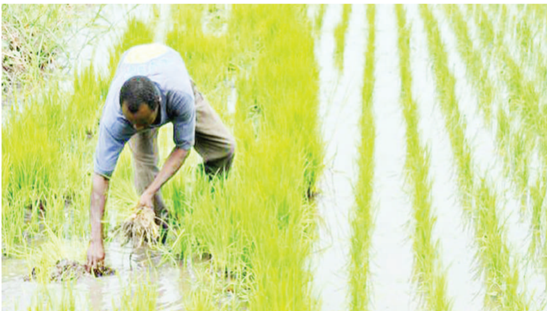
Wakulima wa mpunga katika majaluba yao, ambayo ni maeneo rafiki wa kueneza kichocho.