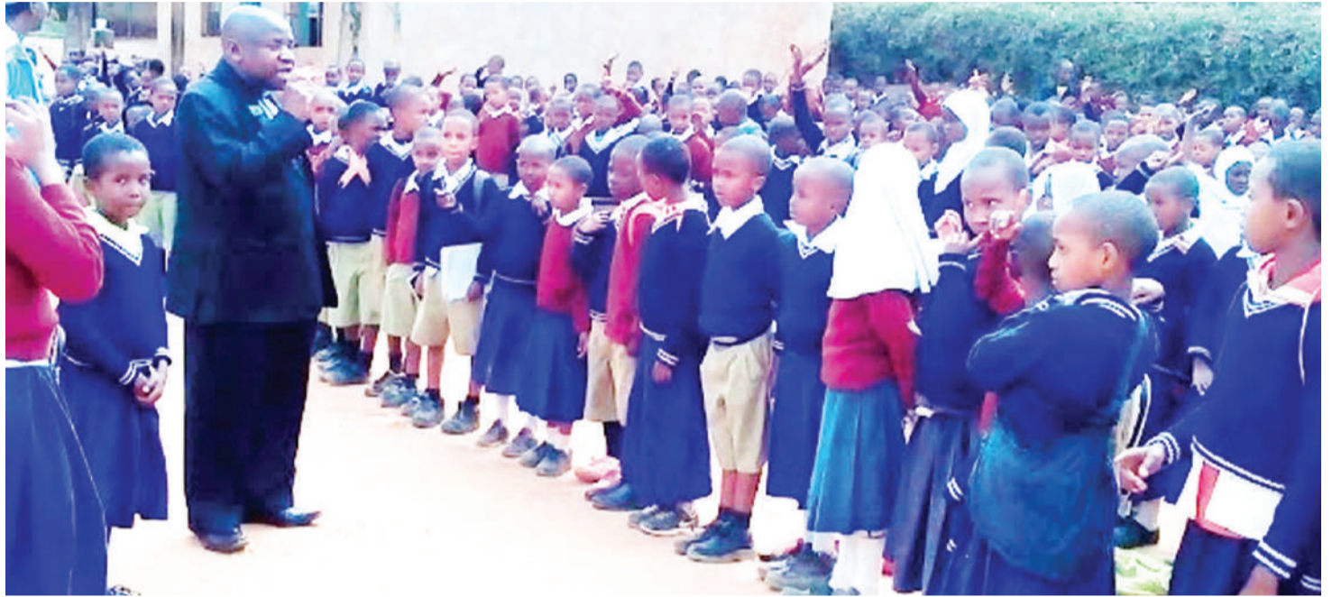
Kiongozi wa kiserikali wilayani Mbulu mkoani Manyara, alipowatembelea wanafunzi wa Shule ya Msingi Harka.

"Mfano, unakuta wazazi wa jamii ya kifugaji wanamtafuta mchungaji na wanapoenda kuhamisha mifugo, wanawaacha