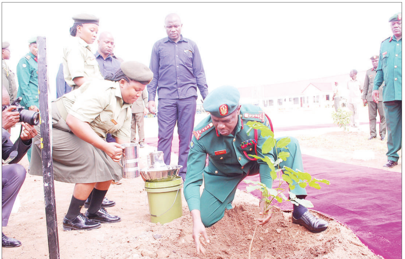
Mkuu wa Majeshi ya Ulinzi, Jenerali Venance Mabeyo, akipanda mti baada ya kuzindua majengo ya makao makuu ya Jeshi la Kujenga Taifa (JKT), yaliyopo Chamwino Buigiri, mkoani Dodoma jana.