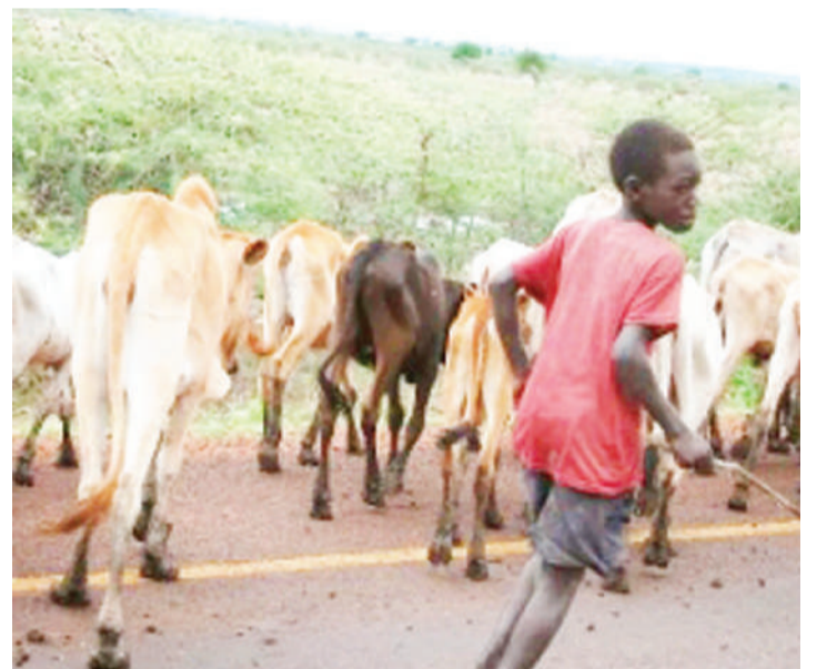
Mfugaji wa umri mdogo akiwa kazini, mkoani Manyara.

Utafiti uliofanywa na Kituo cha Sheria na Haki za Binadamu (LHRC) mwaka 2017 kupitia vy-