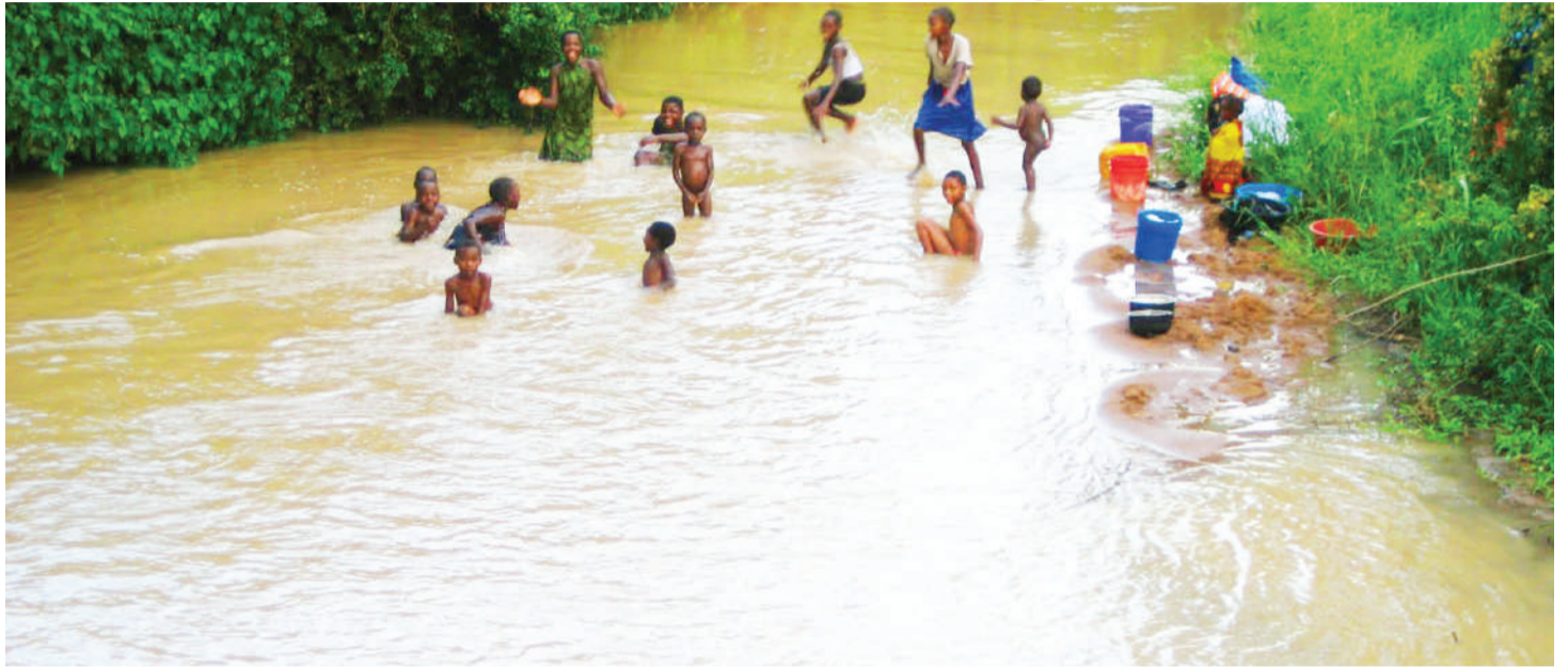
Watoto wakioga na kucheza katika maji yanayotumika kama haya napo kusababisha kusambaa kichocho. PICHA: MTANDAO.

“Kulikuwa na programu maalum za kuelimisha wananchi kuhusiana na ugonjwa wa kichocho, kwa mfano Zanzibar kulikuwa na kitu kinaitwa ‘Zanzibar Elimination of Schistosomiasis Trans-