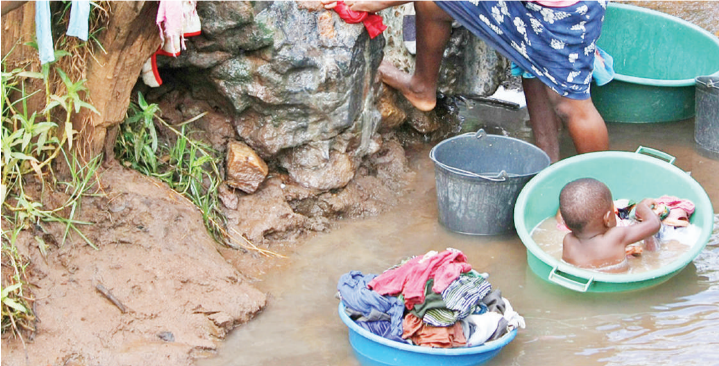
Mazingira ya maji yanayotumika kusababisha kusambaa kichocho.

• Taasisi Ifakara yajibebesha jukumu • Wilaya tano, Visiwa Victoria hatari • Mtafiti Levira: Tuko pabaya Afrika