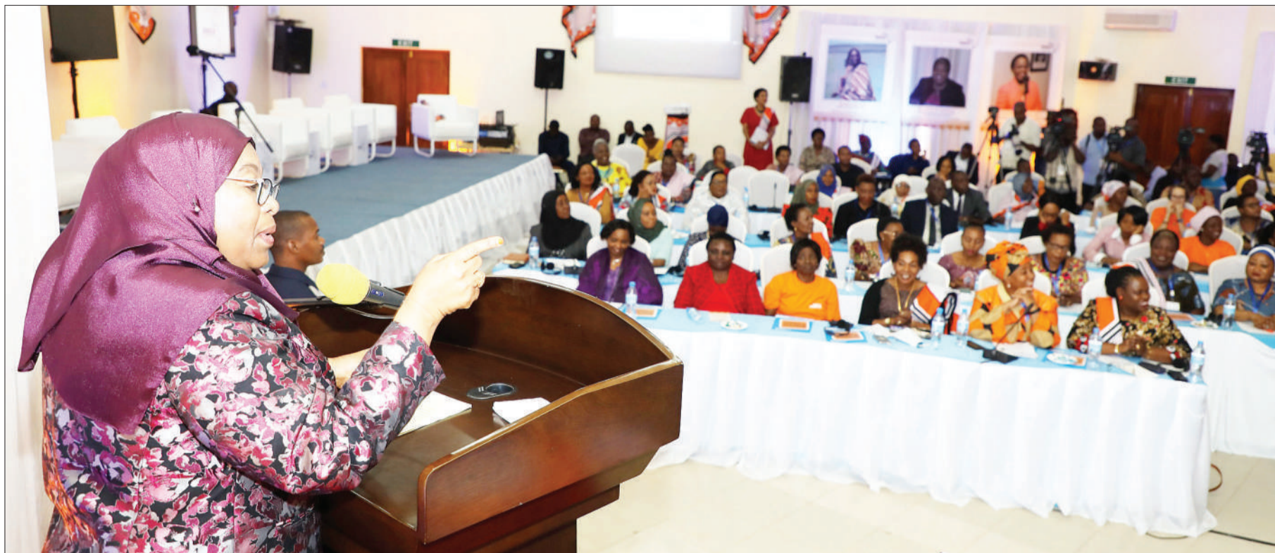
Makamu wa Rais, Samia Suluhu Hassan, akizungumza katika uzinduzi wa Mtandao wa Viongozi Wanawake Afrika, Tawi la Tanzania, jijini Dodoma jana, ambapo kauli mbiu ya Mtandao huo ni Wanawake na Uongozi Twende Pamoja Wakati ni huu.