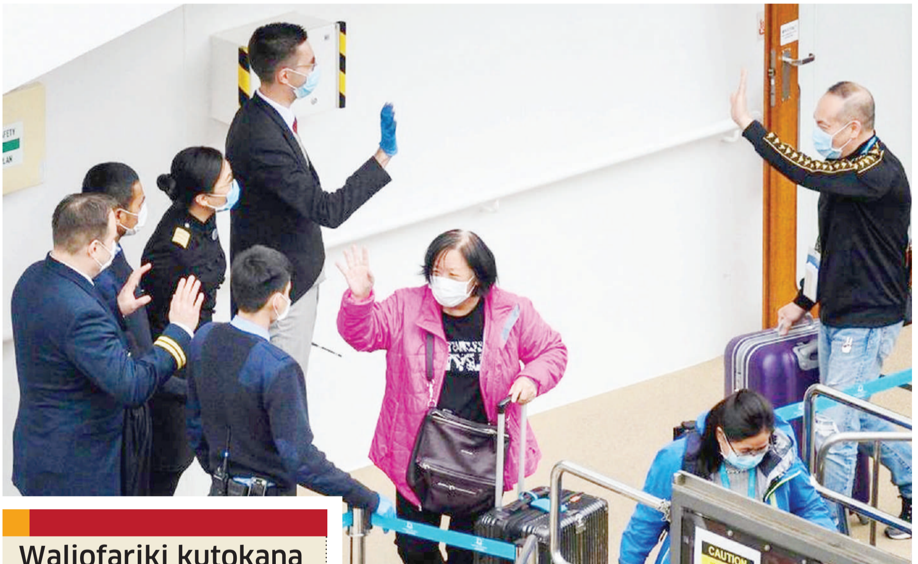
Raia wa China wakisalimbia kwa kupungiana pasipo kushikana mikono kuhofia kuambukizana virusi vya Corona.

Wakati huohuo, Watu 78,064 wameambukizwa virusi vya ugonjwa wa Corona na kusababisha vifo vya watu 2,715 nchini China tangu ugonjwa huo ulipozuka Desemba mwaka jana. BBC