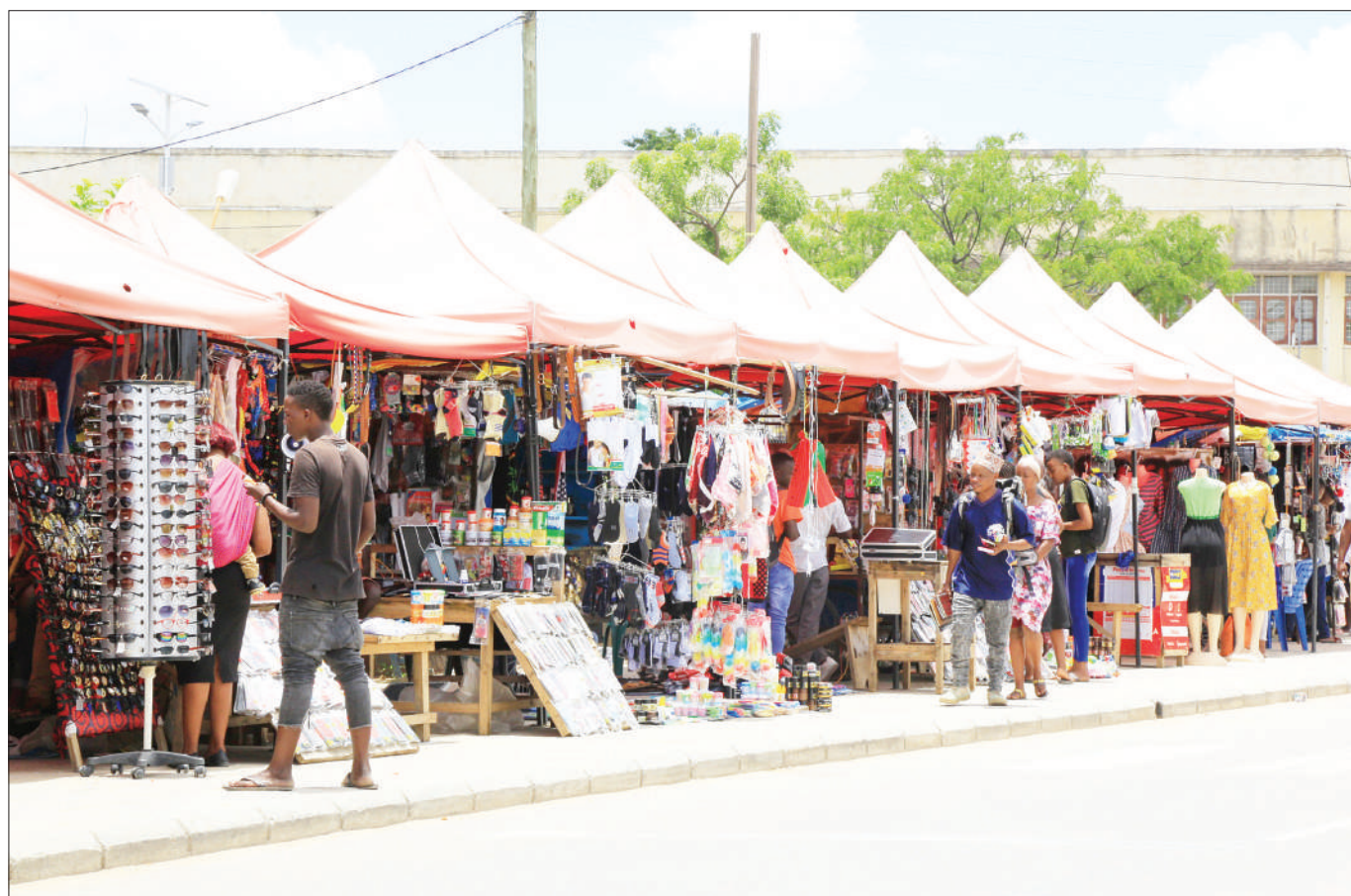
Baadhi ya wafanyabiashara ndogondogo maarufu kama machinga wa eneo la One Way, jijini Dodoma, wakionekana kubuni utaratibu mzuri wa kupanga bidhaa zao na kuweka mabanda ya muda, ili bidhaa zao zisiharibike na vumbi au kunyeshewa na mvua.

Kibwengo alitoa wito kwa jamii kuendelea kutoa taarifa pale wanapoona sehemu kuna vitendo vya rushwa.