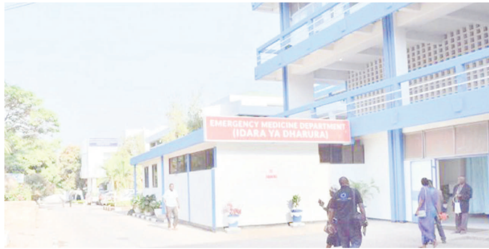
Mandhari ya mapokezi ya wagonjwa wa dharura wa Hospitali Bugando.

• Daktari Bingwa: Kila siku tunawatibu 45 • Inazalisha gesi, majitiba ya wagonjwa wake • Kila kitu kwa elektroniki, makubwa 'kibao'