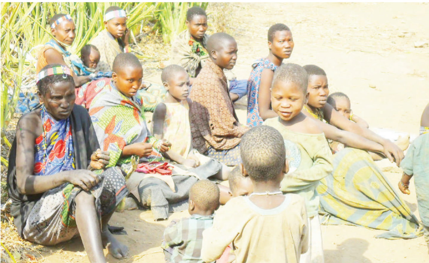
Kundi la jamii ya wawindaji, kati yao wamo watoto.