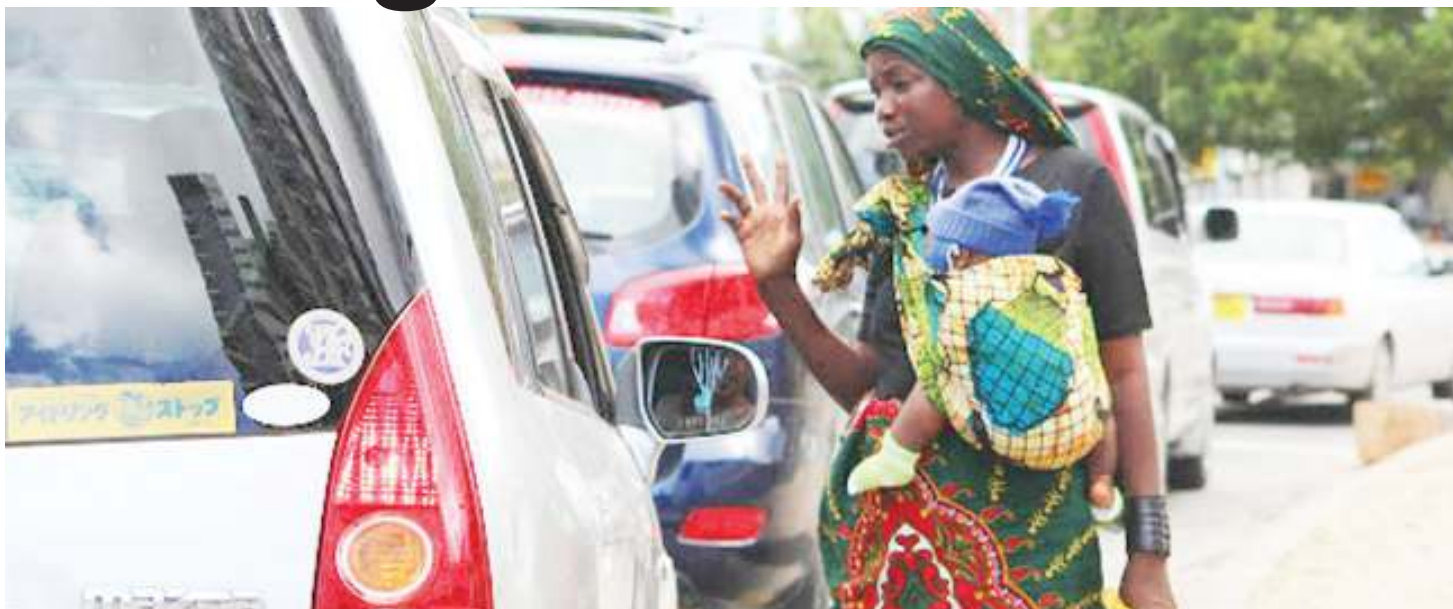
Mama anayedaiwa kuomba, katika Barabara ya Ali Hassan Mwinyi, akiwa na mwanawe.