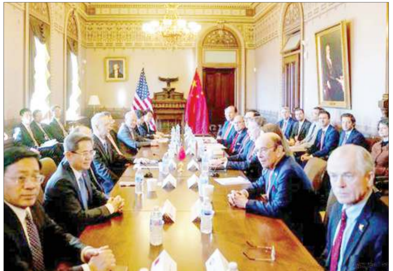
Wajumbe wa Marekani na China wakiwa kwenye mazungumzo ya kutatua mgogoro wa kibiashara baina ya nchi hizo.

Waziri wa Fedha wa Marekani, Steven Mnuchin, alisema kutokana na ugumu wa masuala hayo, makubaliano ya kuimaliza mgogoro huo hayatazamiwi kufikiwa kwenye mkutano huo wa siku mbili wa mjini Washington, lakini anatarajia watapiga hatua kubwa. DW