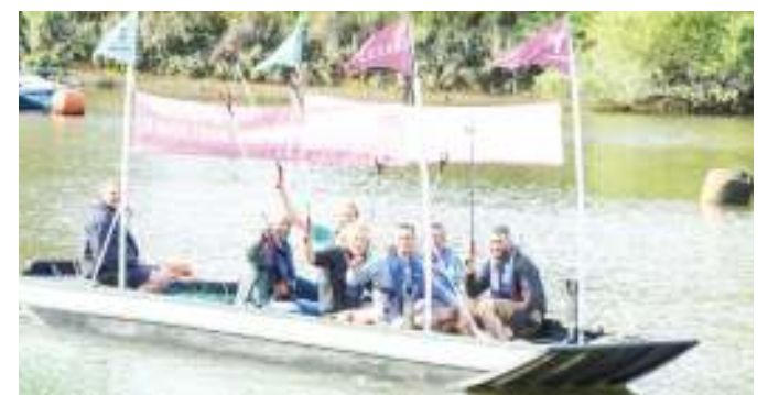
Boti nyingine kama ya nchini Kenya, zilizotengenezwa kwa pastiki nchini.

Katika siku chache zijazo, boti hiyo itaanza safari kuelekea Pemba na Zanzibar na kurejea ilipotoka ambapo mafundi watajaribu kutafakari zaidi kuhusu namna bora ya matumizi ya boti hiyo. (CHANZO: RFI Kiswahili).