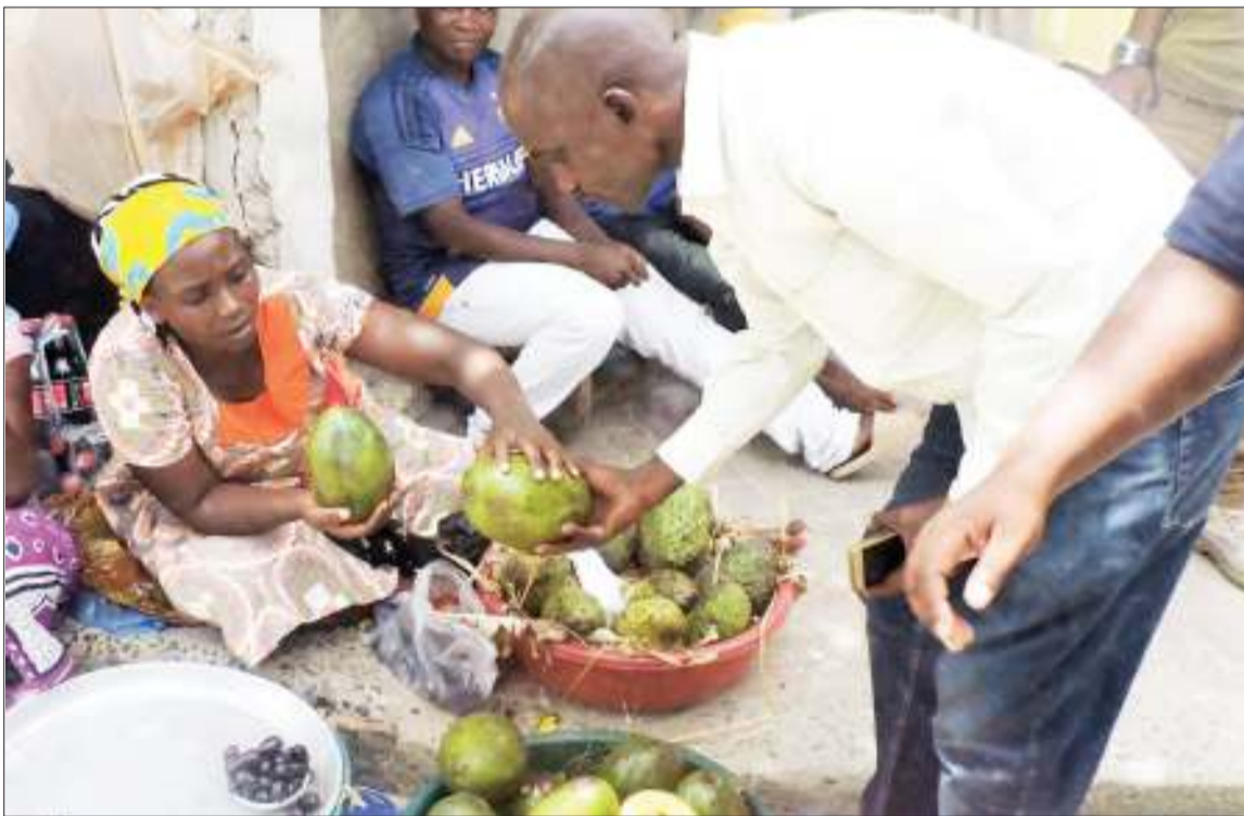
Mchuzi wa parachichi akimhudumia mteja kando ya Barabara ya Bibi Titi Mohamed, eneo la Mnazi Mmoja, jijini Dar es Salaam jana. Parachichi moja aliliuza kwa bei ya 1,500/- Kwa sasa kuna uhaba wa matunda hayo jijini Dar es Salaam, hivyo bei kupaa.

“Ninawaomba walemavu wenzangu waachane na tabia ya kuwa ombaomba na badala yake waanze kufikiria kufanya shughuli ndogo ndogo za kujiingizia kipato,” alisema Upendo.