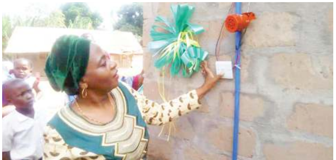
Naibu Waziri wa Nishati, Subira Mgalu, akionyesha ishara ya kuwasha umeme katika nyumba mojawapo Kijiji cha Kisanga, wilayani Kisarawe, mkoa wa Pwani.

Msikae maofisini, waunganishieni umeme wananchi na taasisi zote, zikiwamo shule na vituo vya afya kwa ajili ya kuleta maendeleo.