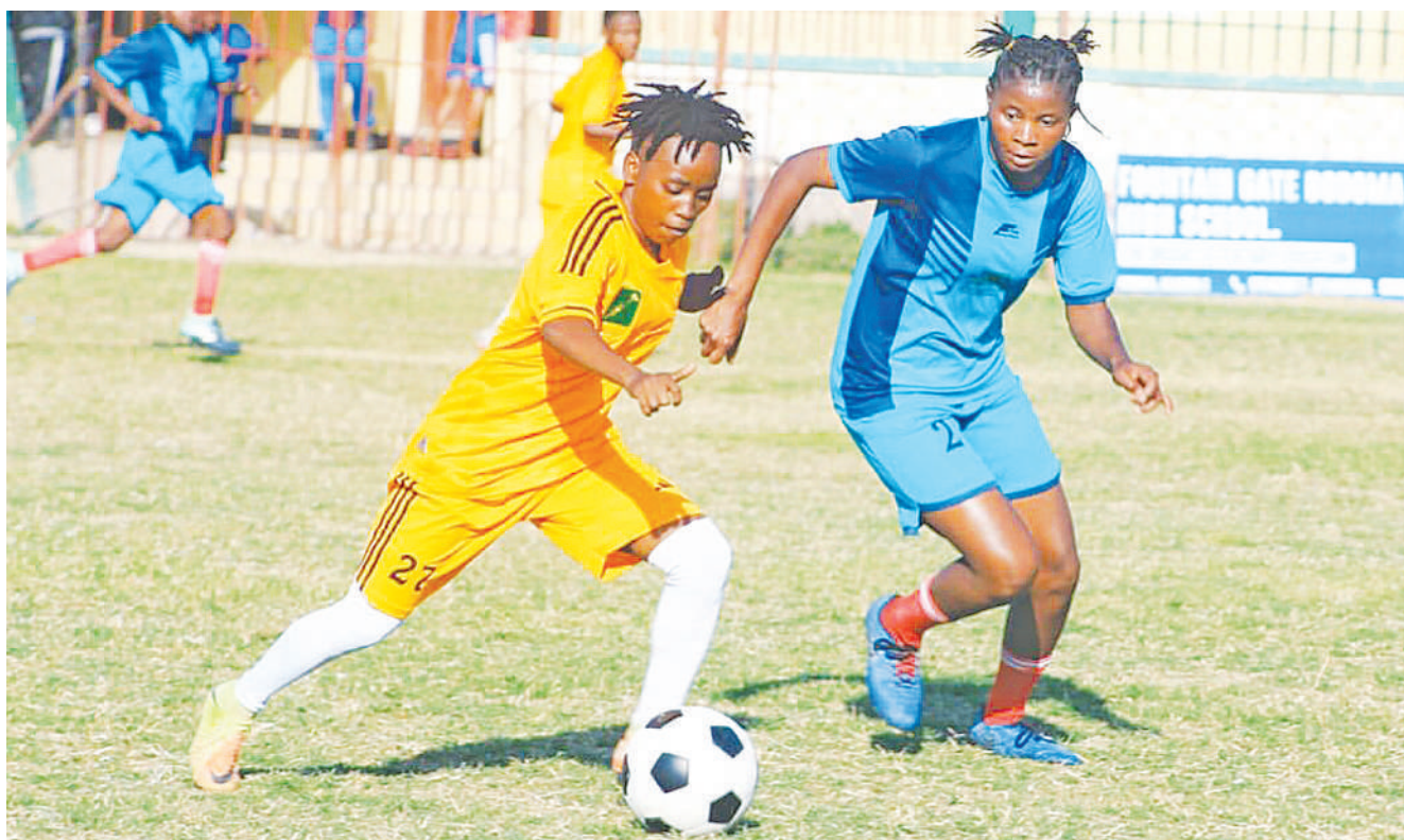
Mchezaji wa Mapinduzi Queens kutoka Njombe (kushoto), akiwania mpira dhidi ya nyota wa Mkwawa Queens ya Iringa katika mechi ya Ligi Daraja la Kwanza Wanawake iliyochezwa kwenye Uwanja wa Fountain Gate jijini, Dodoma jana. Mkwawa ilishinda bao 1-0.

Bingwa wa mashindano hayo atapata tiketi ya kuwakilisha Zanzibar katika mashindano ya kimataifa ya Kombe la Shirikisho Afrika.