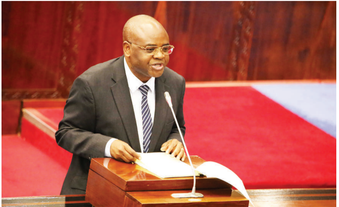
Waziri wa Nchi, Ofisi ya Rais, Mipango na Uwekezaji, Prof. Kitila Mkumbo akiwasilisha taarifa ya hali ya uchumi kwa mwaka 2023 na mpango wa maendeleo wa mwaka 2024/2025, Bungeni jijini Dodoma jana.

Waziri huyo alitaja jambo lingine ni Tanzania inanunua zaidi kutoka nje kuliko kiwango inachouza. Hivyo, bado kuna urari mkubwa katika