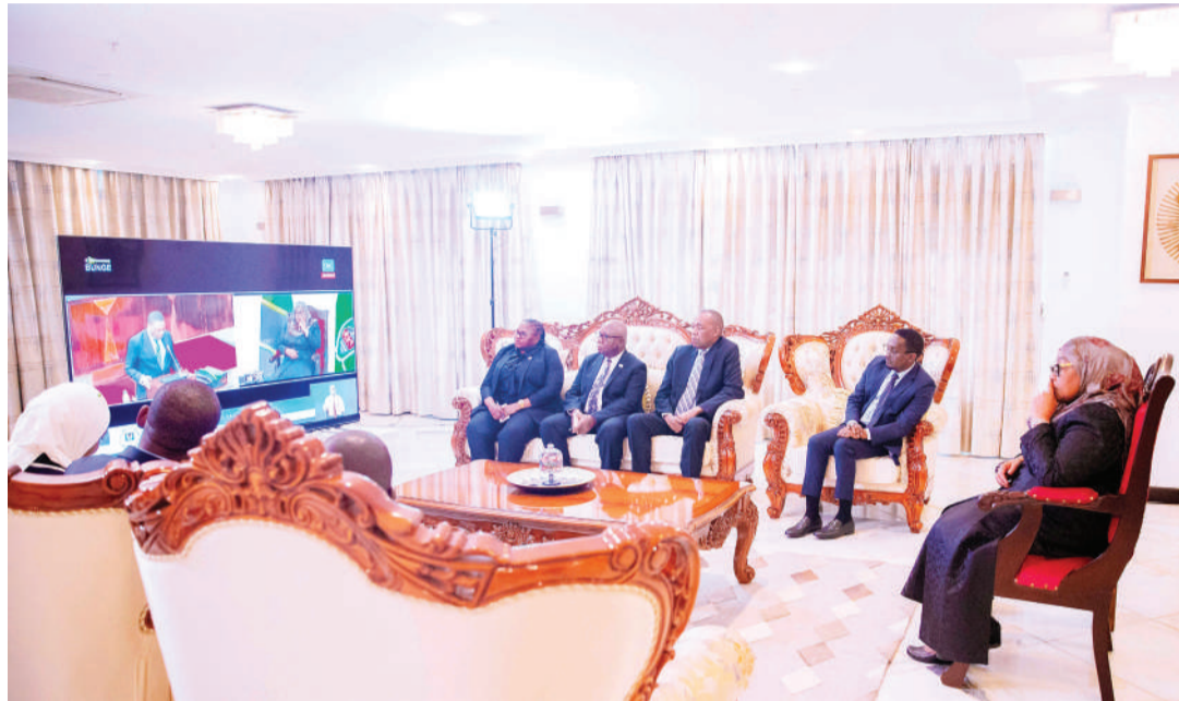
Rais Samia Suluhu Hassan akifuatilia Bunge la Bajeti Kuu ya Serikali ya mwaka 2024/25, kwa njia ya runinga nyumbani kwake, Chamwino mkoani Dodoma jana.

Ongezeko la bajeti kwa kiasi kikubwa limetokana na kugharamia: Deni la Serikali ambalo limeongezeka kutokana na kushuka kwa thamani ya shilingi, kuongezeka kwa viwango vya riba na kuiva kwa mikopo ya