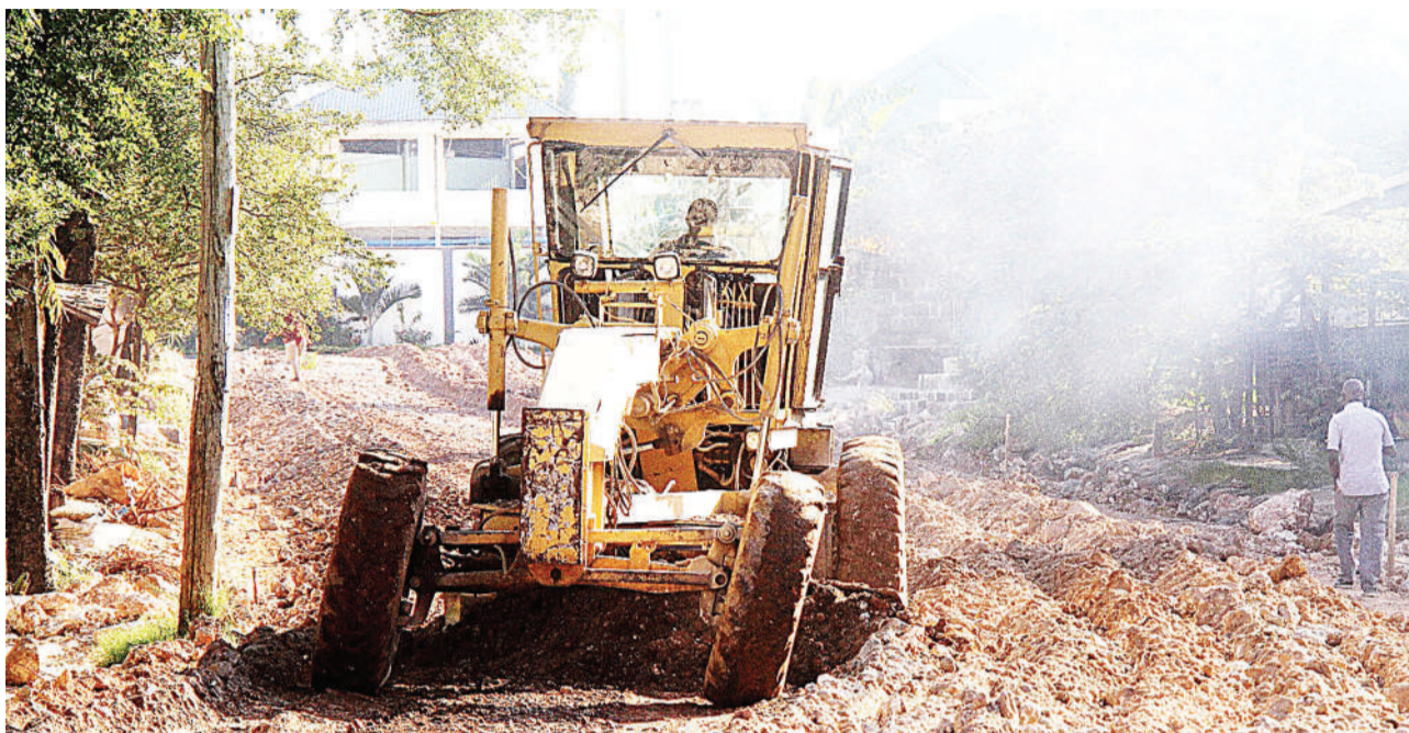
Mtambo ujenzi wa kampuni ya Southern Link, ukichonga barabara iliyopo Kitunda jijini Dar es Salaam kwa ajili ya ujenzi wa kiwango cha lami mita miantano juzi.

Hata hivyo, Simbachawene alisema kwa mujibu wa kanuni za fedha duniani zinaipa Tanzania wigo wa ukomo wa kukopa na kama nchi bado ina sifa ya kukopa kwa sababu bado haijafikia kikomo hicho.