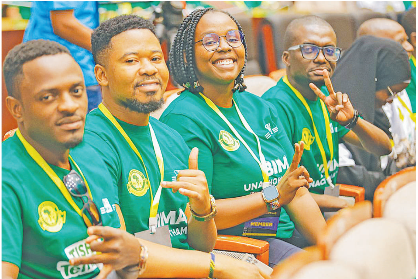
Wanachama wa Yanga kutoka matawi mbalimbali nchini wakifurahia jambo ndani ya mkutano mkuu wa mwaka wa klabu hiyo uliofanyika Jumapili iliyopita jijini, Dar es Salaam.

Baada ya ushindi wa Jumanne, Stars imepaa hadi nafasi ya pili katika Kundi E ikifikisha pointi sita sawa na vinara Morocco wakati Niger wanashika nafasi ya tatu wakiwa wamejikusanyia pointi tatu sawa na Zambia wakati DRC ambayo haina pointi hata moja ni ya tano na Eritrea inaburuza mkia katika kundi hilo.