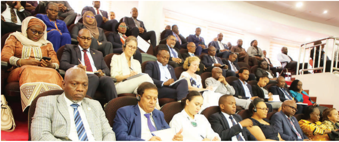
Sehemu ya Mabalizi wa-naoziwakilisha nchi zao hapa nchini, wakifuatilia kwa makini uwasilishwaji wa hotuba ya Bajeti Kuu ya Serikali.