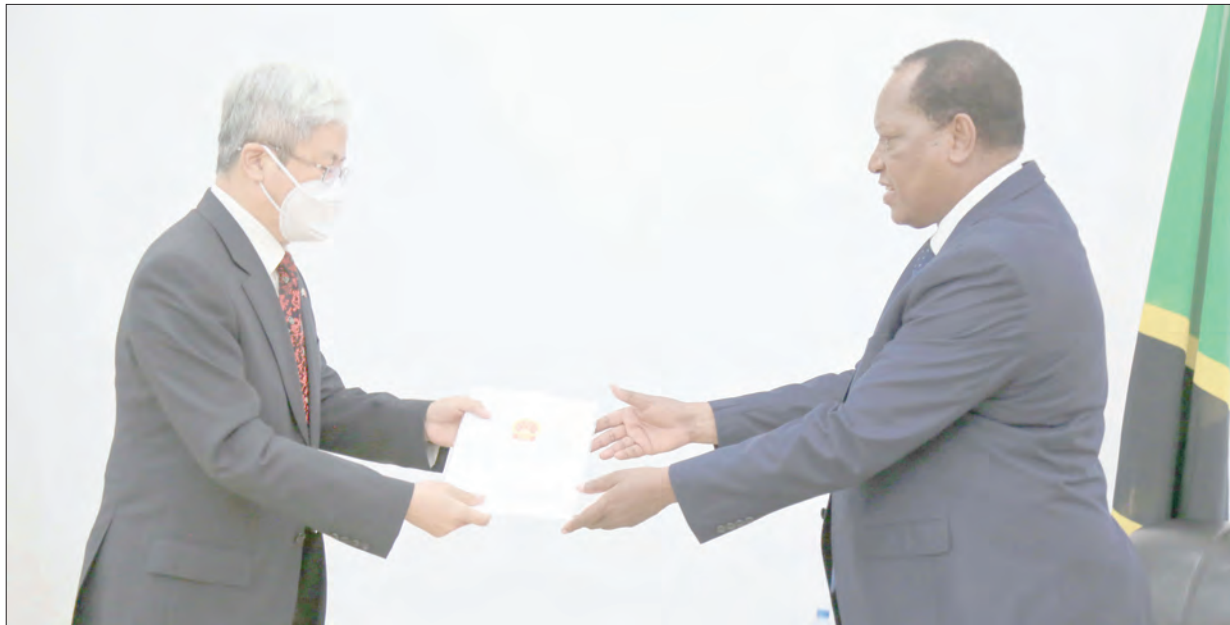
Waziri wa Mambo ya Nje na Ushirikiano wa Afrika Mashariki, Prof. Palamagamba Kabudi, akipokea hati za utambulisho kutoka Kansela Mkuu wa China, Zhang Zhisheng.

Alisema watuhumiwa hao wamekuwa wakiiba pikipiki katika maeneo mbalimbali Dar es Salaam na kuzipeleka kwa madalali ambao huziua.