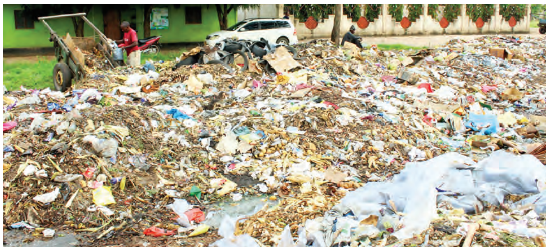
Ghuba la taka la Majengo Makaburini katika Manispaa ya Shinyanga, lililo kwenye makazi ya watu limeishi kwa miezi miwili bila uchafu kuondolewa.

lichu ya viongozi kuahidi kuwa usafi utafanyika na eneo hilo litakuwa safi na salama katika kipindi kifupi kijacho.