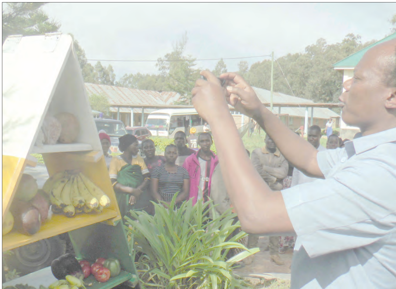
Naibu Waziri wa Afya, Maendeleo ya Jamii, Jinsia, Wazee na Watoto, Dk. Godwin Mollel, akipiga picha kwa kutumia simu janja mfano wa pembe tatu ya utayarishaji wa lishe bora kwa lengo la kudhibiti tatizo la udumavu kwa watoto juzi, alipotembelea Chuo cha Maendeleo ya Jamii (CDTI), Rungemba, Wilaya ya Mufindi.

Alisema taalo hizo zitasaidia kwa kipindi cha mwaka mzima na kuongeza mahudhurio katika masomo na kumjenga mwanafunzi na kuongeza ufaulu.