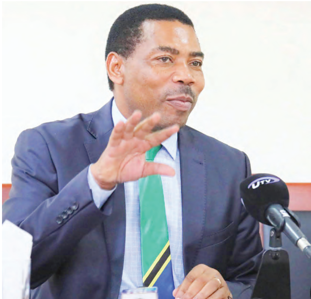
Waziri wa Katiba na Sheria, Mwigulu Nchemba, wizara yake ina jukumu la kutafsiri sheria zote kwa Kiswahili na kuzitumia kutoa hukumu mahakamani.

Tafsiri za uhitaji halisi wa mabadiliko hayo zinatofautiana na uwakilishi wake au uwasilishaji wa mada hiyo mbele ya hadhara tofauti za kiutawala unategemea anayezungumza na hisia zake katika suala hilo. Aina tatu za msisitizo au mwelekeo wa tafsiri hizo zinaonekana, moja ni ya Rais John Magufuli, ya pili ni