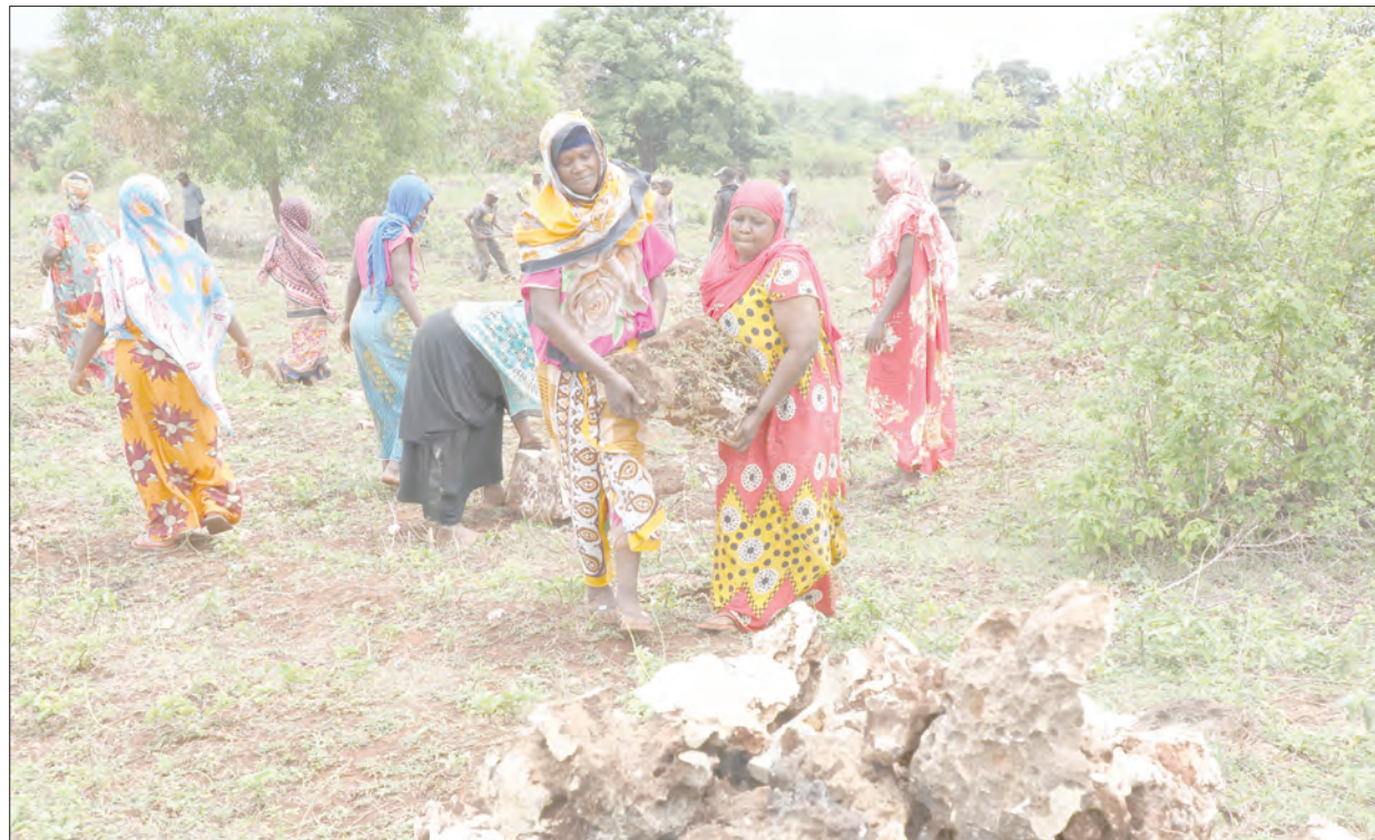
Wananchi wa Kijiji cha Bambi wakishiriki kukusanya mawe, Mkoa wa Kusini Unguja, eneo lililotengwa kwa ajili ya ujenzi wa shule ili kuwaondolea adha wanafunzi ya kutembea umbali mrefu.

Alisema kampuni yao itaendelea kutoa msaada kama hiyo kila hali inaporuhusu, katika sekta mbalimbali lengo likiwa kudumisha umoja na ushirikiano uliopo katika pande mbili hizo.