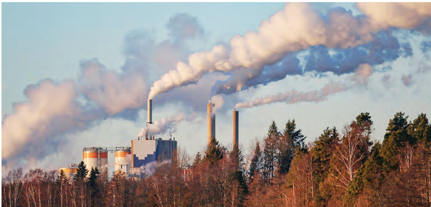
Uchafuzi wa mazingira unaotokana na uzalishaji usiojali mazingira unakwamisha jitihada za kupunguza kiasi cha joto duniani.