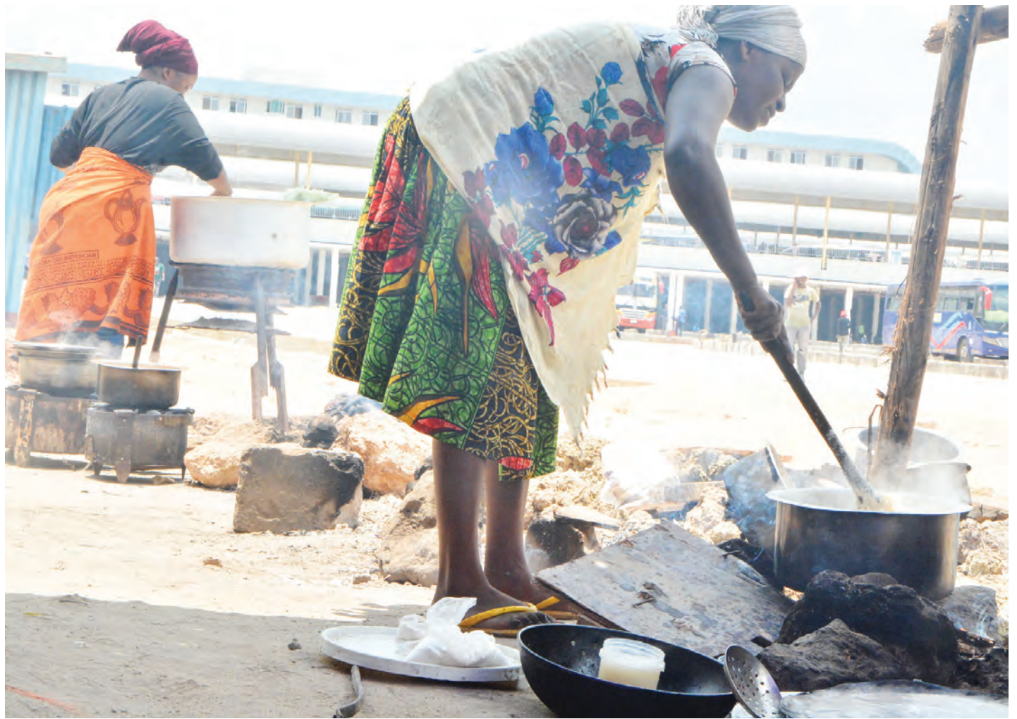
Mamalishe wakiendelea na kazi zao katika eneo la kituo cha Magufuli Mbezi Luis Manispaa ya Ubungu, Dar es Salaam jana, wakisubiri kupangiwa eneo maalum la kufanyia biashara yao.