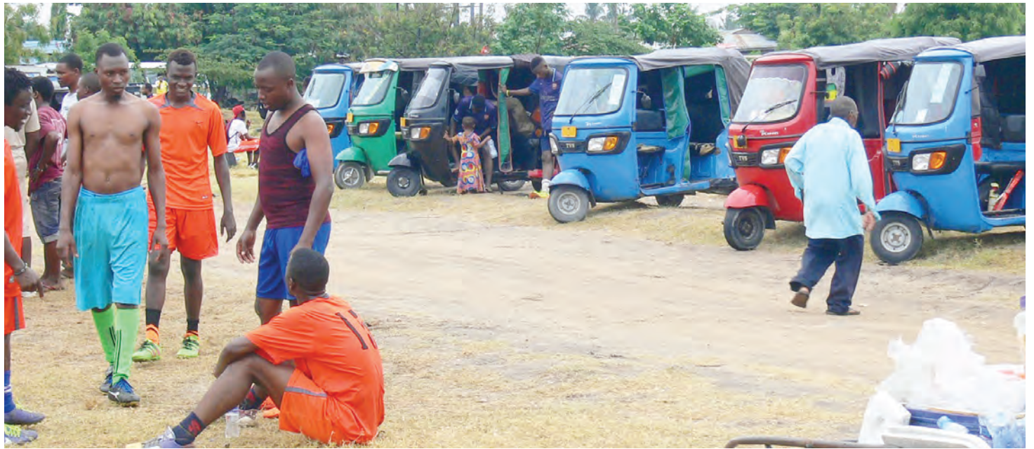
Barakoa za vitambaa zimeshika kasi maeneo mengi, lakini wafanyabiashara hasa wa sehemu zenye mikusanyiko mikubwa Dar hawajahamasika kuzivaa.

“Kuwapo maelezo mengi kuhusu corona, kunatufanya tushindwe