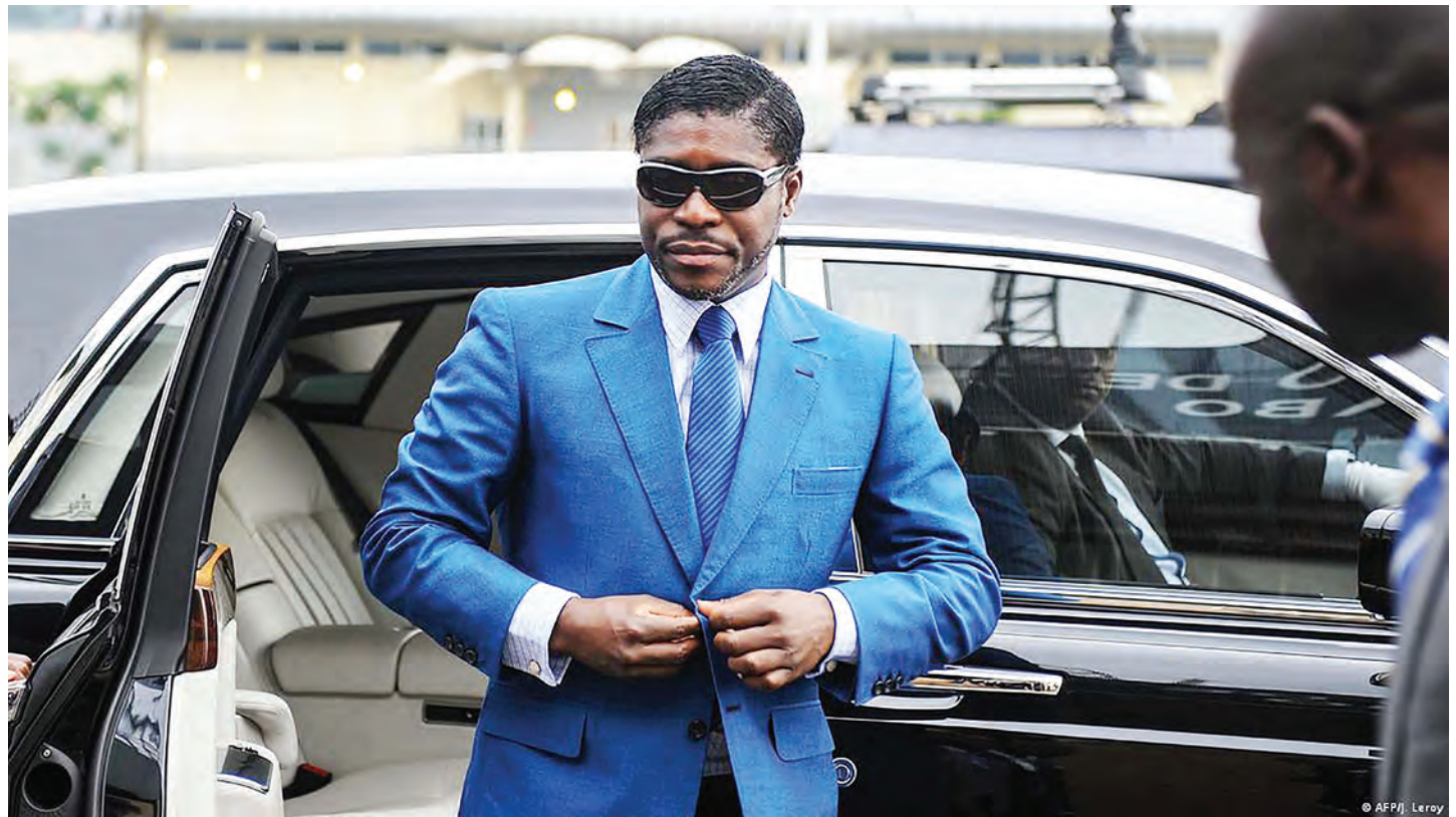
Teodorin Nguema Obiang ambaye ni mtoto wa rais wa Guinea ya Ikweta