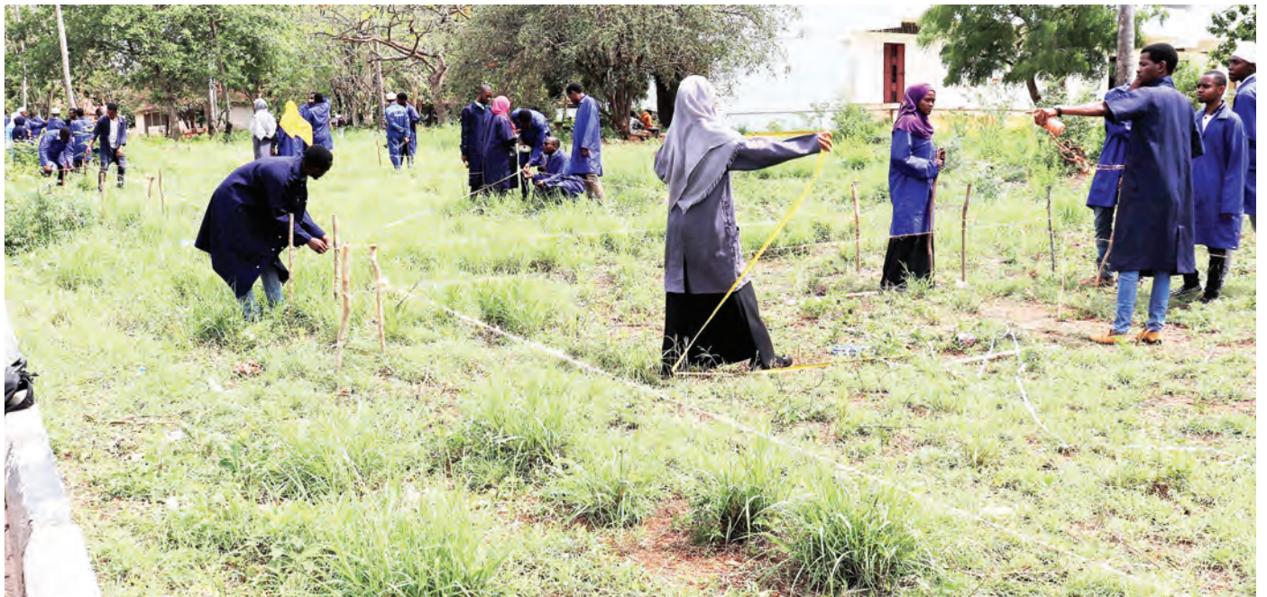
Wanafunzi wa mwaka wa kwanza wa shahada ya uhandisi wa ujenzi katika Taasisi ya Sayansi na Teknolojia ya Karume Zanzibar (KIST), wakijifunza kwa vitendo kuhusu maandalizi ya ujenzi wa nyumba, katika taasisi hiyo, Mbweni Zanzibar jana.

Pia aliagiza mamlaka kuziandikia barua kampuni zote zenye meli za abiria kuuza tiketi kulingana na idadi ya abiria ya meli iliyoruhusiwa.