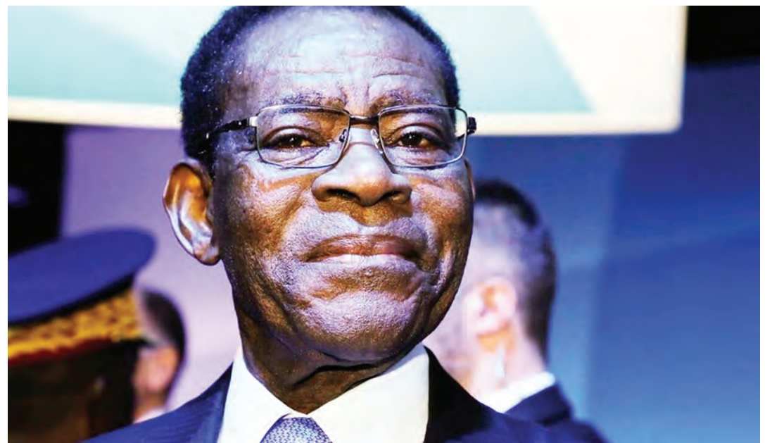
Rais Teodoro Obiang

Licha ya kutokuwepo Mahakamani, alihukumiwa kifungo cha miaka mitatu, faini ya dola milioni 35, na mali zake za kifahari Ufaransa zililikamatwa. Moja ya mali zake zilizokamatwa Paris ilikuwa na thamani ya zaidi ya dola milioni 120.