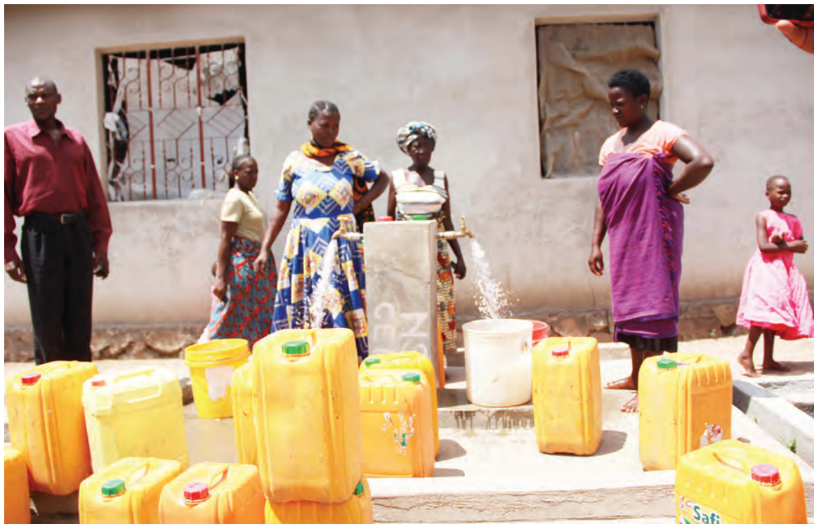
Baadhi ya wanawake wa kata ya Lubugu, Wilaya ya Magu, mkoani Mwanza, wakichota maji safi na salama katika moja kati ya vituo 30 vya maji vilivyo katika mradi wa Nsolabubinja, unaotoa huduma hiyo kwa vijiji vitatu vya kata hiyo, uliojengwa chini ya miradi ya Wakala wa Maji Safi na Usafi wa Mazingira Vijijini (RUWASA) wilayani humo juzi.

“Watu wakishapata uelewa kuhusu umuhimu wa kulipa kodi, wakijua kwani wanalipa kodi, hawataisumbua serikali kwa sababu watakuwa wanajua