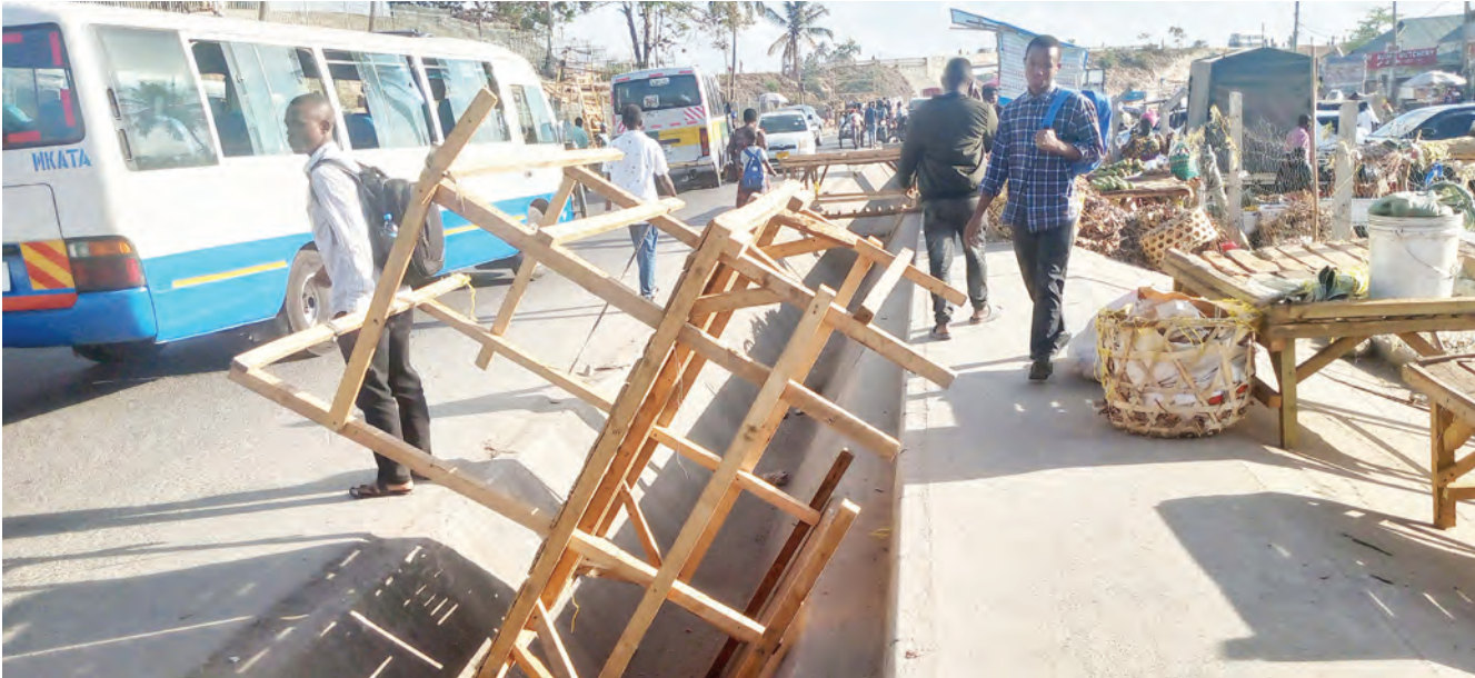
Machinga wakiwa wameacha meza ndani ya mtaro wa maji ya mvua, Mbezi Mwisho, Manispaa ya Ubungo, mkoani Dar es Salaam jana, huku wengine wakiwa wameweka biashara zao kwenye njia ya waenda kwa miguu, kitendo kinachosababisha usumbufu.