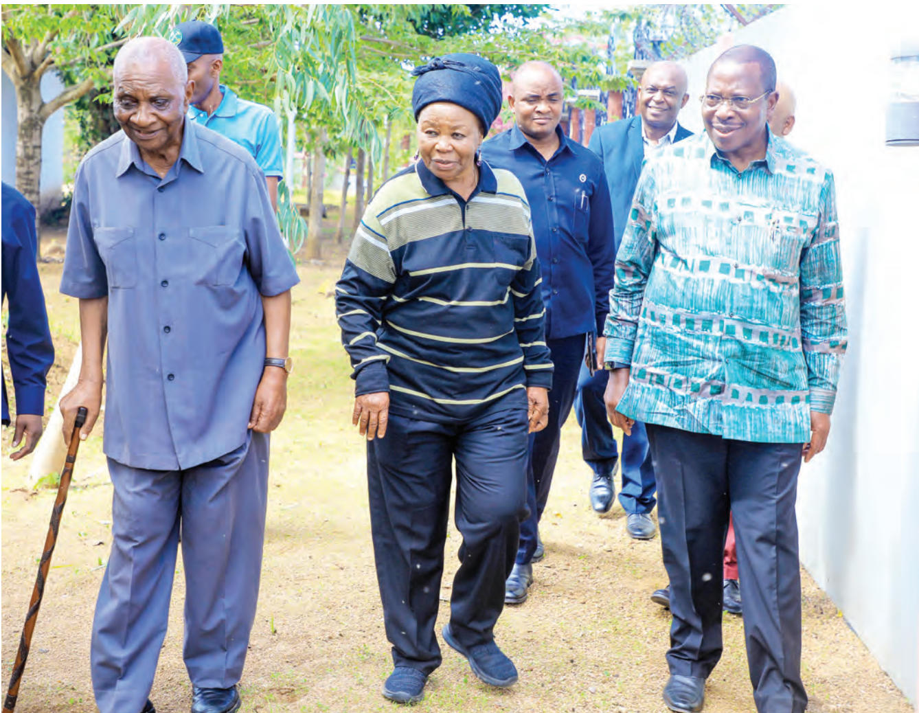
Makamu wa Rais, Dk. Philip Mpango akiongozana na Spika wa Bunge mstaafu Mzee Pius Msekwa (kushoto) na mkewe Anna Abdallah (katikati), baada ya kuwasili nyumbani kwake Wilaya ya Ukerewe, mkoani Mwanza, kwa ajili ya kumjulua hali, akiwa katika ziara wilayani humo jana.