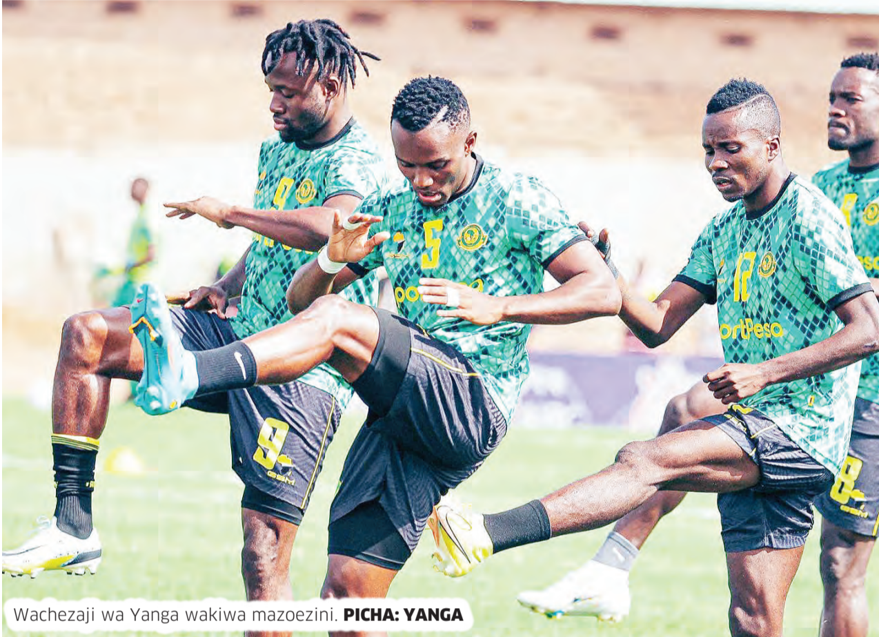
Wachezaji wa Yanga wakiwa mazoezini.