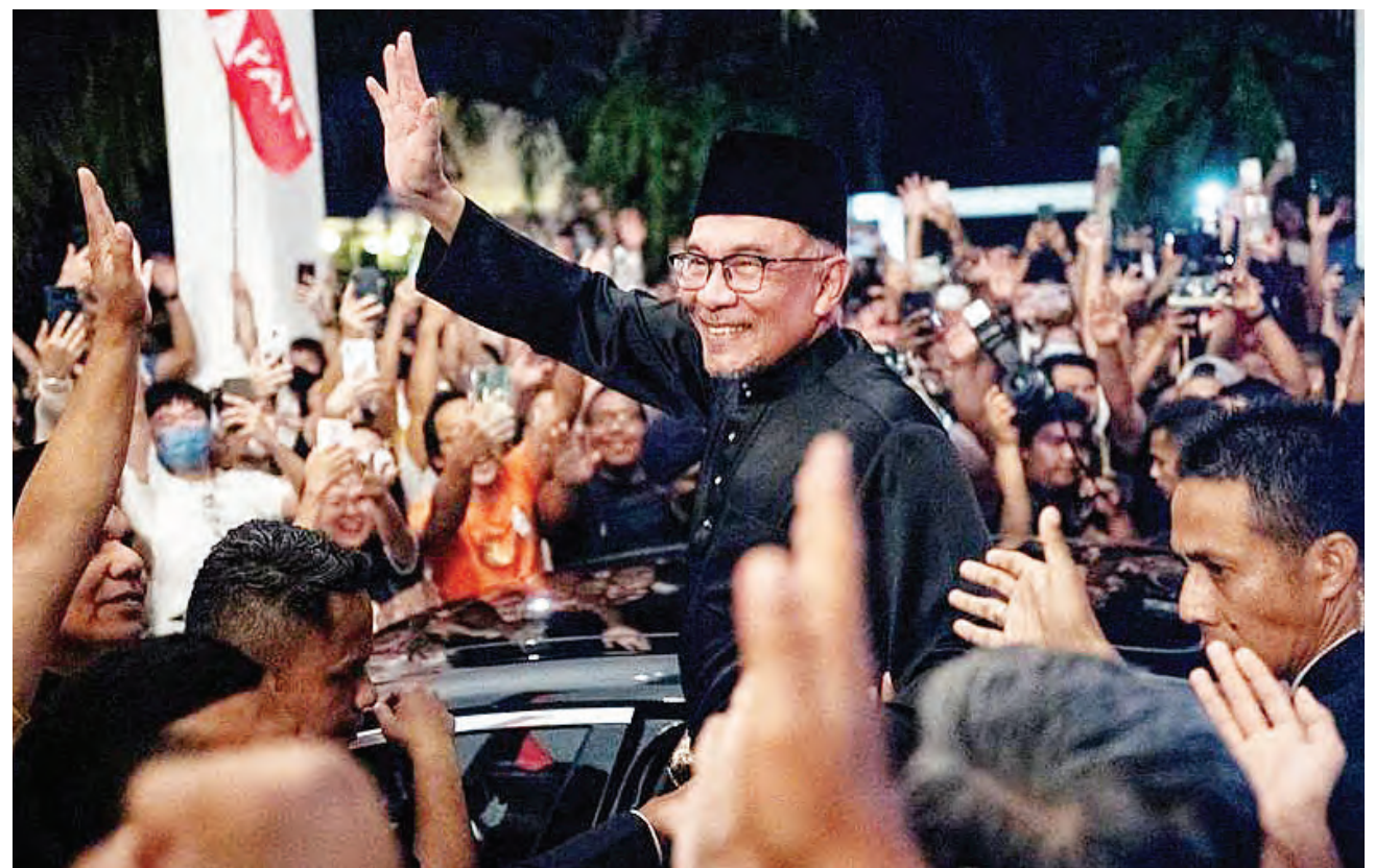
Waziri Mkuu mteule wa Malaysia, Anwar Ibrahim akiwapungia mkono wafuasi wake baada ya mkutano wake na waandishi wa habari mjini Sungai Long, Selangor, Malaysia.