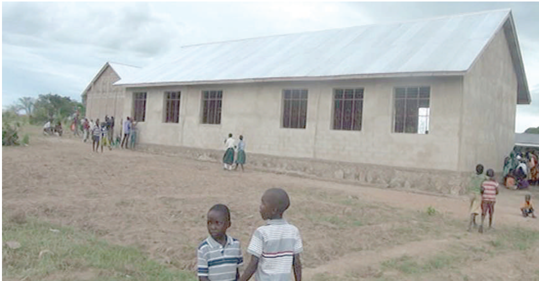
Shule ya Sekondari ya Kata Buhumbi, wilayani Magu.

walitembea umbali wa kilomita 38, kwenda shuleni na kurudi nyumbani, huku mazingira ya usafiri yakiwa siyo rafiki, kuvuka mto na mvua kunyeshewa wakati wa masika ilikuwa ni kawaida kwao.