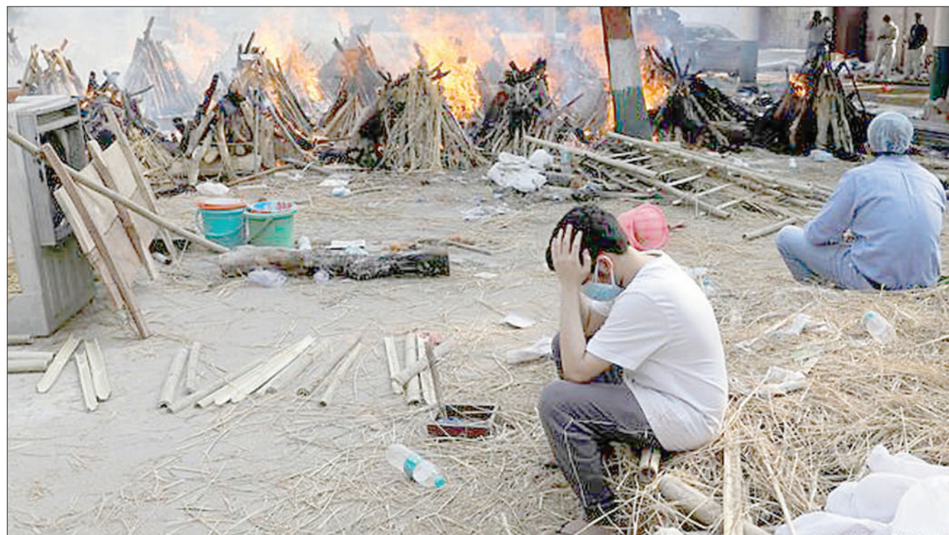
Wafanyakazi wa matanuri ya kuchomea maiti wakiwa wameelemewa na wimbi kubwa la watu wanaohitaji huduma hiyo kwa wapendwa wao waliofariki kutokana na mlipuko wa ugonjwa wa corona nchini India jana.