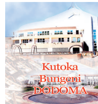
Habari zote na Augusta Njoji, DODOMA

wote wa mamlaka za serikali za mitaa nchini kutumia fursa hiyo kwa wale wenye uwezo wa kuajiri ili kutumia fursa hiyo ya kuajiri," alisema.