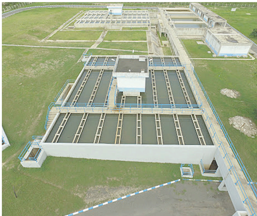
Mtambo wa maji wa Ruvu Juu.

neo mbalimbali hususan kwenye maeneo ya mijini.