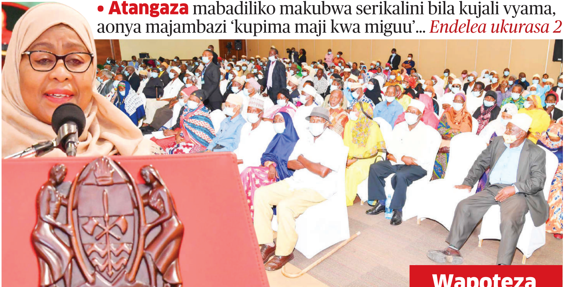
Rais Samia Suluhu akizungumza na wazee wa Mkoa wa Dar es Salaam, Ukumbi wa Mlimani City, jana.

• Atangaza mabadiliko makubwa serikalini bila kujali vyama, aonya majambazi 'kupima maji kwa miguu'... Endelea ukurasa 2