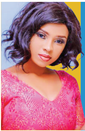
LULU DIVA ARINGIA URITHI WA MAMA Uk.12