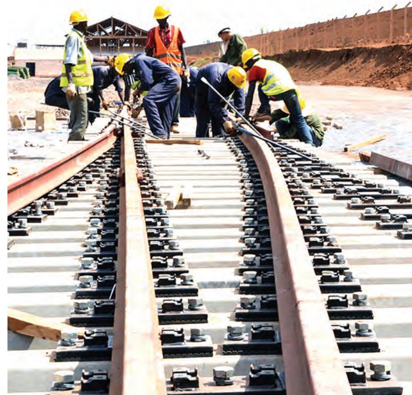
Reli ya kisasa ya SGR ikikamilika inaweza kuwa na tija zaidi iwapo bandari zitakuwa zinafanyakazi kwa ufanisi na teknolojia ya kisasa.

Ni kuhoji ufanisi na uwezo wa kutendaji wa mamlaka hiyo, na kutumia mtandao wa uchukuzi (logistics) ambao unatumia na kampuni hiyo, mfumo wa mawasiliano na vyombo vya usafirishaji