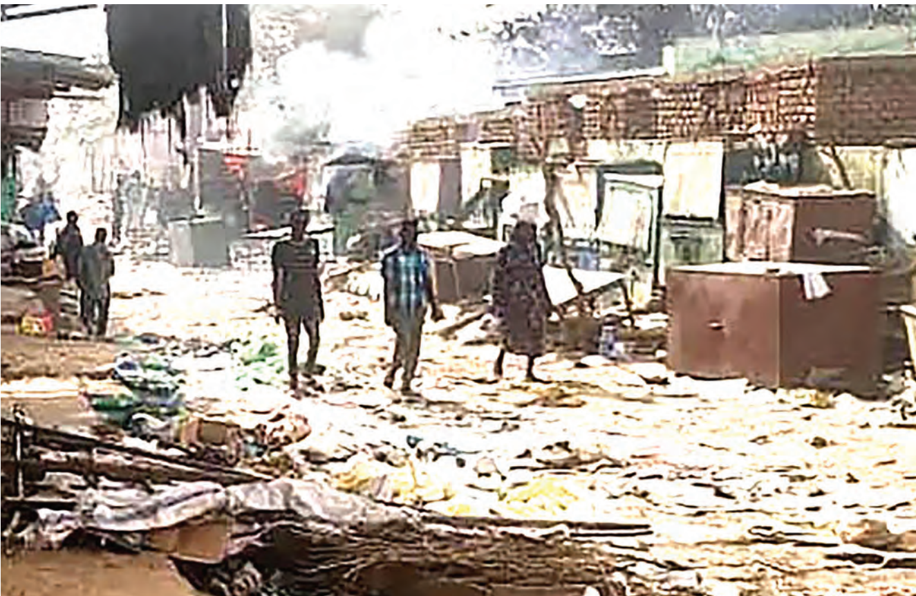
Baadhi ya wakazi wakipita karibu na nyumba zilizobomoka kutokana na mapigano yanayoendelea nchini Sudan.

Kadhia hiyo ilitokea kati ya tarehe 20 na 21 mwezi uliopita karibu na mji mkuu wa Darfur wa EL-Geneina.