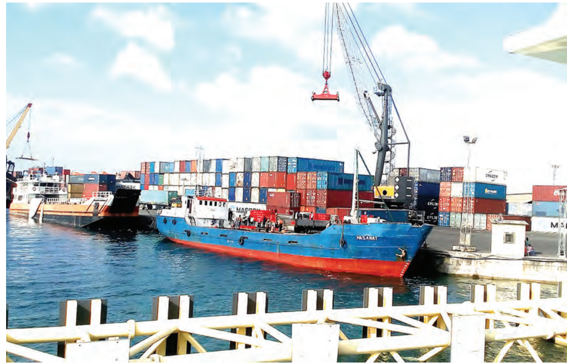
Bandari 'mama' ya Dar es Salaam inayotegemewa na nchi za Maziwa Makuu.

Kwa mfano mzigo ukitoka China lazima ukabidhiwe kwa mda wa bandari ya Dar, ukifika ushushwe, upeleke bandari kavu na kote huko yako makaratasi ya kujazwa, na kulipiwa. DP World