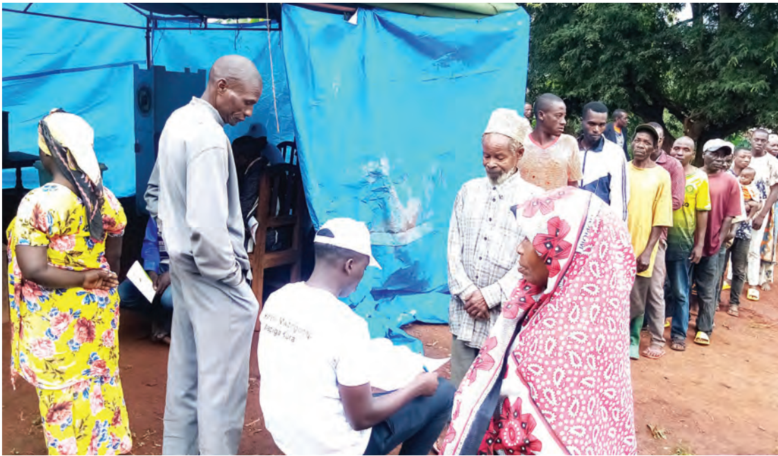
Wakazi wa Kitongoji cha Bwiti, Kijiji cha Kimbo, Kata ya Potwe, wilayani Muheza mkoani Tanga, wakiwa wamepanga foleni kwa ajili ya kupiga kura za kumchagua diwani wa kata hiyo, kwenye uchaguzi mdogo jana.

“Mfano, mfumo unatakiwa wa kidijitali maana tuko nchi mbalimbali hatuwezi kuwasiliana kwenye makaratasi... mapendekezo yakikubaliwa, vipaumbele vitawekwa na tutakwenda kwenye utekelezaji,” alisema Tukai.