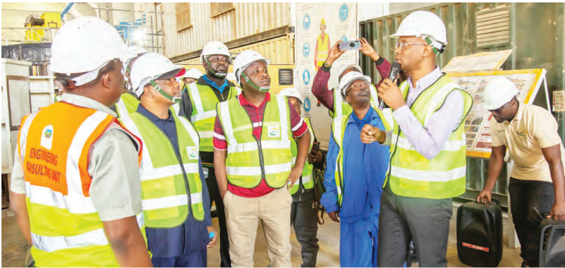
Waziri wa Nishati, January Makamba, akiwaeleza viongozi wa Kanisa la Pentekoste kuhusu mradi wa Bwawa la Mwalimu Nyerere.