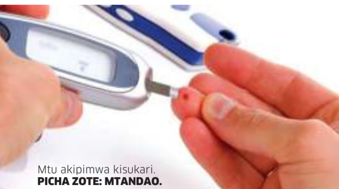
Mtu akipimwa kisukari.