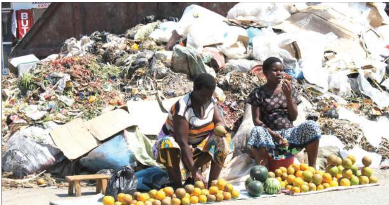
Ujasiriamali ukiendelea katika mazingira yaliyo machafu.

Katika utetezi wake huo, kondakta alisema yeye na dere-