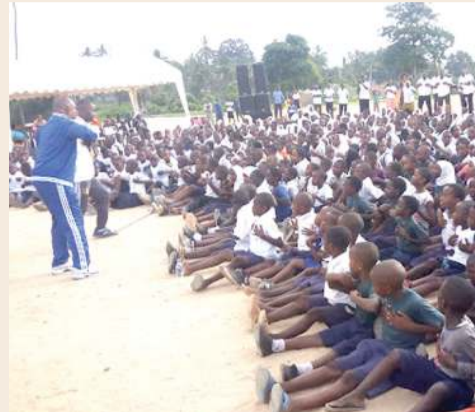
Wanafunzi wakielimishwa wanayopaswa kujua kuhusu ugonjwa wa kisukari.

“Kasi ya watu kuugua magonjwa yasiyo ya kuambukiza imeongezeka kwa kiwango kikubwa katika miaka ya karibuni na hali inaonyesha kuwa kwa sasa yanasababisha vifo vingi kuliko magonjwa ya kuambukiza,” anasema Nchimbi. Anayataja magonjwa mengine yasiyo ya kuambukiza, mbali na kusukari ni shinikizo la damu, maradhi ya moyo, selimundu, kiharusi, pumu na matatizo ya kinywa. Nchimbi alieleza dhamira ya uelimishaji kuhusu namna ya kujikinga na magonjwa yasiyo ya kuambukiza. Hapo anagusia umma kubadili tabia za ulaji vyakula vyenye mafuta mengi, sukari na wanga. Meneja Mradi wa Ugonjwa wa Kisukari kwa