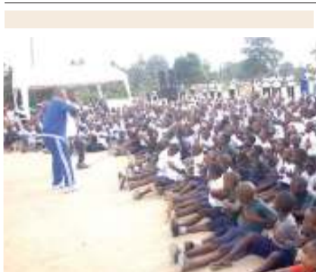
Wanafunzi wafuatwa waliko kupewa darasa la kisukari