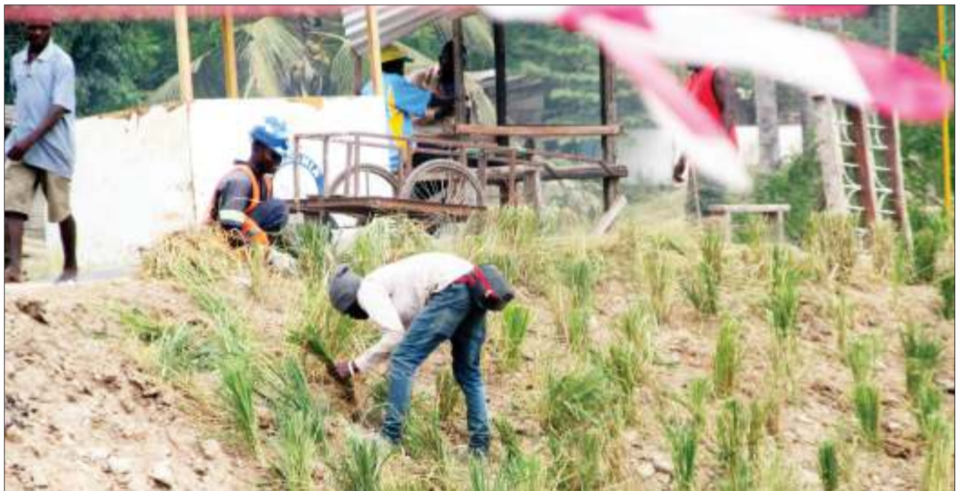
Wafanyakazi wa kampuni zinazopanua barabara ya Morogoro, wakipanda nyasi kwa ajili ya kuzuia mmomonyoko wa ardhi eneo la Kimara Suka jijini Dar es Salaam jana.

Alisema kikosi kazi hicho kilikuwa kinaongozwa na wataalamu wa fedha wa halmashauri hiyo na ndiyo maana wamefanikiwa kukusanya vizuri mapato hayo hasa yanayohusiana na mapato yatokanayo na ushuru wa huduma.