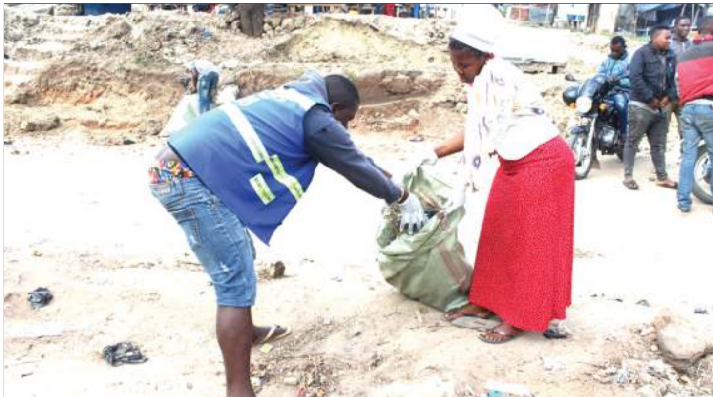
Wakazi wa Mbezi Mwisho, Dar es Salaam, wakishiriki Siku ya Usafi Duniani, kwa kusafisha mazingira yao.

nchi nyingine zaidi ya 60 duni-ani, zikiwamo majirani wa Kenya na Rwanda, pia ughaibuni; China, Italia na Ufaransa.