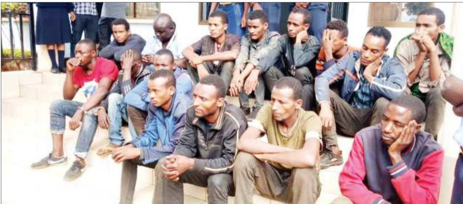
Wahamiaji haramu kutoka nchini Ethiopia waliokamatwa katika pori la kijiji cha Lugono wilayani Mvomero mkoani Morogoro, pamoja na waliokamatwa kwa tuhuma za kuwasafirisha wahamiaji hao wakiwa chini ya Askari wa Kikosi cha Uhamiaji mkoani humo.

"Uzoefu unaonyesha kuwa mwombaji mikopo anaweza kutumia dakika 30 kukamilisha maombi yake katika mfumo ikiwa ana nyaraka zote muhimu," Badru alisema.