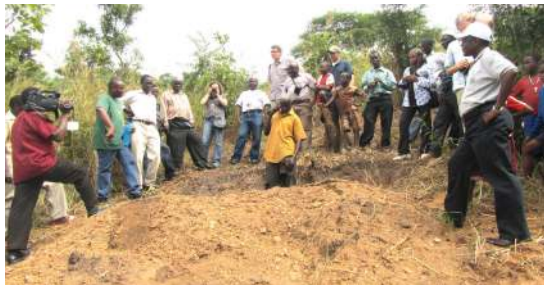
Mmoja wa wachoma mkaa katika kijiji cha Msimba Wilaya ya Kilosa, akionyesha matanuri ya asili ya kuchoma mkaa yanavyofanya kazi.

“Nashauri kama serikali kupitia wizara husika, kuna inatoa mwongozo kwa halmashauri kutenga bajeti ya USM, kama ilivyofanya kwa vijana, kinamama na wenye ulemavu, ili shughuli za uhifadhi ziendelee kuwa bora Tanzania nzima,” anasema.