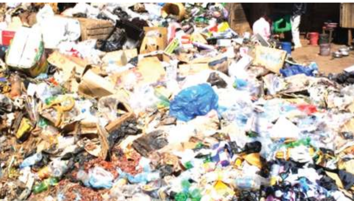
plastiki zilivyosambaa.

Ni mtazamo wote unaoangukia katika dhana ya kuweka jiji katika mazingira ya usafi na kuwa mbali na magonjwa.