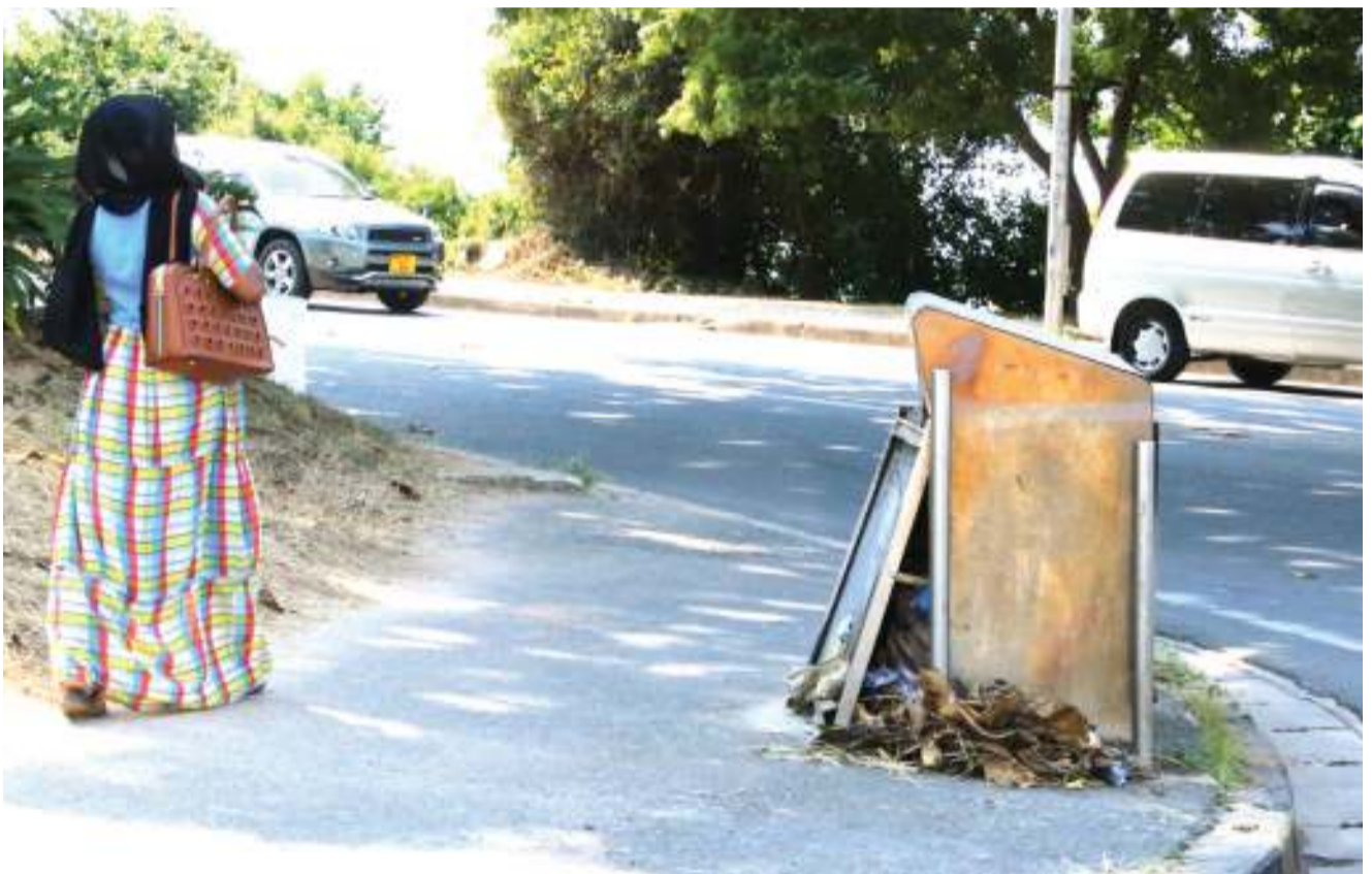
Mkazi wa jijini la Dar es Salaam, akipita karibu na boksi la takataka lililowekwa kwenye makutano ya Barabara ya Kenyatta na Kinondoni ambalo halijazolewa kwa muda mrefu.