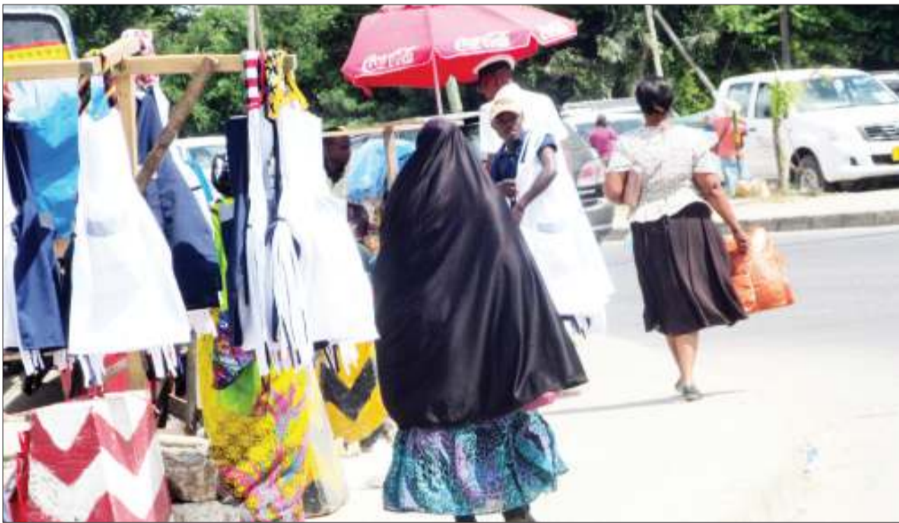
Wakazi wa jijini Dar es Salaam wakipita kwenye njia ya waenda kwa miguu eneo la Mwenge, ambalo hata hivyo, sehemu ya njia hiyo imevamiwa na wamachinga.