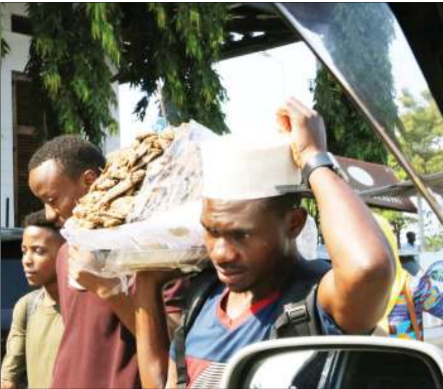
Muza samaki wa jijini Dar es Salaam akitembeza bila ya kufunika ili kuzuia vumbi na wadudu kutua juu yake na kusababisha maradhi kwa wateja.