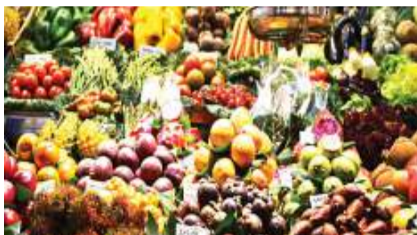
TFDA inavyopigana kumnusuru mlaji kutoka chakula chenye hatari ya sumu