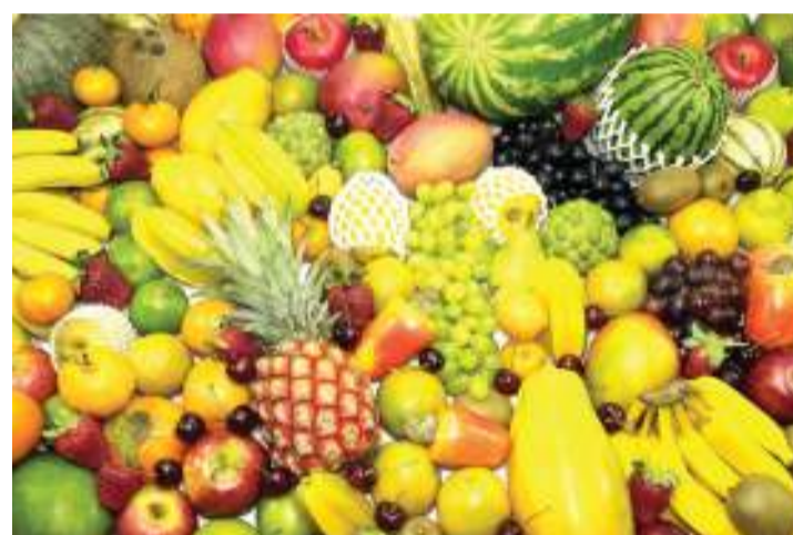
Baadhi ya vyakula vinavyoshauriwa kulinda mwili dhidi ya maradhi ya kisukari.

‘food poison.’ Mara zote, msongo wa mawazo, kukosa muda wa kupumzika, ulevi wa pombe, uvutaji sigara uliopitiliza kiasi, kutofanya mazoezi ya vingi na mwili kwa ujumla, vyote vinasababisha kongosho kushindwa kuzalisha kichocho cha insulin na kuleta kisukari.