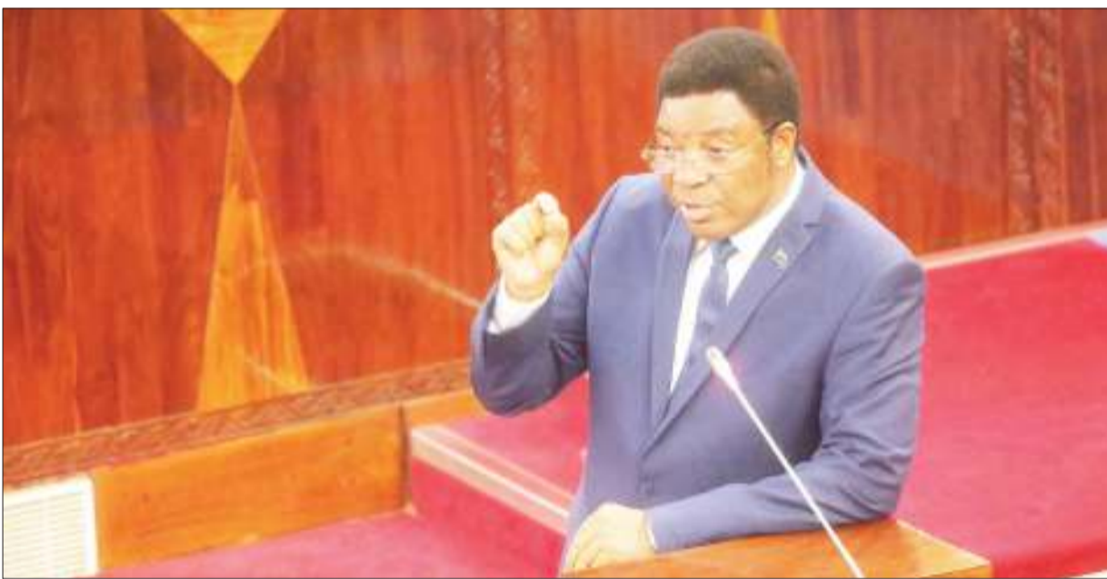
Waziri Mkuu, Kassim Majaliwa, akitoa tamko la serikali kuhusu kauli ya Mbunge wa Starehe nchini Kenya, Charles Kanyi Njagua maarufu kwa jina la Jaguar, bungeni jijini Dodoma, juzi.

“Mpaka sasa waathirika nane wamefidia kiasi cha Sh. milioni 12.8 kwa mradi wa Wasso-Sale kilometa 49. Katika mradi wa Makutano-Sanzate kilometa 50 wananchi waliolipwa fidia ni watu 433 kwa jumla ya Sh. milioni 2,608.5,” alisema.