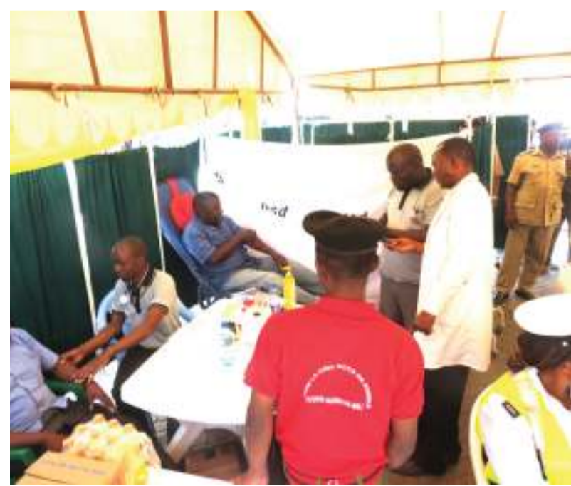
Kilniki ya kisukari ikiendelea katika hospitali kuadhimisha Siku ya Kisukari Duniani.

ATHARI ZINGINE Ugonjwa wa kisukari, mbali na athari za kiafya, pia zina athari mbalimbali katika sura ya uchumi binafsi kwa mgonjwa na katika sura pana, inagusua maendeleo ya Taifa. Kitaalamu imethibitika kwamba, endapo mgonjwa hajajua jinsi ya kudhibiti ugonjwa wa kisukari,