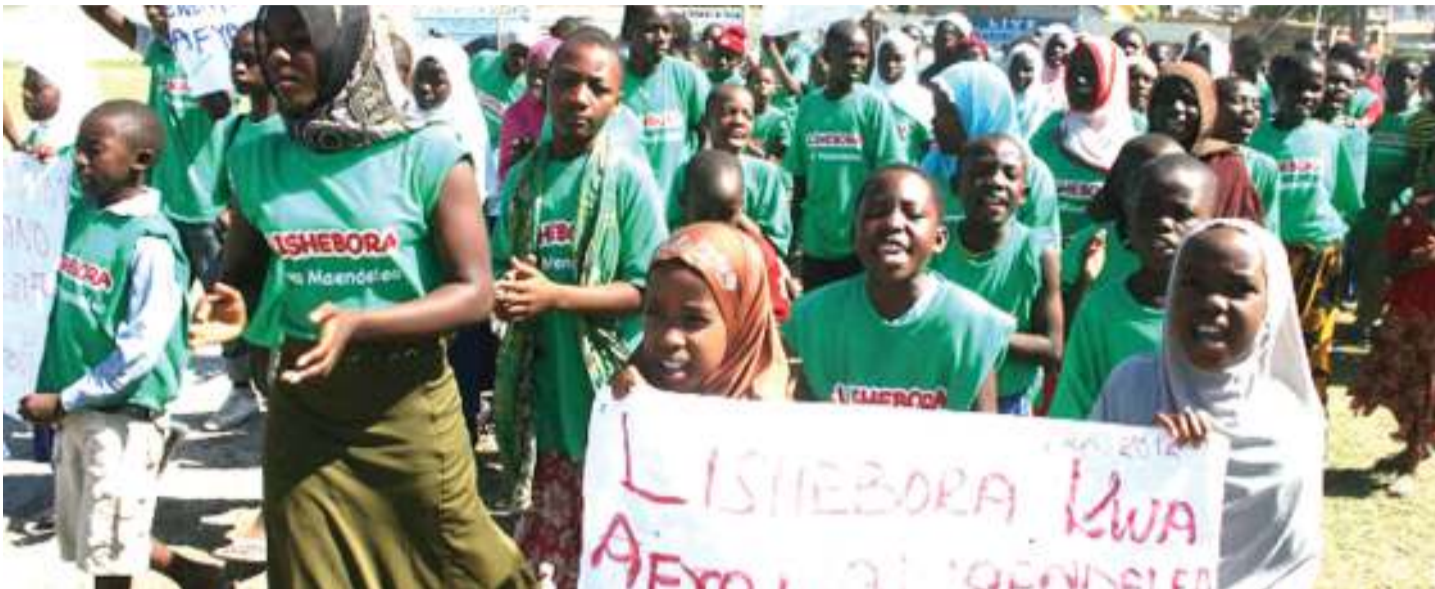
Baadhi ya wadau wa lishe bora wakiandamana.