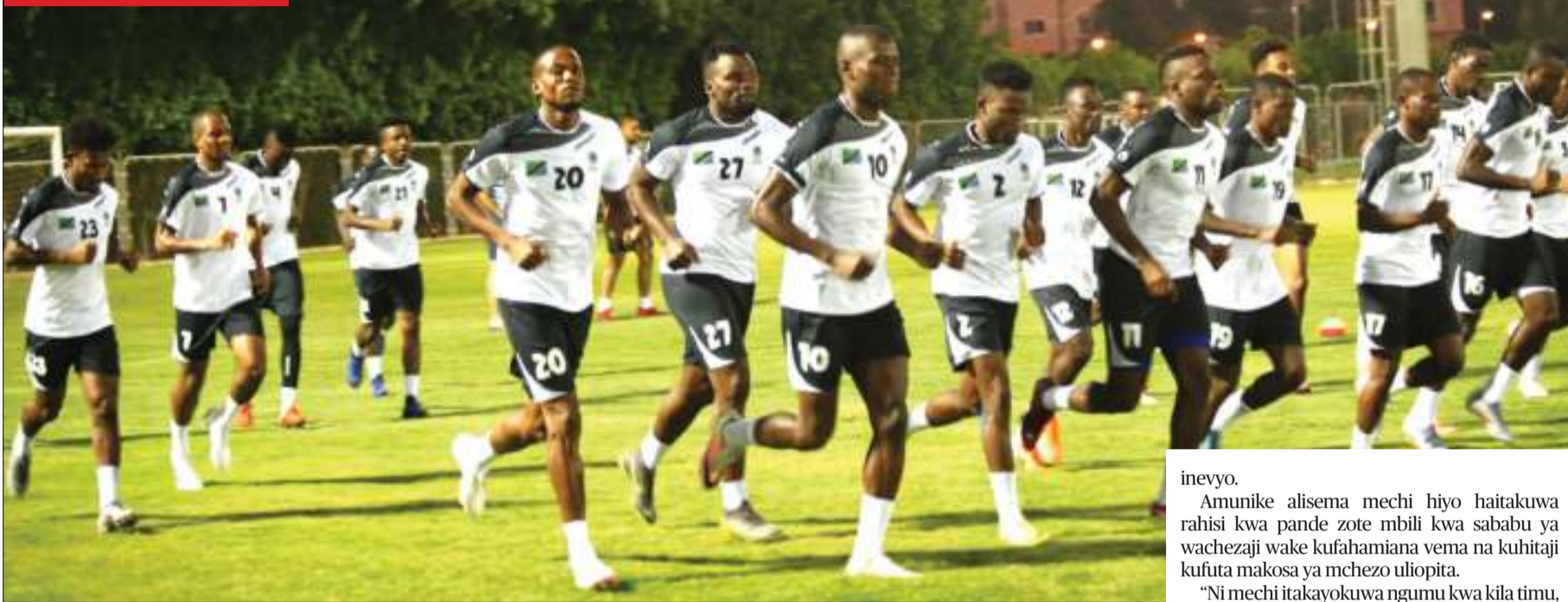
Wachezaji wa Taifa Stars wakiwa mazoezini jana kwenye Uwanja wa Petrosport jijini Cairo, Misri kujiwinda na mechi ya Afcon Kundi C dhidi ya Harambee Stars leo.