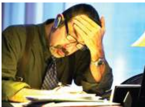
Mtu akiwajibika.