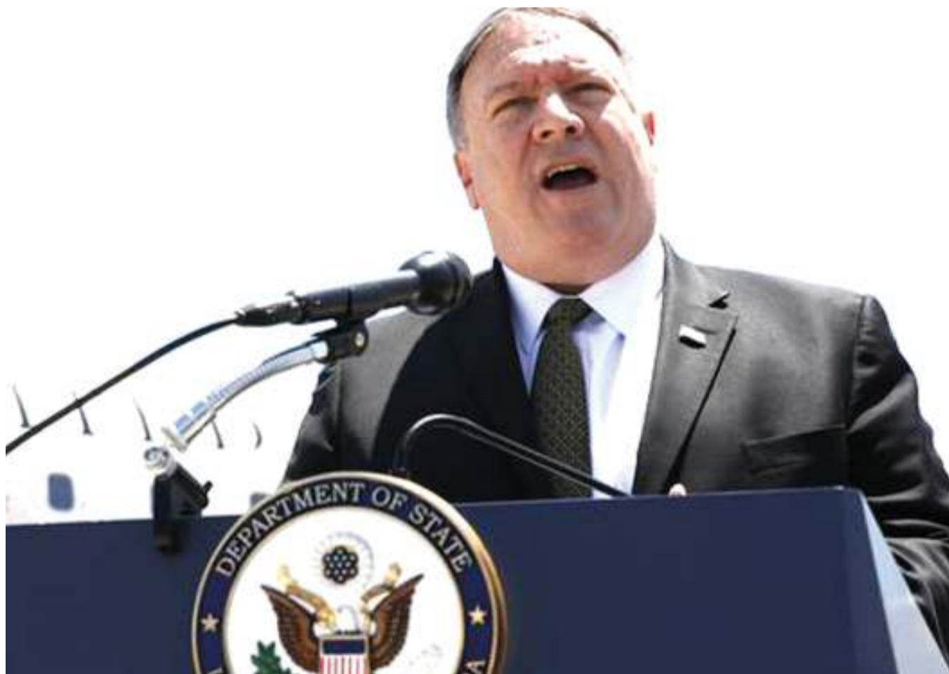
Waziri wa Mambo ya Nje wa Marekani, Mike Pompeo ambaye kwa sasa yupo India kwa mazungumzo na Waziri Mkuu wa nchi hiyo, Narendra Modi, katika juhudi za kulinda uhusiano kati ya mataifa hayo.