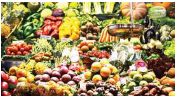
Sehemu ya vyakula vinavyochangia lishe bora.

malengo yanayojikeleza katika kuondoa umaskini, kutokomeza njaa na kulinda afya ya jamii na ustawi wake.