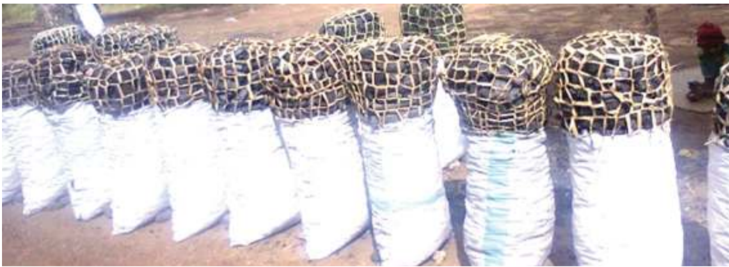
Mkaa uliozalishwa.

fanya maamuzi, watakuwa na uelewa kuhusu USM, ni dhahiri kuwa misitu itakuwa salama na kuchangia maendeleo.