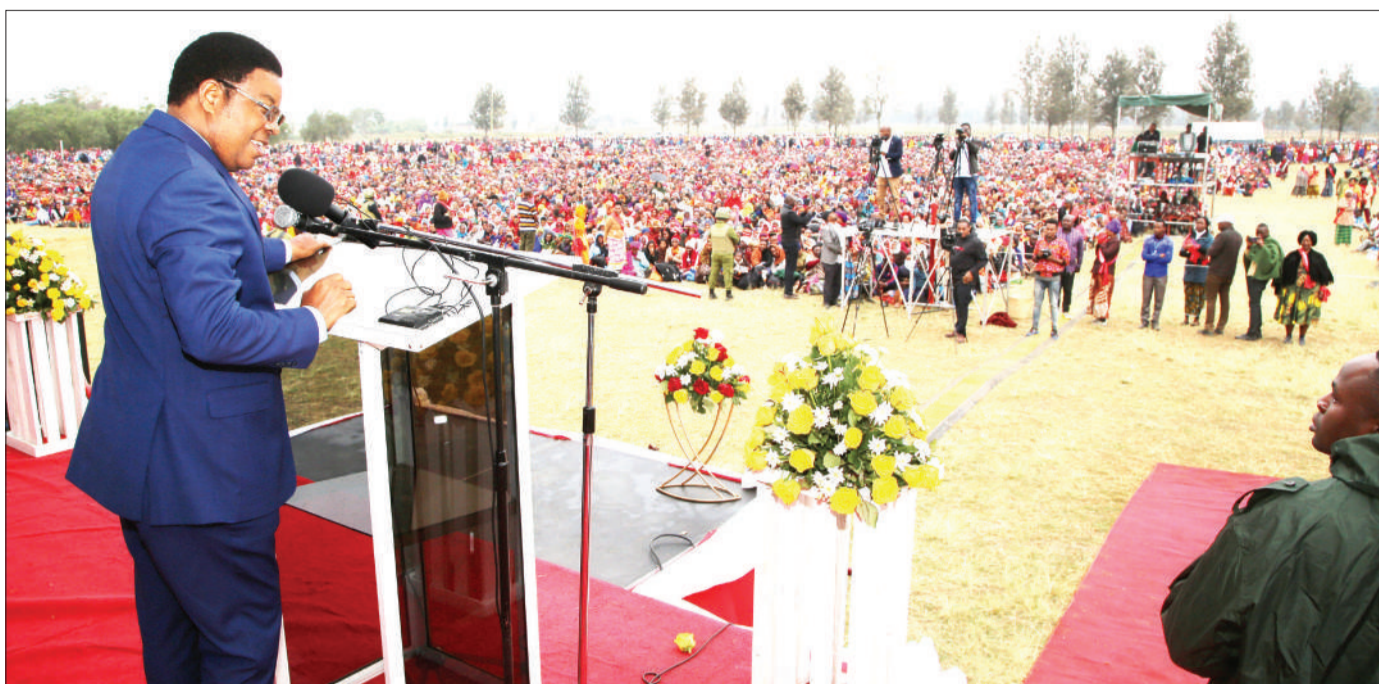
Waziri Mkuu, Kassim Majaliwa, akizungumza katika kongamano maalum lililoandaliwa na Kituo cha Radio cha Safina la kuliombea Taifa katika uwanja wa Magereza, Kisongo jijini Arusha jana.