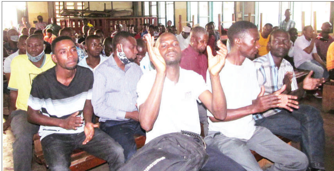
Wafanyakazi wa kiwanda cha kutengeneza mabomba cha Tanzania Steel Pipes Limited (TSP), ambao ni wana-chama wa Chama cha Wafanyakazi wa Viwanda, Biashara, Taasisi za Fedha, Huduma na Ushauri (TUICO), tawi la kiwanda hicho, wakiwa katika mkutano wa kujadili mambo mbalimbali yanayohusu maslahi yao, jijini Dar es Salaam juzi.