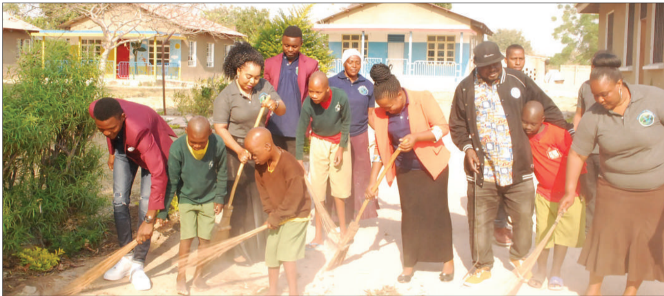
Umoja wa vijana wa soko la Sabasaba wakishirikiana kufanya usafi wa mazingira na watoto wenye mahitaji maalum wa kituo cha Cheshire kilichopo Miyuji jijini Dodoma jana.

"Kwa niaba ya kituo nitoe shukrani zetu za dhiti na kuwaomba isiwe mwisho na watu wengine wajitokeze kuiga mfano huu, ili kutusaidia watoto kwani tunamahitaji mengi sana kama chakula, sabuni na mavazi," alisema James.