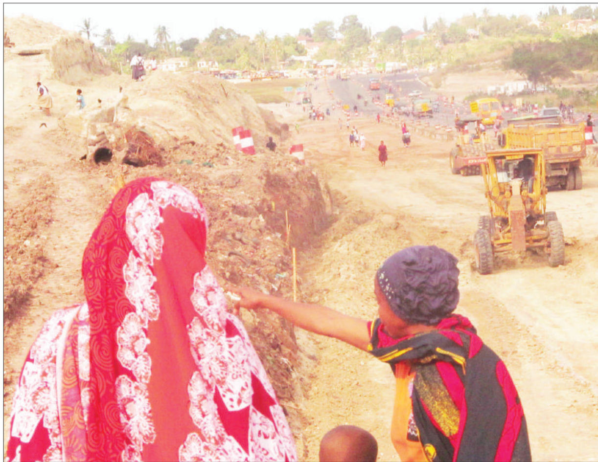
Wakazi wa Mbezi Mwisho jijini Dar es Salaam wakiangalia kazi ya upanuzi wa barabara ya Morogoro kwa ajili ya kupunguza msongamano wa magari ikiendelea juzi.

Aidha, aliwataka wanafunzi hao kuwa makini na kila wanachorusha kwenye mitandao ya kijamii, na badala yake watumie kufanya mambo ambayo yatawaongezea thamani kitaaluma na kulinda utu wao.