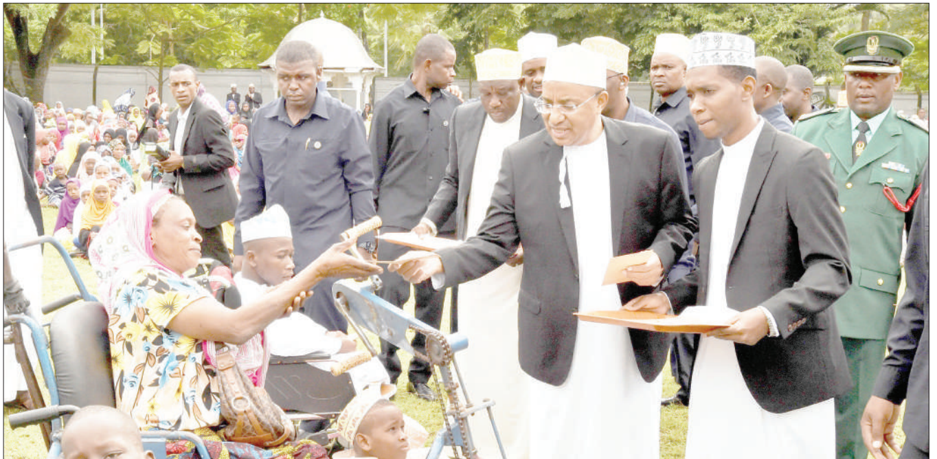
Rais wa Zanzibar na Mwenyekiti wa Baraza la Mapinduzi, Alhaj Dk. Hussein Ali Mwinyi, akitoa mkono wa Eid El Fitri kwa wananchi waliotoka katika viwanja vya Ikulu, jijini Zanzibar jana.