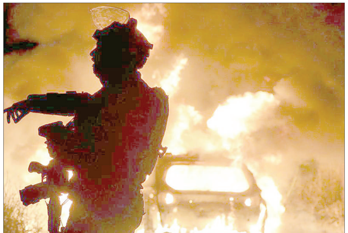
Polisi akishuhudia gari likiwaka moto baada ya kushambuliwa na Wapalestina katika mji wa Jerusalem.

Waziri mkuu wa Israel, Benjamin Netanyahu, alituma ujumbe wa twitter akisema mashirika ya kigaidi katika eneo la Gaza yalivuka mpaka mwekundu na kuahidi Israel itajibu kwa uwezo mkubwa.