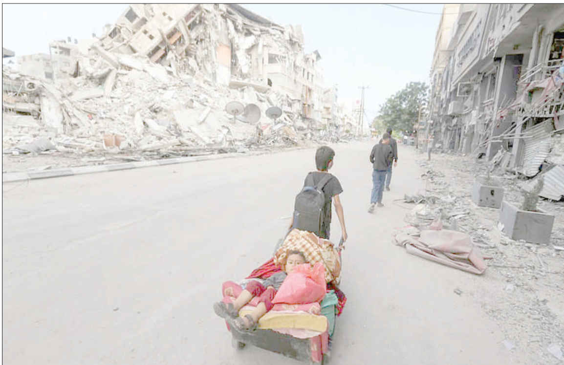
Kijana wa Kipalestina akiendesha mkokoteni uliobeba vitu na mdogo wake wakati wakiyahama makazi yao kufuatia mashambulizi ya angani yanayofanywa na Israel na kusababisha majengo, nyumba kuharibiwa vibaya, mjini Gaza, jana.