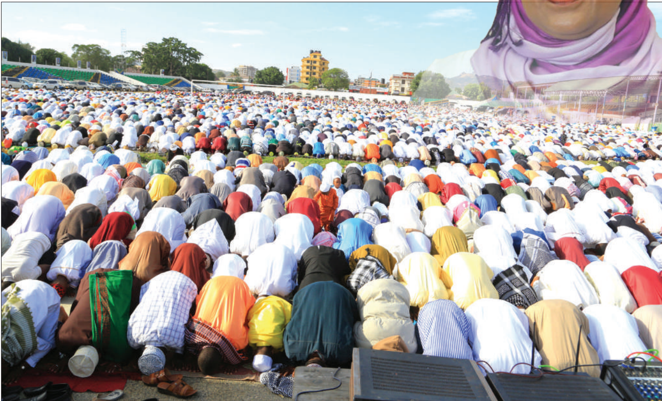
Waumini wa dini ya Kiislam wakishiriki swala ya Eid El Fitri, katika Uwanja wa Jamhuri, jijini Dodoma jana.