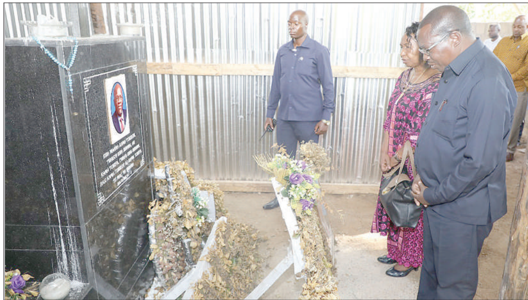
Makamu wa Rais, Dk. Philip Isdor Mpango, akizuru kaburi la aliyekuwa Rais wa Jamhuri ya Muungano wa Tanzania, Hayati Dk. John Magfuli, aliposimama kwa muda wilayani Chato, akiwa njiani akielekea wilayani Kibondo, mkoani Kigoma jana, kwa ajili ya kufunga kampeni za ichaguzi mdogo wa ubunge za CCM za Jimbo la Muhambwe, unaotarajiwa kufanyika kesho.

Aliyataja maridhiano ya kisiasa yaliyofikiwa ya-meondosha siasa za chuki na uhasama na sasa wananchi kuunganisha nguvu na umoja kwa ajili ya kujenga Zanzibar yenye neema nyingi.