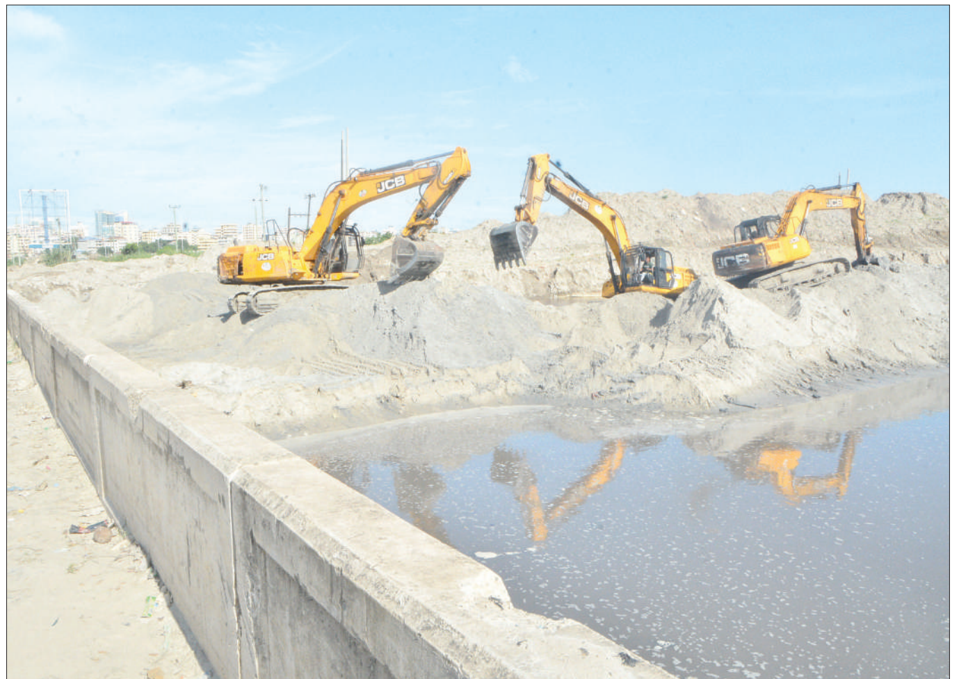
Upanuzi na utoaji mchanga uliojaa ukiendelea ili kurahisisha maji kupita kwa urahisi kwenye Mto Msimbazi, eneo la Jangwani, jijini Dar es Salaam mapema wiki hii.

Alisema umeme unaozalishwa kutoka katika Mini-grid ya Kigoma una faida kubwa kimazingira kwa kuwa unapunguza matumizi ya umeme wa mafuta ambayo gharama yake ni kubwa na kupongeza uongozi wa Mkoa wa Kigoma kwa kutumia Green Power.