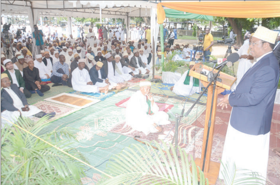
Waziri Mkuu Kassim Majaliwa, akiwahutubia waumini wa Dini ya Kiislamu wakati wa swala ya Eid El Fitri, katika viwanja vya Mnazi Mmoja, jijini Dar es Salaam jana.