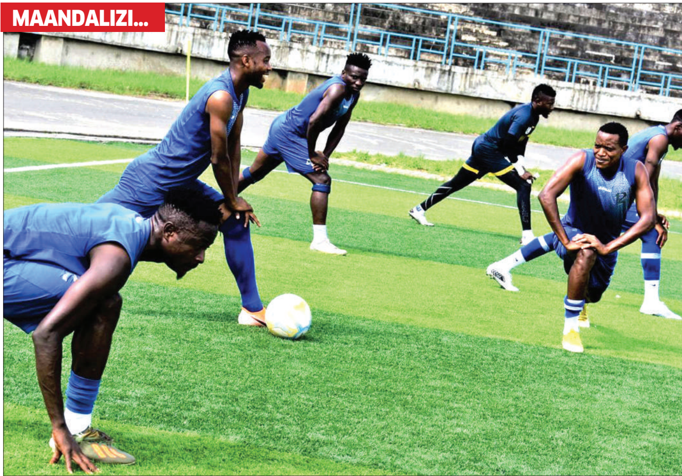
Wachezaji wa timu ya KMC FC, wakifanya mazoezi katika Uwanja wa Uhuru jijini Dar es Salaam juzi, kujiandaa na mchezo wa Ligi Kuu Bara dhidi ya Azam FC utakaopigwa leo katika Uwanja wa Chamazi, Dar es Salaam.