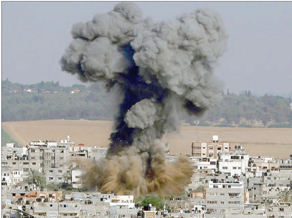
Mlipuko wa bomu katika makazi ya Wapalestina baada ya ndege za Israel kushambulia.

Msikiti wa Al Aqsa unatambuliwa na dini za Kiyaudi na Kiislamu kama