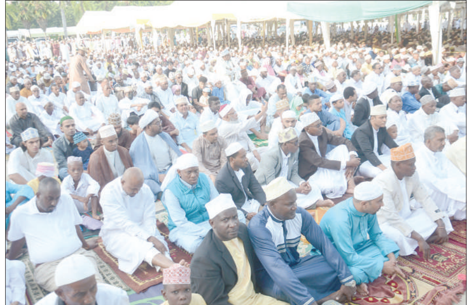
Waumini wa Dini ya Kiislamu, wakiwa katika swala ya Eid El Fitri, katika viwanja vya Mnazi Mmoja, jijini Dar es Salaam jana.