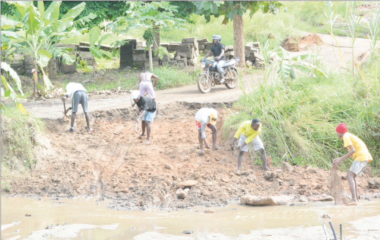
Vijana wakijitolea kutengeneza barabara ili watu wapite kwa urahisi katika Mto Tegeta, eneo la Goba jijini Dar es Salaam juzi.