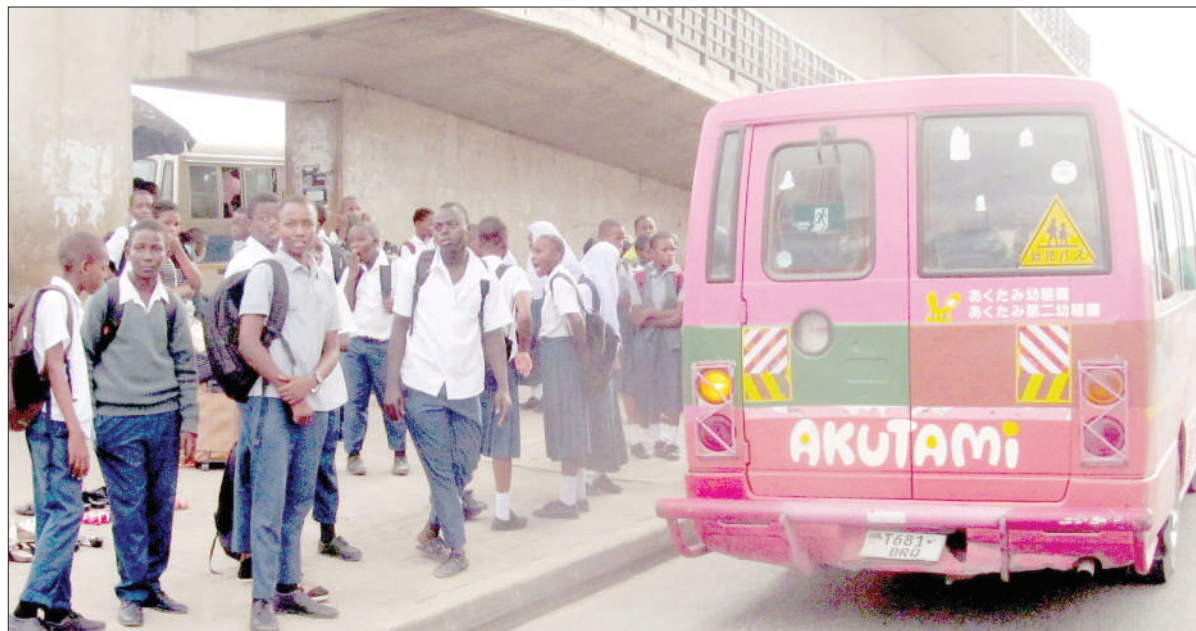
Wanafunzi wak- isubiri usafiri katika kituo cha daladala cha Kimara Mwisho, Barabara ya Morogoro, jijini Dar es Salaam mapema wiki hii. Baadhi ya makondakta na madereva wamekuwa wak- iwaacha vituoni na kusababisha wachelewe kufika shuleni au nyumbani.

Waziri Mkenda alisisitiza kuwa mazao ya Tanzania hususani mahindi na bidhaa nyingine ni salama, kwani kabla bidhaa haijasafirishwa nje ya nchi, mamlaka husika kama Shirika la Wiwango (TBS), hufanya vipimo kuhakikisha viwango vina-vyohitajika sokoni vimekidhi.