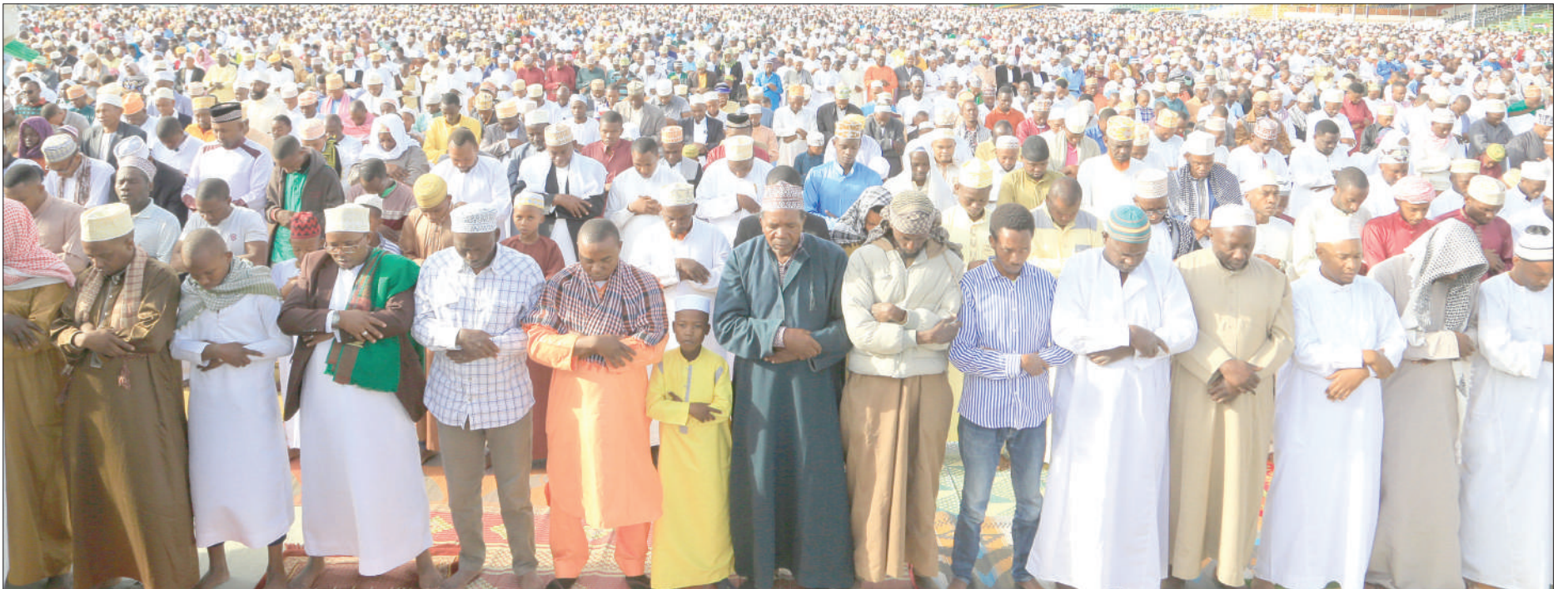
Baadhi ya waumini wa Dini ya Kiislamu, wakishiriki Swala ya Eid El Fitri, katika Uwanja wa Jamhuri, jijini Dodoma jana.