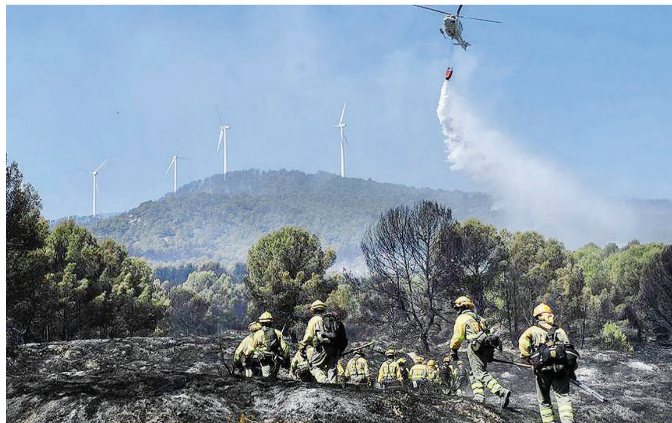
Helikopta zikisaidia zoezi la kupambana na moto unaoteketeza Hifadhi ya Taifa ya Moncayo karibu na kijiji cha Borja nchini Uhispania jana.

Alidai kuwa, sheria hizo, ambazo zilitangazwa kwenye gazeti la serikali Aprili 12, 2022, zilikusudiwa kuhakikisha hadhi na uhuru wa mahakama unadumishwa na kwamba nia haikuwa kuondoa uhuru wa kujieleza. BBC