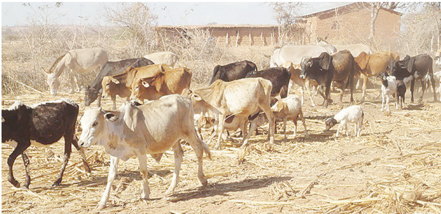
Mazingira ya ukame kama haya yanasababisha mifugo kufa kwa njaa na hata watoto kukumbwa na utapiamlo.

vya jimbo lake vimekumbwa na ukame kikiwamo cha Idonyo-naado, anatoa wito kwa walionu-faika na msaada kutumia kwa kile kilichokusudiwa.