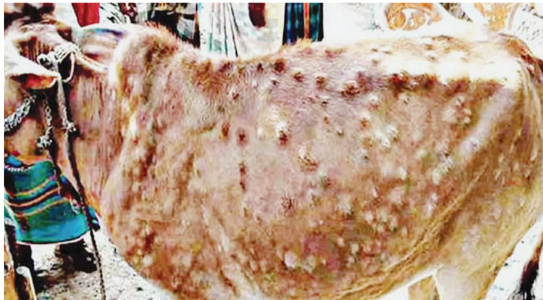
Ugonjwa wa mapele katika ngozi licha ya kuuwa mifugo kwa wingi, chanjo yake ni ya gharama kubwa.

Hanang ina ng'ombe 282,111 inatumia njia mbalimbali kukabiliana na magonjwa ya ngozi ya