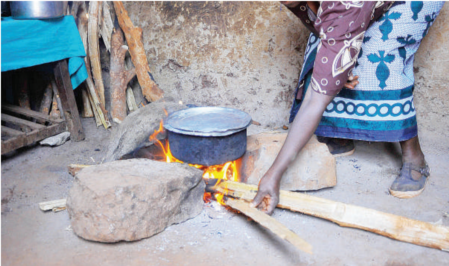
Kuni na mkaa nishati inayotumika kila mahali kupikia chanzo chake ni misitu.