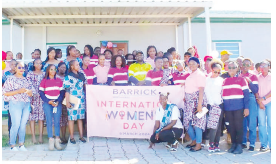
Wafanyakazi Wanawake wa mgodi wa Barrick North Mara wakiwa katika picha ya pamoja baada ya kushiriki zoezi la kukabidhi msaada katika kituo cha kulea watoto cha City of Hope wilayani Tarime katika kuadhimisha Siku ya Wanawake Duniani mwishoni mwa wiki.