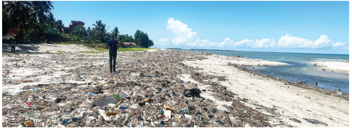
Mwonekano wa sehemu ya ufukwe wa Rainbow, Mbezi Beach, Dar es Salaam.