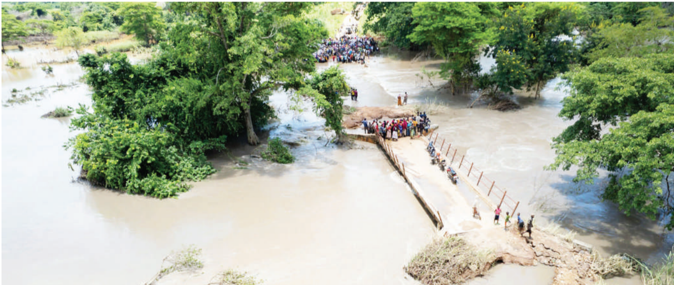
Wananchi wakiwa kwenye daraja eneo la Kibutuka mpakani mwa wilaya ya Liwale na Nachingwea mkoani Lindi mwishoni mwa wiki, wakishuhudia uharibifu wa barabara uliosababishwa na mvua inayoendelea kunyesha mkoani humo.

Kutokana na kuvunja mkataba, mdai aliingia hasara ya Sh. 500,000,000 na hasara nyingine ya Sh. 50,000,000 ambayo ilitokana na kukaribisha wadau mbalimbali wakiwamo wenye hoteli kubwa, fedha walizolipwa na alipoteza biashara na kukosa kipato.