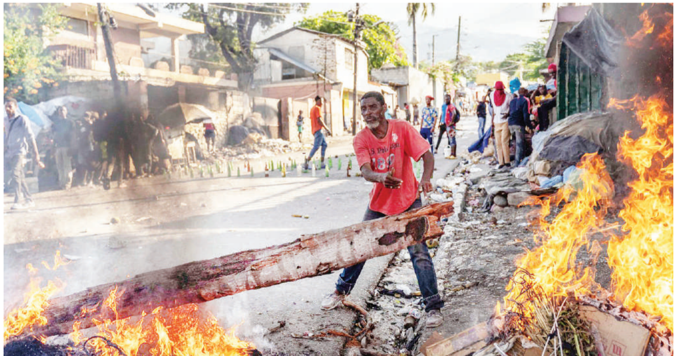
Hali ilivyo nchini Haiti baada ya waandamanaji kuibua machafuko.