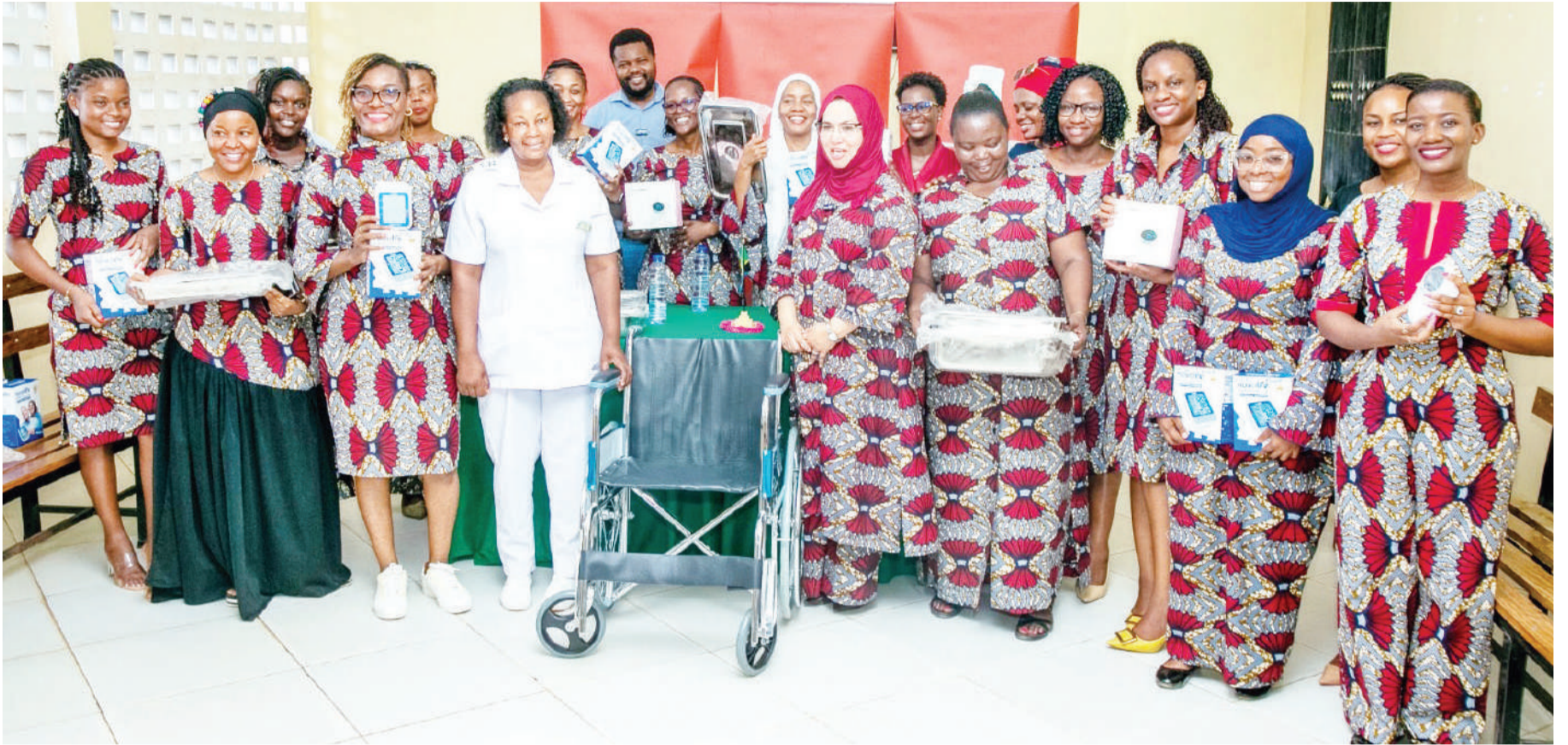
Watumishi wa Kampuni ya Mafuta ya Puma Tanzania wakiwa kwenye picha ya pamoja na viongozi wa hospitali ya wilaya ya Kigamboni huku wakiwa wame-shika vifaa tiba ambavyo kampuni ya mafuta ya Puma Tanzania imekabidhi na kutumika katika wodi ya wanawake ya hospitali ya wilaya ya Kigamboni, jijini Dar es Salaam. Puma wamekabidhi msaada huo leo Machi 8, 2024 wakati wa Maadhimisho ya Siku ya Wanawake.