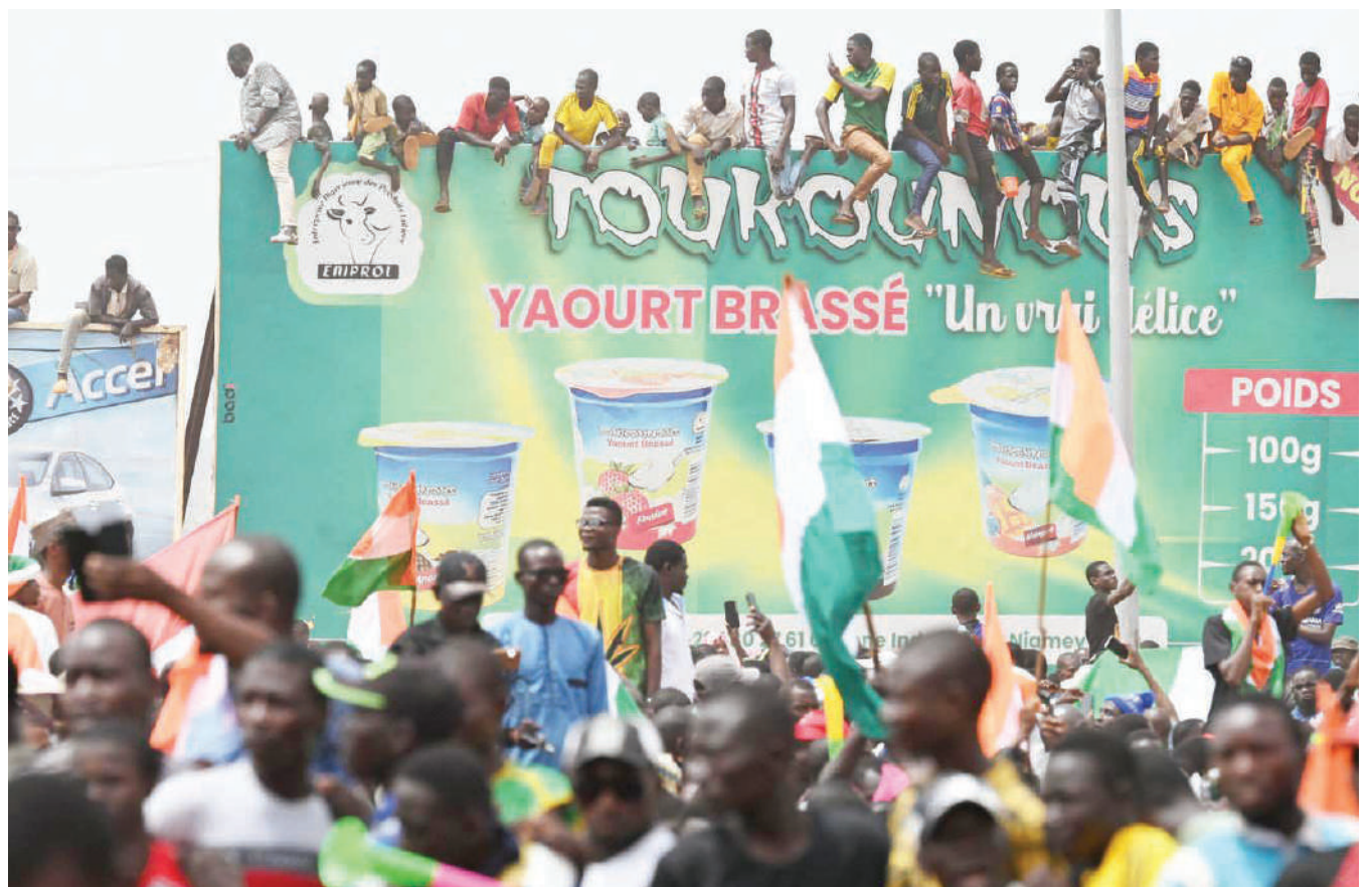
Baadhi ya wananchi nchini Niger wakiwa wamebeba mabango, wengine wakiwa juu ya magari wakishinikiza kuondoka kwa vikosi vya ulinzi vya Ufaransa nchini humo.

Rais huyo mshirika wa Ufaransa ambaye kuchaguliwa kwake kulileta matumaini ya utulivu katika taifa hilo alikamatwa na wajumbe wa kitengo chake cha ulinzi Julai 26. DW