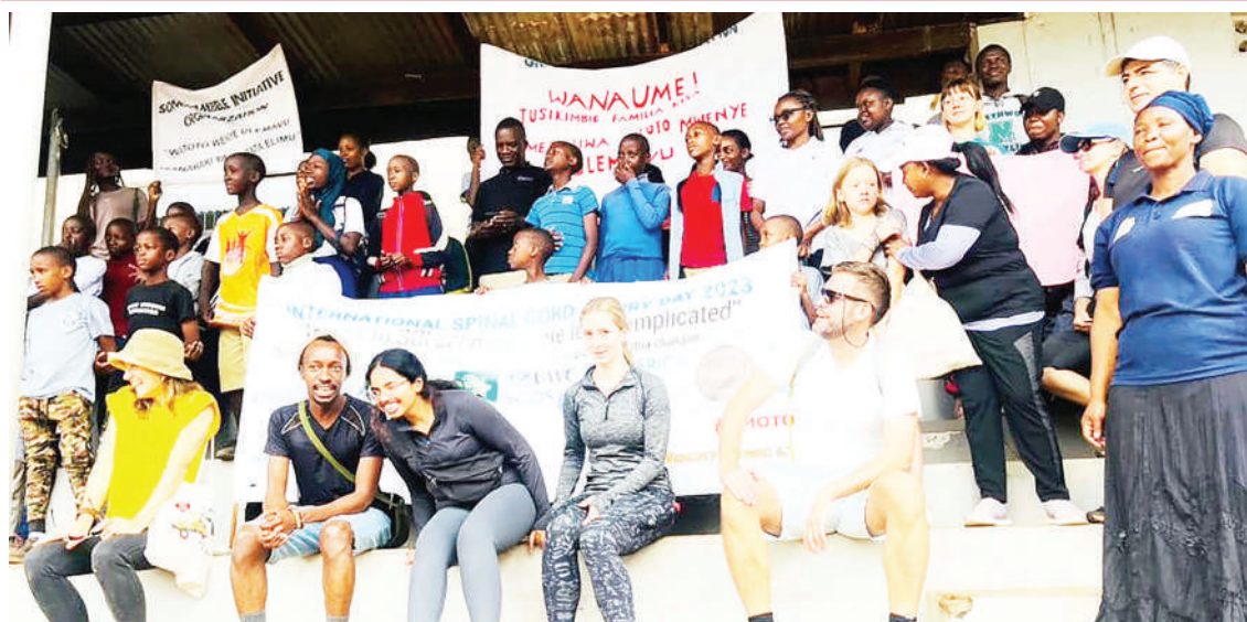
Baadhi ya wadau wakiwa na watu wenye tatizo la uti wa mgongo wakimsikiliza mgeni rasmi Ofisa Ustawi wa Jamii wa Mkoa wa Kilimanjaro, Scolastica Swai (hayuko pichani), katika ufunguzi wa elimu kwa jamii kuhusu matatizo ya uti wa mgongo iliyoandaliwa na Shirika la Songambe Initiative mwishoni mwa wiki.

Hata hivyo, aliwataka wenyeviti wa vijiji kuacha tabia ya kuuza ardhi bila kufuata taratibu kwani mihuri wanayotumia ilishapigwa marufuku, hivyo atakayefanya hivyo hatua kali zitachukuliwa dhidi yake bila kuone-wa huruma.