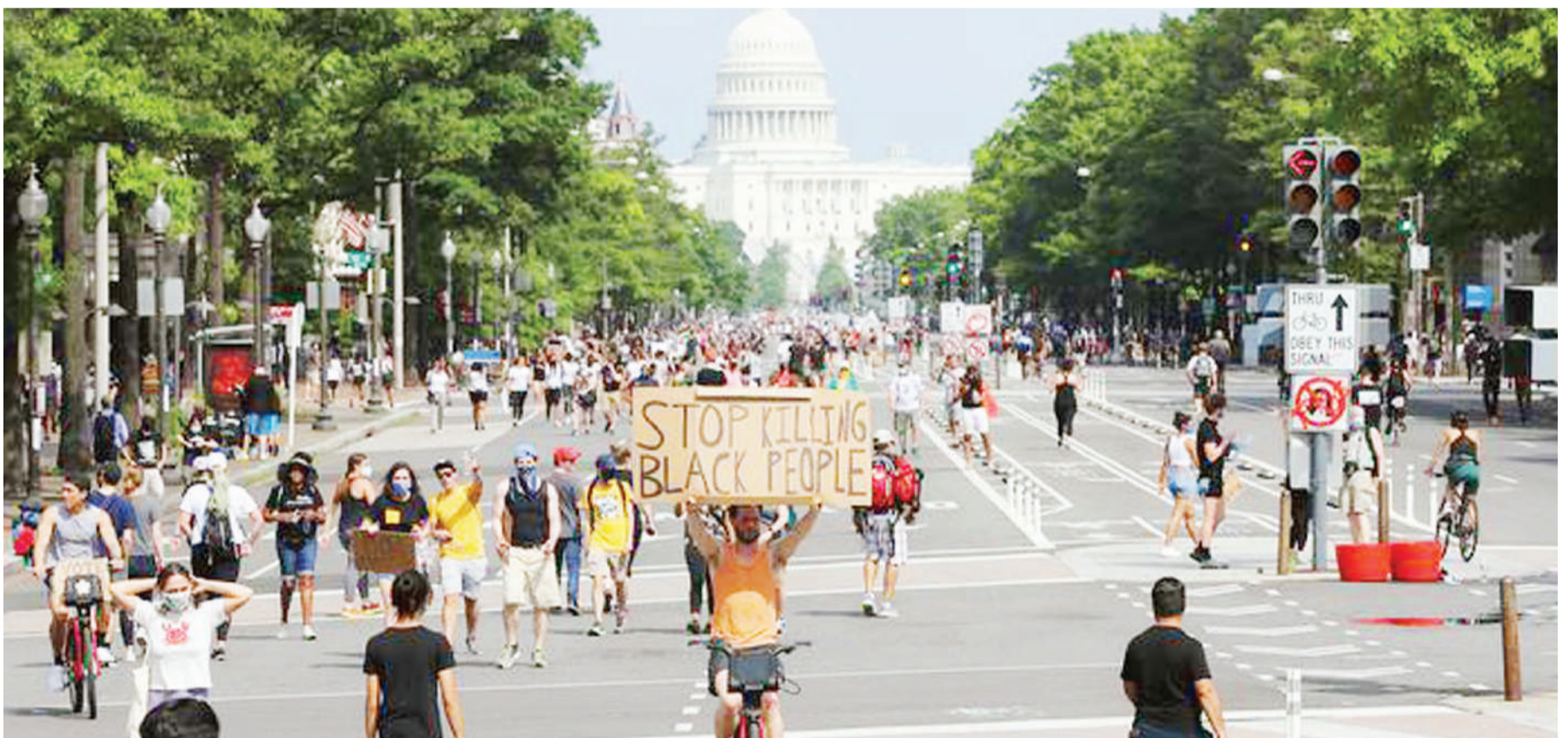
Wananchi wa Marekani wakiwa wameandamana mitaani kupinga vitendo vya ubaguzi wa rangi pamoja na manyanyaso ya Jeshi la Polisi.

Rais Kenyatta pia alitaka watu kuwa wa kweli na hali jinsi ilivyo na kusisitiza kwamba ikiwa hatua zilizopo zisinge. BBC