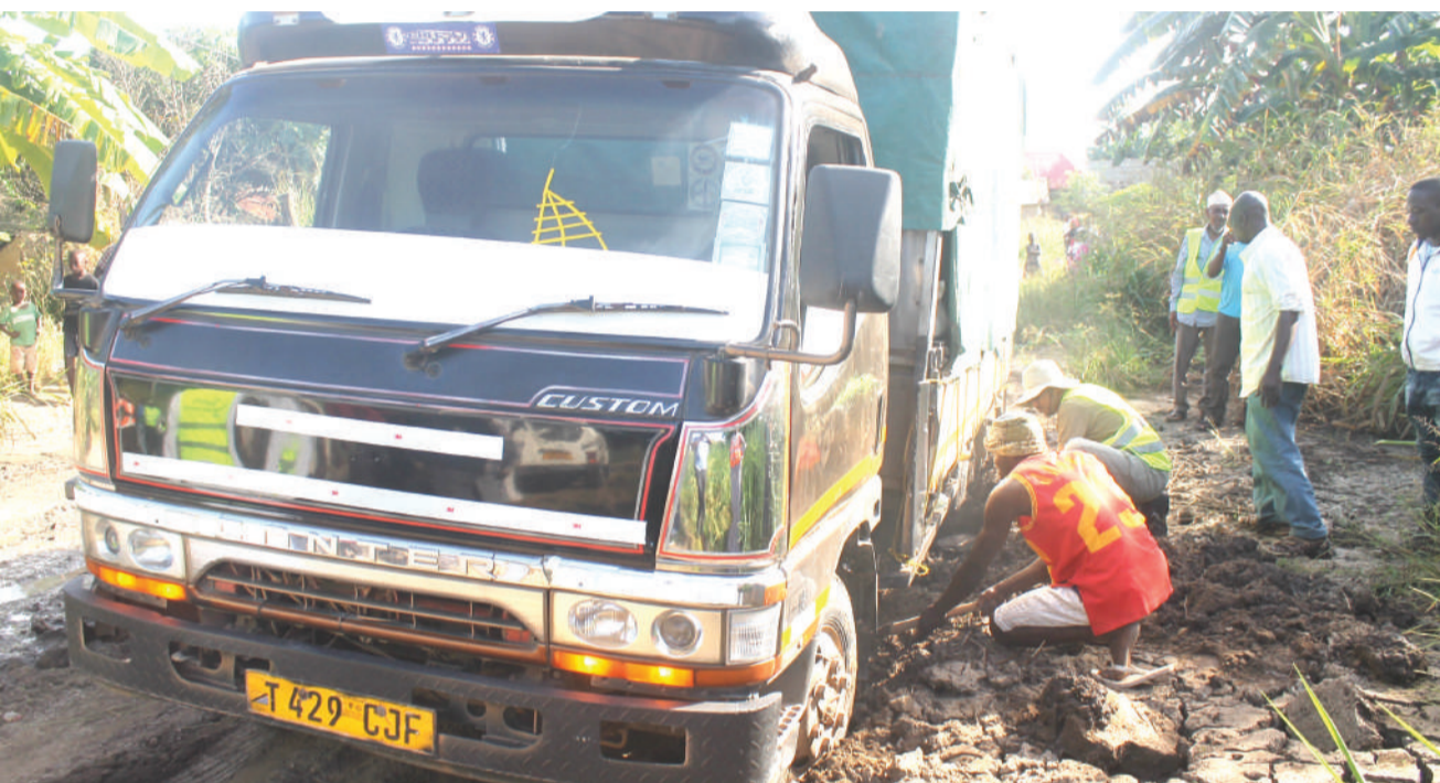
Wakazi wa Kibiti mkoani Pwani wakijaribu kulinasua gari lililonasa katika tope juzi, kutokana na barabara kuharibika.

Waziri Bashungwa alitoa wito kwa wafanyabiashara, wamiliki wa viwanda vyote nchini, wakulima, taasisi za umma, halimashauri za wilaya na taasisi binafsi, kushirikiri katika maonyesho hayo ili kuongeza wigo wa masoko ya kilimo, viwanda, mifugo, uvuvi na madini.