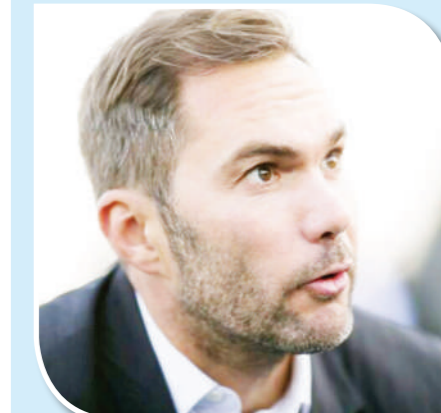
DAVID DE GEA

“Sina uhakika kama yeye [Kylian Mbappe] ni aina ya mchezaji ambaye atafiti kwenye mipango ya Jurgen Klopp, sioni uwezekano huo, angalau [Timo] Werner au [Jadon] Sancho wanaweza kufiti, lakini si kwa Mbappe, haiti kabisa pale.” mchezaji wa zamani wa Liverpool, Jason McAteer akiambia Stats Perform News.