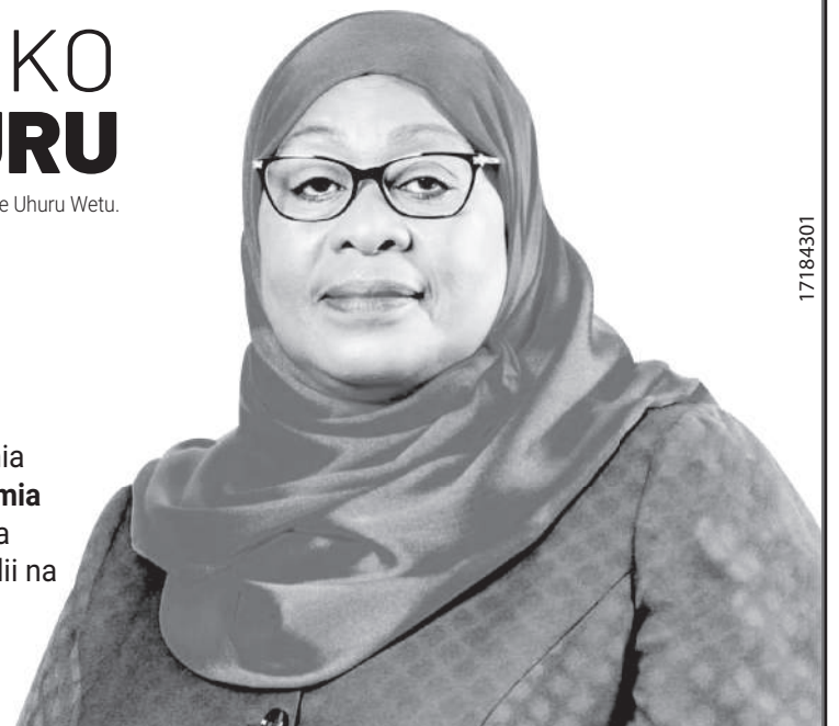
Mhe Dkt. Samia Suluhu Hassan Rais wa Jamhuri ya Muungano wa Tanzania