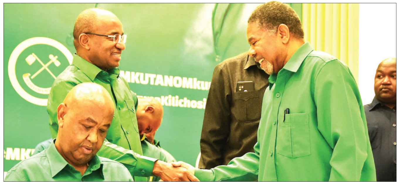
Makamu Mwenyekiti wa Chama Cha Mapinduzi (CCM) Zanzibar na Rais wa Zanzibar, Dk. Hussein Ali Mwinyi, akisalimiana na Makamu Mwenyekiti wa CCM Zanzibar mstaafu, Dk. Ali Mohamed Shein, wakati wa Mkutano Mkuu wa 10 wa CCM, jijini Dodoma jana. Kushoto ni Makamu Mwenyekiti wa CCM Bara, Abdulrahman Kinana.

SAMIA kufyeka walioshindwa kwenda na kasi yake, JK asema uongo unaigawa CCM... Endelea Ukurasa wa 2