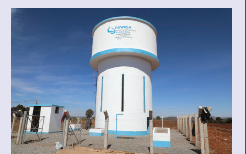
Tangi la maji la mradi wa Nyamlenge Iringa uliyotekelezwa kwa fedha za Ustawi wa Taifa na Mapambano dhidi ya ugonjwa wa UVIKO 19 unahudumia zaidi wa wakazi 1675.