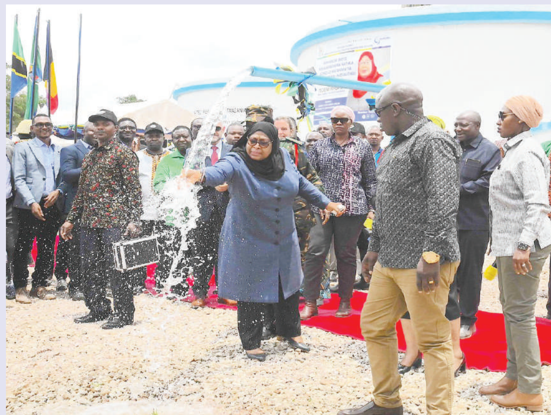
Mheshimiwa Dkt. Samia Suluhu Hassan, Rais wa Jamhuri ya Muungano wa Tanzania akigusa maji mara baada ya Uzinduzi wa mradi wa maji wa Kakonko - Kiziguzigu uliopo Kakonko Mkoani Kigoma.

RUWASA ilirithi jumla ya skimu za maji 1,379 zilizokuwa zimekamiliika na kulikuwa na miradi 632 za ujenzi wa skimu za usambazaji wa maji katika maeneo mbalimbali nchini. Kati ya skimu hizo zilizokuwa zimekamiliika, 177 zilikuwa hazitoi huduma ya maji kwa wananchi kutokana na changamoto mbalimbali ikiwemo changamoto ya kukauka kwa vyanzo vya maji. Wakati huo, yaani mwezi Julai 2019 upatikanaji wa huduma ya maji vijijini ulikuwa ni wastani wa asilimia 64.8.