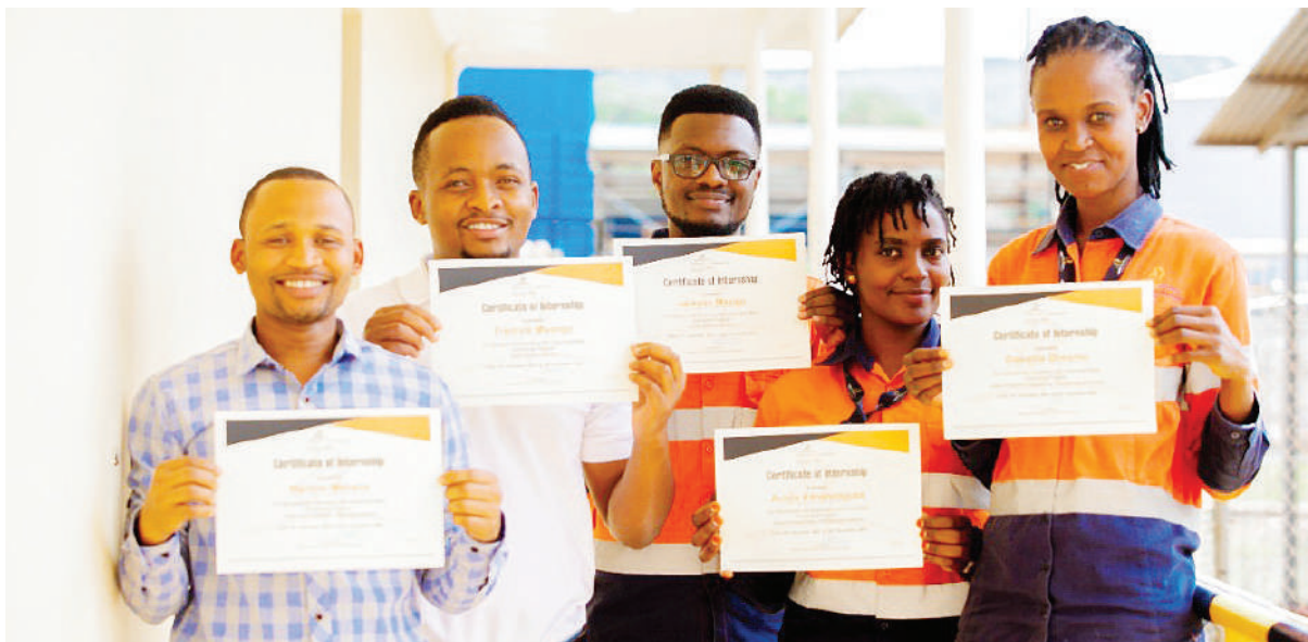
Baadhi ya wahitimu wa mafunzo tarajali kutoka GGML, wakiwa na vyeti vya kuhitimisha mafunzo waliyoyapata kwenye kampuni hiyo katika kipindi cha 2021/2022.

Tangu programu hiyo ianze mwaka 2009 hadi sasa, jumla ya wahitimu 168 wamenufaika. Kati yao, wanawake ni 58 na wanaume ni 110 huku wengi wao waki-ajiriwa na GGML katika vitengo vya uchenjaji dhahabu, uhandisi, ufundi, ulipuaji na uchimbaji madini na baadhi yao wameajiriwa katika kampuni nyingine ndani na nje ya nchi.