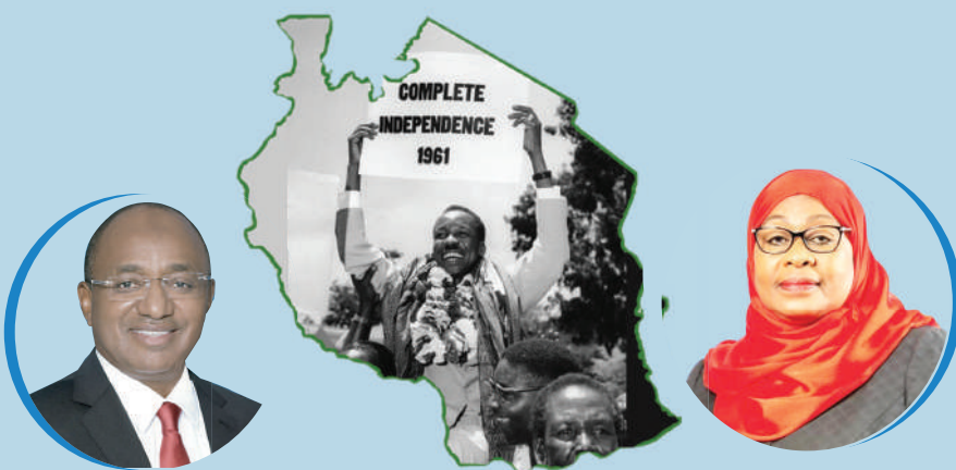
Dr. Hussein Ali Mwinyi Rais wa Zanzibar na Mwenyekiti wa Baraza la Mapinduzi