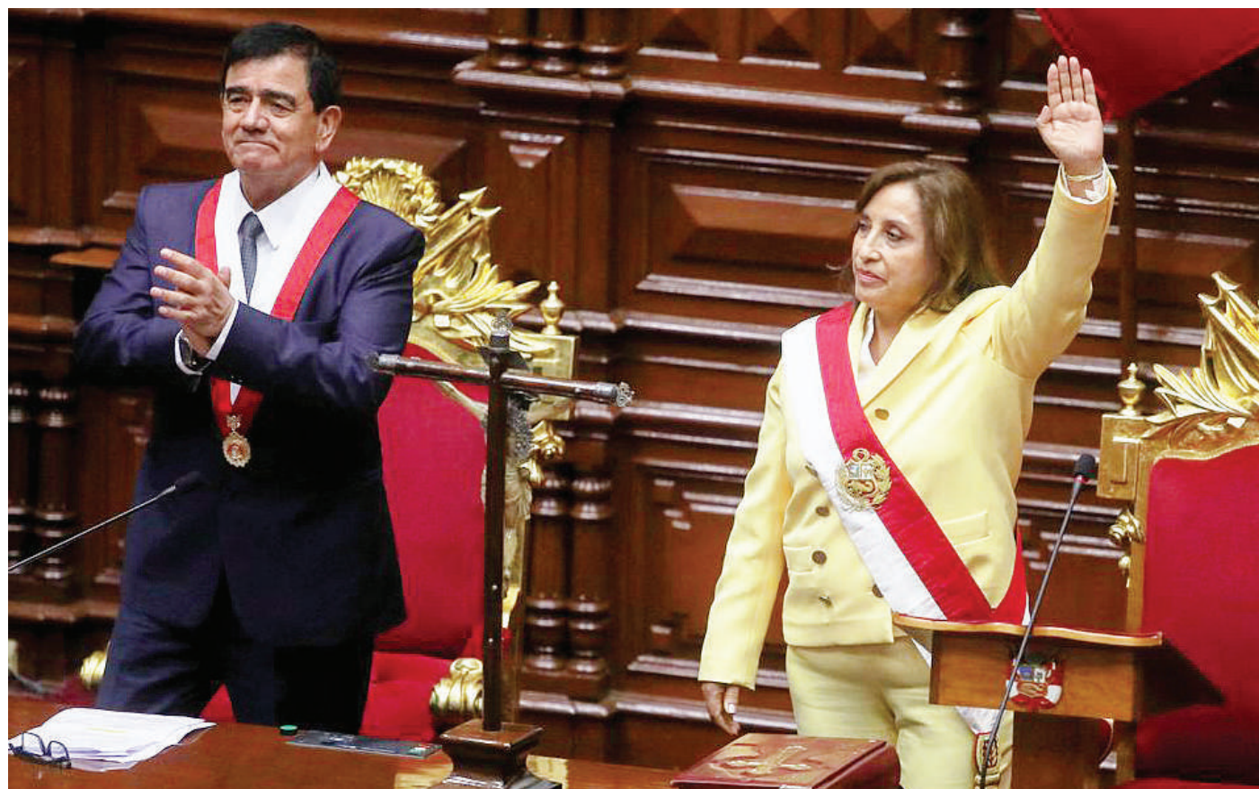
Aliyekuwa Makamu wa Rais wa Peru, Dina Boluarte, akiwasalimbia wabunge baada ya kuapa bungeni kuwa rais mpya wa nchi hiyo.