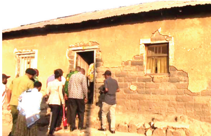
Nyumba ya Marehemu Mzee Mrisho Makwaya, ambako kulikuwa kambi ya TANU na safari ya Julius Nyerere kwenda UNO, iliikoanzia.