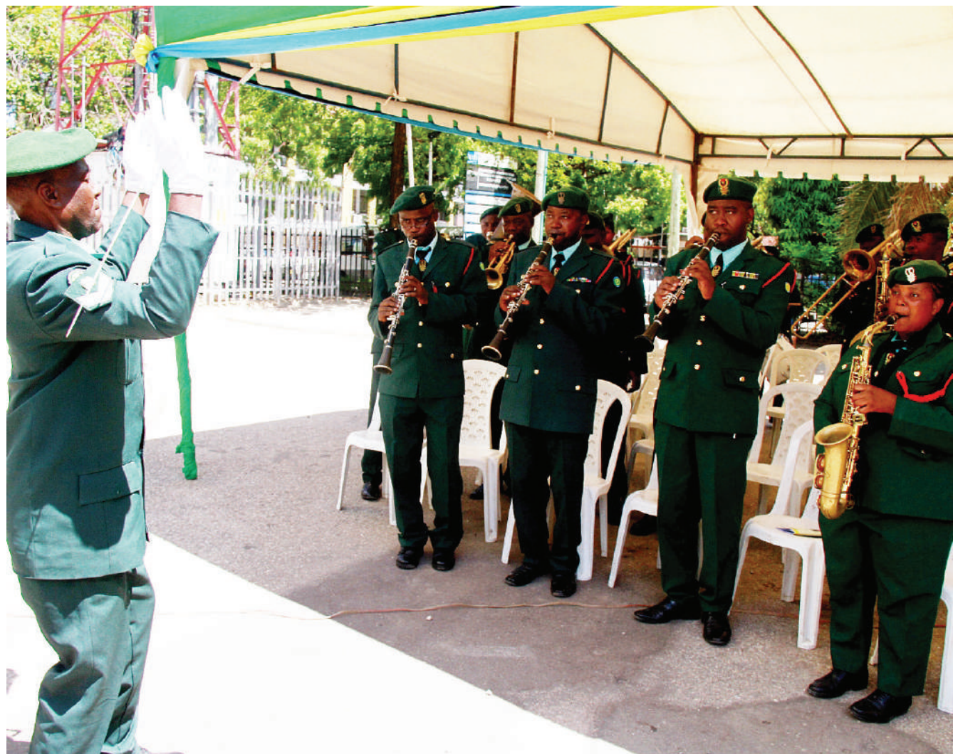
Bendi ya Jeshi la Wananchi (JWTZ), ikitumbuiza katika mahafali ya Taasisi ya Elimu ya Watu Wazima yaliyo- fanyika Dar es Salaam jana.

Yanga ndio mabingwa watezezi wa mashindano hayo ambapo katika mechi ya fainali waliifunga Coastal Union ya jijini, Tanga.