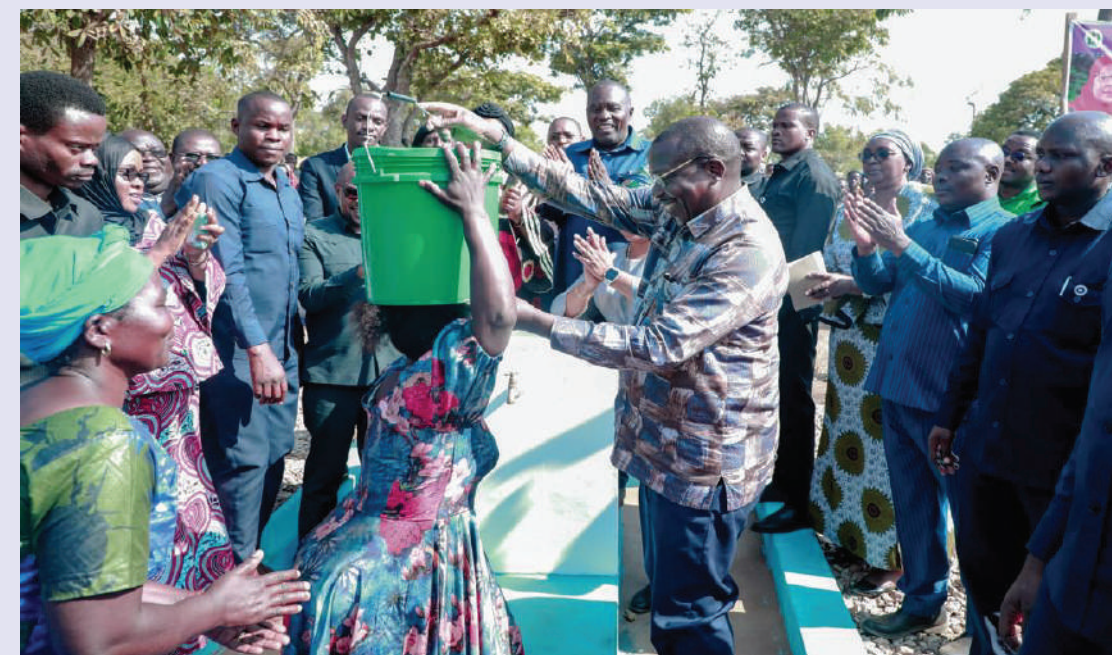
Mheshimiwa Dkt. Philip Isidor Mpango, Makamu wa Rais wa Jamhuri ya Muungano wa Tanzania akimtua ndoo ya maji kichwani mkazi wa Tanganyika mara baada ya uzinduzi wa mradi wa maji wa Sibwesa Wilayani Tanganyika Mkoa wa Katavi. Mradi wa maji wa Sibwesa umetekelezwa kwa fedha za Ustawi wa Taifa na Mapambano dhidi ya UVIKO 19 na sasa unahudumia wakazi zaidi ya 7,000.

Ili kuendana na muda unaotakiwa kukamilisha utekelezaji wa miradi hii, ilionekana ni vyema utekelezaji ukafanyika wa aina mbili ambazo kwanza ni kufanya ununuzi wa Pampu na Bomba kwa pamoja kutoka kwa Wakala wa watengenezaji wa pampu na viwanda vya uzalishaji wa bomba na Pili kutumia wakandarasi kwa ajili ya ujenzi wa miundombinu ya maji (civil works). Miradi minne (4) tu inatekelezwa kwa kutumia utaratibu wa wataalam wa ndani (Force Account).