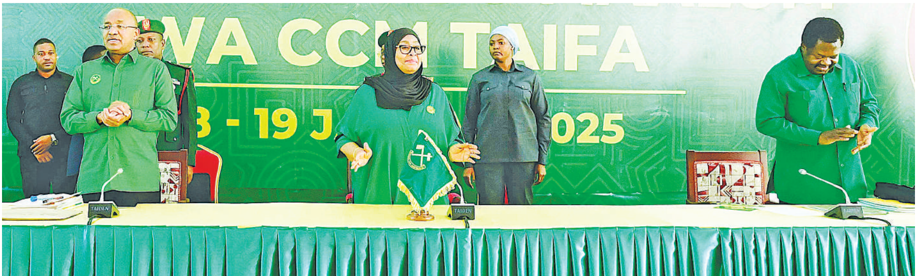
Mwenyekiti wa Chama Cha Mapinduzi (CCM) Taifa, Rais Samia Suluhu Hassan akiongoza Kikao cha Halmashauri Kuu ya CCM Taifa (NEC), jijini Dodoma jana. Kushoto ni Makamu Mwenyekiti wa CCM Visiwani na Rais wa Zanzibar, Dk. Hussein Ali Mwinyi na kulia ni Katibu Mkuu wa CCM, Balozi Dk. Emmanuel Nchimbi.

• Kiu mrithi wa Kinana yaongezeka, wajasiriamali wafurahia fursa... Endelea Uk.3