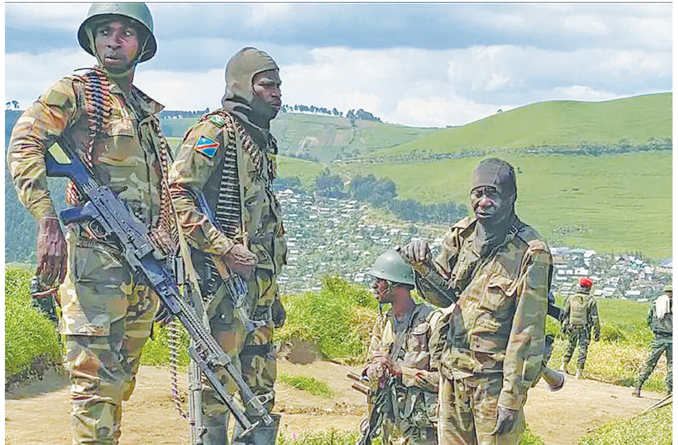
Wanajeshi wa DRC wakilinda sehemu ya mji wa Masisi hivi karibuni.