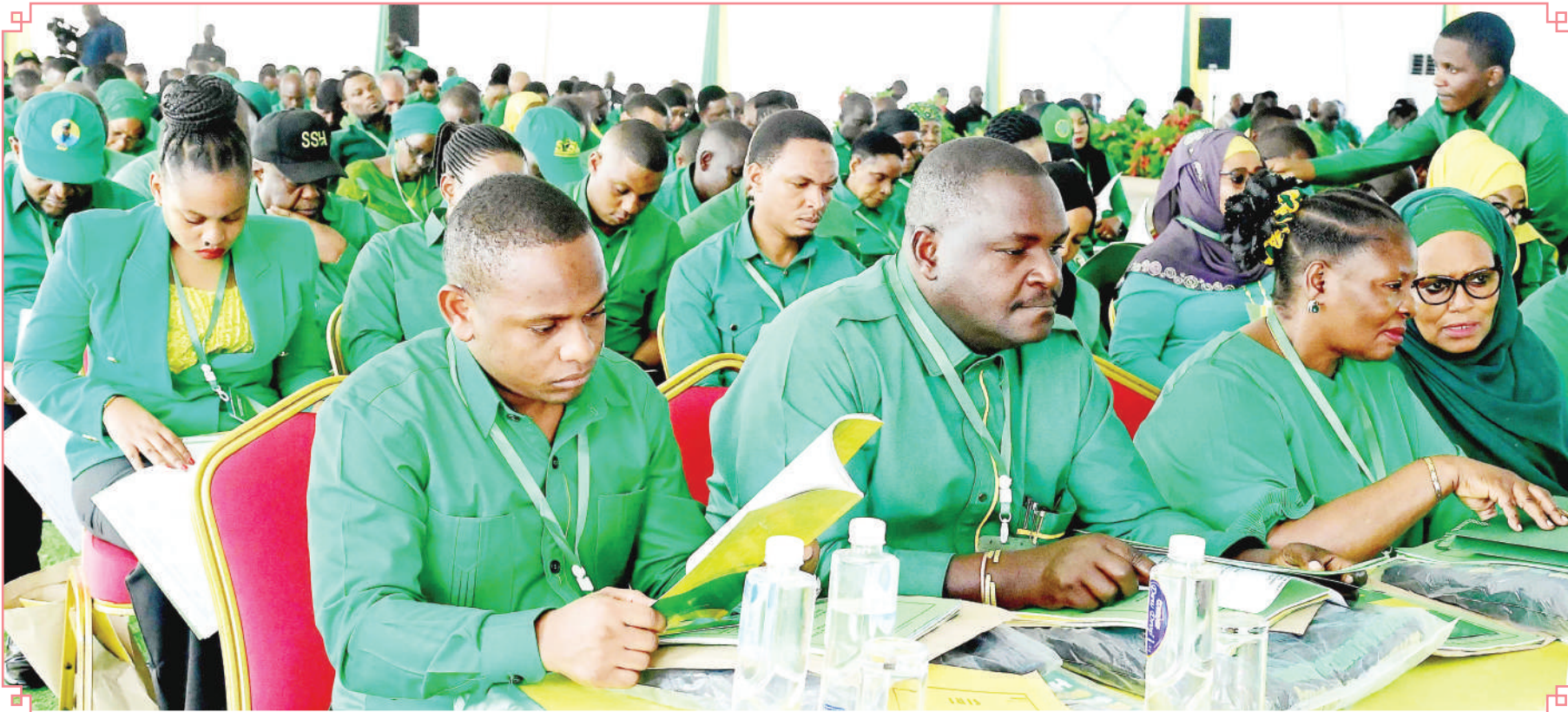
Sehemu ya Wajumbe wa Halmashauri Kuu ya Chama Cha Mapinduzi CCM Taifa (NEC), wakiwa kwenye kikao jijini Dodoma jana.