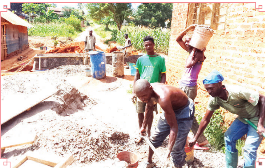
Mafundi wakiendelea na ujenzi wa karavati katika barabara inayoenda eneo la ofisi ya Mtendaji wa Kata ya Kwamkabara, wilayani Muheza, mkoani Tanga, hivi karibuni.