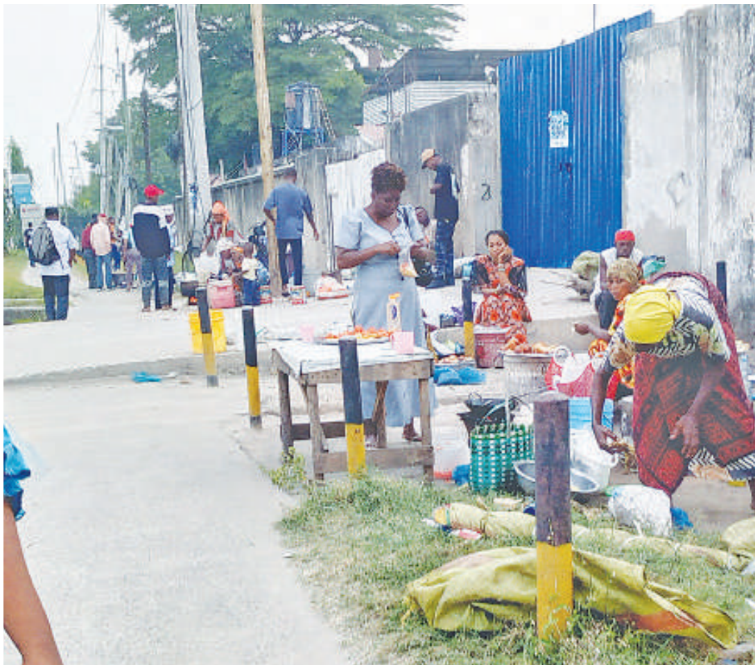
Mamalisha wakiendelea na shughuli zao kando ya barabara, eneo la Mikocheni Viwandani, Manispaa ya Kinondoni, Dar es Salaam jana, mazingira ambayo ni hatarishi kiafya kutokana na kukosa huduma muhimu kama maji na vyoo.

Mkutano huo umeshirikisha wadau mbalimbali wa uchaguzi ikiwamo taasisi za serikali na binafsi, vyama vya siasa, makundi maalum, vyombo vya ulinzi na usalama na vyombo vya habari.