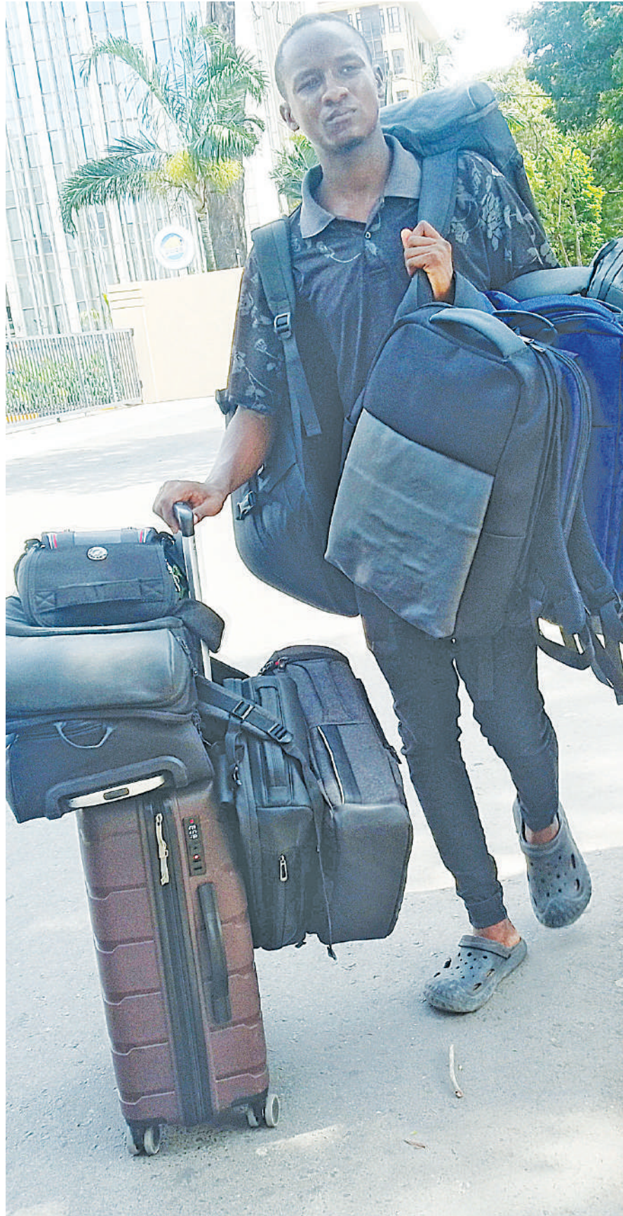
Mfanyabiashara mdogo maarufu machinga, akibeba mabegi kutafuta wateja katika eneo la Posta, jijini Dar es Salaam jana.

Pia alisema serikali inaendelea kusimamia na kuhakikisha mikataba ya biashara ya kaboni inanufaisha wananchi na inafanyika kwa mujibu wa kanuni za usimamizi wa biashara ya kaboni.