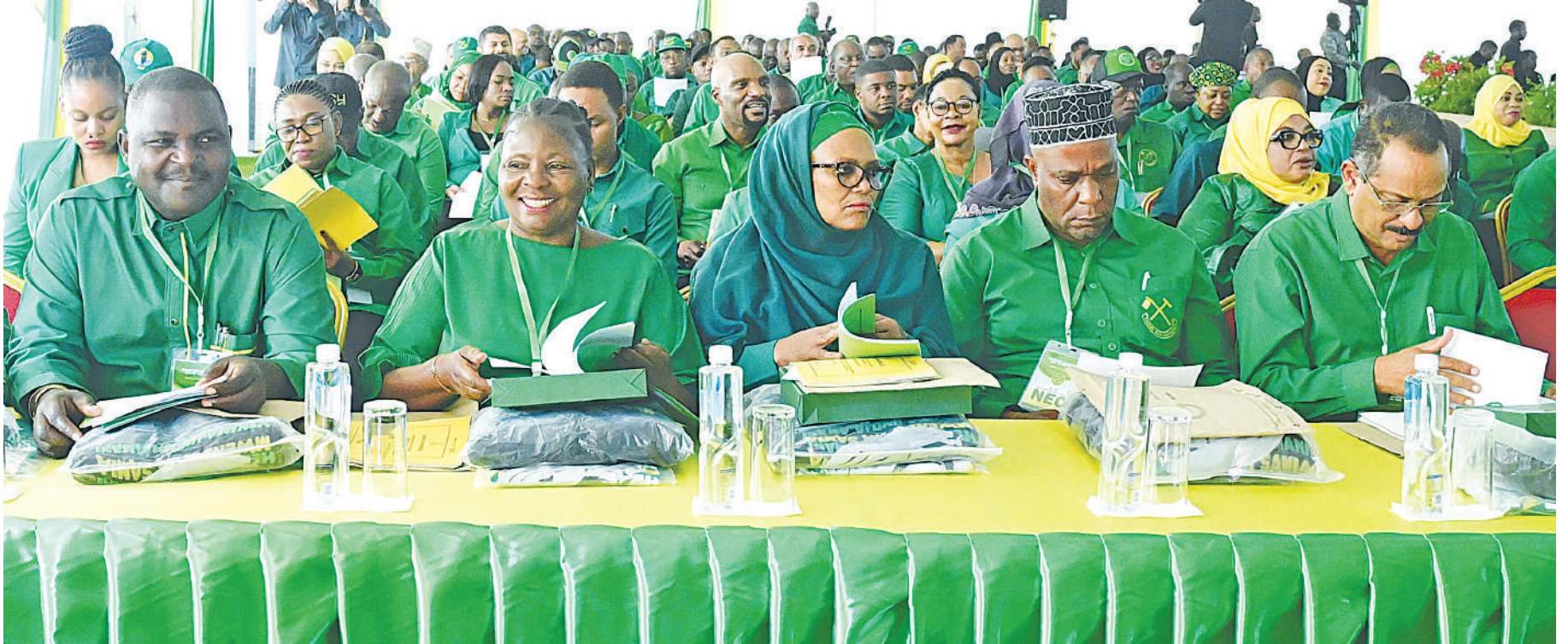
Sehemu ya Wajumbe wa Halmashauri Kuu ya Chama Cha Mapinduzi CCM Taifa (NEC), wakiwa kwenye kikao jijini Dodoma jana.