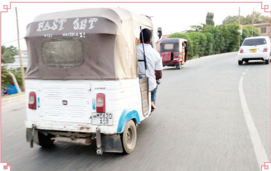
Abiria wa bajaji akiwa amekaa mbele upande wa kulia katika bajaji iliyokuwa barabara ya kuelekea Malamba Mawili Mbezi, Dar es Salaam juzi, kitendo ambacho ni hatari kwa usalama wake.