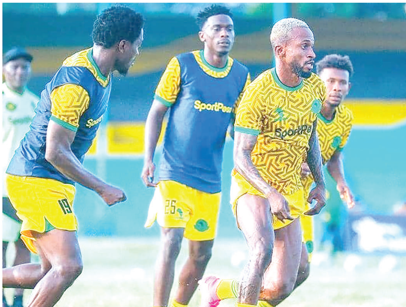
Wachezaji wa Yanga wakiwa mazoezini, ambapo jana usiku walishuka Uwanja wa Azam Complex, Chamazi kuvaana na Polisi Tanzania kwenye mechi ya Kombe la FA. Jumamosi wiki hii pia Yanga itaikaribisha CR Belouizdad ya Algeria kwenye mechi ya Kundi D ya Ligi ya Mabingwa Afrika itakayopigwa Uwanja wa Benjamin Mkapa, Dar es Salaam.

“Vijana wako vizuri tunaendelea na maandalizi baada ya mchezo wetu na Geita Gold FC, tumerudi katika uwanja wa mazoezi kusahihisha makosa yetu, yasijirudie katika mechi zijazo ikiwamo na Kagera Sugar tukiwa ugenini,” alisema kocha huyo.