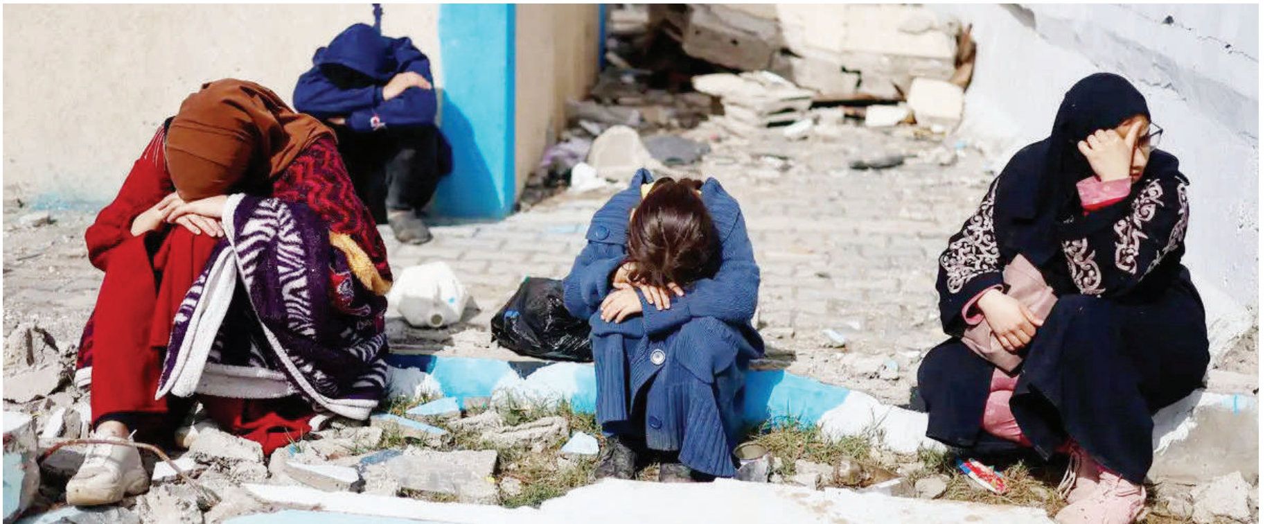
Wakazi wa Gaza wakiwa wameinamisha vichwa ishara ya kukosa matumaini kuhusu operesheni za Israel zinazoendelea katika ukanda huo. PICHA: MTANDAO