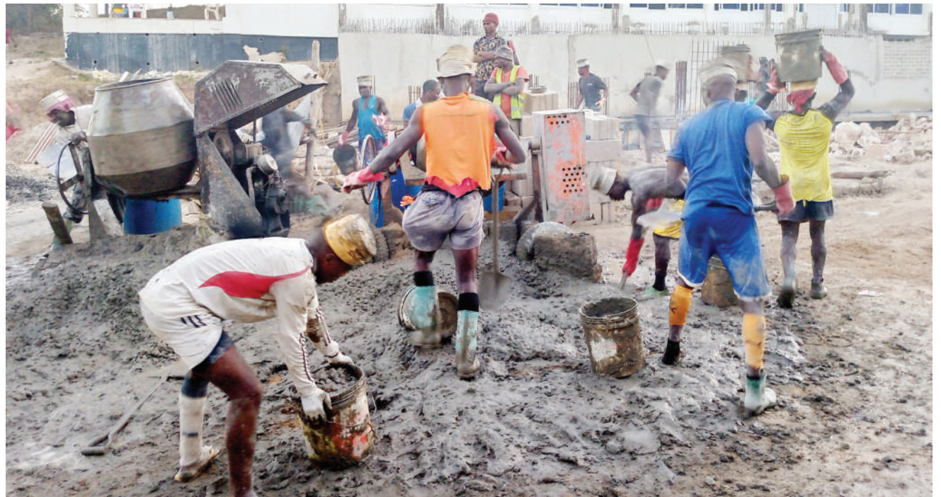
Vijana wakisomba zege kwa ajili ya kuweka jamvi sehemu ya Kanisa la Wasabato Mbezi Luis, Manispaa ya Ubungo, mkoani Dar es Salaam juji.

"Hii inanifanya niweze kufanya miamala kwa urahisi na gharama nafuu. Hakuna ulazima wa kwenda tawini tena hakika Akiba Wakala ni zaidi ya huduma kwa kuangalia faida lukuki zilizosheheni katika huduma," alisema.