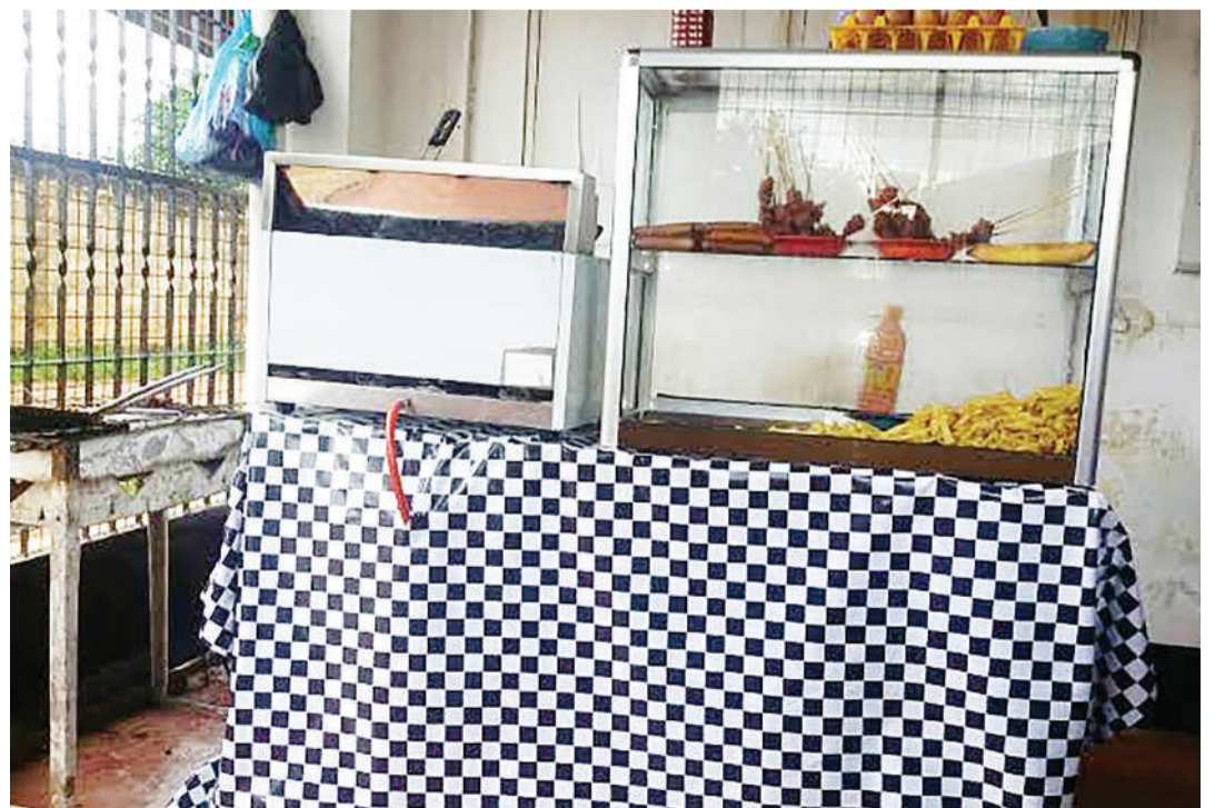
Kibanda: Kibanda cha Chipsi.