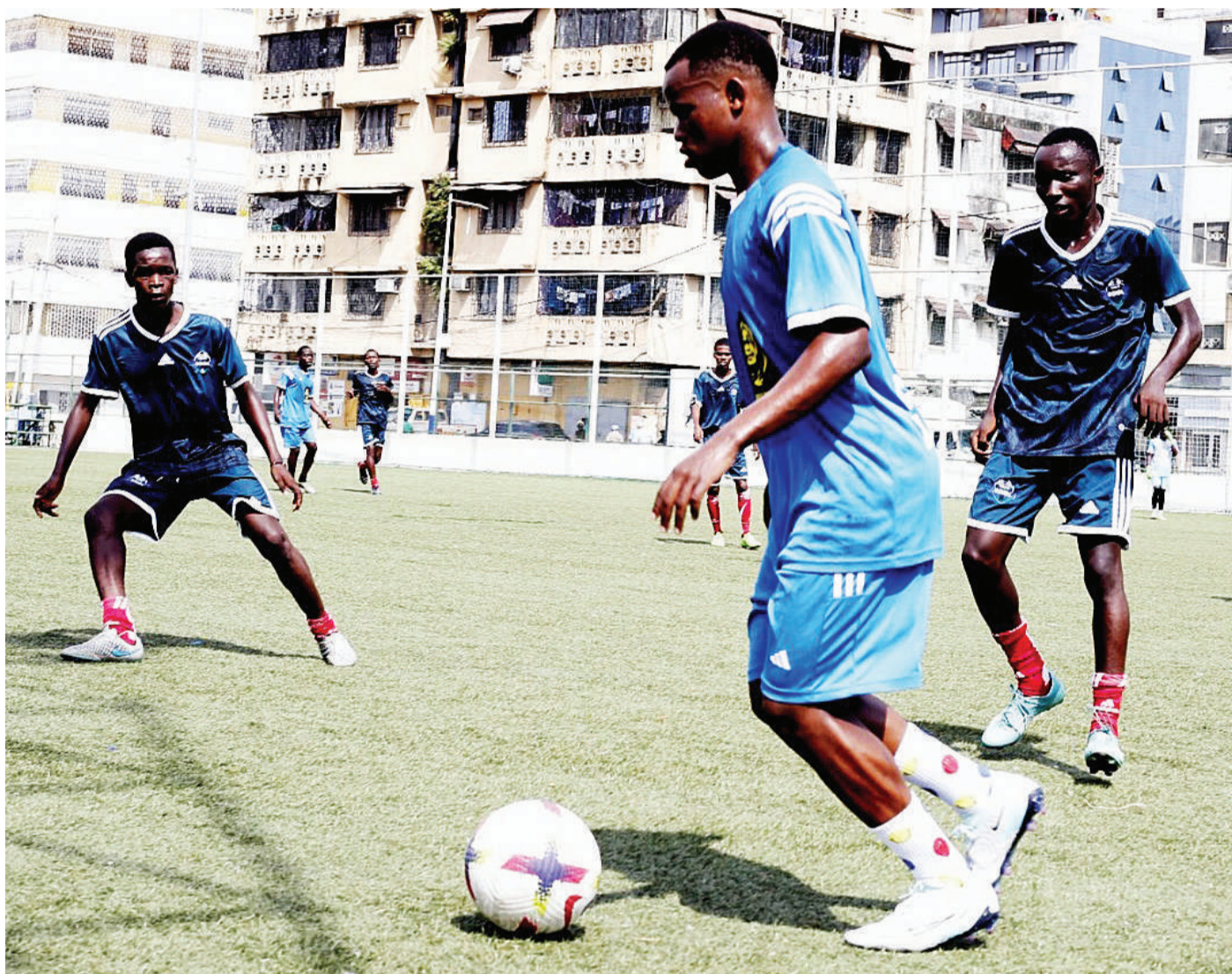
Vijana wakifanya mazoezi katika Uwanja wa Uhuru jijini Dar es Salaam kama walivyokutwa na mpiga picha jana.

Oktoba 5 mwaka jana ilikwenda ugenini, Uwanja wa Sokoine Mbeya na kuwachapa wenyeji, Prisons mabao 3-1, kabla ya kwenda mkoani Singida na kutoakipigo cha mabao 2-1 mbele ya Singida Fountain Gate Oktoba 8 na kurejea Dar es Salaam kutoa kipigo cha mabao 2-1 kwa Ihefu FC, Oktoba 28.