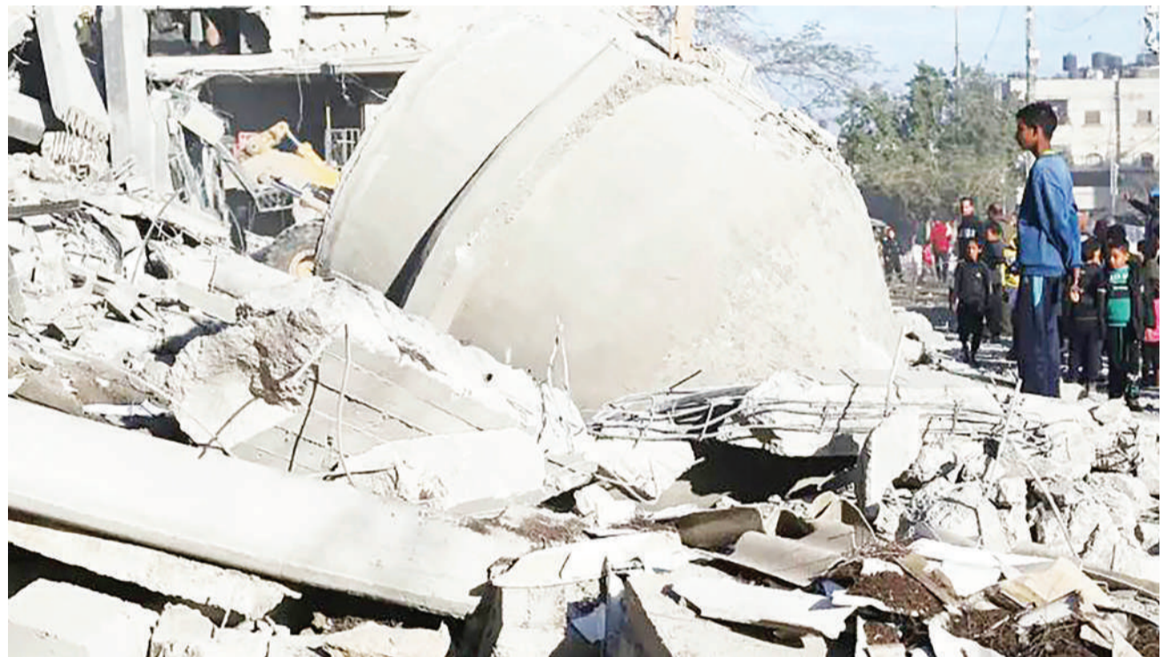
Uharibifu uliofanywa na vikosi vya Israel katika mji wa Rafah hivi karibuni.