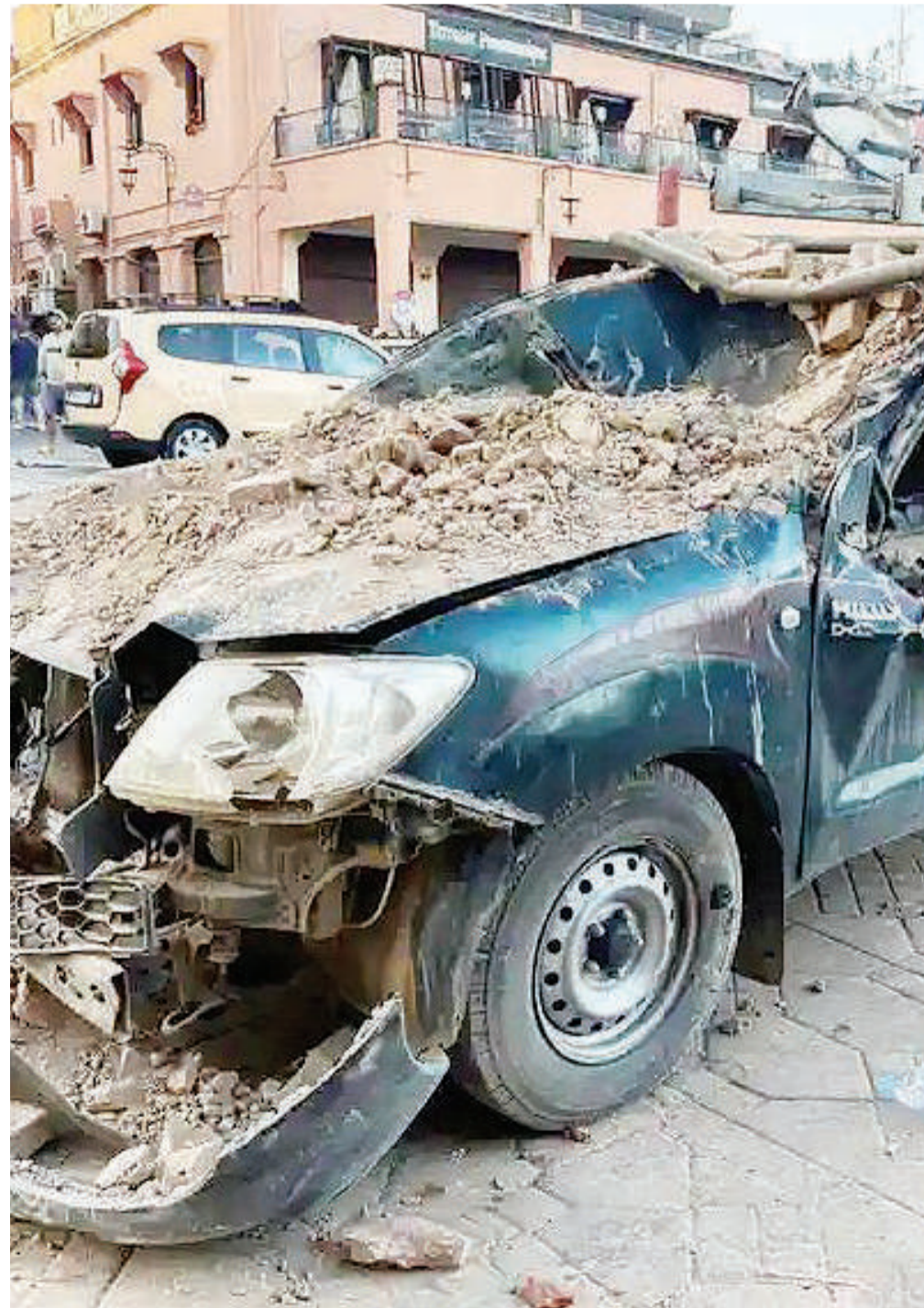
Mwonekano wa gari lililoathiriwa na tetemeko la ardhi lililoukumba Mji wa Marrakesh, nchini Morocco mwishoni mwa wiki. PICHA: REUTERS

Kitovu cha tetemeko la ardhi, kilikuwa katika Milima ya Atlas, kuliko na vijiji vingi vya mbali ambavyo ni vigumu kuvifikia. BBC