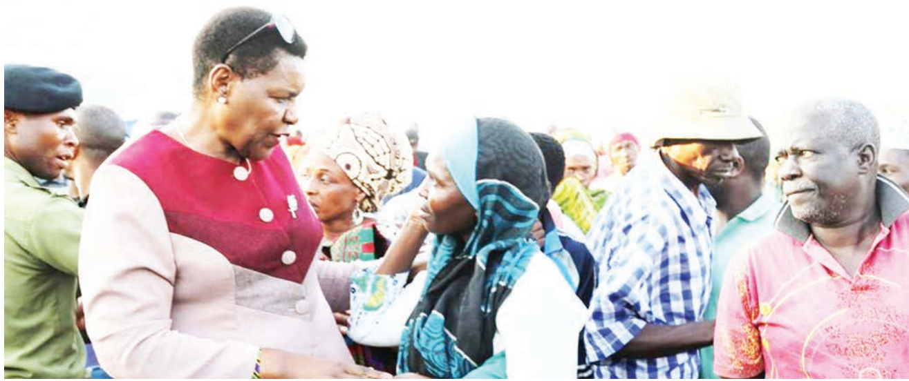
Waziri wa Ardhi Nyumba na Maendeleo ya Makazi, Dk. Angeline Mabula (kushoto), akizungumza na mkazi wa Pangani, mkoani Pwani, alipomaliza kuhutubia mkutano wa hadhara wa kupokea na kukabidhi taarifa ya uchunguzi wa mgogoro wa ardhi eneo la Pangani, mkoani humo juzi.

Kinana alisisitiza kwamba baada ya kumaliza ziara yake, atakwenda kumwambia Rais Samia Suluhu Hassan kwamba wananchi wa Mkoa wa Kigoma wamemwambia kanyaga, apeleke bungeni sheria za hovy ili zifutwe.