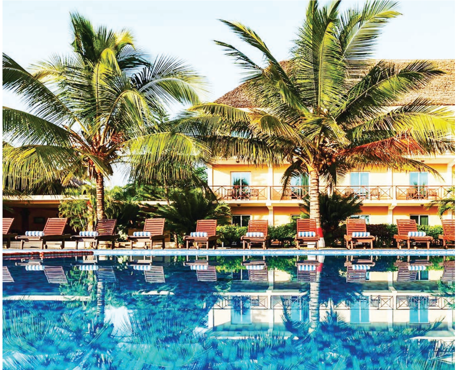
Moja ya hoteli zilizojengwa kwenye fukwe za Bahari ya Hindi, Dar es Salaam.

"Sisi kama wawekezaji hatuna shaka na hukumu iliyotolewa na mahakama, lakini tunaomba tu Manispaa ya Kigamboni kama ambavyo sehemu ya hukumu ambayo nakala yake tunayo inavyotoa nafasi ya majadiliano ya kutafuta namna ya kuweka barabara ya