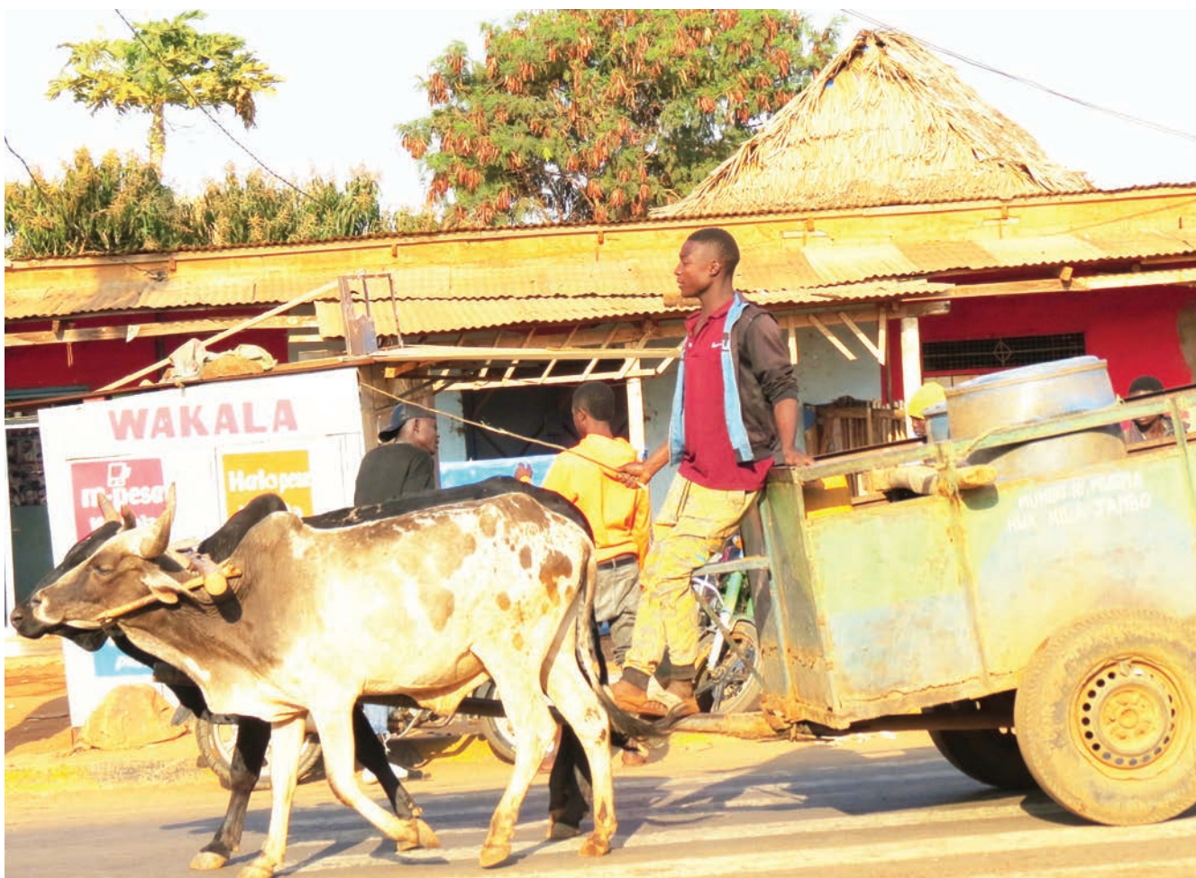
Mkazi wa Kijiji cha Mbande, Wilaya ya Kongwa, akitumia tela linalokokotwa na ng'ombe kama nyenzo ya usafiri wakati akitafuta wateja wa maji, kijijini hapo jana. Dumu moja lenye maji aliliuza kwa bei ya Sh. 400/- hadi Sh. 500/-.

"Hii promosheni ya 'Tisha na Tembocard' ni shindano ambalo litampa mabadiliko mteja, atakuwa akihitaji huduma au bidhaa anatomia kadi yake kuchanja tu na kulipia badala ya kutoa burungutu la fedha," alisema.