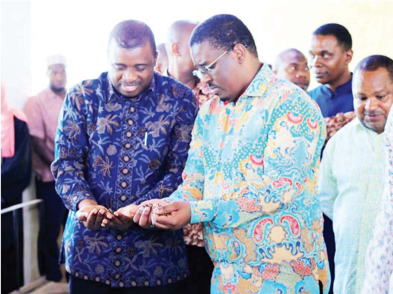
Makamu wa Pili wa Rais wa Zanzibar, Hemed Suleiman Abdullah (kushoto), akiwa na Waziri wa Biashara na Maendeleo ya Viwanda, Omar Said Shaaban, wakiangalia karafuu, walipofanya ziara ya kukagua vituo vya kuuzia zao hilo, Kisiwani Pemba jana.

"Tunashukuru kuwa zoezi limekamilika hakuna matukio mabaya yalioitokea na vishikwambi vyote vipo salama," alisema.