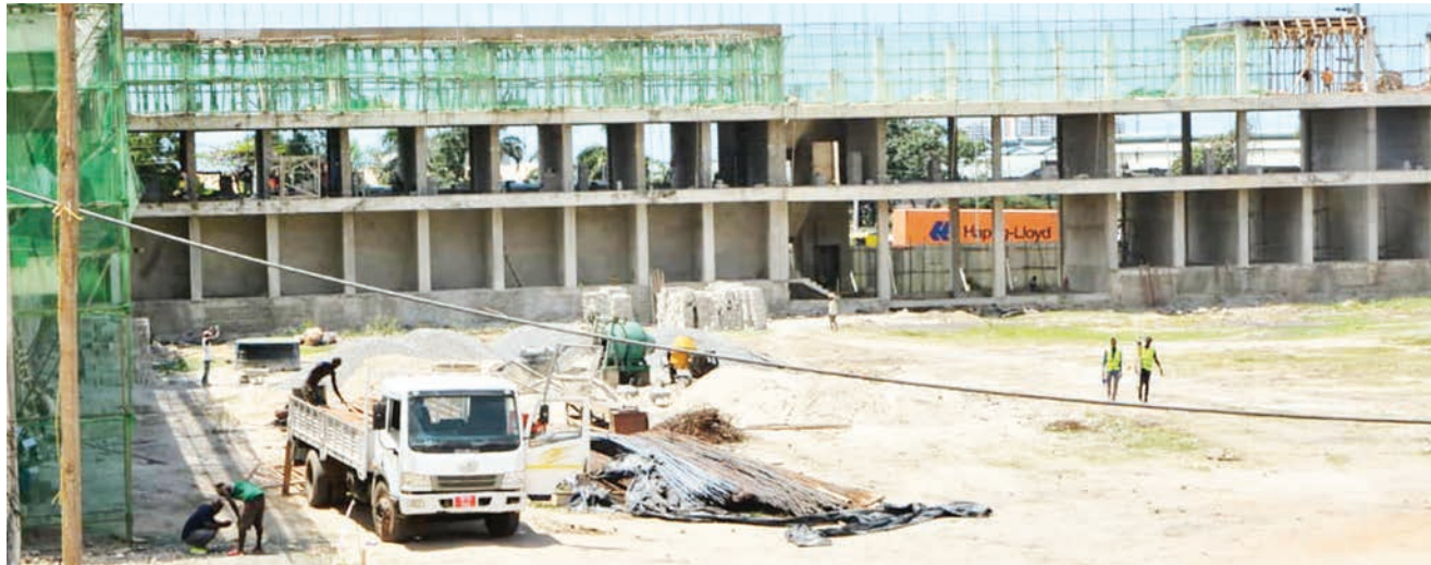
Kazi ya ujenzi wa majengo ya mradi wa stendi mpya ya mabasi Mwenge, ikiendelea katika Manispaa ya Kinondoni, mkoani Dar es Salaam jana, baada ya ujenzi wake kusimama kwa muda mrefu.