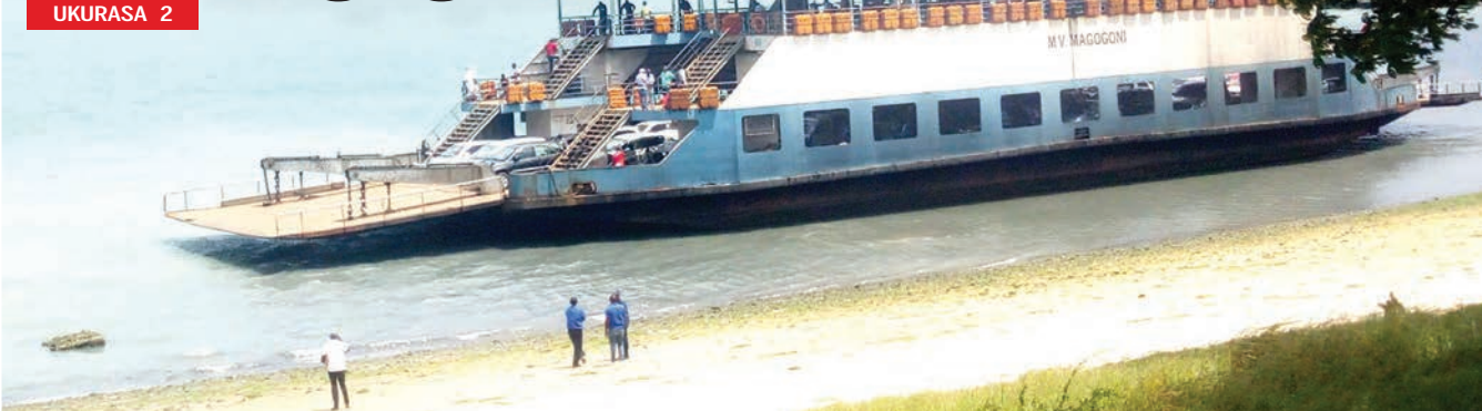
Pantoni ya MV Magogoni, ikiwa imekwama ufukweni mwa Bahari ya Hindi jijini Dar es Salaam baada ya kusukumwa na upepo kutoka kwenye lango lake la kupakia abiria la Magogoni Feri jana.