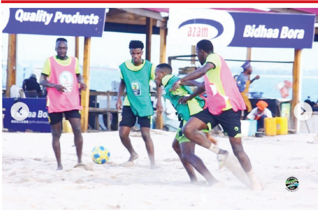
Wachezaji wa Timu ya Soka ya Taifa ya Ufukweni wakijiandaa na mechi ya marudiano dhidi ya Malawi kwa ajili ya kusaka tiketi ya kushiriki Fainali zizazo za Kombe la Mataifa Afrika (BSAFCON) itakayochezwa kesho kwenye fukwe ya Coco jijini Dar es Salaam.

Azam FC itafungua pazia la Ligi Kuu Tanzania Bara Agosti 17, mwaka huu kwa kuwakaribisha Kagera Sugar kwenye Uwanja wa Azam Complex jijini Dar es Salaam.