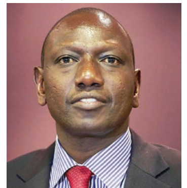
Naibu Rais William Ruto