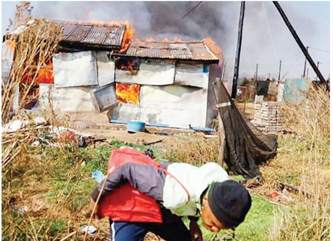
Mkazi wa kitongoji cha Johannesburg akikimbia baada ya kuibuka ghasia zilizosababisha wageni kulengwa na kuchomewa nyumba zao moto jana.

Kama tulivyoripoti hapo awali, wizara ya ulinzi ya Taiwan ilisema kwamba meli na ndege nyingi za China zimevuka mstari wa kati wa Taiwan Strait kwa siku ya pili mfululizo. BBC