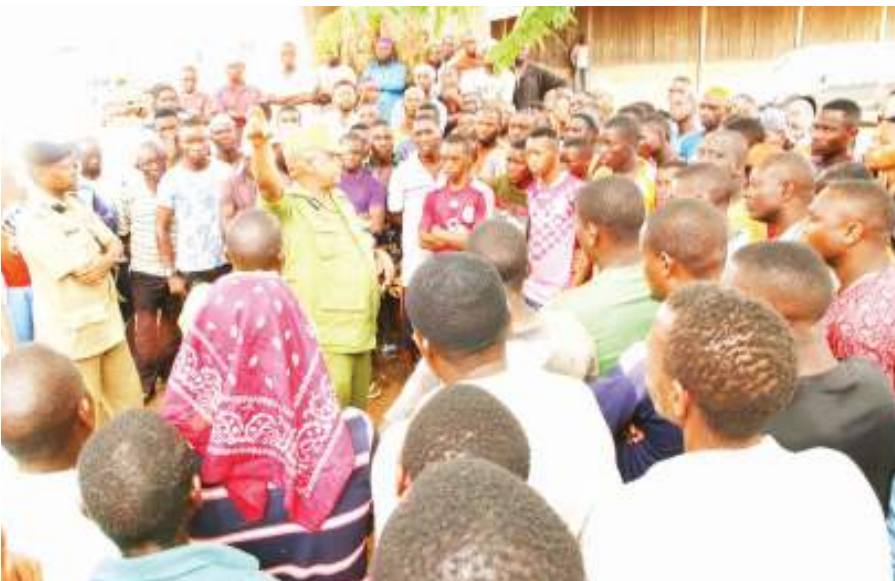
Kamishna wa Operesheni na Mafunzo, Sabas, akizungumza na wananchi pamoja na wakazi wa Newala katika ziara yake ya siku moja aliyofanya maeneo hayo, lengo la ziara hiyo ilikuwa ni kuwashukuru wananchi kuwa ushirikiano wao wanaoutoa kwa vyombo vya ulinzi na usalama juu ya kukabiliana na uhalifu katika maeneo hayo.