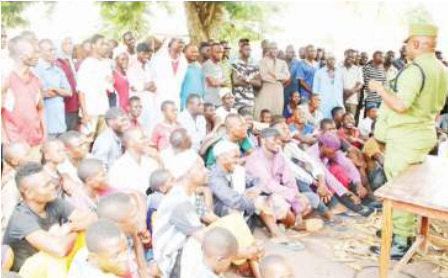
Kamishna wa Operesheni na Mafunzo, akizungumza na wananchi pamoja na wakazi wa Tandahimba mkoani Mtwara katika ziara ya maeneo hayo, lengo la ziara hiyo ilikuwa ni kuwashukuru wananchi kuwa ushirikiano wao.