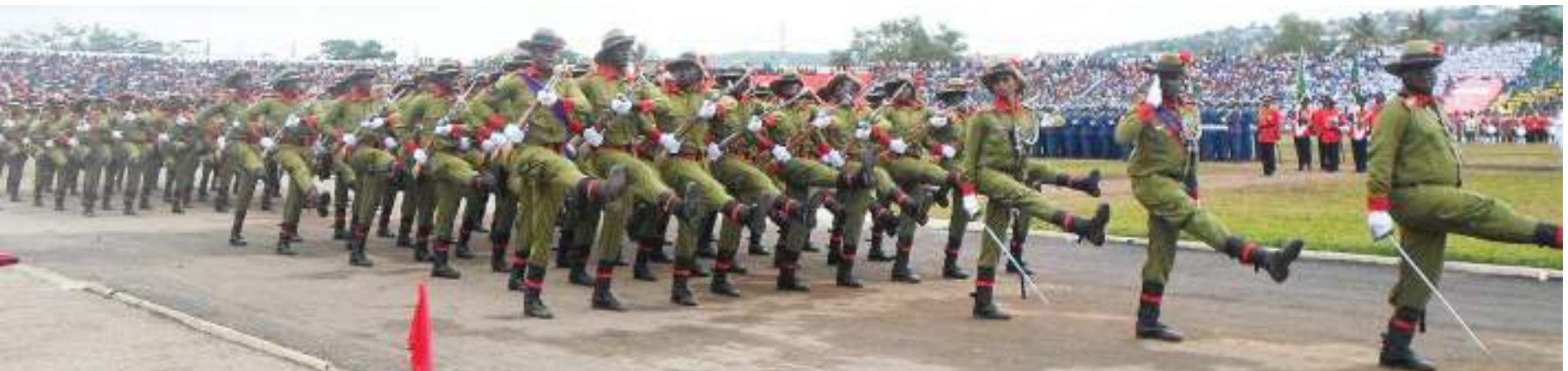
Wanajeshi wa Jeshi la Kujenga Taifa (JKT) wakiwa katika gwaride la sherehe za miaka 58 ya Uhuru na miaka 57 ya Jamhuri katika uwanja wa CCM Kirumba, Mwanza.