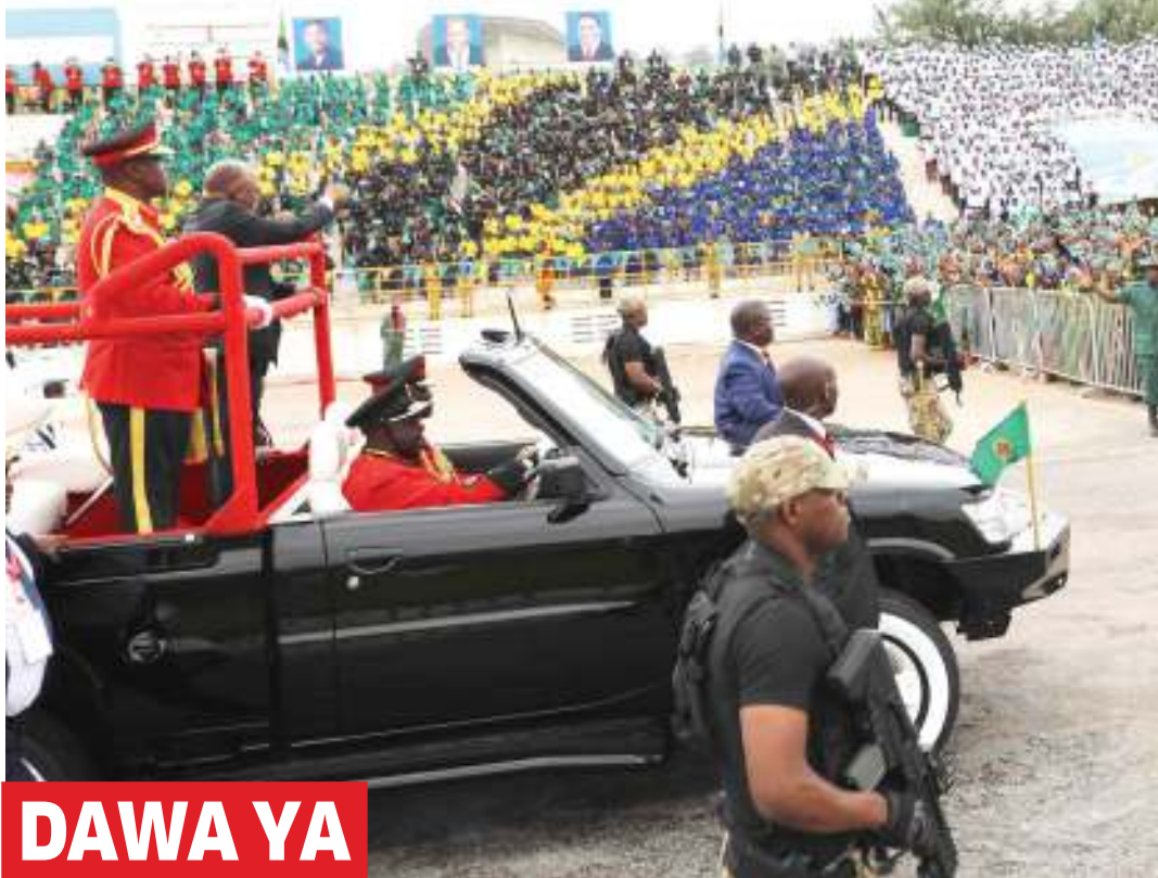
Rais John Magufuli akiwasili katika Uwanja wa CCM Kirumba jijini Mwanza kuongoza sherehe za maadhimisho ya miaka 58 ya Uhuru jana.

PROF. LIPUMBA "Rais ana jukumu la kujenga demokrasia katika nchi yetu, hasa tunapoelekea uchaguzi mkuu".