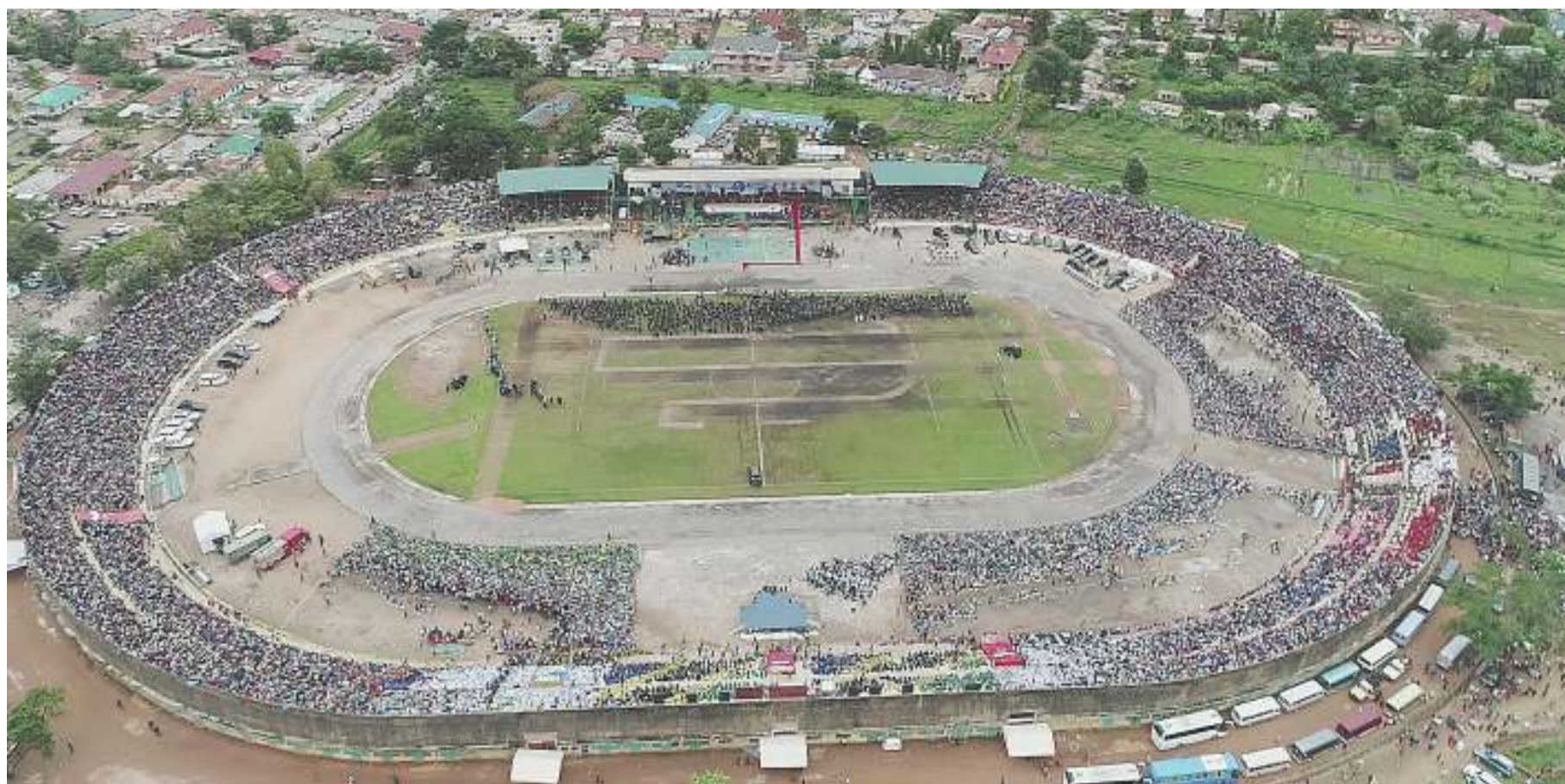
Mwonekano wa Uwanja wa CCM Kirumba, jijini Mwanza, wakati wa sherehe za miaka 58 ya Uhuru na 57 ya Jamhuri zilizoongozwa na Rais John Magufuli jana.