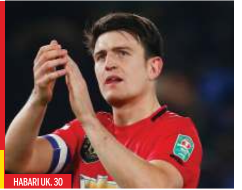
HABARI UK. 30