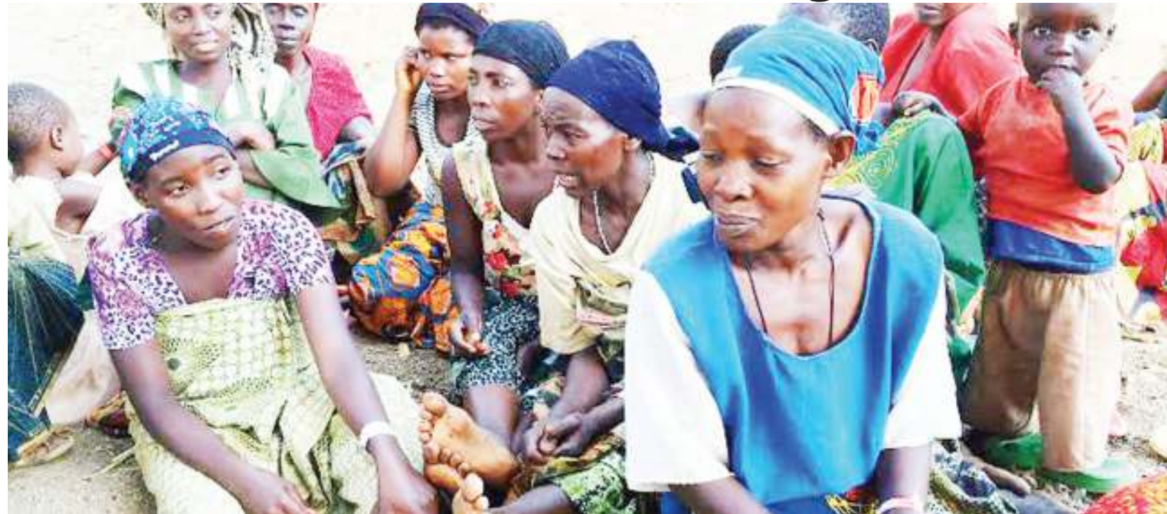
Wanawake wakiwa kwenye kambi ya wakimbizi mkoani Kigoma. Kinamama hawa wanahitaji ulinzi ili kuepushwa na vitendo vya udhalilishaji.

“Dawati limekuwa msaada kwa wanawake na watoto ambao hutitumia kuelezea adha na vitendo vya ukatili dhidi yao, pia wanaume