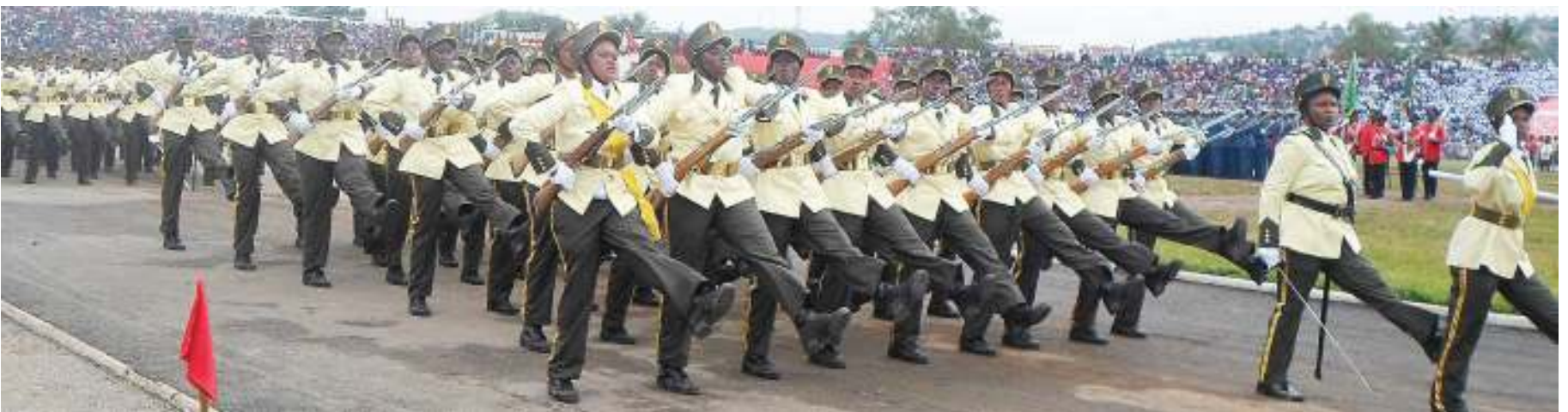
Askari wa Kikosi cha Kutuliza Ghasia (FFU) wakiwa katika gwaride la sherehe za miaka 58 ya Uhuru na miaka 57 ya jana jijini Mwanza.