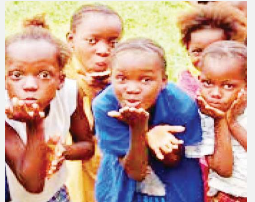
Watoto ambao ni sehemu ya jamii, wanastahili haki ya kutunzwa, kulindwa na kujaliwa katika misingi yote ya kibinadamu.