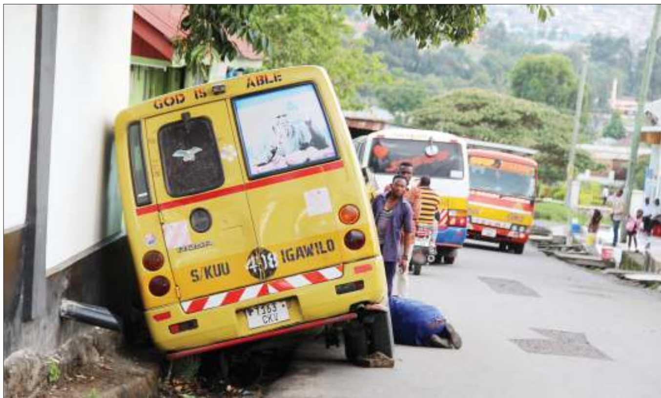
Wafanyakazi wa moja ya daladala zinazofanya safari zake kati ya Stendi Kuu na Igawilo jijini Mbeya, wakihangaika kuikwama gari hiyo baada ya kuteleza na kutumbukia kwenye mtaro katika eneo la Bustani ya Jiji la Mbeya karibu na Uwanja wa Sokoine mwishoni mwa wiki.

Alisema wao wanaendelea kutoa elimu ili wananchi wawe na uelewa wa kutosha kuhusu matukio hayo.