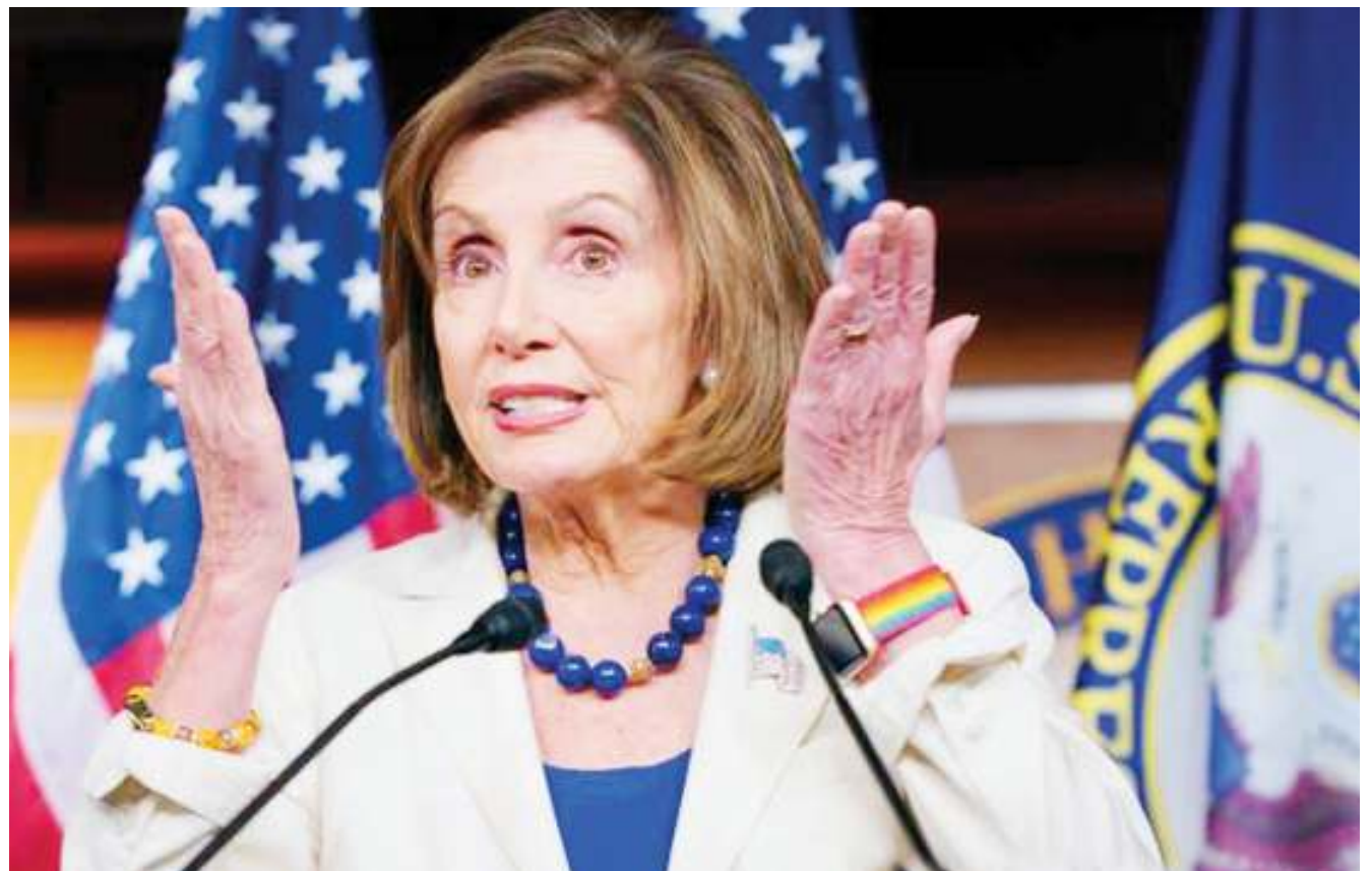
Spika wa Bunge la Marekani, Nancy Pelos.

Mkutano wa pili uliopangwa kukutanisha wajumbe wa nchi mbili mjini Kampala chini ya upatanishi wa Angola uliahirishwa na haijafahamika utafanyika lini ili kusuluhisha mgogoro huu. BBC