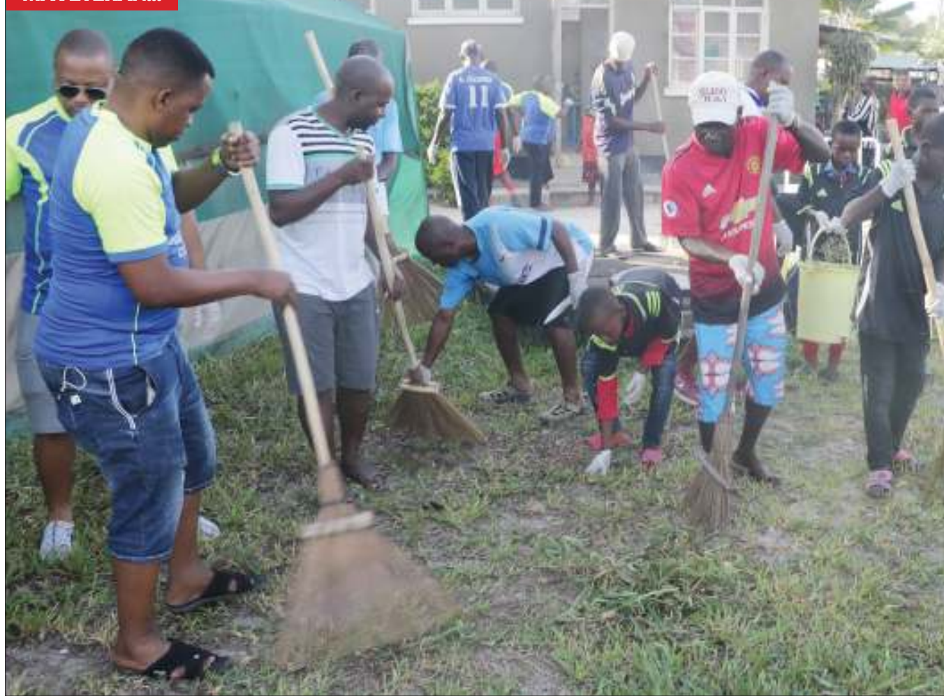
Wanaumojia wa Kitunda Veteran kwa kushirikiana na Kiyombo Veteran, wakifanya usafi katika Zahanati ya Kitunda jijini Dar es Salaam kusherehekea miaka 13 tangu kuanzishwa kwao sambamba na kusherehekea miaka 58 ya Uhuru jana.