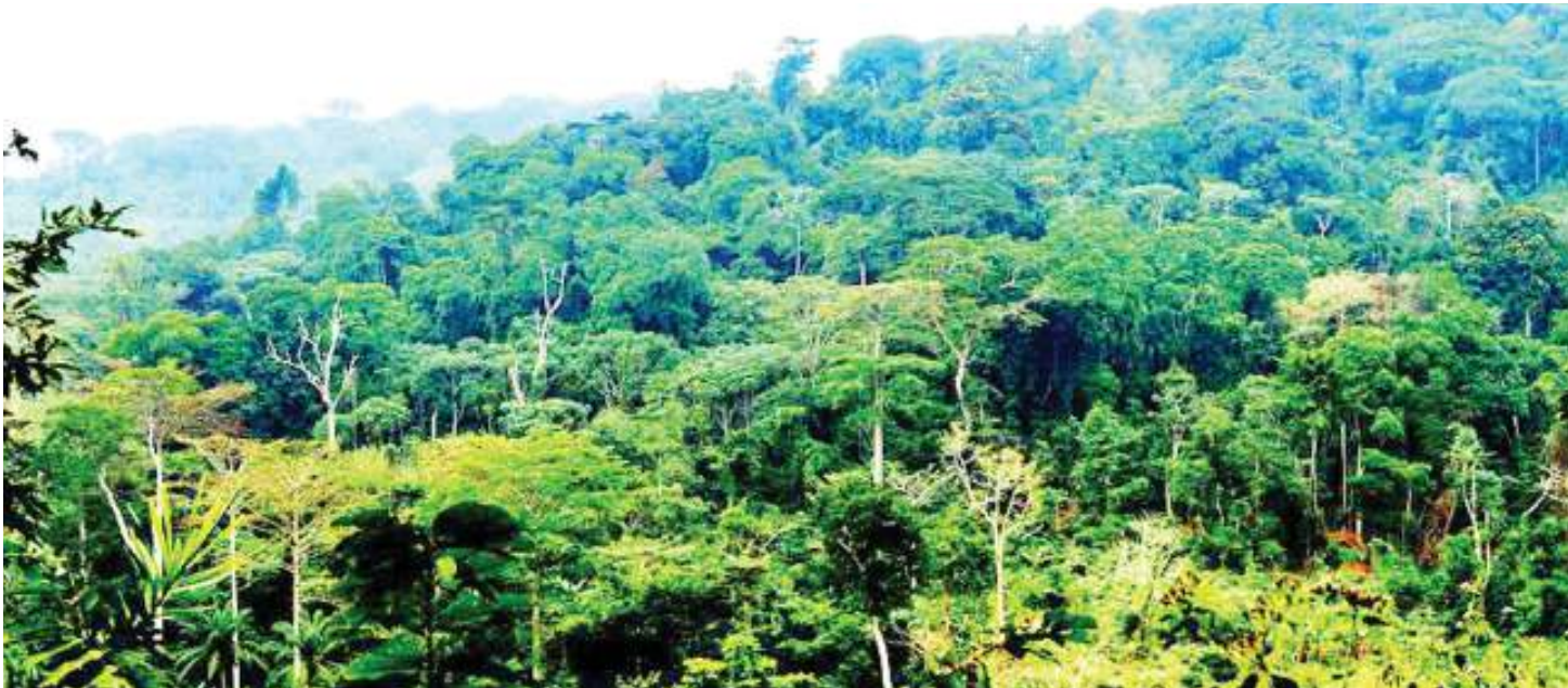
Misitu ni rasilimali muhimu kwa vile ndicho chanzo cha mvua, hewa safi na nishati kuni. Bila ulinzi wa misitu kuna hatari ya taifa kugeuka jangwa.