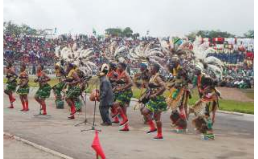
Sungusungu 1,200 kutoka wilayani Kwimba, Mkoa wa Mwanza, wakiwa katika sherehe za miaka 58 ya Uhuru na miaka 57 ya Jamhuri katika uwanja wa CCM Kirumba, Mwanza jana.