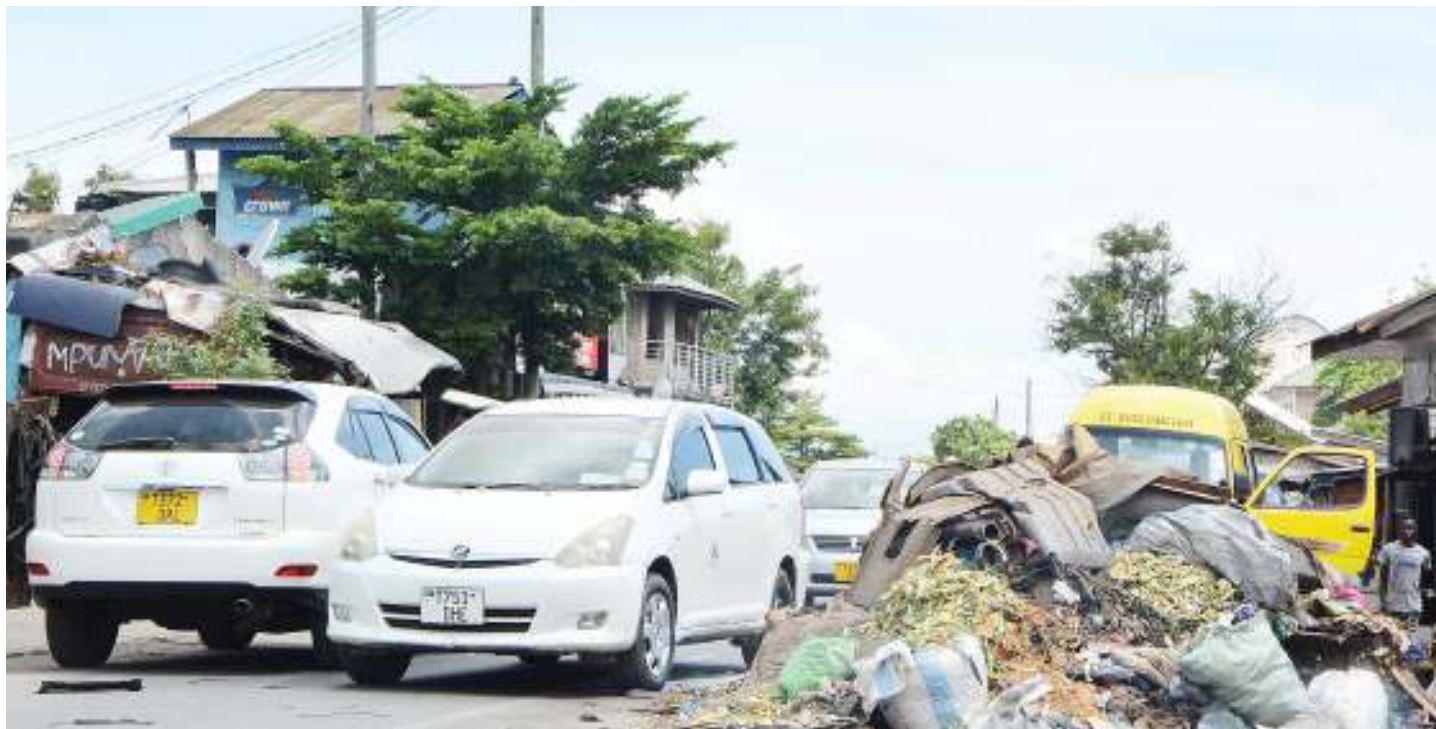
Magari yakipishana kwa shida kutokana na taka zilizotelekezwa barabarani na kuleta usumbufu katika Mtaa wa Matumbi Tabata, jijini Dar es Salaam jana.

"Mwaka 2015/16 kilikuwa ni kipindi kigumu, kilikuwa ni kipindi ambacho baadhi ya watu walipiga picha wakisema bandari imebaki magofu, kwa hiyo tunajivunia mpango tuliouweka wa kuongeza shehena ambayo haipungui tani milioni moja kwa mwaka," alisema.