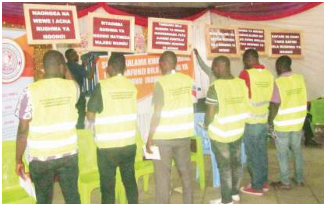
Madereva wa bodaboda na daladala, wakiwa na mabango yenye ujumbe wa kupiga vita rushwa ya ngono.

“Lengo lilikuwa ni kutaka kujua matatizo yanayowakabili wanafunzi wa kike kuanzia nyumbani, mitaani na hata shuleni, ndipo wengi wao wakaeleza kuombwa rushwa ya ngono madereva wa bodaboda na