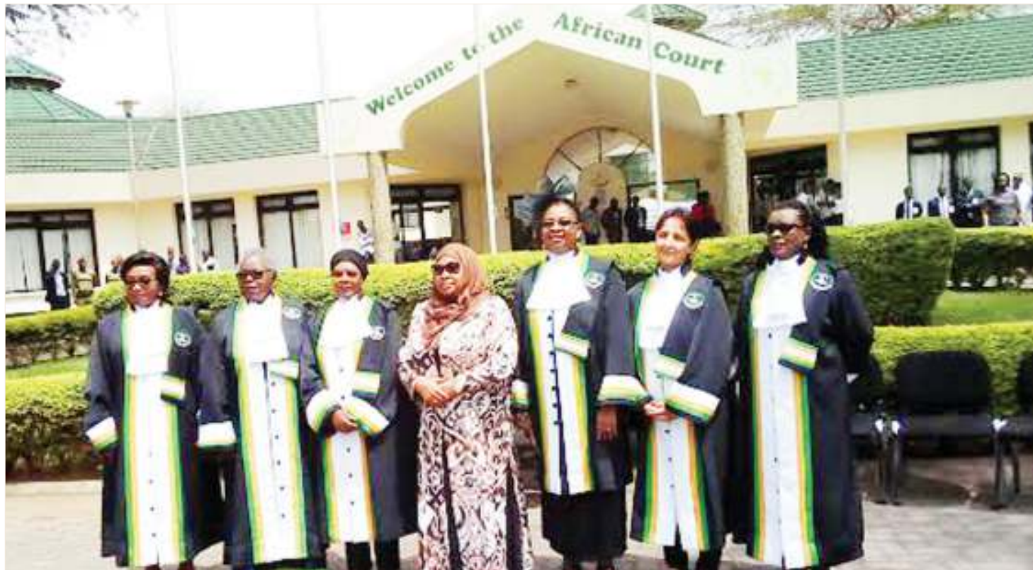
Majaji wa Mahakama ya Afrika wakiwa kwenye makao makuu ya taasisi hiyo yaliyoko Arusha.

Hatua nyingine ya kuanzia ni lazima iendana na ile ya kwanza pale mlalamikaji anapokubaliwa na mahakama kuwa sheria za nchi husika, kwa ujumla wake au katika kipengele maalum kinachogusa haki