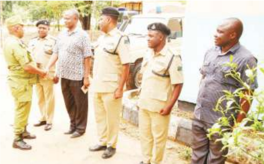
Kamishna wa Operesheni na Mafunzo ya Jeshi la Polisi, Sabas, akipokelewa na maofisa na wakaguzi baada ya kuwasili katika kituo cha Polisi Newala mkoani Mtwara, katika ziara yake ya siku moja iliyokuwa na lengo la kuzungumza na askari wa kituo hicho.

na Tandahimba na baada ya hapo alizungumza na wananchi wa maeneo hayo ili kujua hali ya usalama kwa sasa.