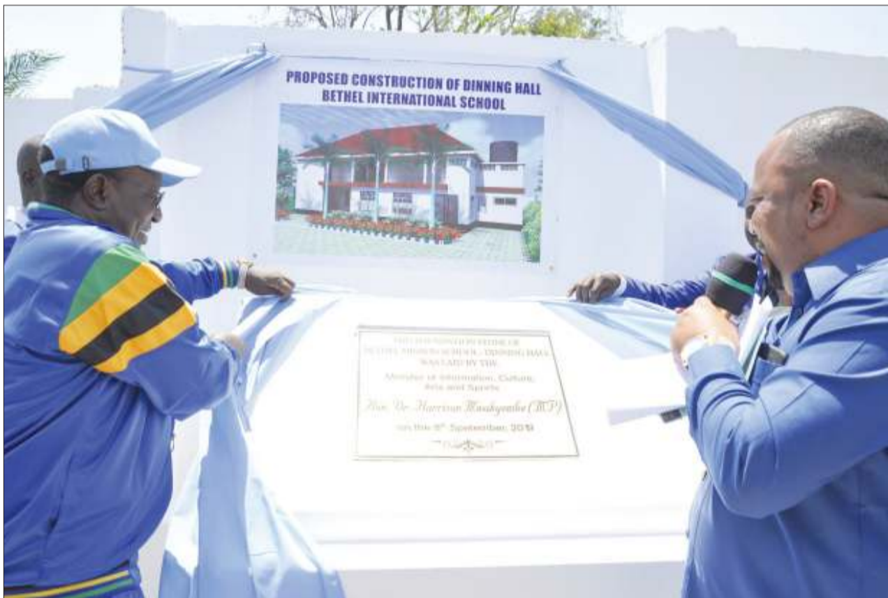
Waziri wa Habari, Utamaduni, Sanaa na Michezo, Dk. Harrison Mwakyembe (kushoto), akifunua kitambaa kuashiria uwekaji wa jiwe la msingi katika ujenzi wa ukumbi wa chakula, maabara na chumba cha kompyuta wakati wa mahafali ya 15 ya darasa la saba na wanafunzi wa awali katika Shule ya awali na Msingi ya Bethel Mission Mabibo Makuburi jijini Dar es Salaam juzi.