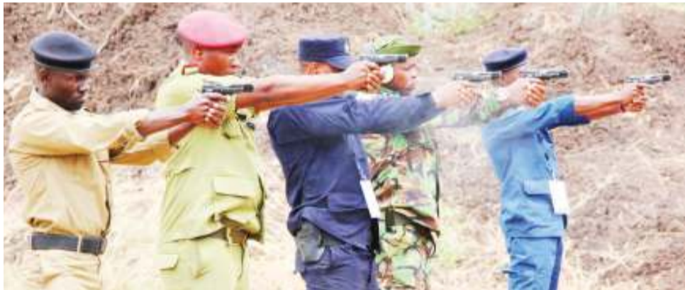
Askari kutoka nchi za Tanzania, Uganda, Rwanda, Kenya na Burundi wakiwa katika ulengaji wa shabaha kwa timu za askari wa kike kwenye mashindano ya michezo ya Wakuu wa Majeshi ya Polisi ya Nchi za Kanda ya Afrika Mashariki (EAPCCO GAMES 2019).

M ICHEZO ni miongoni mwa mikakati ambayo hutumika na vyombo vya ulinzi na usalama katika kujenga umoja, kuimarisha uhusiano na ushirikiano pamoja na kubadilishana taarifa za kiinteligensia ambazo husaidia katika mapambano dhidi ya uhalifu na wahalifu hususani makosa yanayovuka mipaka na yale yanayofanyika kwa njia ya mtandao.