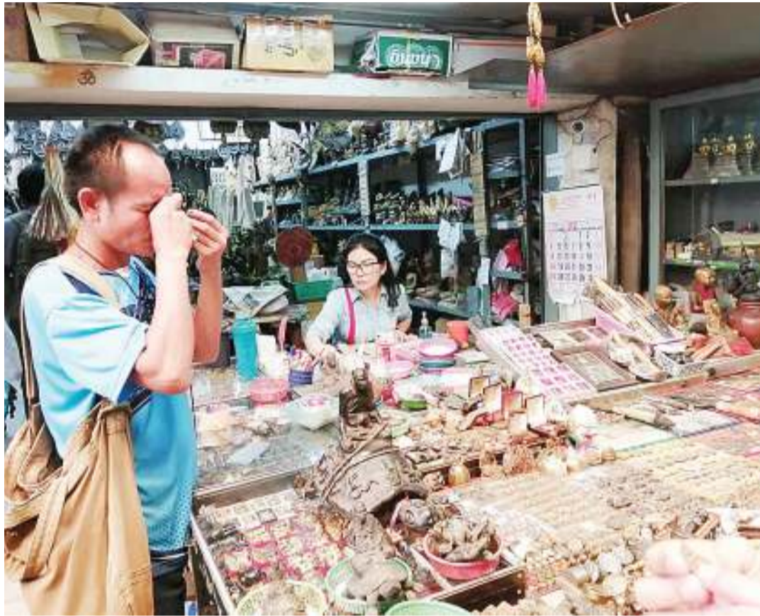
Mnunuzi wa bidhaa za wanyamapori akipima uhalisia wa bidhaa hizo kama alivyokutwa na mpiga picha wetu katika soko la Amulet, lililopo Jiji la Bangkok, Thailand. Soko hilo ni maarufu kwa bidhaa haramu na halali za wanyamapori na hutembelewa na maelfu ya watalii kutoka Asia.