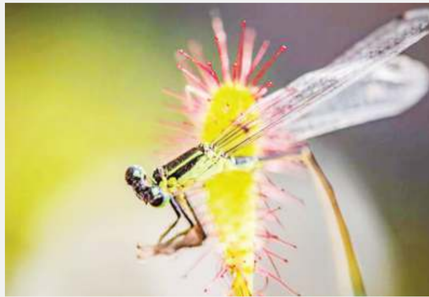
Wadudu huvutiwa na majani ya mmea huo.

Anasema ni muhimu kuhifadhi mimea ya kula nyama kwa faida yao kwa mazingira na viumbe hai, na kwa faida ya baadaye, kama vile chanzo kinachoweza kutengeneza dawa mpya. BBC