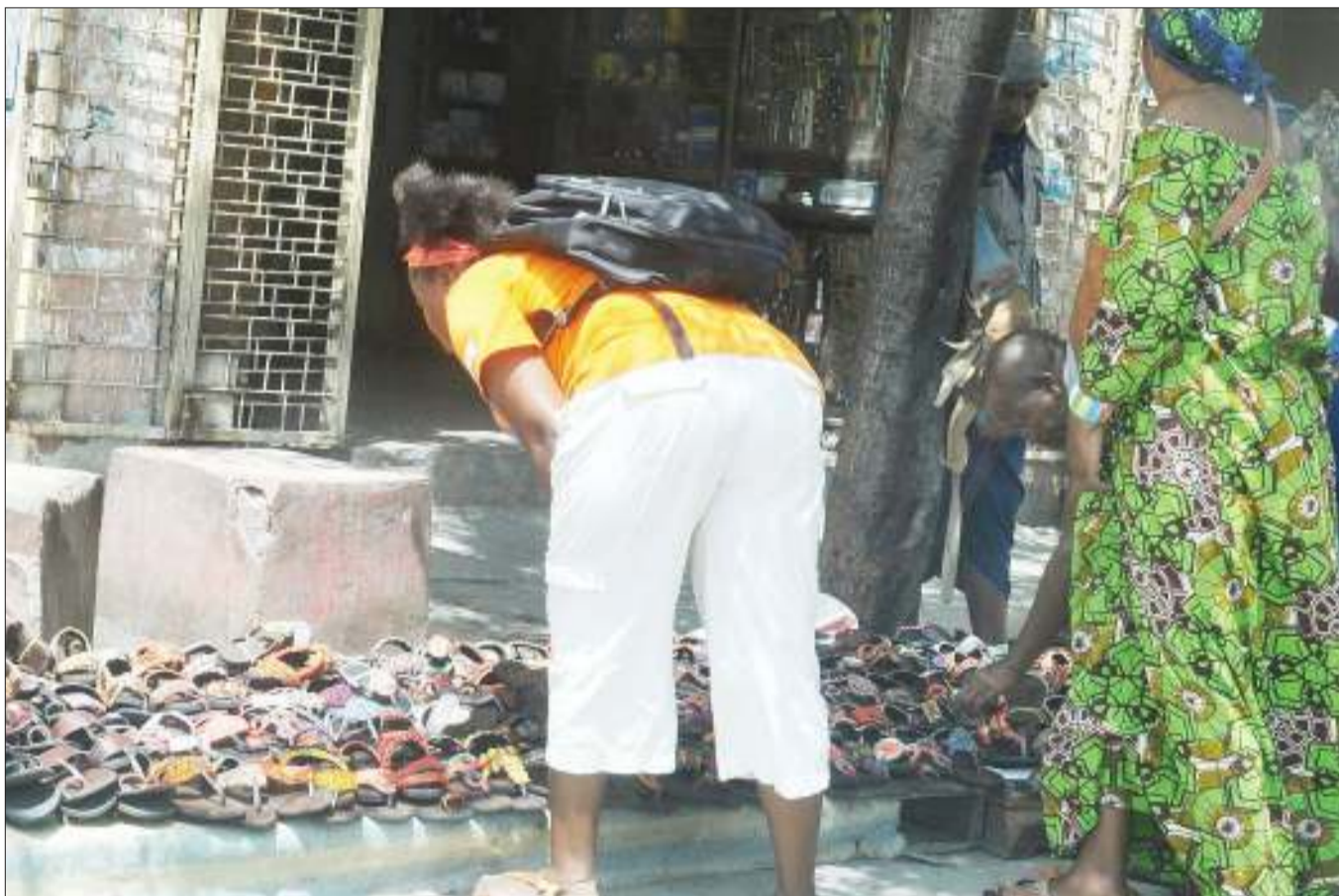
Wananchi wakichagua sendozi zilizokuwa zikiuzwa kando ya Barabara ya Uhuru, eneo la Mnazi Mmoja, jijini Dar es Salaam jana.

Magoma alisema mbali na msaada huo wa BMZ, halmashauri nayo imekuwa ikitoa mikopo kwa vikundi vya watu wenye ulemavu ili waendeshe miradi yao kwa ajili ya kujikimu kimaisha.