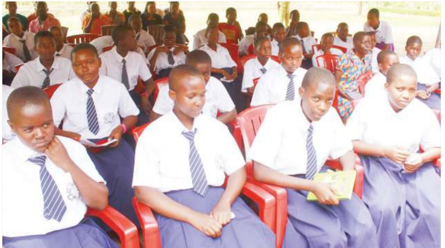
Ustawi wa vijana kama hawa unategemea sana mawazo yao ambayo nayo huibua hisia kisha hatua kuchukuliwa.

Unavyojenga hisia chanya unakaribisha au kutuma mawimbi kuwa