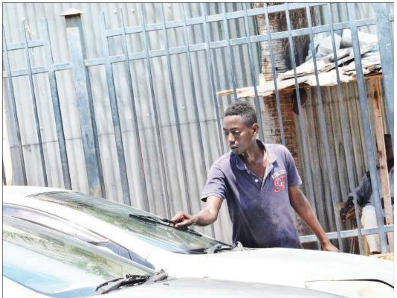
Kijana wa mtaani akiosha kioo cha gari katika Barabara ya Bibi Titi Mohamed, jijini Dar es Salaam jana, bila ya kuruhusiwa kitendo ambacho husababisha usumbufu kwa madereva.

Mfumo huo ulisitishwa rasmi Septemba 3, mwaka huu.