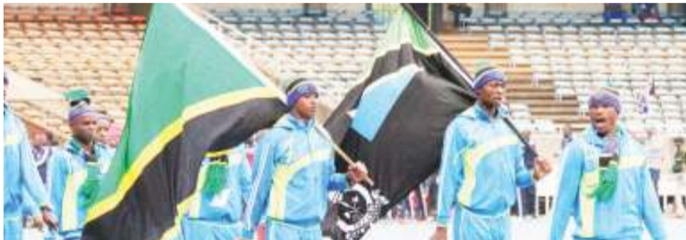
Wanamichezo kutoka Jeshi la Polisi Tanzania wakipita kutoa heshima kwa mgeni rasmi wakati wa ufunguzi wa michezo ya Wakuu wa Majeshi ya Polisi ya Nchi za Kanda ya Afrika Mashariki (EAPCCO GAMES 2019) yaliyomalizika jijini Nairobi nchini Kenya, Agosti 31.