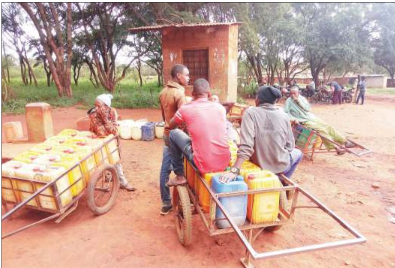
Baadhi ya wakazi wa eneo la Haydom, wilayani Mbulu Mkoa wa Manyara, wakisubiri kuchota maji, ambayo upatikanaji wake ni shida katika eneo hilo juzi.

Alisema kuna baadhi ya vijiji kama Oduonyowas, Losikito na Lengijave ambavyo mvua hazikuwa nyingi lakini chakula cha kutosha cha kutumia sasa na vya akiba kwa ajili ya kipindi kijacho.