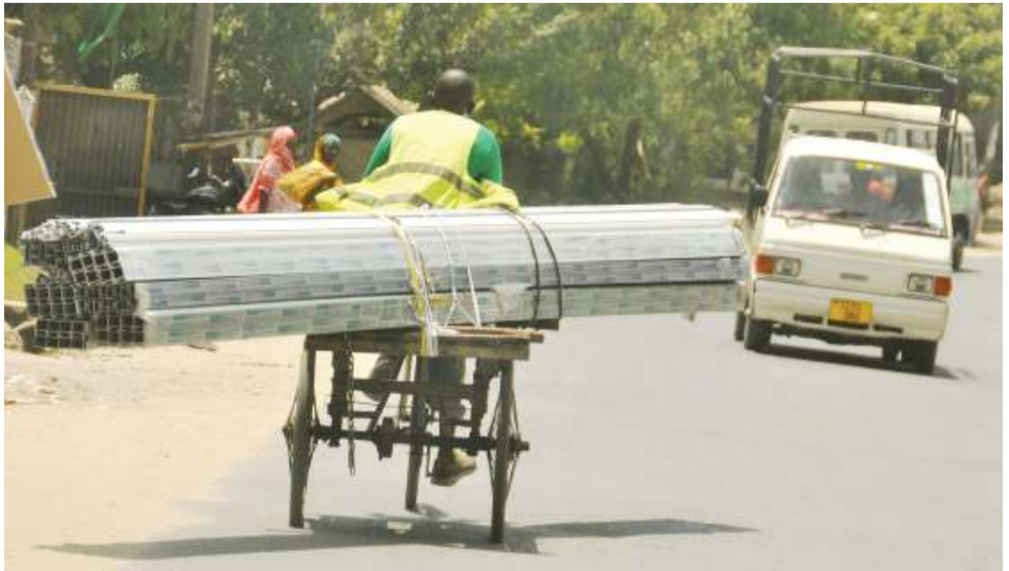
Mwendesha guta akiwa amesheheni mzigo mkubwa uliokuwa ukisababisha usumbufu kwa watumiaji wengine wa barabara katika eneo la Mburahati, jijini Dar es Salaam jana.