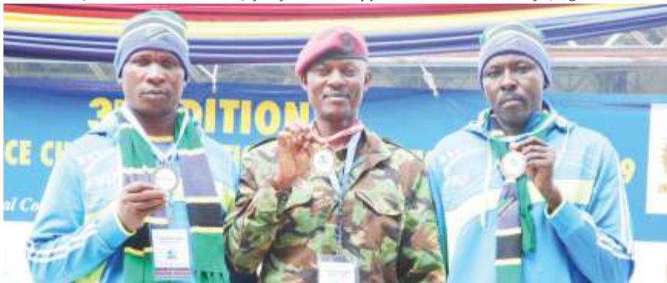
Askari wa Jeshi la Polisi Tanzania na Jeshi la Polisi Kenya (katikati), wakiwa na medali zao walizotunukiwa baada ya mashindano ya ulengaji wa shabaha kwa silaha ya SMG AK 47 wakati wa mashindano hayo