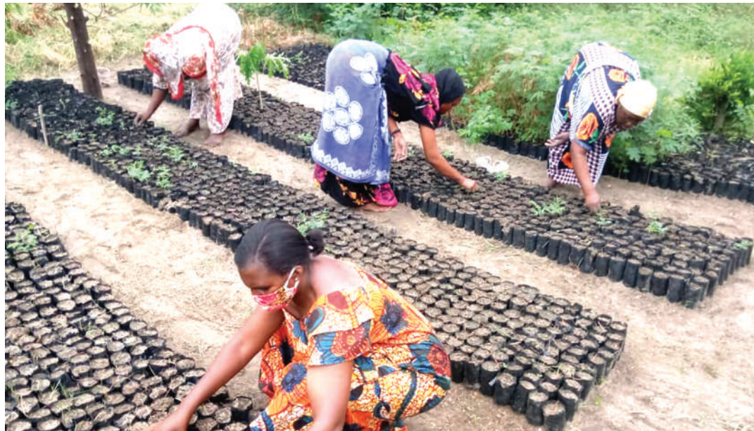
Kupanda miti kulenge matokeo chanya kwa wakulima, wanyama na makazi salama yenye miti na mvua.

Kulingana na takwimu za mwaka 2015 za Wizara ya Maliasili na Utalii, kwa mwaka, Tanzania Bara ilikuwa inapoteza hekta takribani