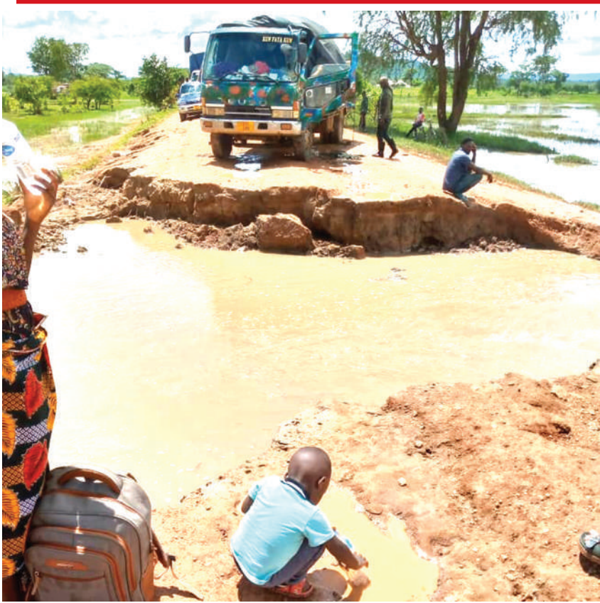
Mawasiliano ya eneo la Kona ya Mnyagara, Wilaya ya Tanganyika mkoani Rukwa yakiwa yamekatika na mvua na kusababisha usumbufu kwa watumiaji wa barabara hiyo mwishoni mwa wiki.