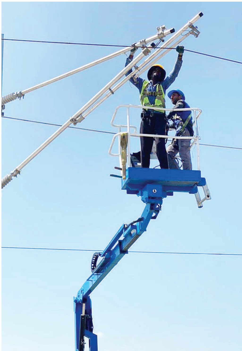
Baadhi ya mafundi wa kampuni ya ujenzi wa mradi wa reli ya kisasa (SGR) Yepi Merkezi kutoka Uturuki wakiendelea na ujenzi wa mifumo ya umeme katika kipande cha Isaka-Tabora chenye urefu wa kilometa 165 jana.

Mfaume alisema Ramadhani alimshika ugoni mke wake akifanya mapenzi na mdogo wake, kwamba baada ya kumfumana walishindwa kuelewana na kuzuka ugomvi uliosababisha Ramadhani kufikishwa polisi.