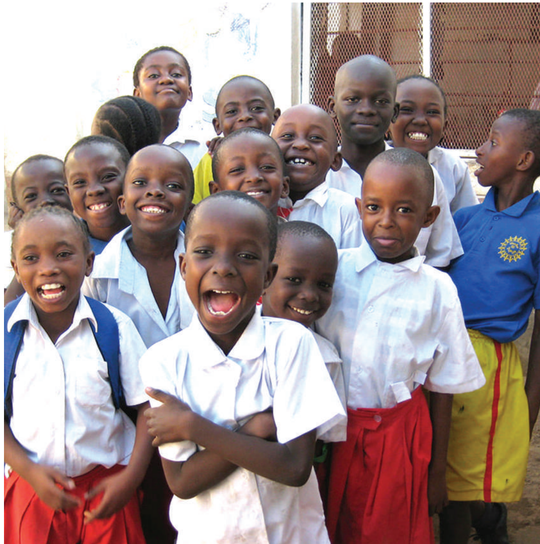
Shule zimefunguliwa Januari 9, wanafunzi wahamasishwe kwenda shuleni na kujifunza badala ya utoro.

Anasema kwa mazingira kama hayo, wanafunzi wengine wanaona ni bora wakae nyumbani waendelea na shughuli nyingine, badala ya