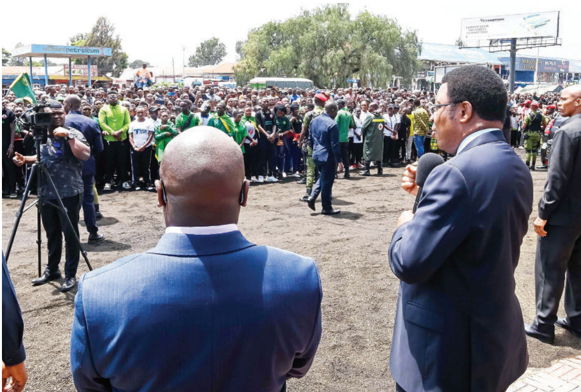
Waziri Mkuu, Kassim Majaliwa, akizungumza na wananchi wa Mbeya Mjini baada ya kuwasili mkoani humo kwa ziara ya kikazi katika mikoa ya Mbeya na Songwe jana.