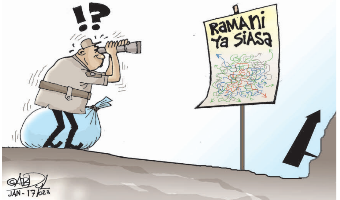
JAN - 17/2023

Tupinge ukatili huu kwa nguvu zote vinginevyo jamii yote italia kilio cha kusaga meno.