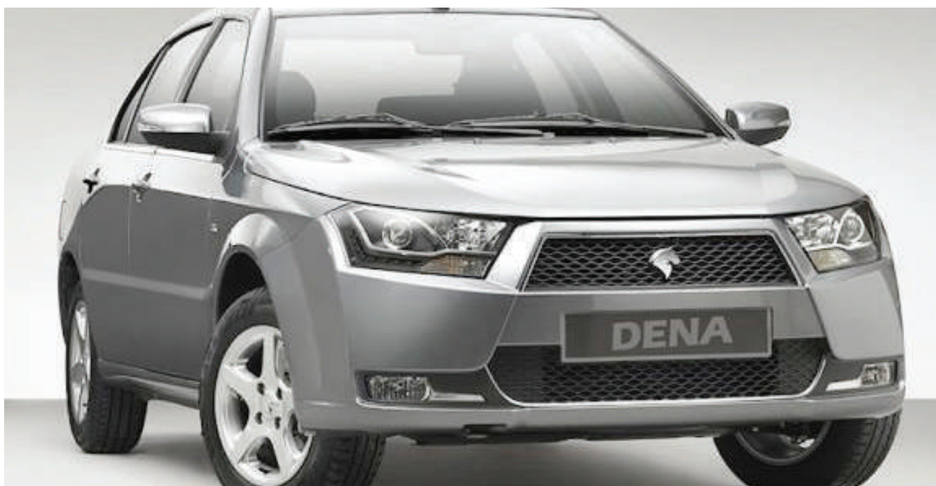
Gari aina ya Dena, inayozalishwa kwa teknolojia ya ndani, nchini Iran.

Iran ni nchi inayosifika duniani kwa kuzaa mafuta na gesi, pia ikitumia vyema utalii wake kuboresha uchumi wake, ingawa sekta hiyo im-