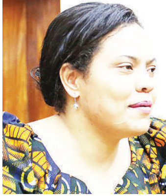
Waziri wa Maliasili na Utalii, Angellah Kairuki