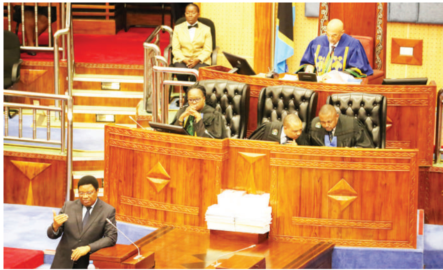
Waziri Mkuu, Kassim Majaliwa aki-jibu maswali yaliyoulizwa na baadhi ya wabunge kwenye kipindi cha maswali ya hapo kwa papo, Bungeni Dodoma jana.