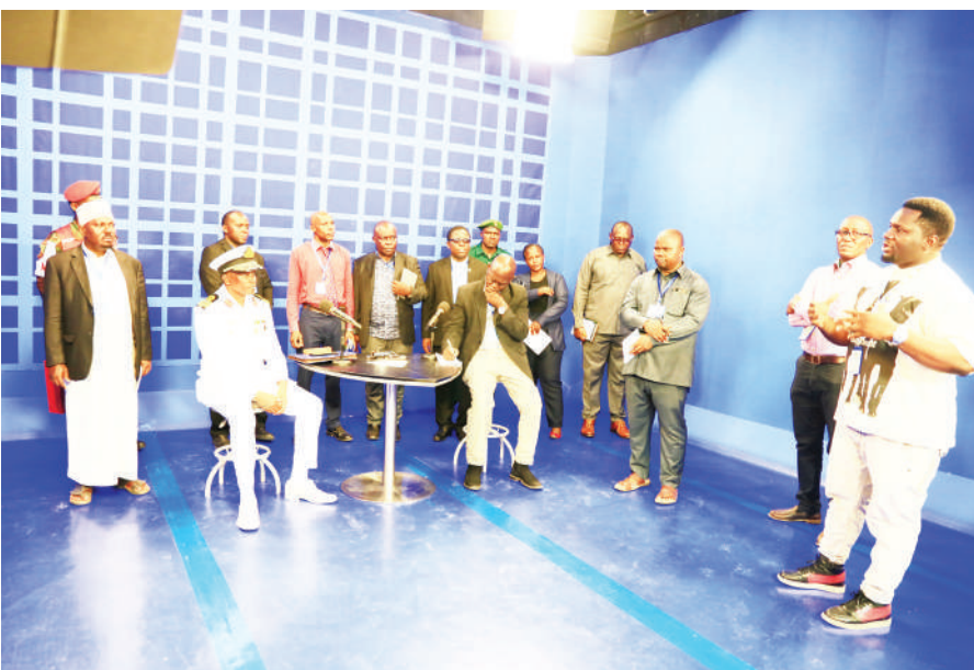
Baadhhi ya washiriki wa kazi fupi ya Uongozi na Usalama wa Taifa wakiwa katika moja ya studio za ITV.