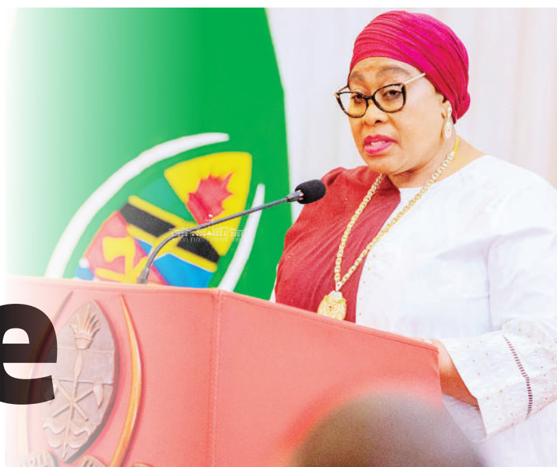
Rais Samia Suluhu Hassan akizungumza na mabalozzi wanaoziwakilisha nchi zao nchini na wawakilishi wa mashirika ya kimataifa, katika sherehe za mwaka mpya kwa mabalozzi hao, Ikulu jijini Dar es Salaam juzi usiku.

ASISITIZA utakuwa huru na wa haki... Endelea Ukurasa 2