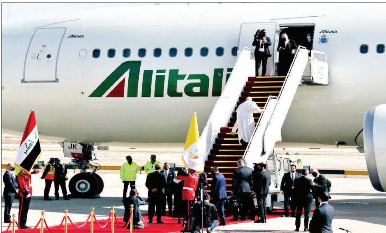
Papa Francis akipanda ndege baada ya kumaliza ziara yake ya siku nne nchini Iraq, katika Uwanja wa Ndege wa Baghdad, jana.