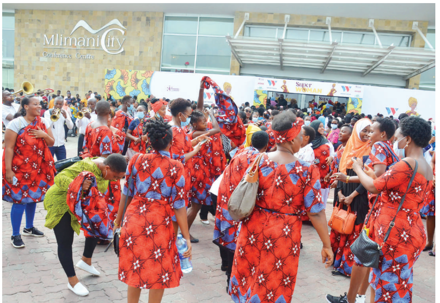
Wanawake wakicheza katika viwanja vya Mlimani City jijini Dar es Salaam jana, wakati wa kusherehekea Siku ya Wanawake Duniani.