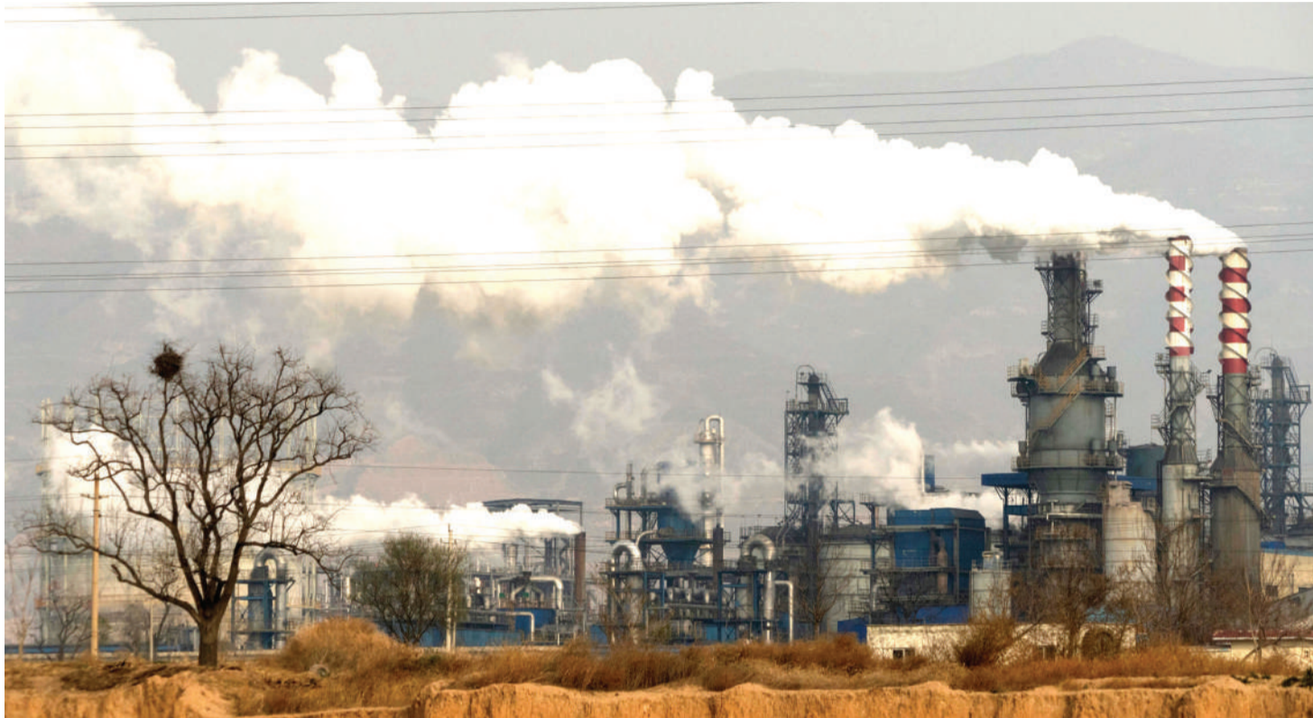
Viwanda vya chuma vinavyotumia makaa ya mawe ni chanzo cha magonjwa ya njia za hewa na joto duniani linalochochea mabadiliko ya tabianchi.

Kuongeza hali ya joto duniani sasa kunaielekea kufikia nyuzi 1.5.