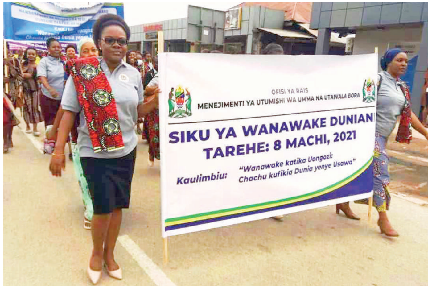
Baadhi ya watumishi wa umma wanawake wa Ofisi ya Rais, Menejimenti ya Utumishi wa Umma na Utawala Bora wakiwa katika maandamano ya Siku ya Wanawake kimkoa Machi 8, 2021 jijini Dodoma.

Alitoa wito kwa viongozi wa kluba za wapinga rushwa za vyuo vya elimu ya juu mkoani humo kuendelea kutoa elimu ya kupinga vitendo vya rushwa kwa kushirikiana na taasisi hiyo.