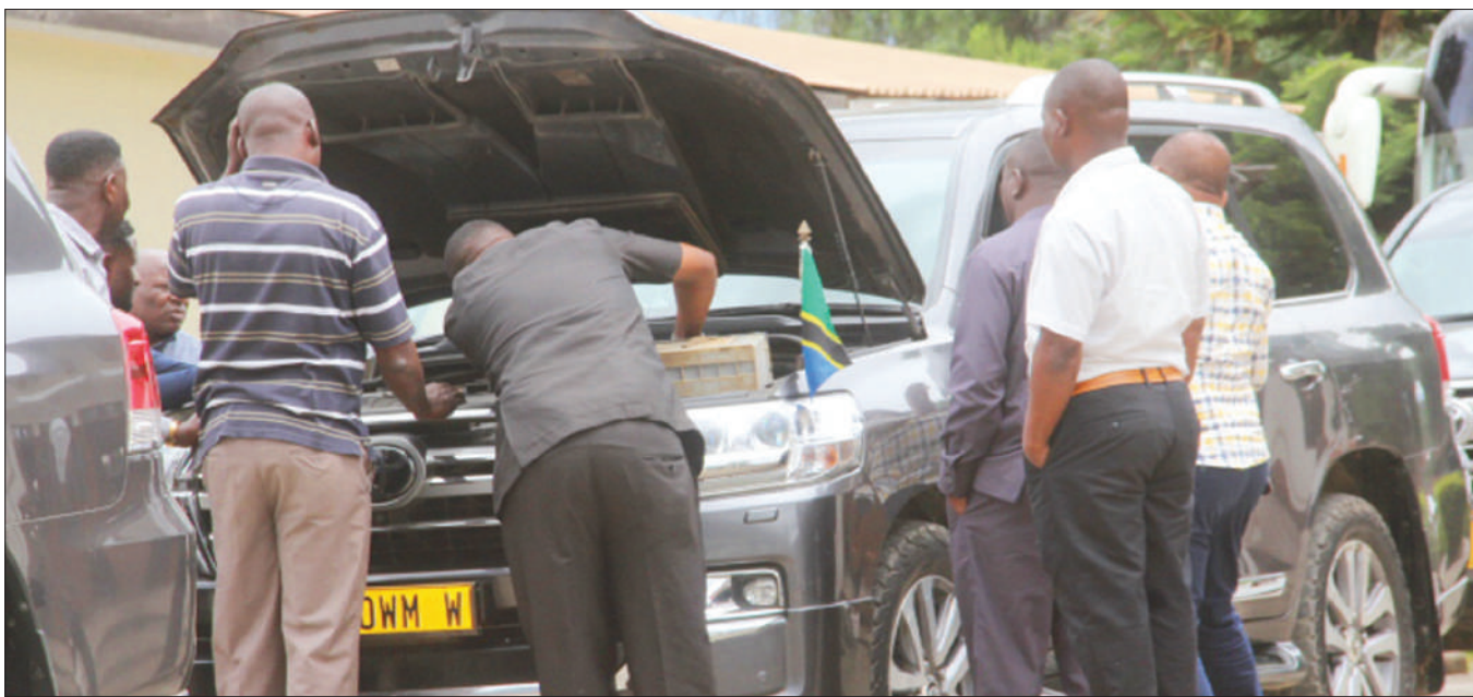
Madereva wa magari ya serikali wakilifanyia marekebisha gari la Naibu Waziri wa Nchi, Ofisi ya Waziri Mkuu anayehughulikiana watu wenye ulemavu, Umyi Nderiananga, wakati wa ziara ya Kamati ya Bunge ya Ukimwi, Kifua Kikuu na Dawa za Kulevya, mkoani Mbeya.